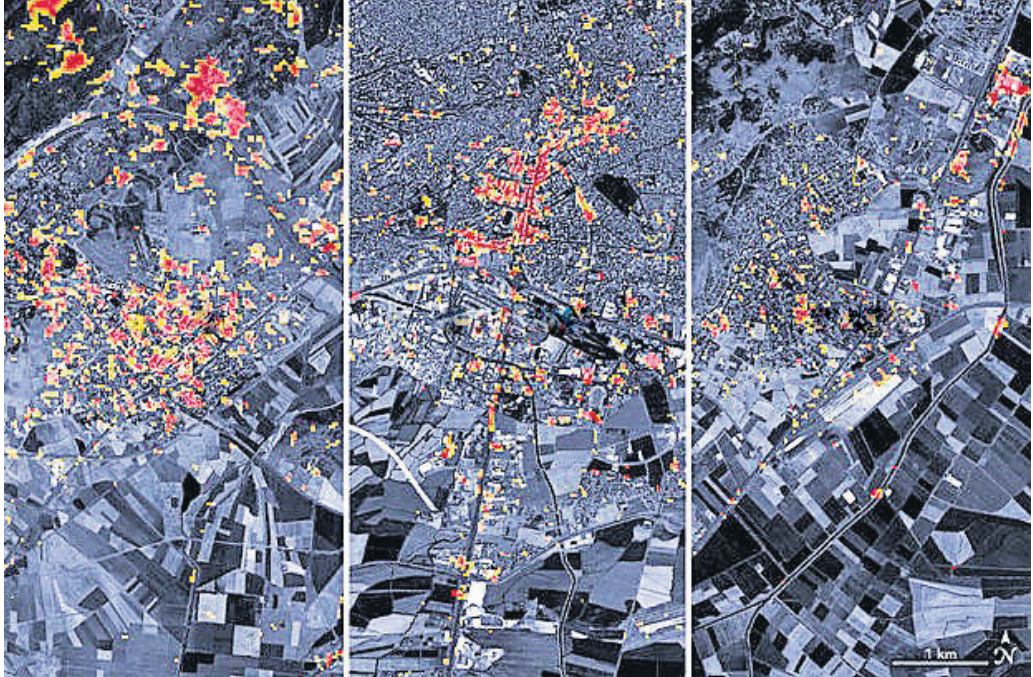
ତୁର୍କୀର ଭୂକମ୍ପ ବିଧୁସ୍ତ୍ର ୩ ସହର ନୁରଦାଗି, କହରାମନମାନ୍‌ରସ ଓ ଚୁରକୋଲୁରୁ ସାଟେଲାଇଟ୍ ଚିତ୍ର ନାସା ପକ୍ଷରୁ ଜାରି କରାଯାଇଛି।

ଭୟାବହ ଭୂକମ୍ପରୁ ଶନିବାର ବିତପାଢ଼ି ଛଅ ଦିନ ରେଷ୍ଟି ଟିମ୍ ତରଫରୁ ଉଦ୍ଧାର କାର୍ଯ୍ୟ ଚାଲିଥିବାବେଳେ ଉଗ୍ରାବଶେଷ ତଲୁ ଲୋକଙ୍କୁ ଉଦ୍ଧାର କାର୍ଯ୍ୟ ଚାଲିଛି। ଏଭଳି ସ୍ଥିତିରେ ଆମେରିକୀୟ ମହାକାଶ ଗବେଷଣା ସଂସ୍ଥା (ନାସା) ଶନିବାର ଭୂକମ୍ପରେ ତୁର୍କୀ ଓ ସିରିଆ ଅଞ୍ଚଳରେ ସାଟେଲାଇଟ୍ ଇମେଜ୍ ଜାରି କରିଛି। ଏହି ଛବି ନାସାର ଜେଡ୍ ପ୍ରୋପାକ୍ସରୁ ଲାଭରେଗୋରି ପକ୍ଷରୁ ଉଦ୍ଧାରକାରୀମାନେ ଶନିବାର ୯ ଜଣଙ୍କୁ ସୁରକ୍ଷିତ ଉଦ୍ଧାର କରିଛନ୍ତି। ତୁର୍କୀ, ସିରିଆରେ ହୋଇଥିବା