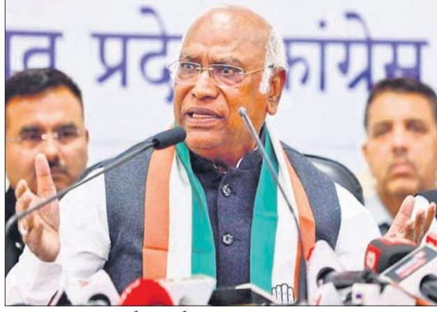
କଂଗ୍ରେସ ଅଧକ୍ଷ ମଲ୍ଲିକାର୍ଜୁନ ଖାର୍ଦ୍ଦୋ

କଂଗ୍ରେସ ଅଧକ୍ଷ ମଲ୍ଲିକାର୍ଜୁନ ଖାର୍ଦ୍ଦୋ କହିଥିଲେ। ଦେଶରେ ବାଙ୍କି ସ୍ୱାଧୀନତା ନାହିଁ ବୋଲି ଖାର୍ଦ୍ଦୋ କହିଥିଲେ। ୨୦୧୪ରେ କଂଗ୍ରେସ ଅଧକ୍ଷ ମଲ୍ଲିକାର୍ଜୁନ ଖାର୍ଦ୍ଦୋ କହିଥିଲେ। ୨୦୧୪ରେ କଂଗ୍ରେସ ଅଧକ୍ଷ ମଲ୍ଲିକାର୍ଜୁନ ଖାର୍ଦ୍ଦୋ କହିଥିଲେ।