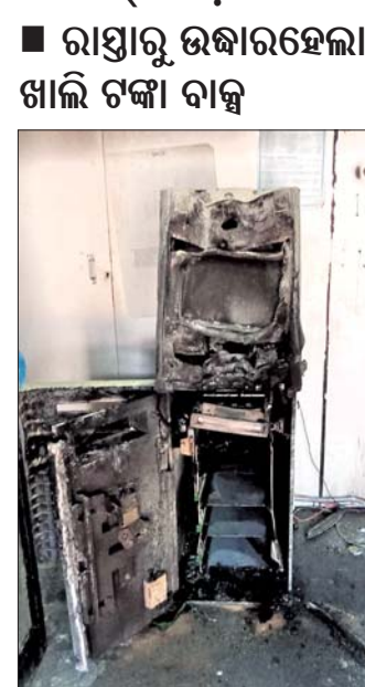
ଟଙ୍କା ଲୁଟ୍ ପରେ ଦୁର୍ଭିକ୍ଷମାନେ ପୋଡ଼ିଦେଇଥିବା ଏଟିଏମ୍।