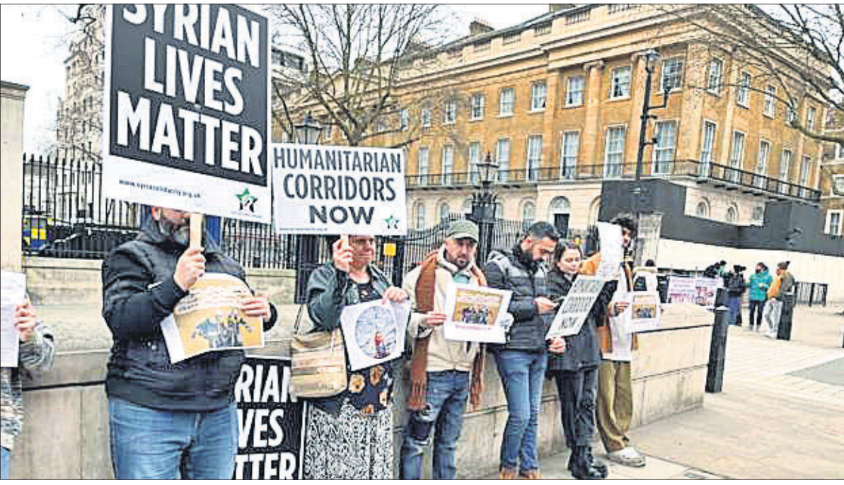
ଭୂକମ୍ପ ପ୍ରଭାବିତ ସିରିଆ। ଭୂକମ୍ପରେ ବୁର୍ଜ୍‌ହା ଅଧିକ ସହାୟତା ମିଳୁଥିବାରୁ ବ୍ରିଟେନ୍‌ର ଡାକ୍ତରୀ ଶ୍ରେଣୀରେ ଶିବିରର ସିରିଆ ସମର୍ଥକମାନେ ବିରୋଧ ପ୍ରଦର୍ଶନ କରୁଛନ୍ତି।