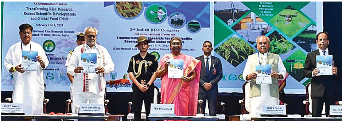
କଟକ ଜିଲ୍ଲା ବିଦ୍ୟାଳୟରୁ ଉଦ୍ଘାଟନା କରାଯାଇଥିବା କର୍ମକ୍ରମରେ ରାଷ୍ଟ୍ରପତି କ୍ରିପାପା ମୁର୍ମୁ ଓ ଅନ୍ୟ ଅତିଥିମାନେ ସ୍ମରଣାଂଶୁ ଉଦ୍ଘାଟନା କରୁଛନ୍ତି ।