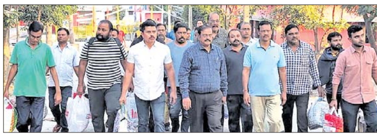
ସମ୍ବଲପୁର କେଲରୁ ବାହାରିଥିବା ଓକିଲମାନେ ।

ପଶ୍ଚିମ ଓଡ଼ିଶାରେ ହାଇକୋର୍ଟ ବେଞ୍ଚ ପ୍ରତିଷ୍ଠା ଦାବିରେ ଆନ୍ଦୋଳନକ୍ରମିତ ଭଙ୍ଗାଟୁଣା ମାମଲାରେ ରିଟ୍ ହୋଇଥିବା ୭୯ ଜଣ ଆଇନଜୀବୀଙ୍କୁ ହାଇକୋର୍ଟ କ୍ରମ୍ଭାବର ସରମୂଳକ କାମିନ ପ୍ରଦାନ କରାଯାଇଛି। ଶନିବାର ସମ୍ବଲପୁର କୋର୍ଟରେ କାର୍ଯ୍ୟକ୍ରମ ପ୍ରକ୍ରିୟା ଶେଷ ହେବା ପରେ ଅପରାହ୍ଣ ପ୍ରାୟ ସାଢ଼େ ୪ଟା ସମୟରେ ଓକିଲମାନେ କେଲରୁ ବାହାରିଥିଲେ। କେଲ ବାହାରେ ଅପେକ୍ଷା କରିଥିବା ପରିବାର ପରିଜନଙ୍କ ସହ ସେମାନେ ଘରକୁ ଯାଇଥିଲେ। ହାଇକୋର୍ଟରେ ସର୍ତ୍ତ ରହିଥିବାକୁ ଗଣମାଧ୍ୟମ