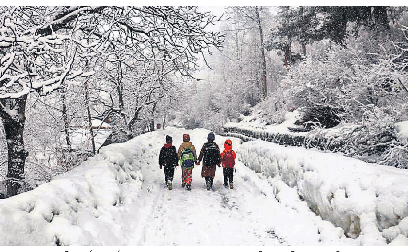
କ୍ୟୁ-କ୍ୟୁରର ବାରମୁଣ୍ଡା ଜିଲା ଅନ୍ତର୍ଗତ ତଙ୍ଗମାରୀ ଅଞ୍ଚଳରେ ପ୍ରବଳ ତୁଷାରପାତ ଯୋଗୁ ବରଫାବୃତ୍ତ ରାସ୍ତାରେ ପିଲାମାନେ ଶନିବାର ସ୍କୁଲ ଯାଉଛନ୍ତି।