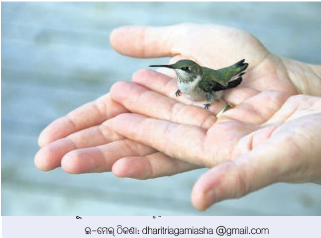
ଇ-ମେଲ୍ ଠିକଣା: dharitriagamisha@gmail.com