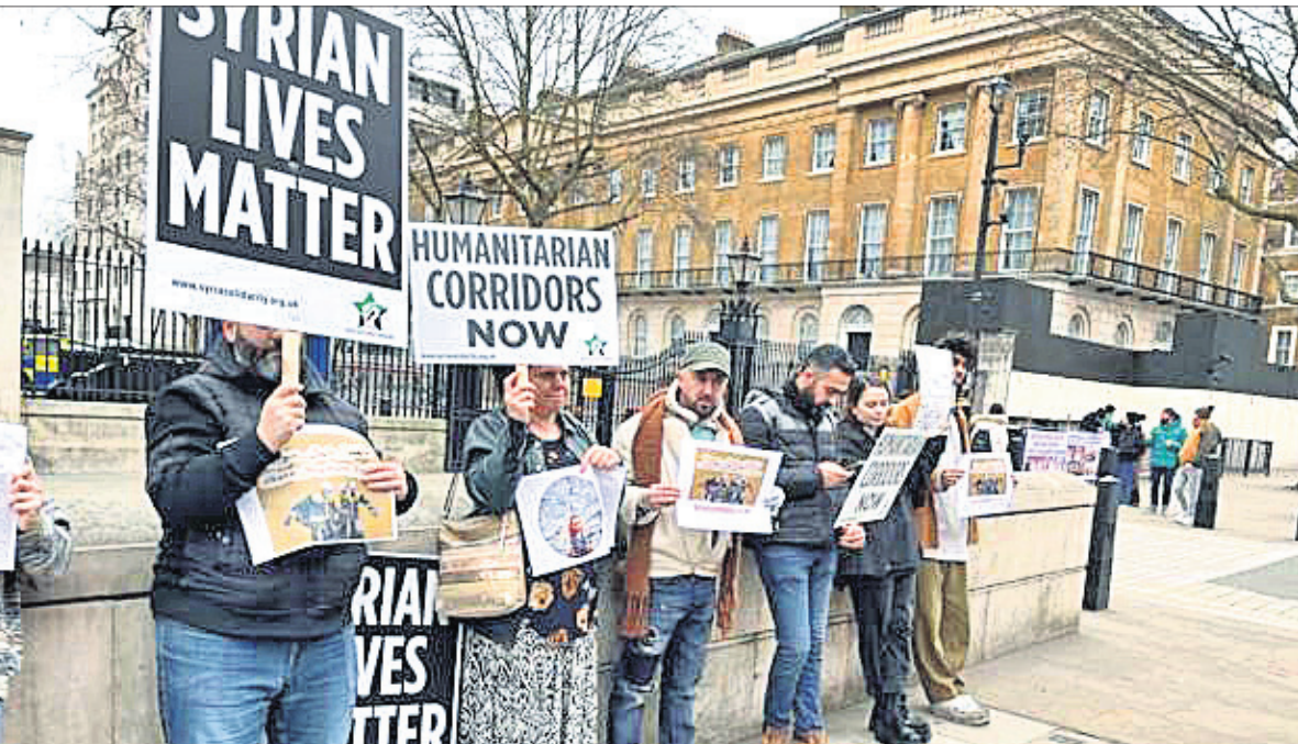
ଭୂକମ୍ପ ପ୍ରଭାବିତ ସିରିଆ। ଦୁନିଆରେ ଦୁର୍ଗାକୁ ଅଧିକ ସହାୟତା ମିଳୁଥିବାରୁ ବିପତ୍ତିର ଉପରେ ଶନିବାର ସିରିଆ ସମର୍ଥକମାନେ ବିଶୋଭା ପ୍ରଦର୍ଶନ କରୁଛନ୍ତି।

ପ୍ରଶଂସକଙ୍କ ବାପାଙ୍କ ଜୀବନ ବଞ୍ଚାଇଲେ ସାରଥୀ ପୁସ୍ତକାଳୟ ଆଲୁ ଅର୍ଜୁନ ନିକେର ଚାଙ୍କର ଜଣେ ପ୍ରଶଂସକଙ୍କ ବାପାଙ୍କ ସ୍ୱାସ୍ଥ୍ୟାବସ୍ଥା ଖରାପ ଜାଣି ସହାୟତା କରିଛି।