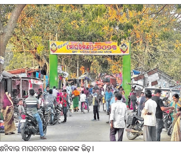
ଶନିବାର ମାଘମେଳାରେ ଲୋକଙ୍କ ଭିଡ଼ ।

ଖୋଲି ଗ୍ରାହକମାନଙ୍କୁ ଅପେକ୍ଷା କରିଥିଲେ । ସେପରି ବେପାର ହୋଇ ନ ଥିଲା । ଏବେ ଗୋଟିଏ ସ୍ଥାନରେ ବିକିନି ସାମଗ୍ରୀ ମିଳୁଥିବାରୁ ଗ୍ରାହକଙ୍କ ଭିଡ଼ ପରିଲକ୍ଷିତ ହେଉଛି । ହେଲେ ବହୁ ଯାତ୍ରୀଙ୍କ ସମାଗମ ସତ୍ତ୍ୱେ ମାଘ ମେଳାରେ ଶୌଚାଳୟ ବ୍ୟବସ୍ଥା ନ ଥିବାରୁ ଯାତ୍ରୀମାନେ ନାହିଁ ନ ଥିବା ସମସ୍ୟାର ସମ୍ମୁଖୀନ ହେଉଛନ୍ତି । ଶନିବାର ପ୍ରଥମ ରାତ୍ରିରେ ଧଉଳି ଗଣନାସ୍ୟା ଯାତ୍ରା ପରିବେଷଣ କରିବ । ଅଗ୍ରମ ଚିତ୍କଟ ପାଇଁ କାଉଣ୍ଡରରେ ଭିଡ଼ ପରିଲକ୍ଷିତ ହୋଇଛି ।