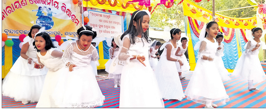
ଶିକ୍ଷାଗ୍ରମର ପିଲାମାନେ ନୃତ୍ୟ ପରିବେଷଣ କରୁଛନ୍ତି।