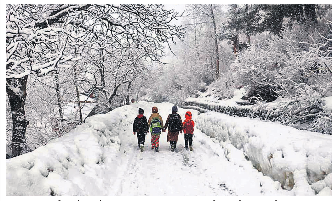
କସ୍-କମ୍ପାରର ବାରମୂଳା ଲିଲା ଅନ୍ତର୍ଗତ ତଙ୍ଗମାରୀ ଅଞ୍ଚଳରେ ପ୍ରବଳ ତୁଷାରପାତ ଯୋଗୁ ବରଫାବୃତ୍ତ ରାସ୍ତାରେ ପିଲାମାନେ ଶନିବାର ସ୍କୁଲ ଯାଉଛନ୍ତି।

ଆମେରିକା ରାଷ୍ଟ୍ରପତି ଜେ ବାଇଡେନ୍ଙ୍କ ନିର୍ଦ୍ଦେଶକ୍ରମେ ଆଲୀସ୍କାର ଉତ୍ତର ଉପକୂଳ ଆକାଶରେ ଉଡ଼ୁଥିବା ଏକ ଅଜଣା ବସ୍ତୁକୁ ଏହାର ମୁକ୍ତବିମାନ ଗୁଳିକରି ଖସାଇ ଦେଇଛି। କାର୍ ଆକୃତର ବସ୍ତୁଟି ୪୦,୦୦୦ ଫୁଟ ଉଚ୍ଚରେ ଉଡ଼ୁଥିଲା ଏବଂ ବେସାମରିକ ବିମାନ ଉଡ଼ାଣ ପାଇଁ ବିପଦ ସୃଷ୍ଟି କରିବା ଆଶଙ୍କା ରହିଥିଲା। ତେବେ ଏହା ଗୋଇନ୍ଦା ତଥ୍ୟ ସଂଗ୍ରହରେ ନିୟୋଜିତ ଥିଲା କି ନାହିଁ ସ୍ପଷ୍ଟ ହୋଇ ନ ଥିବା ହାଇଲ୍ ହାଇଲ୍ ଜାତୀୟ ସୁରକ୍ଷା ପରିଷଦ ମୁଖପାତ୍ର ଜନ୍ କିରୁବି କହିଛନ୍ତି। ସେହିପରି ଏହା କେଉଁଠୁ ଆସିଥିଲା ଏବଂ କେଉଁ ଉଦ୍ଦେଶ୍ୟରେ ଆସିଥିଲା, ତାହା ମଧ୍ୟ ଜଣାପଡ଼ିନାହିଁ। ତେବେ ପୂର୍ବରୁ ଆମେରିକା କ୍ଷେପଣାସ୍ତ୍ର ମାଡ଼ କରି ଖସାଇଥିବା ଚାଇନା