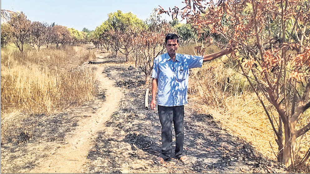
ଫାର୍ମ ହାଉସ୍‌ରେ ନିଆଁ ଲାଗି ଜଳିଯାଇଥିବା ମୂଲ୍ୟବାନ ଗଛ।