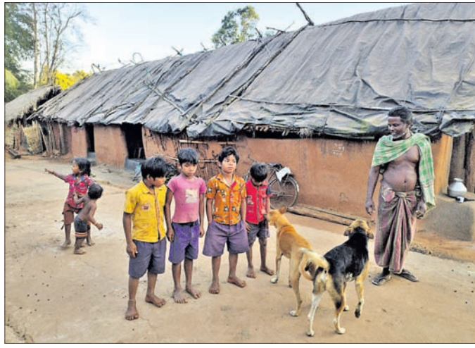
କରତୁଳି ଗାଁରାସ୍ତାରେ ପିଲାମାନେ ।

ନୟାଗଡ଼ ଜିଲ୍ଲା ନୂଆଗାଁ ବ୍ଲକ୍ ଜାକେତା ପଞ୍ଚାୟତର କରତୁଳି ଗାଁରେ ଶିଶୁମାନେ ହାତୀ ଭୟ, ଜଙ୍ଗଲ ରାସ୍ତା ଯୋଗୁ ଧୂଳି ଓ ଅଜ୍ଞାନତା କେନ୍ଦ୍ରକୁ ଯାଇ ପାରୁନାହାନ୍ତି । ପାଠ ନ ପଢ଼ି ଏଠାର ଶିଶୁମାନେ ପାଦ ହୋଇ ଚାଲିଛନ୍ତି । ଏକଥା ପାଠପଢ଼ୁଥିବା କେତେଜଣ ଶିଶୁ କହିଛନ୍ତି । ଅନ୍ୟପକ୍ଷେ ଅଭିଭାବକମାନେ ଏହାକୁ ସ୍ୱୀକାର କରିଛନ୍ତି । ସେହିପରି ହାତୀ ଭୟ ଯୋଗୁ ସନ୍ଧ୍ୟା ହେଲେ ଗାଁରେ ଚାଟିକବାଟ ପଡ଼ିଯାଉଛି । ସରକାର ଗ୍ରାମାଞ୍ଚଳ ପାଇଁ ଅନେକ ଯୋଜନା କରିଛନ୍ତି । ହେଲେ ମୋ ଗୁହାଳ, ଖଟଗାଡ଼ ପରି ଅନେକ ଯୋଜନା ଏଠାରେ ଅପହଞ୍ଚି ହୋଇ ରହିଛି । ଗାଁଠାରୁ ପଞ୍ଚାୟତର ଦୂରତା ୨ କିମି ହୋଇଥିବାବେଳେ ନୂଆଗାଁ ବ୍ଲକ୍ କାର୍ଯ୍ୟାଳୟ ୧୦ କିମି ଦୂରରେ ରହିଛି । ନୂଆଗାଁ ବାହାଡ଼ାଖୋଲା ରାସ୍ତାର କରତୁଳି ଛକଠାରୁ ୧କିମି ଗଲେ ପଡ଼େ କରତୁଳି ଗାଁ । ଏଠାରେ ୧୦ ପରିବାରର ୫୪ ଜଣ ବାସ କରନ୍ତି । ଜଣେ ଆଦିବାସୀ ପରିବାରକୁ ଛାଡ଼ିଦେଲେ ଅନ୍ୟ ସବୁ