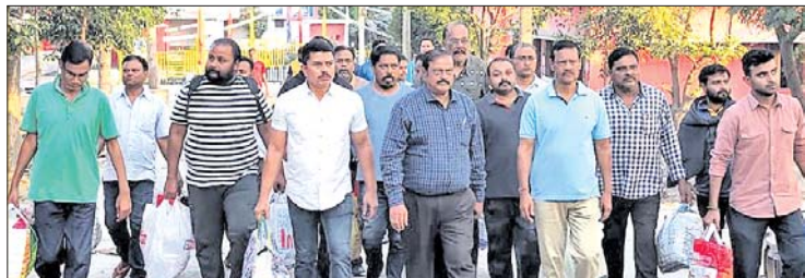
ସମ୍ବଲପୁର ଜେଲରୁ ବାହାରିଥିବା ଓକିଲମାନେ।

ପ୍ରତିନିଧିକ୍ଷେପମାନେ କୌଣସି ପ୍ରତିକ୍ରିୟା ଦେଇ ନ ଥିଲେ କିମ୍ବା ଏକାଠି ହୋଇ ନ ଥିଲେ। ପ୍ରାୟ ୬୦ଦିନ ବ୍ୟବଧାନରେ ପରିବାର ଓ ପରିଜନଙ୍କୁ ଦେଖିବା ପରେ କେତେଜଣ ଆଇନଜୀବୀ ଭାବବିହୀନ ହୋଇପଡ଼ିଥିଲେ। ସୂଚନାଯୋଗ୍ୟ, ପଶ୍ଚିମ ଓଡ଼ିଶାରେ ହାଇକୋର୍ଟ ସ୍ଥାୟୀ ବେଞ୍ଚ ଦାବିକେଲ ଆନ୍ଦୋଳନ ସମୟରେ ଡିସେମ୍ବର ୧୨ରେ ଅଭାବନା ଘଟଣା ଘଟିଥିଲା। କୋର୍ଟ ଭଙ୍ଗାଚୁରା ସହ ବିଚାରପତିଙ୍କୁ ବାହାର କରିଦେବା ଭଳି ଘଟଣା