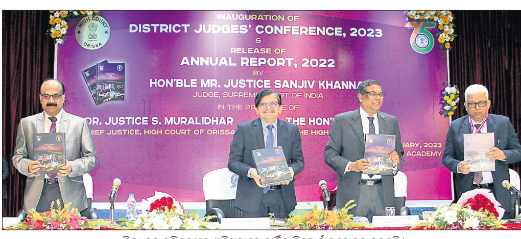
ଜିଲା ଜଜ୍ ସମିଳନୀରେ ଅତିଥିମାନେ ବାର୍ଷିକ ରିପୋର୍ଟ ଉଦ୍ଘାଟନ କରୁଛନ୍ତି ।

ଓଡ଼ିଶା ହାଇକୋର୍ଟ ପକ୍ଷରୁ ୨ ଦିନିଆ ଜିଲା ଜଜ୍ ସମିଳନୀ କଟକସ୍ଥିତ ଓଡ଼ିଶା ଛୁଟିଆଇ ଏକାଡେମୀରେ ଶନିବାର ଉଦ୍ଘାଟିତ ହୋଇଯାଇଛି । ସୁପ୍ରିମକୋର୍ଟ ବିଚାରପତି ସଞ୍ଜିବ ଖନ୍ନା ଏହାକୁ ଉଦ୍ଘାଟନ କରି କହିଥିଲେ, ଭାରତୀୟ ସଂସ୍କୃତି ମୁକ୍ତରେ ଓଡ଼ିଶା ହେଉଛି ଏକ ମଣି । ନିୟମ ଆଧାରରେ ଠିକ୍, ସ୍ୱଳ୍ପ ନିଷ୍ପତ୍ତି ହିଁ ହେଉଛି ନ୍ୟାୟ । ନ୍ୟାୟ ପ୍ରଦାନବେଳେ ପରିସ୍ଥିତିକୁ ସମ୍ବଳିତାରେ ବିଚାରପତିମାନେ ସେତିକି ଚିନ୍ତା ହେବାକୁ ସେ ପରାମର୍ଶ ଦେଇଥିଲେ । ସାମାଜିକ ଗଣମାଧ୍ୟମ ଦ୍ୱାରା ସତ୍ୟ କିପରି କ୍ଷୟ ହେଉଛି ତାହା ଉପରେ ଆଲୋଚନା କରିଥିଲେ । ନ୍ୟାୟ ପ୍ରଦାନବେଳେ ନିରପେକ୍ଷତା ପ୍ରତି ଯତ୍ନବାନ ହେବା ଉଚିତ ବୋଲି ବିଚାରପତି ଖାଲି କହିଥିଲେ ।