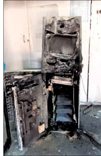
ଟଙ୍କା ଲୁଟ୍ ପରେ ଦୁର୍ଭିକ୍ଷମାନେ ପୋଡ଼ିଦେଇଥିବା ଏଟିଏମ୍।

ଏଟିଏମ୍‌ରୁ ଟଙ୍କା ଲୁଟ୍ କରିବା, ଏଟିଏମ୍‌ରେ ନିଆଁ ଲଗାଇ ପାଟୁଆ ପକ୍ଷରୁ ଚାଲିଯିବାର ଭିଡ଼ି ରେକର୍ଡ୍ ରହିଛି। ଏହାକୁ ପୋଲିସ୍ ଯାଞ୍ଚ କରୁଛି। ଟଙ୍କା ଲୁଟ୍ ପରେ ଦୁର୍ଭିକ୍ଷମାନେ ଶୋଭାପୁଟ୍ ବ୍ରିକ୍ ଦେଇ ଆନ୍ତ୍ରପ୍ରଦେଶର ପେଦାବାଇଲି ଅଞ୍ଚଳକୁ ଚାଲିଯାଇଥିବା ପ୍ରାଥମିକ ତଦନ୍ତରୁ ଜଣାପଡ଼ିଛି। ଏନେଇ ସାମାଜିକ ଅଞ୍ଚଳରେ ହାଲ ଆଲର୍ଟ କାରି ହୋଇଛି। ପୂର୍ବରୁ ବାଲେଶ୍ୱର, ନବରଙ୍ଗପୁର ଆଦି ଅଞ୍ଚଳରେ ଏଭଳି ଘଟଣା ଘଟଣା ଘଟଣା ଦୁର୍ଭିକ୍ଷମାନେ ଖସିଯିବାରେ ସଫଳ ହୋଇଥିବାରୁ ସେହି ସମାନ ଭଙ୍ଗରେ ବାଲୁଆ ଏଟିଏମ୍‌ରୁ ଲୁଟ୍ କରିଥିବାରୁ ସମ୍ପୃକ୍ତ ବ୍ୟାଙ୍କର ଏଥିରେ ସମ୍ପୃକ୍ତି ଥିବା ପୋଲିସ୍ ସଦେହ କରୁଛି। ପାଟୁଆ ଥାନାରେ ମାମଲା (ନଂ.୨୧/୨୩) ରୁକୁ କରାଯାଇ ଘଟଣାର ତଦନ୍ତ କରାଯାଉଥିବା ଏଡିପିଓ ମହାପାତ୍ର କହିଛନ୍ତି।