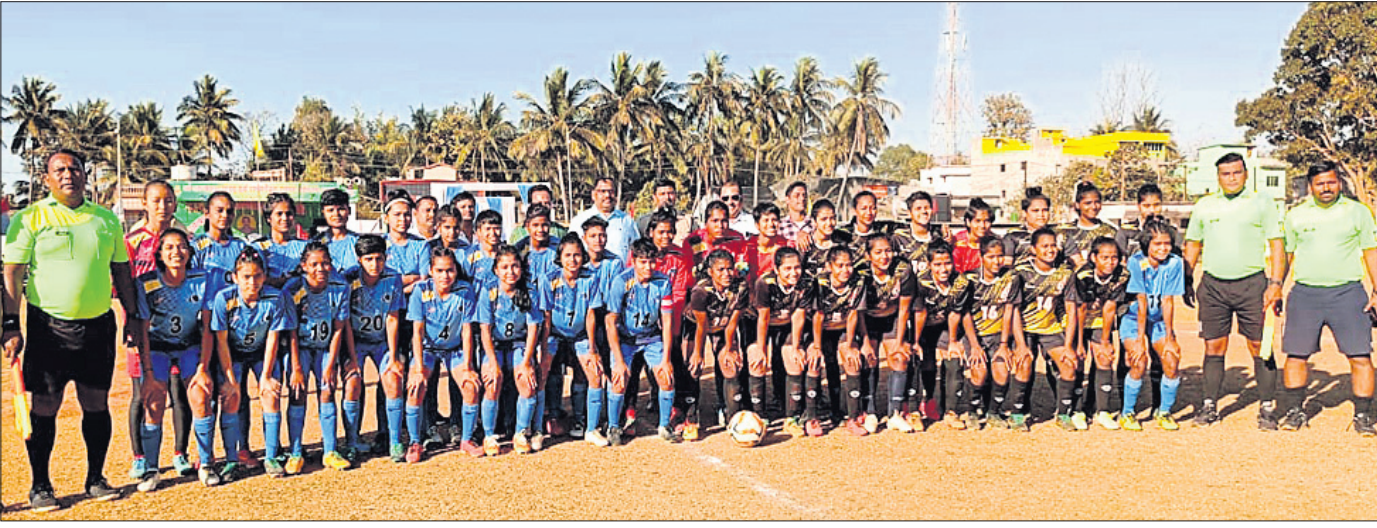
ଅତିଥି ଗହଣରେ ଉଭୟ ଦଳର ଖେଳାଳି ।