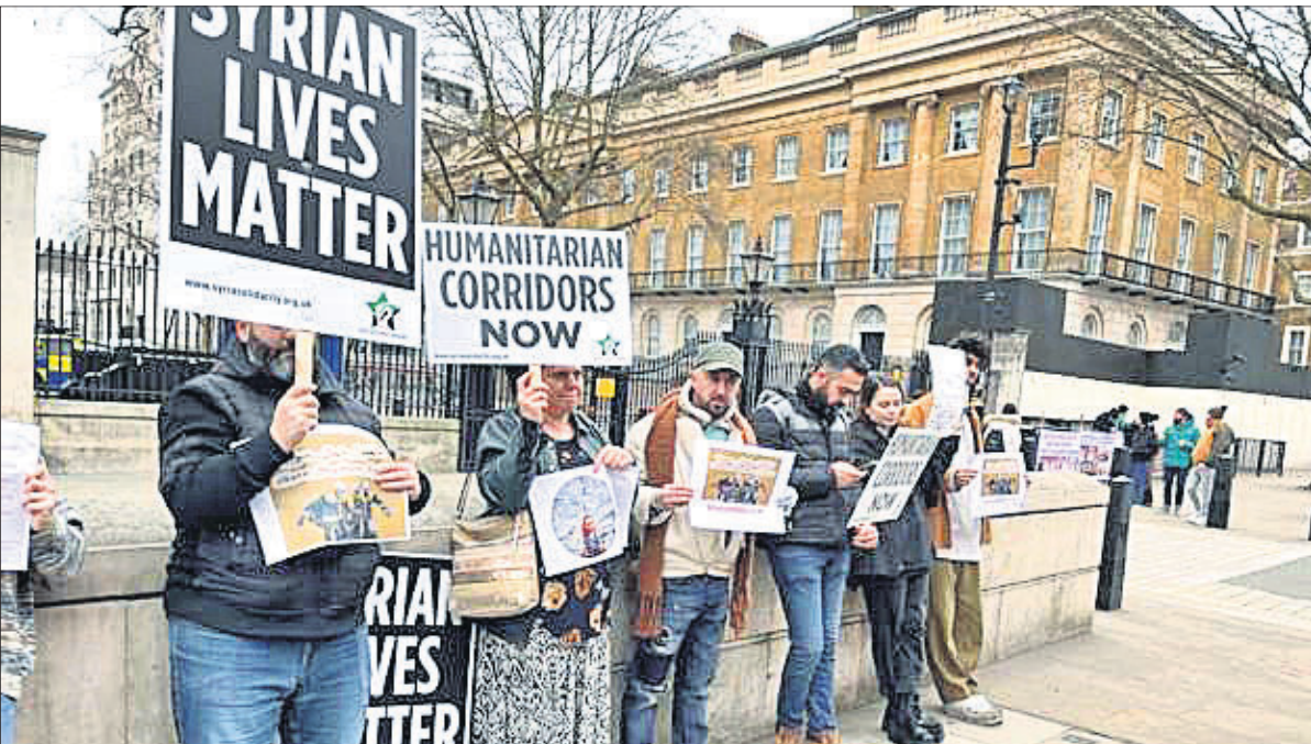
ଭୂକମ୍ପ ପ୍ରଭାବିତ ସିରିଆ। ତୁରକୀରେ ତୁରକୀକୁ ଅଧିକ ସହାୟତା ମିଳୁଥିବାରୁ ବ୍ରିଟେନ୍‌ର ଡାକ୍ତରୀ ଶ୍ରେଣୀରେ ଶିନିଆର ସିରିଆ ସମର୍ଥକମାନେ ବିରୋଧ ପ୍ରଦର୍ଶନ କରୁଛନ୍ତି।

ସାଉଥ୍ ପୁପୁରସ୍ଟାର ଅଲ୍ଲୁ ଅର୍ଜୁନ ନିକଟରେ ଚାକର ଜଣେ ପ୍ରଶଂସକଙ୍କ ବାପାଙ୍କ ସ୍ୱାସ୍ଥ୍ୟାବସ୍ଥା ଖରାପ ଜାଣି ସହାୟତା କରିଛନ୍ତି।