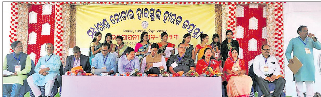
ହୀରକ ଜୟନ୍ତୀ ଉତ୍ସବରେ ମହାସାଧନ ଅତିଥି ।