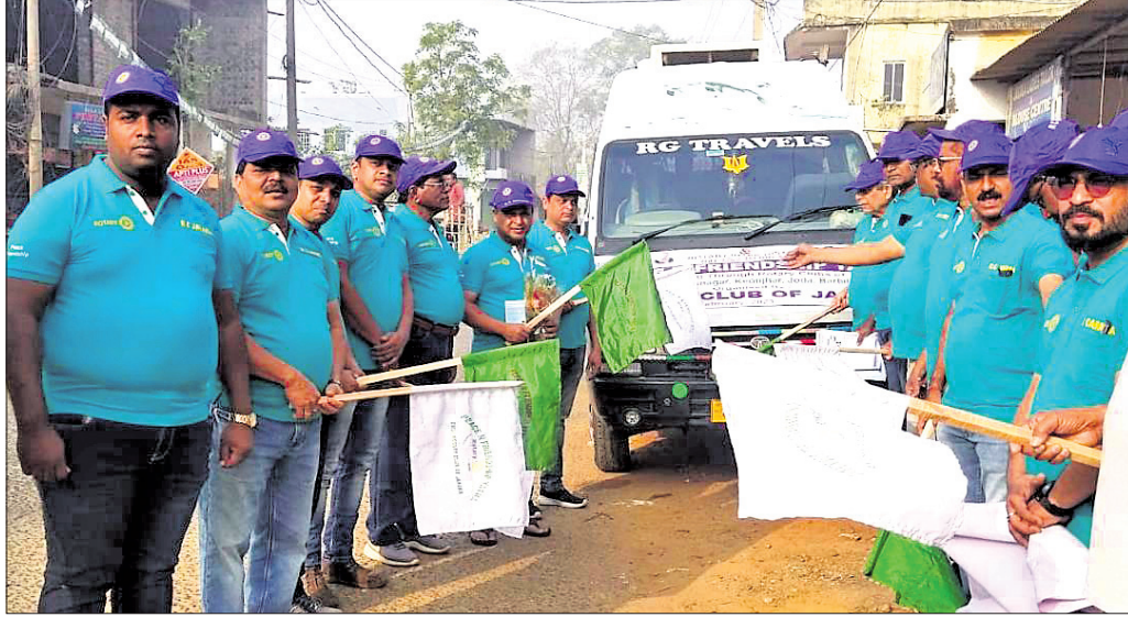
ଶାନ୍ତି ଓ ବନ୍ଧୁତ୍ୱ ଯାତ୍ରାକୁ ବିଧାୟକ ପଦାଳା ହଲାଇ ଶୁଭାରମ୍ଭ କରୁଛନ୍ତି।