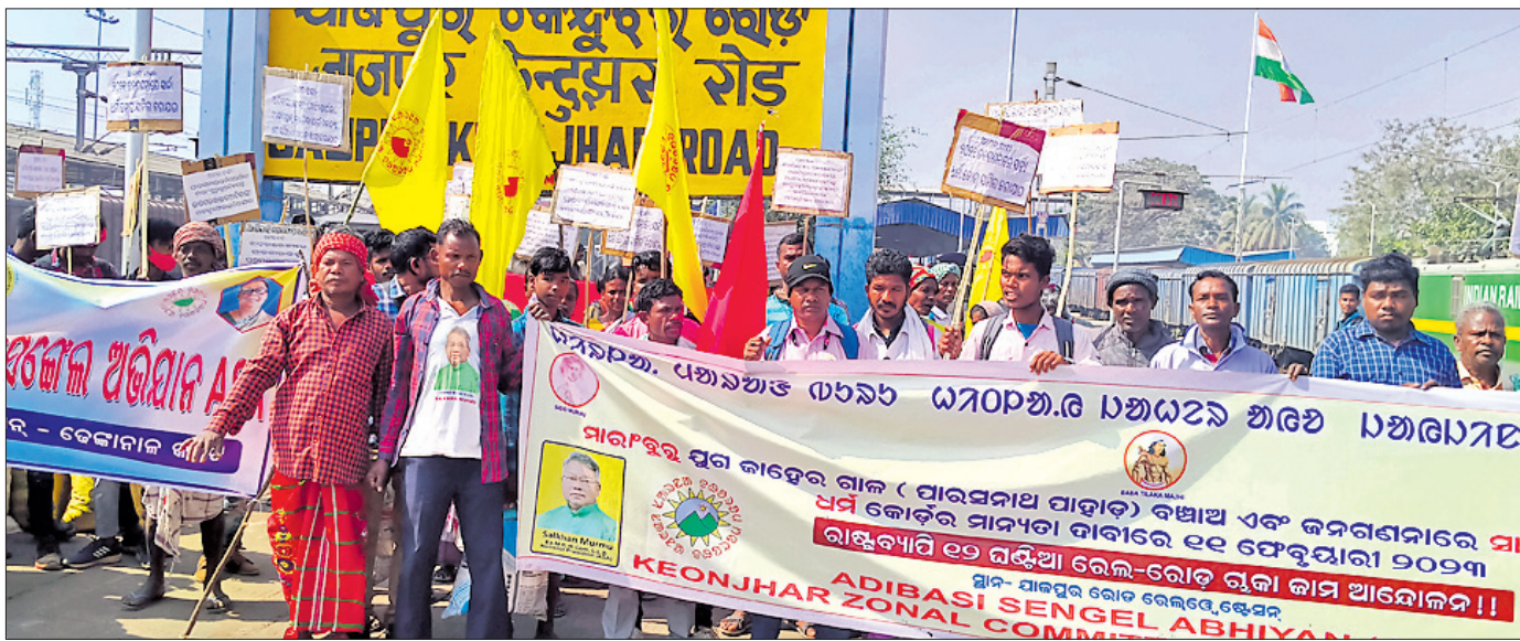
୫ ଦିନୀ ଦାବିରେ ନେଇ ଲୋକେ ଯାଜପୁର-କେନ୍ଦୁଝର ରୋଡ୍ ରେଳପଥକୁ ଅବରୋଧ କରିଛନ୍ତି।