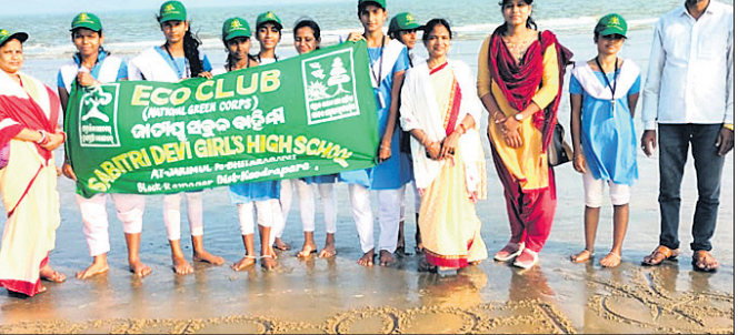
ସଫେଇ କାର୍ଯ୍ୟରେ ଯୋଗଦେଇଥିବା ଛାତ୍ରୀ, ଶିକ୍ଷୟିତ୍ରୀ ଓ ଶିକ୍ଷକମାନେ।