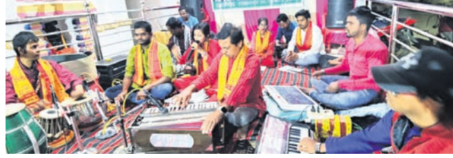
ମନ୍ଦିରର ବାର୍ଷିକ ଉତ୍ସବ ଅବସରରେ ସାଂସ୍କୃତିକ କାର୍ଯ୍ୟକ୍ରମ।