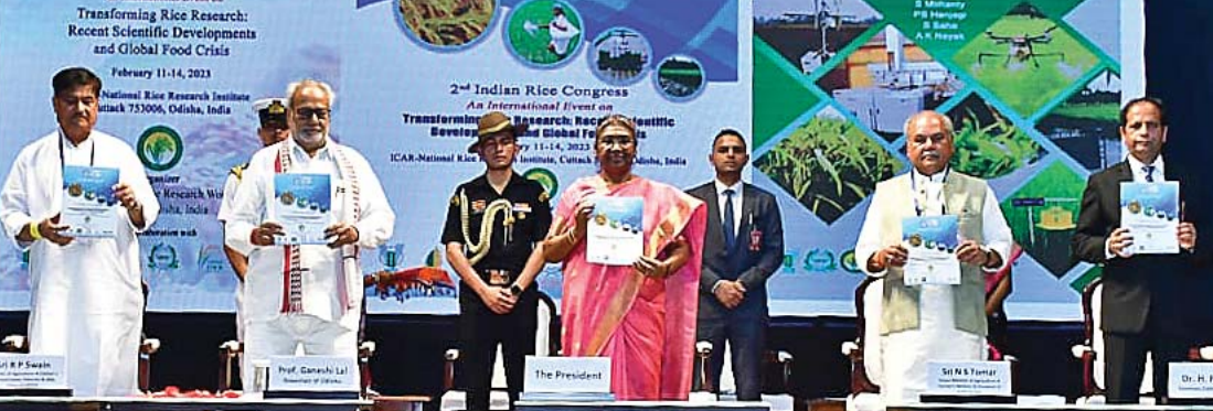
କଟକ ଜିଲ୍ଲା ବିଦ୍ୟାଧରପୁରସ୍ଥିତ ଏନ୍.ଆର୍.ଆର୍.ଆଇ.ରେ ଶନିବାର ୨ୟ ଭାରତୀୟ ରାଇସ୍ କଂଗ୍ରେସ୍ ଉଦ୍‌ଘାଟନା କାର୍ଯ୍ୟକ୍ରମରେ ରାଷ୍ଟ୍ରପତି ଦ୍ରୌପଦୀ ମୁର୍ଦ୍ଦୁ ଓ ଅନ୍ୟ ଅତିଥିମାନେ ସ୍ମରଣିକା ଉନ୍ମୋଚନ କରୁଛନ୍ତି।