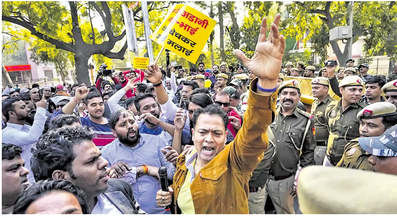
ଆଦାନୀ ପୁସ୍ତକ ଅନୁଷ୍ଠାନର କେପିଏ ଡିଭିଜନର ଆମ୍ଭ ଆଦାନୀ ପାର୍ଟି (ଏସପି) କର୍ମୀମାନେ ଭାଙ୍ଗିବା ନେତୃତ୍ୱାଧୀନ କେନ୍ଦ୍ର ସରକାରଙ୍କ ବିରୋଧରେ ସ୍ତୋତ୍ରାଦାନ ଦେଇ ନୂଆଦିଲ୍ଲୀରୁ ଦଳୀୟ ମୁଖ୍ୟମନ୍ତ୍ରୀ ନିକଟରେ ରବିବାର ବିଶୋଭ ପ୍ରଦର୍ଶନ କରୁଛନ୍ତି।