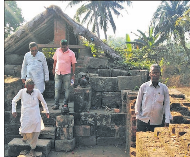
ଗୋଲରା ଗଡ଼ର ଭଗ୍ନ ଦେବୀ ତିତ୍ତୋପ୍ତାଙ୍କ ଆସ୍ଥାନସ୍ଥଳ।

ଦିକୁଆଁରା ରଥ ହତ୍ତାରେ ସଂଗ୍ରହ ହୋଇ ରହିଥାଏ। ସେଇ ରଥକୁ ଦଉଡ଼ିରେ ପ୍ରଥମ ପରସ୍ତ ବୋଳାଯାଏ। ଶୁଖିଗଲେ ପୁଣି ବୋଳାଯାଏ। ଏହିପରି ପାଞ୍ଚ ପରସ୍ତ ବୋଳା ହୋଇ ଖରାରେ ଶୁଖେ। ସେଇ ଗାଣ ଦଉଡ଼ି କପିଳକରେ ଲାଗି ମହଣ ସବୁ ଓଜନର ପଥର ଉପରକୁ ଯାଏ। ଦିକୁଆଁରା ରଥ ଯୋଗୁ ଦଉଡ଼ି ଯିବା ଆସିବାରରେ ଅଧୁନି ହୁଏ ନାହିଁ। ଆମେ ୨୦୨୧ ଫେବୃଆରୀ ୨୪ ତାରିଖରେ ଗୋଲରାଗଡ଼ ଯାଇ ପୋଥି ବସ୍ତ୍ର ଘଟଣାର ଅନୁସନ୍ଧାନ କରିଥିଲୁ। ଦିନସାରା ଗଡ଼ରେ ରହିଥିଲୁ। ଆମ ସହିତ ଓଡ଼ିଶା ଐତିହ୍ୟ ପରିଷଦ ଏବଂ କୋଣାର୍କ ଐତିହ୍ୟ ପରିଷଦର ସମ୍ପାଦକ