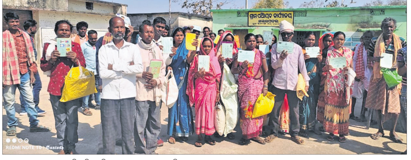
ଚାଉଳ ପାଇ ନ ଥିବା ନୂଆପଡ଼ା ଜିଲ୍ଲା ସିନାପାଳି ବ୍ଲକ୍ ଖଇରପଦର ପଞ୍ଚାୟତର ହିତାଧିକାରୀମାନେ ।