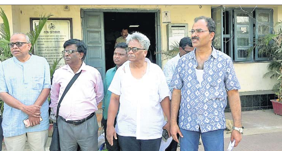
ଆନାରେ ବ୍ୱାରମ୍ଭ ହୋଇଥିବା ସିଟିଜେନ୍ ଫୋରମ୍ ସଦସ୍ୟ ।