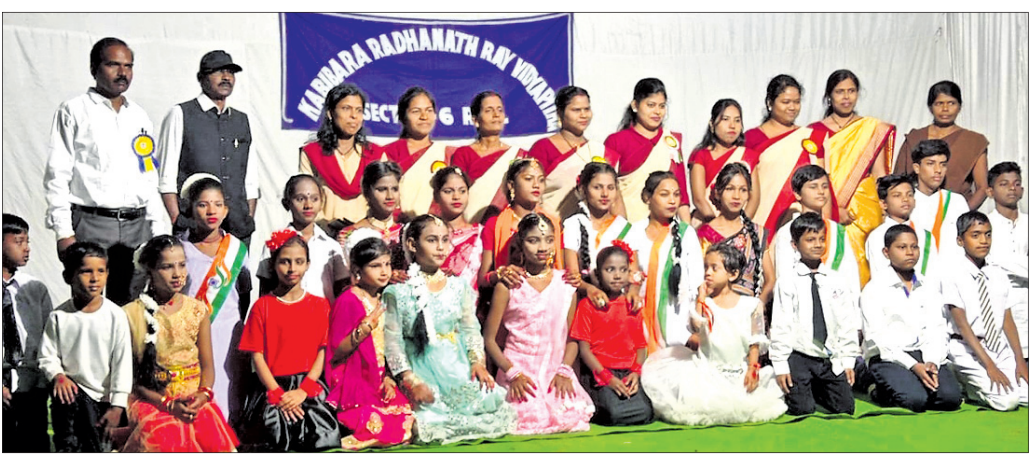
ଶିକ୍ଷୟିତ୍ରୀ ଶିକ୍ଷକଙ୍କ ଗହଣରେ ପୁରସ୍କୃତ ହୋଇଥିବା ଛାତ୍ରାଛାତ୍ରୀ।