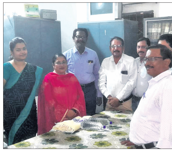
ବରିଷ୍ଠ ଦେଘ୍‌ନା ତଥା ସହକାରୀ ବୌଦ୍ଧକଳା ବିଦାୟ ସମ୍ବର୍ଦ୍ଧନା ଦିଆଯାଇଛି।