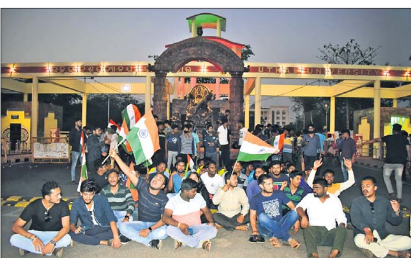
ଉତ୍କଳ ବିଶ୍ୱବିଦ୍ୟାଳୟ ମୁଖ୍ୟ ଫାଟକ ସମ୍ମୁଖରେ ଏକିଭିପି ସଦସ୍ୟମାନେ ଦେଇଥିବା ଧାରଣା ।