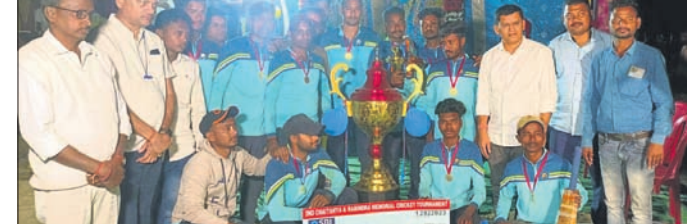
ଅତିଥିଙ୍କ ଗହଣରେ ଚାମ୍ପିୟନ ଦଳର ଖେଳାଳିବୃନ୍ଦ ।