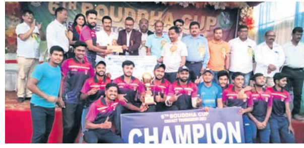
ଅତିଥିମାନଙ୍କ ଦ୍ୱାରା ଚାମ୍ପିୟନ ଦଳକୁ ତ୍ରୁଟି ପ୍ରଦାନ କରାଯାଇଛି।