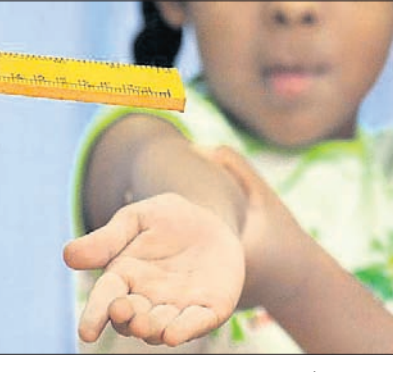
ଶିକ୍ଷକମାନେ ପିଲାଙ୍କ ଭିତରେ ଥିବା କୁଅଭ୍ୟାସ ଓ କୁପ୍ରବୃତ୍ତିକୁ ଦୂର କରି

ମାତ୍ର ବୟସଗତ ଅପରାଧକୁ କାରଣରୁ ସେ ଯେବେ କିଛି ଭୁଲ୍ କରିବେ ତେବେ ତାକୁ ବାଟକୁ ଆଣିବାକୁ କିଛିତା ଅନୁଶାସନର ଆବଶ୍ୟକତା ରହିଛି। ନ ହେଲେ ଏହାର ଅଭାବରେ ପିଲାଟିର ଆଚରଣରେ କିଛିତା ଅସ୍ୱାଭାବିକତା ଦେଖାଦେବା ସ୍ୱାଭାବିକ। ତା'ର ବୁଝାମଣା ବଢ଼ିଯିବ। ଶିକ୍ଷକଙ୍କ କଥା ବା ନିର୍ଦ୍ଦେଶକୁ ସେ ହେଉଛାନ୍ତ ମନେକରିବ। ଏବେ ବୋଧେ ଏସବୁ ଘଟଣା ପ୍ରାୟତଃ ସବୁ ବିଦ୍ୟାଳୟରେ ଦେଖିବାକୁ ମିଳୁଛି। ଉଚ୍ଚମ ଶିକ୍ଷାଦାନ ସହିତ ଶୁଣ୍ଠିତ, ସଂଯମା ଓ ସକରିତ୍ରବାଦ ହେବାର ସମସ୍ତ କଳାକୋଶ୍ରେଣୀ ବିଦ୍ୟାଳୟରେ ହିଁ ଶିକ୍ଷା ଦିଆଯାଇଥାଏ। ଏହାଠାରେ ହିଁ ପିଲାଏ ସେମାନଙ୍କ ଭବିଷ୍ୟତ ନିର୍ଦ୍ଦିଷ୍ଟ ପୁରୁଷିତ ଓ ସୁଚିନ୍ତିତ ମାର୍ଗବର୍ତ୍ତନ ପାଇଥାନ୍ତି। ଶିକ୍ଷକମାନେ ପିଲାଙ୍କ ଭିତରେ ଥିବା କୁଅଭ୍ୟାସ ଓ କୁପ୍ରବୃତ୍ତିକୁ ଦୂର କରି