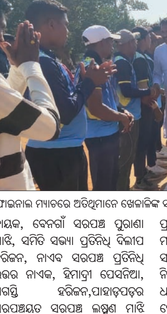
ଫାଇନାଲ୍ ମ୍ୟାଚ୍‌ରେ ଅତିଥିମାନେ ଖେଳାଳିଙ୍କୁ ସହ ପରିଚିତ ହେଉଛନ୍ତି।

କଳାହାଣ୍ଡି ଜିଲ୍ଲା ଲାଞ୍ଜିଗଡ଼ ବ୍ଲକ୍ ସ୍ତରୀୟ ୩୦ ଟୀମ୍ ଚାମ୍ପିୟନ ଟୁର୍ଣ୍ଣାମେଣ୍ଟର ଫାଇନାଲ୍ ମ୍ୟାଚ୍‌ରେ ଚଣାଳିମା ନକ୍‌ଆଉଟ କ୍ରିକେଟ୍ ଜିତିଥିବା ଦଳକୁ ଅତିଥିମାନେ ତ୍ରୁଟି ପ୍ରଦାନ କରୁଛନ୍ତି।