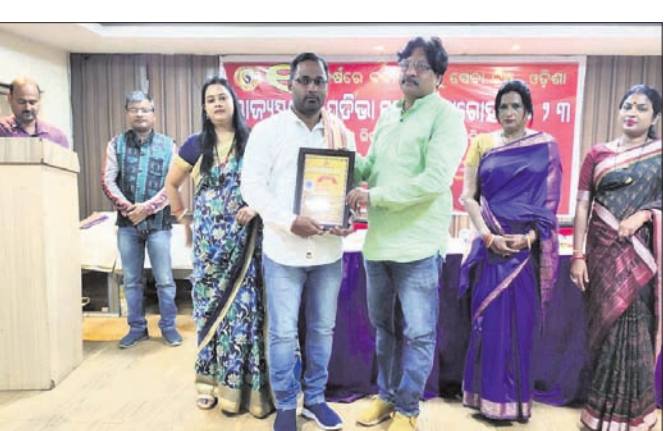
ରାଜ୍ ପୋଲି କ୍ଲିନିକ୍ ଆଣ୍ଡ ଡାକ୍ତରୋଷ୍ଟିକ ସେଣ୍ଟର ମୁଖ୍ୟ ସେବାରତ୍ନ ସମ୍ମାନ ଗ୍ରହଣ କରୁଛନ୍ତି।

ବରଗଡ଼ର ରାଜ୍ ପୋଲି କ୍ଲିନିକ୍ ଆଣ୍ଡ ଡାକ୍ତରୋଷ୍ଟିକ ସେଣ୍ଟରକୁ ସେବାରତ୍ନ ସମ୍ମାନରେ ସମ୍ବର୍ଦ୍ଧିତ କରାଯାଇଛି। କଟକ ବକ୍ସିକାର ସ୍ଥିତ ଓଡ଼ିଶା ପାଇଁ ନିବାସରେ ଅନୁଷ୍ଠିତ ବଦାନୀୟ ବନ୍ଧୁ ସଙ୍ଗଠନର ବାର୍ଷିକ ଉତ୍ସବ କାର୍ଯ୍ୟକ୍ରମରେ ଉତ୍ତମ ସେବା ଯୋଗାଇବା ସକାଶେ ଏହି ମର୍ଯ୍ୟାଦାଜନକ ସମ୍ମାନ ପ୍ରଦାନ କରାଯାଇଛି। ରାଜ୍ ପୋଲି କ୍ଲିନିକ୍ ଆଣ୍ଡ ଡାକ୍ତରୋଷ୍ଟିକ ସେଣ୍ଟରର ମୁଖ୍ୟ ପାଣିଗ୍ରାହୀ କହିଛନ୍ତି ।