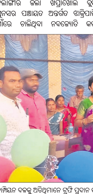
ଚାମ୍ପିୟନ ଦଳକୁ ଅତିଥିମାନେ ତ୍ରୁଟି ପ୍ରଦାନ କରୁଛନ୍ତି।

କଳାଙ୍ଗାର ଜିଲ୍ଲା ଖପ୍ରାଖୋଲ ବ୍ଲକ୍ ସ୍ତରୀୟ ୩୦ ଟୀମ୍ ଚାମ୍ପିୟନ ଟୁର୍ଣ୍ଣାମେଣ୍ଟର ଫାଇନାଲ୍ ମ୍ୟାଚ୍‌ରେ ନବଜ୍ୟୋତି କପ୍ ଜିତିଥିବା ଦଳକୁ ଅତିଥିମାନେ ତ୍ରୁଟି ପ୍ରଦାନ କରୁଛନ୍ତି।