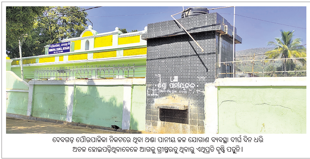
ଦେବଗଡ଼ ପୌରପାଳିକା ନିକଟରେ ଥିବା ଅଣ୍ଡା ପାର୍କର କଳ ଯୋଗାଣ ବ୍ୟବସ୍ଥା ଦୀର୍ଘ ଦିନ ଧରି ଅଟକ ହୋଇପଡ଼ିଥିବାବେଳେ ଆଗକୁ ଗ୍ରୀଷ୍ମଋତୁ ଥିବାରୁ ଏଥିପ୍ରତି ଦୃଷ୍ଟି ପଡ଼ିଛି।

ରାଉରକେଲା ଅଫିସ, ୧୨୧୨: ରାଉରକେଲା ଜିଆରପି ପୋଲିସ୍ ବିଶ୍ୱା ରେଲୱେ ଓଡ଼ରକ୍ରିକ ରେଲ ଧାରଣାକୁ ଜଣେ ଅଜଣା ଯୁବକଙ୍କ ମୃତଦେହକୁ ରବିବାର ଜବତ କରିଛି। ମୃତକଙ୍କ ଉତ୍ସବ ପାଖାପାଖି ୩୦ ବର୍ଷ ହେବ ଏବଂ ତାଙ୍କ ପରିଚୟ ମିଳିନାହିଁ। ରବିବାର ଅପରାହ୍ଣ ସାଢ଼େ ୨ଟାରେ ଉକ୍ତ ଯୁବକଙ୍କ ମୃତଦେହ ରେଲ ଧାରଣାରେ ପଡ଼ିଥିବା ମଞ୍ଜି ବସ୍ତିର ଲୋକେ ଦେଖି ପୋଲିସ୍‌କୁ ଖବର ଦେଇଥିଲେ। ପୋଲିସ୍ ଘଟଣାସ୍ଥଳରେ ପହଞ୍ଚି ମୃତଦେହ ଉଦ୍ଧାର କରି ଆରକ୍ଷିତ ମର୍ଗ ଶାସ୍ତ୍ରରେ ରଖିଛି। ଏ ନେଇ ପୋଲିସ୍ ଏକ ଅପମୃତ୍ୟୁ ମାମଲା (ନଂ. ୧୩୧୨୩) ଗୁରୁ କରି ଘଟଣାର ତଦନ୍ତ ଚଳାଇଛି।