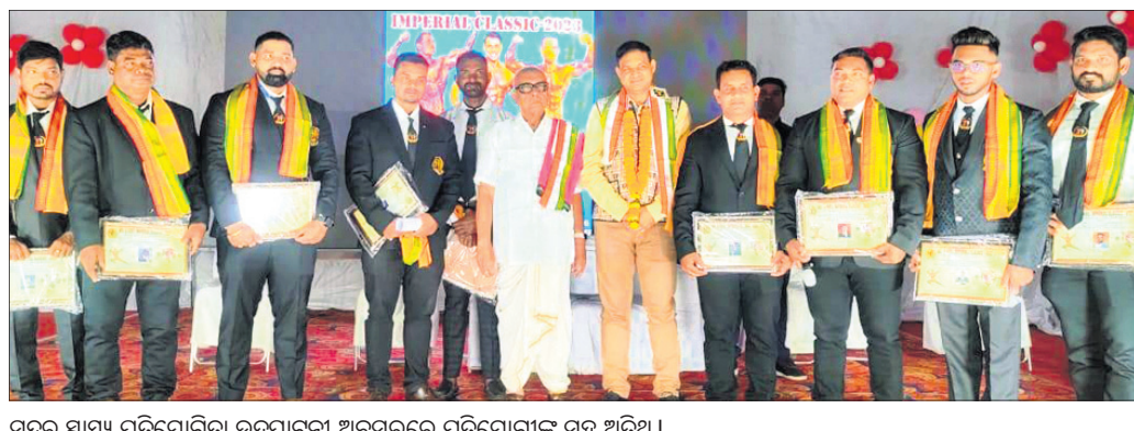
ସୁନ୍ଦର ସ୍ୱାସ୍ଥ୍ୟ ପ୍ରତିଯୋଗିତା ଉଦ୍‌ଘାଟନା ଅବସରରେ ପ୍ରତିଯୋଗୀଙ୍କ ସହ ଅତିଥି ।