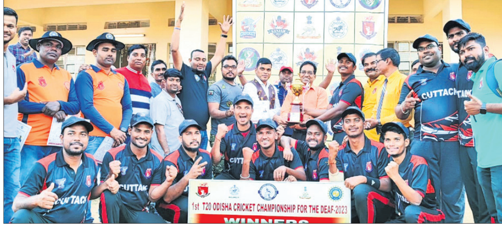
କଟକର ଦଳ ସହ ଅତିଥିମାନେ ।

ବଲାଙ୍ଗୀର ଜିଲ୍ଲା ସଙ୍ଗତର ବଡ଼ମାଳ ଗୋଳାବାରୁଦ ଘୋର୍ଷିତ ଷ୍ଟୁଡିୟମରେ ବଧୂର ଚିତ୍ର ଓଡ଼ିସିଏ ପ୍ରଥମ ଓଡ଼ିଶା କ୍ରିକେଟ ଚାମ୍ପିୟନଶିପ ରବିବାର ଅନୁଷ୍ଠିତ ହୋଇଯାଇଛି। ଅପରାହ୍ନରେ କଟକ ଓ ବଲାଙ୍ଗୀର ମଧ୍ୟରେ ଫାଇନାଲ ଖେଳ ଅନୁଷ୍ଠିତ ହୋଇଥିଲା। ବଲାଙ୍ଗୀର ପ୍ରଥମେ ବ୍ୟାଟିଂ କରି ନିର୍ଦ୍ଧାରିତ ୨୦୦ରୁଅଧିକ ୧୪୩ ରନ କରିଥିଲା। କଟକର ୧୮ ଓଭରରେ ୫ ରନକେବଳ ବିନିମୟରେ ଆବଶ୍ୟକ ରନ ସଂଗ୍ରହ କରି ବିଜୟୀ ହୋଇଥିଲା। ଫାଇନାଲ ଖେଳରେ ସୁରେନ୍ଦ୍ର ମହାନନ୍ଦ ଓ ବିକ୍ରମ ରାଉତ ଅମ୍ପେୟାର, ନିମାଇଁ ଚରଣ ମଲିକ ଓ ବୀରେନ୍ଦ୍ର ମୁନା ଷ୍ଟୋରର ଦାୟିତ୍ୱ ତୁଲାଉଥିଲେ। ପୁରସ୍କାର ବିତରଣ ଉତ୍ସବରେ ବଡ଼ମାଳ ଗୋଳାବାରୁଦ କାରଖାନାର ମହାପ୍ରବନ୍ଧକ ପ୍ରଦୀପ