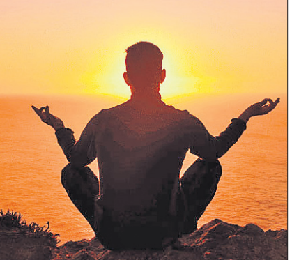
କେତେକ ଆୟାମକୁ ଦେଖିପାରିଛନ୍ତି। ଯେତିକି କି ପୋତା ଇନ୍ଦ୍ରପ୍ରାରେତ୍ ତରଙ୍ଗକୁ ଦେଖିପାରିବେ। ସେହିପରି ଆମ ସମସ୍ତେ ନିଷ୍ଠାସ ପ୍ରଶ୍ନାସରେ ନେଉଥିବା ବାୟୁ ଆମକୁ ଅଦୃଶ୍ୟ ଓ ସେଥିରେ ବିଜ୍ଞାନ ଦୃଷ୍ଟିକୋଣରୁ ଅନେକ ପ୍ରକାରର ବାୟୁକଣିକା ଭରି ରହିଛି; ଯେପରିକି ସବସ୍ପାରୋୟାନ, ଅନୁଜାନ, ଅଜ୍ଞାନକାମ୍ପ୍ ଜଣାଯାଏ ଯାହା ଦିନେ ଆମକୁ ଅଜଣା ଥିଲା। ଏ ସବୁ ବ୍ୟାଖିବାର ଚାପୁର୍ଣ୍ଣ ହେଲା, ସାରା ଜଗତରେ ଏତିକି ଅନେକ କିଛି ଅଦୃଶ୍ୟ ଓ ଅଜଣା କିଛି ଅଛି, ଯାହା ଖୋଜି ବାହାର କରିବା ବେଳକୁ ହୁଏତ ଏ ମଣିଷ ସତ୍ୟତା ବିଲୁପ୍ତ ହୋଇଯାଇଥିବ। ଆଉ ମଣିଷ ସତ୍ୟତା ବ୍ୟତୀତ ଯେତେବସ୍ତୁ ଲଜ୍ଜ ଜ୍ଞାନ, ପୂଣି ଉଦ୍ଭେଦଯାଳ ଜଗତର ବିଶାଳତା ଭିତରେ ପୂଣି ହଜିଯିବ। ଅର୍ଥାତ୍ ଜ୍ଞାନର ସ୍ୱରୂପ ଓ କାୟା କେବଳ ମଣିଷଦ୍ୱାରା ହିଁ ପରିପୁଷ୍ଟ ହୁଏ। ଏଠାରେ ମହାଭାରତରେ ବର୍ଣ୍ଣିତ ଯଶ ଓ

ଜ୍ଞାନ ପ୍ରାପ୍ତି ପାଇଁ ଯେଉଁ ଧ୍ୟାନ, ସାଧନା, ଅଧ୍ୟବସାୟ ଓ ଜିଜ୍ଞାସା ଆବଶ୍ୟକ, ତାହା ଆସିଥାଏ ମାନସିକ ଏକାଗ୍ରତାଠାରୁ ଓ ଏହି ମାନସିକ ଏକାଗ୍ରତା ଦୃଢ଼ କରିବାକୁ ଆବଶ୍ୟକ ହୋଇଥାଏ କପ, ଧ୍ୟାନ ଆଦି ଆଧ୍ୟାତ୍ମିକ ମାର୍ଗ। ଏକ ପ୍ରକୃତ ମାନସିକ ଶକ୍ତିସମ୍ପନ୍ନ ବ୍ୟକ୍ତି ହିଁ ବେଦ, ଉପନିଷଦ ଆଦିକୁ ମନେରଖିପାରିବ, ଅନ୍ୟଥା ଲିଙ୍ଗର ପଦ୍ଧତିର ଆବିଷ୍କାର ପୂର୍ବରୁ ଏହିସବୁ ଗ୍ରନ୍ଥଗୁଡ଼ିକୁ ପଢ଼ି ପରେ ପଢ଼ି ମନେରଖିବା ନୁହେଁ ଅସମ୍ଭବ ହୋଇଥାଆନ୍ତା। ଆଜି ଲିଙ୍ଗର ଓ ମୁଦ୍ରଣ ପଦ୍ଧତିର ଆବିଷ୍କାର ପରେ ବୋଧହୁଏ ସେହି ପ୍ରକୃତ ମାନସିକ କସରତର ଆଉ ବିଶେଷ ଆବଶ୍ୟକତା ପଡ଼ୁନାହିଁ। ତେବେ ଆଜି ବିଜ୍ଞାନ ଓ ବୈଷୟିକ କ୍ଷେତ୍ରରେ ଅନେକ ଆବିଷ୍କାର ଓ ଉଦ୍ଧାରଣ ହୋଇଛି, କିନ୍ତୁ ଏହି ଜ୍ଞାନ ବିଶାଳ ବିଶ୍ୱବ୍ରହ୍ମାଣ୍ଡର ଅଜ୍ଞତା ରୁକ୍ଷନାରେ ଅତି ସୀମିତ। ଅଜ୍ଞାନ ତ ଏହି ସାମାଜିକ ବିଶ୍ୱ ପରି ଅସୀମ, ଯାହାର କିଛି କିଛି ଅଂଶ ଆମେ ଅନାବୃତ୍ତ କରି ଚାଲିଛେ। ଆଜି ଅନାବୃତ୍ତ ଜ୍ଞାନ ଆସନ୍ତାକାଳି ପରିବର୍ତ୍ତନ ମଧ୍ୟ ହୋଇଯାଉଛି। ଜ୍ଞାନର ସତ୍ୟତା ଆଜି ଯାହା କାଳି ତାହା ଆଉ କିଛି ପ୍ରମାଣିତ ହୋଇଯାଉଛି। ଯେପରି କି କିଛି ଶତାଦ୍ଧୀ ପୂର୍ବରୁ ମଣିଷର ଜ୍ଞାନ