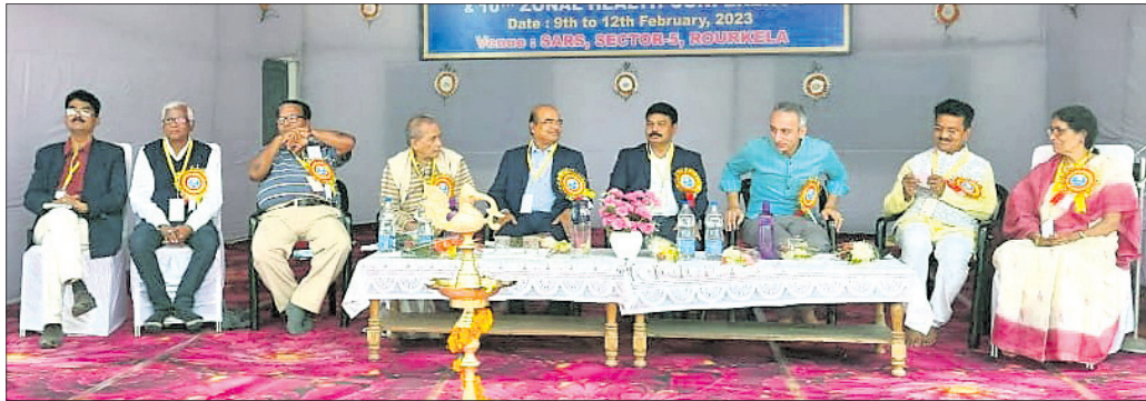
ସୁବର୍ଣ୍ଣ ଜୟନ୍ତୀ ଉଦ୍‌ଘାଟନା ସଭାରେ ମଞ୍ଚାସୀନ ଅତିଥିମାନେ।