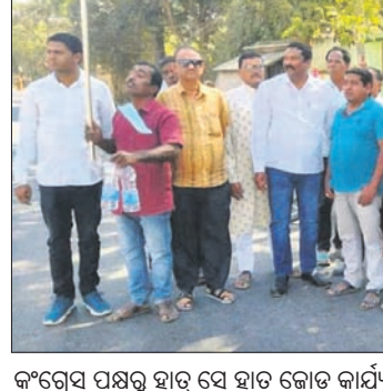
କଂଗ୍ରେସ ପକ୍ଷରୁ ହାତ୍ ସେ ହାତ୍ ଜୋଡ଼ି କାର୍ଯ୍ୟକ୍ରମ।

ବୌଦ୍ଧ ଜିଲ୍ଲା କଂଗ୍ରେସ କମିଟି ପକ୍ଷରୁ ପଞ୍ଚାୟତସ୍ତରରେ ହାତ୍ ସେ ହାତ୍ ଯୋଡ଼ି କାର୍ଯ୍ୟକ୍ରମ ଗତାବର୍ଷ ଠାକୁ ଆରମ୍ଭ ହୋଇଛି।