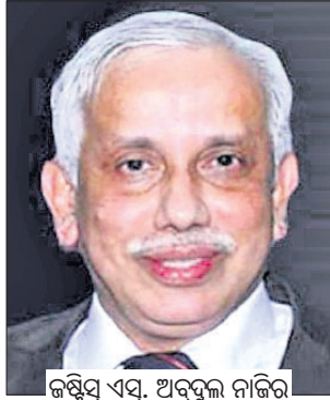
ଜଷ୍ଟିସ୍ ଏସ୍. ଅବ୍ଦୁଲ ନାଜିର