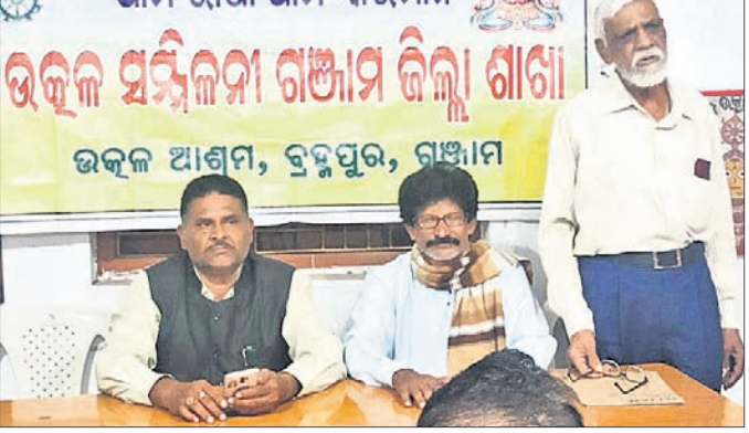
ସଭାରେ ଉପସ୍ଥିତ ସମ୍ମିଳନୀର ସଦସ୍ୟ କୁମ୍ଭ ।