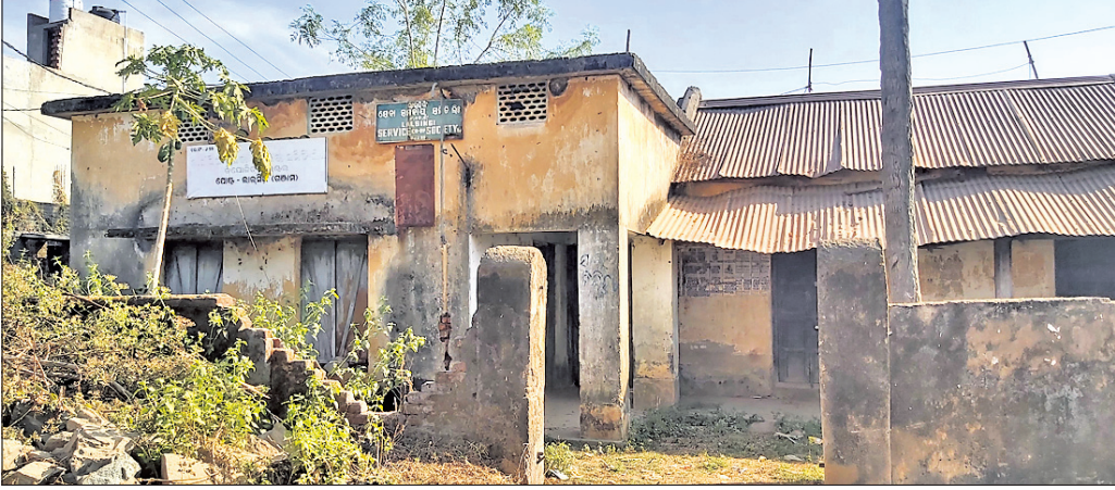
ଭଗ୍ନ ଅବସ୍ଥାରେ ଥିବା ଲାଇସିଂ ସୋସାଇଟି କୋଠା ।

କୃଷକମାନଙ୍କ ଉନ୍ନତି ପାଇଁ ବିଭିନ୍ନ ସେବା ସମବାୟ ସମିତି ସଂସ୍ଥା କାର୍ଯ୍ୟ କରୁଛି। ଭଞ୍ଜନଗର ବ୍ଲକରେ ୧୩ଟି ସେବା ସମବାୟ ସମିତି କାର୍ଯ୍ୟାଳୟ ଅଛି । ସେଥିମଧ୍ୟରୁ ୧୦ଟି କାର୍ଯ୍ୟାଳୟର ନିର୍ମାଣ କୋଠା ବର୍ତ୍ତମାନ ଭଗ୍ନ ଅବସ୍ଥାରେ ରହିଛି। ତେଣୁ ସେସବୁ କାର୍ଯ୍ୟାଳୟଗୁଡ଼ିକ ୫୦୦ ଟଙ୍କା ଆ ଭଡ଼ାଘରେ ରାଲିଛି। ଏତେ କମ୍ ଟଙ୍କାରେ ଘରଭଡ଼ା ମିଳୁ ନ ଥିବା ବେଳେ ସୋସାଇଟି ସମ୍ପାଦକମାନେ ବିକଳ ବ୍ୟବସ୍ଥା କରି କାର୍ଯ୍ୟାଳୟ ଖୋଲୁଛନ୍ତି । ଆଉ ୩ଟି ସେବା ସମବାୟ ସମିତି ଯଥା ଲିକ୍ସି, ଡିଲିସିଲି ଏବଂ ମୁକ୍ତାଗଡ଼ର ନିର୍ମାଣ କୋଠା କାର୍ଯ୍ୟକ୍ରମ ଅଛି । କିଛି ସୋସାଇଟିରେ ଆଇନଗତ ବିବାଦ ଯୋଗୁ ଏକ ବର୍ଷ ହେବ ଚାଲି ପଡ଼ିଛି । ତେଣୁ ବର୍ତ୍ତମାନ ସାହିତ୍ୟରେ ଥିବା ସମ୍ପାଦକ ନିଜ ଘରେ କାର୍ଯ୍ୟାଳୟ ଖୋଲି କାମ ଚଳାଇଛନ୍ତି। ଲିଭାର ଅନେକ ସେବା ସମବାୟ ସମିତି ସଂସ୍ଥା କାର୍ଯ୍ୟାଳୟର ସମାନ ଅବସ୍ଥା। ସେବା ସମବାୟ ସଂସ୍ଥାଗୁଡ଼ିକୁ ସରକାର ଦିନକୁ ଦିନ ଅଧିକ କ୍ଷମତା ଦେଉଥିବା ବେଳେ କାର୍ଯ୍ୟାଳୟର ଉନ୍ନତି ପାଇଁ ବିଶେଷ ଅନୁଦାନ ଦେଉନାହାନ୍ତି । ନିର୍ମାଣ କୋଠା ନଥିବା ଯୋଗୁ କେତେକ ସୋସାଇଟିରେ କାରଜକଳମରେ ମଣ୍ଡି ଚାଲିଛି । ଗୋଦାମ ଗୃହ ନ ଥିବା ଯୋଗୁ