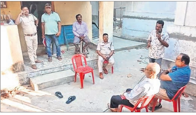
ଚୋରି ଘଟଣାର ତଦାଘନା କରୁଛି ପୋଲିସ ।