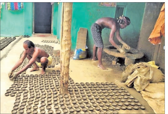
ଦୀପ ପ୍ରସ୍ତୁତିରେ ବ୍ୟସ୍ତ କୁମ୍ଭକାର ପରିବାର ।

ମହାଶିବରାତ୍ରୀ ବା ଜାଗର ଆସନ୍ତା ୧୮ ତାରିଖ ଶନିବାର ପାଳନ ହେବାକୁ ଯାଉଥିବା ବେଳେ ବୁଢ଼ୁଡ଼ା ଅଞ୍ଚଳର ବହୁ କୁମ୍ଭକାର ପରିବାର ମାଟିଦୀପ ତିଆରିରେ ବ୍ୟସ୍ତ ଥିବା ଦେଖିବାକୁ ମିଳୁଛି। ପୂର୍ବ ପୁରୁଷରୁ ମାଟିରୁ ବିଭିନ୍ନ ସାମଗ୍ରୀ ପ୍ରସ୍ତୁତିକୁ କୌଳିକ ବୃତ୍ତି ଭାବେ ଆପଣାଇ ନେଇଥିବା କୁମ୍ଭକାରଙ୍କ ବେଢ଼ସା ଆଧୁନିକତାର ମାଡ଼ରେ ନ ହଜିଯାଇ ଅଦ୍ୟାବଧି ବହୁ ରହିଛି। ପୂର୍ବରୁ ମାଟିପାତ୍ରର ଚାହିଦା ଯଥେଷ୍ଟ ଥିବାରୁ ଏବଂ ରୋଷେଇ ପାଇଁ ଆବଶ୍ୟକ ମାଟିପାତ୍ରଠାରୁ ଆରମ୍ଭ କରି ହାଣ୍ଡି, ମାଠିଆ, ସୁରୋଇ ଆଦି ବିଭିନ୍ନ ସାମଗ୍ରୀ ପ୍ରସ୍ତୁତ କରି କୁମ୍ଭକାର ପରିବାର ବେଶ୍ଟି ରୁଜ ପଇସା ରୋଜଗାର କରି ପରିବାରର ରୁଜରାଣ ମେଣ୍ଟାଇ ପାରୁଥିଲା। ସମୟାନୁକ୍ରମେ ଆଧୁନିକ ମଣିଷର ରୁଚିରେ ମଧ୍ୟ ପରିବର୍ତ୍ତନ ଦେଖାଦେଇଛି। ଏବେ ରୋଷେଇ ପାଇଁ ସାଧାରଣ ଲୋକେ ମାଟିପାତ୍ରକୁ ଭୁଲି ବିଭିନ୍ନ ଧାତୁରେ ନିର୍ମିତ ବାସନାସୁଦନ ବ୍ୟବହାର କରିବାକୁ ପସନ୍ଦ