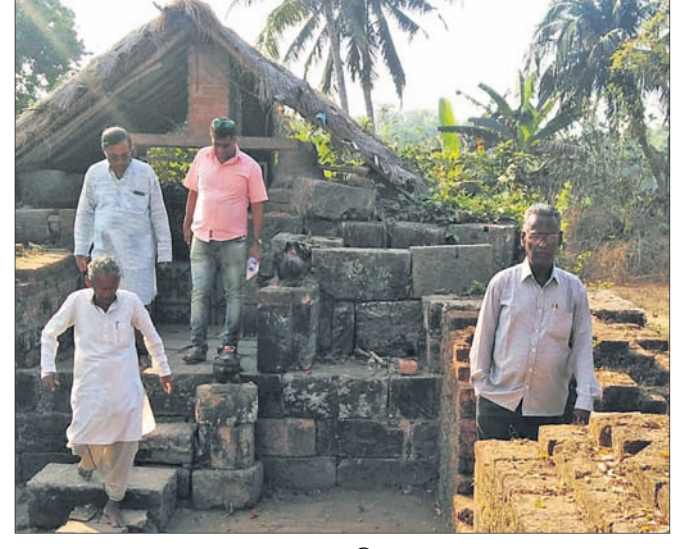
ଗୋଲରା ଗଡ଼ର ଭଗ୍ନ ଦେବୀ ଚିତ୍ରୋତ୍ପଳା ଅଧୀନରେ।