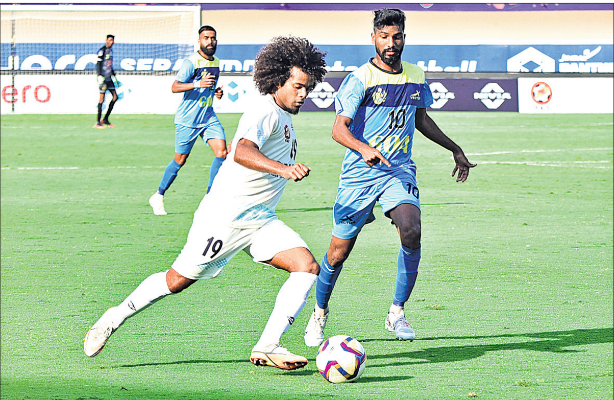
କଳିଙ୍ଗ ଷ୍ଟାଡ଼ିୟମରେ ରବିବାର ଓଡ଼ିଶା ଓ କେରାଳ ମଧ୍ୟରେ ଅନୁଷ୍ଠିତ ମ୍ୟାଚ ।