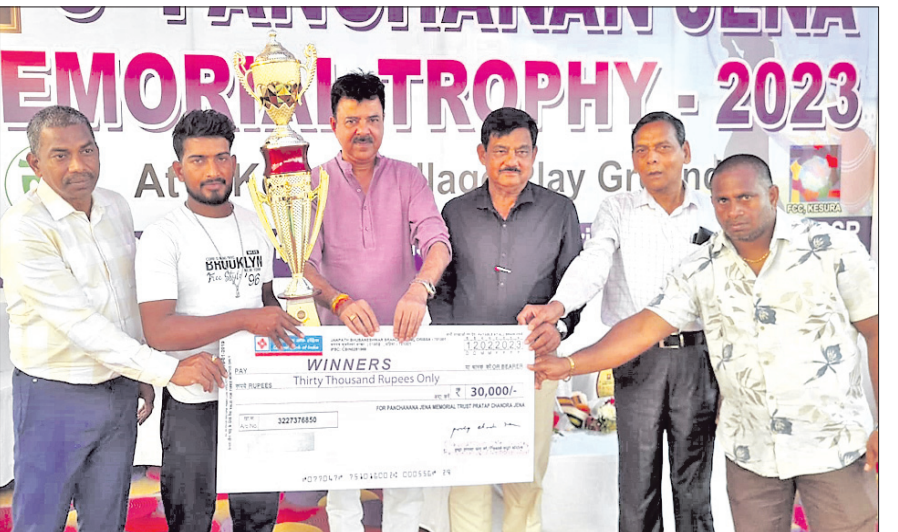
ସୋଲାର କ୍ରିକେଟ କ୍ଲବର ଅଧିନାୟକ ଅତିଥିଙ୍କଠାରୁ ପୁରସ୍କାର ଗ୍ରହଣ କରୁଛନ୍ତି ।