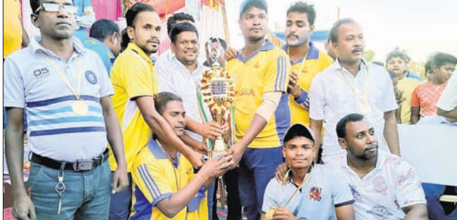
ଅତିଥିକ ଗହଣରେ ଚାମ୍ପିୟନ ଦଳର ଖେଳାଳିମାନେ

ଭାସ୍କର, ୧୨୧୨ (ଡି.ଏନ୍.ଏ.) ପ୍ରାଣୀକ ଚଳୁ ଅଧୀନ ନିମାଣି ଗାଁରେ ଚାଲିଥିବା ବାବୁଭାଇ ସ୍କାଲରା କ୍ରିକେଟ ଟୁର୍ନାମେଣ୍ଟ ଉଦ୍ଘାଟନା ପାଇଁ ଖେଳ ଅନୁଷ୍ଠିତ ହୋଇଯାଇଛି।