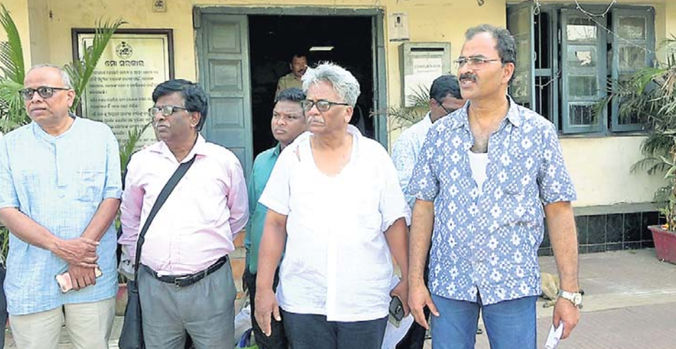
ଆନାରେ ବ୍ୱାରମ୍ଭ ହୋଇଥିବା ସିଟିଜେନ୍ ଫୋରମ୍ ସଦସ୍ୟ ।