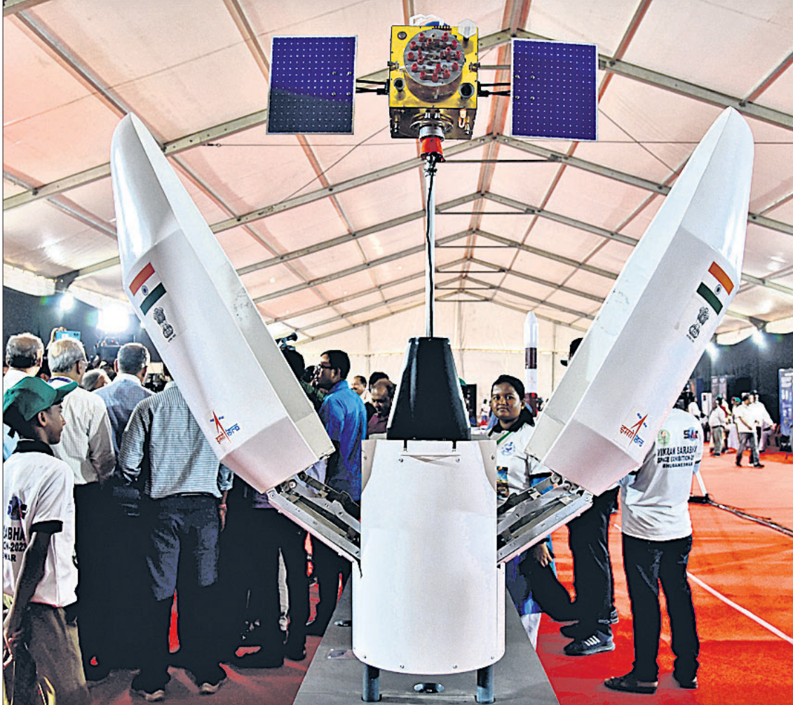
ଭାରତୀୟ ମହାକାଶ ଉଦ୍ଦେଶ୍ୟ ସଂସ୍ଥା (ଇସ୍ରୋ) ଓ ରାଜ୍ୟ ସରକାରଙ୍କ ପକ୍ଷରୁ ଭୁବନେଶ୍ୱର କ୍ୟାମ୍ପସ୍‌ରେ କ୍ୟାମ୍ପସ୍‌ରେ ରବିବାର ଉଦ୍ଘାଟିତ 'ସ୍ପେସ୍ ଅନ୍ ଡୁଇଲ୍' ପ୍ରଦର୍ଶନୀରେ ପ୍ରଦର୍ଶିତ ହୋଇଥିବା ଏକ ପ୍ରକଳ୍ପ।

ରାଜ୍ୟପାଳ ପଦବୀ ଦିଆଯାଇଛି ବୋଲି କଂଗ୍ରେସ ଏମ୍ପି ମାଣିକମ୍ ଚେରୋର କହିଛନ୍ତି। ସେହିପରି ବରିଷ୍ଠ କଂଗ୍ରେସ ନେତା ରଶିଦ୍ ଅଲଭି କହିଛନ୍ତି, ବିଚାରପତିମାନଙ୍କୁ ସରକାରୀ ନିୟୁକ୍ତି ଦିଆଯିବା ଦୁର୍ଭାଗ୍ୟଜନକ। ଏକ ବିପୋର୍ଟ ଅନୁସାରେ ସରକାର ପ୍ରାୟ ୫୦% ଅବସରପ୍ରାପ୍ତ ବିଚାରପତିଙ୍କୁ ବିଭିନ୍ନ ପଦପଦବୀରେ ଅଧିଆନ କରୁଥିବାରୁ ନ୍ୟାୟପାଳିକା ପ୍ରତି ଲୋକଙ୍କ ଆତ୍ମୀୟ କମ୍ପାଦନା ହୋଇଛି। ଏହା ପୂର୍ବରୁ ଜଷ୍ଟିସ୍ ରଞ୍ଜନ ଗୋଗୋଇଙ୍କୁ ସରକାର ରାଜ୍ୟ ସଭାରେ ଆସନ ଦେଇଛନ୍ତି। ନ୍ୟାୟପାଳିକା ସ୍ୱାଧୀନ ଓ ନିରପେକ୍ଷ ହେବା ଉଚିତ ବୋଲି ଅଲଭି ମତ ଦେଇଛନ୍ତି। ପ୍ରକାଶ ସେ, ପୂର୍ବତନ ସିଜେଆଇ ପି. ସପ୍ତାଶିଷ୍ଟଙ୍କୁ ୨୦୧୪ରେ ଏମ୍ପି ସରକାର କେବଳ ରାଜ୍ୟପାଳ ଭାବେ ନିୟୁକ୍ତି ଦେଇଥିଲେ। ସୁପ୍ରିମକୋର୍ଟର ପ୍ରଥମ ମହିଳା ବିଚାରପତି ଜଷ୍ଟିସ୍ ଫତିମା ବିଦି ୧୯୯୨ରେ ଅବସର ନେବା ପରେ ୧୯୯୭ରୁ ୨୦୦୧ ପର୍ଯ୍ୟନ୍ତ ତାମିଲନାଡୁ ରାଜ୍ୟପାଳ ଭାବେ କାର୍ଯ୍ୟ କରିଥିଲେ। ସେତେବେଳେ ଏ.ଡି. ଦେବେଶ୍ୱରୀ ପ୍ରଧାନମନ୍ତ୍ରୀ ଥିଲେ।