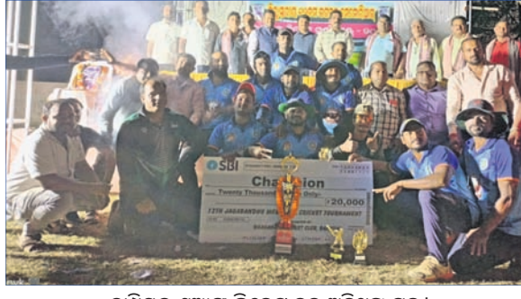
ଚାମ୍ପିୟନ ଶୁଆଙ୍ଗ କ୍ରିକେଟ ଦଳ ଅତିଥିଙ୍କ ସହ।

ପୁରୁଣା ଭୁବନେଶ୍ୱର, ୧୨୨୨ (ଡି.ଏନ.ଏ.) କିଛି ଦିନ ପୂର୍ବରୁ ଶୁଆଙ୍ଗ କ୍ରିକେଟ କ୍ଲବ୍ ୧୨ତମ ଜଗତସ୍ତୁ ସ୍ତରୀୟ ଉଦ୍‌ଯାପିତ ହୋଇଯାଇଛି। ପ୍ରତିଯୋଗିତାର ଫାଇନାଲ ମ୍ୟାଚ ଶୁଆଙ୍ଗ କ୍ରିକେଟ କ୍ଲବ୍, ଭୁବନେଶ୍ୱର ଓ ମା' ଜଗତସ୍ତୁ କ୍ରିକେଟ କ୍ଲବ୍, ବାଲୁଆଳ ମଧ୍ୟରେ ହୋଇଥିଲା।