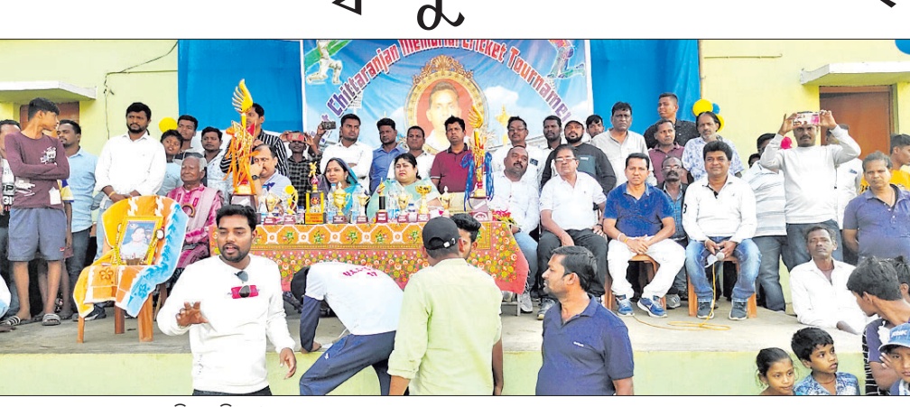
ଉଦ୍ଘାଟନା ସଭାରେ ଉପସ୍ଥିତ ଅତିଥି ଓ ଅନ୍ୟମାନେ

ଧରାକୋଟ ମିନି କ୍ରିକେଟରେ ଦୀର୍ଘ ୧୫ବର୍ଷ ଧରି ଚାଲିଥିବା ବିଭାଜନ ମେମୋରିଆଲ ଟ୍ରଫିର ଫାଇନାଲ ବିଜୟର ଖେଳ ପ୍ରକ୍ଷମରାଜ ଗ୍ୟାଲେକ୍ସି ଲଲେଭେନ ଓ ଚେର ମାରିଆ ତେଲିସିୟସ୍ କ୍ରିକେଟ୍ କ୍ଲବ ମଧ୍ୟରେ ଅନୁଷ୍ଠିତ ହୋଇଥିଲା।