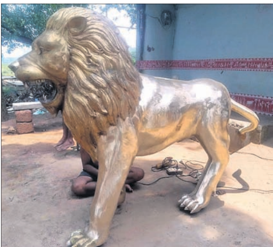
କାରିଗରମାନଙ୍କ ଦ୍ୱାରା ନିର୍ମିତ ରାଧାକୃଷ୍ଣ ଓ ସିଂହ ମୂର୍ତ୍ତି ।