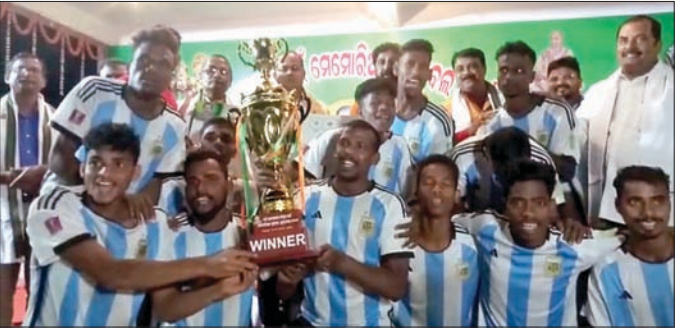
ଚାମ୍ପିୟନ ଭୁବନେଶ୍ୱର ଦଳକୁ ଅତିଥିମାନେ ଟ୍ରଫି ପ୍ରଦାନ କରୁଛନ୍ତି

ଖଣ୍ଡପଡ଼ା ସ୍କୋର୍ସ ଏକାଡେମୀ ଆନୁକୁଲ୍ୟରେ ସ୍ଥାନୀୟ ମଧୁବନ ମିନି କ୍ରିକେଟ ପରିସରରେ ଚାଲିଥିବା ୪ର୍ଥ ରାଜ୍ୟସ୍ତରୀୟ ମହତ୍ତ୍ୱ ସ୍ୱାଇଁ ମେମୋରିଆଲ କ୍ୟୁପ୍ ଫୁଟବଲ ଟୁର୍ନାମେଣ୍ଟର ଉଦ୍ଘାଟନା ପାଇଁ ମ୍ୟାଚ୍ ଅନୁଷ୍ଠିତ ହୋଇଯାଇଛି।