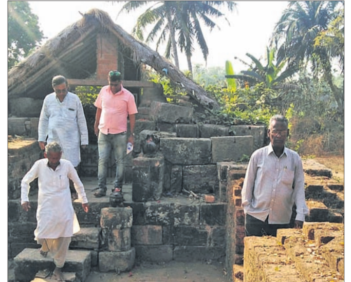
ଗୋଲରା ଗଡ଼ର ଉନ୍ମତ୍ତକାଣ୍ଡ ଦେବା ତିତ୍ତୋପ୍ତାଙ୍କ ଆଧ୍ୟାନୁସାରେ ।