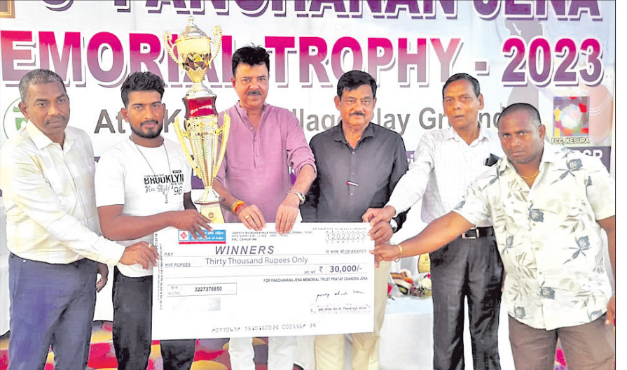
ସୋଲାର କ୍ରିକେଟ କ୍ଲବର ଅଧିନାୟକ ଅତିଥିଙ୍କଠାରୁ ପୁରସ୍କାର ଗ୍ରହଣ କରୁଛନ୍ତି ।