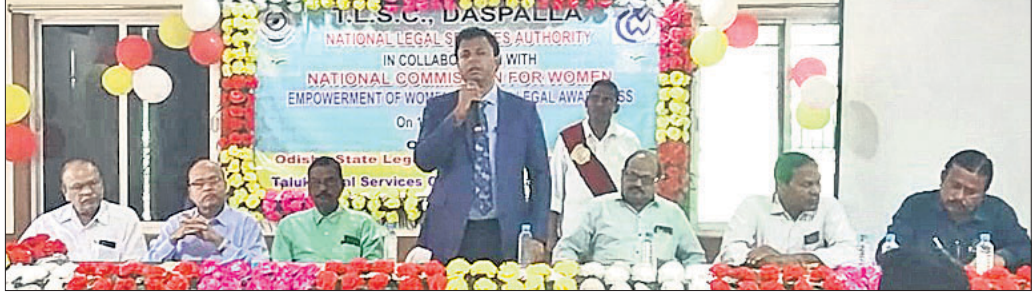
ଆଇନ ସଚେତନତା ଶିବିରରେ ଉପସ୍ଥିତ ଅତିଥିମାନେ।