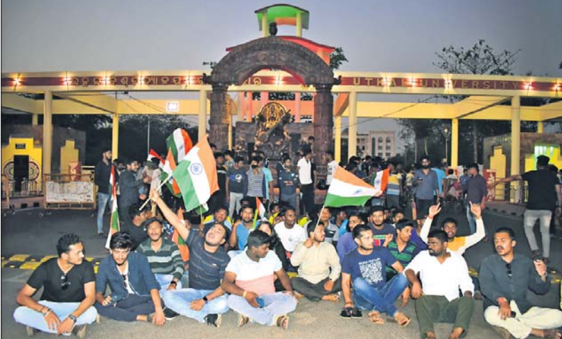
ଉତ୍କଳ ବିଶ୍ୱବିଦ୍ୟାଳୟ ମୁଖ୍ୟ ଫାଟକ ସମ୍ମୁଖରେ ଏକିଭିପି ସଦସ୍ୟମାନେ ଦେଇଥିବା ଧାରଣା ।