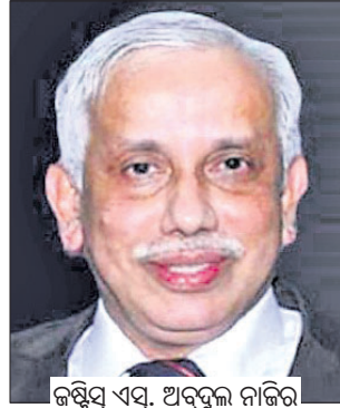
ଜଷ୍ଟିସ୍ ଏସ୍. ଅବ୍ଦୁଲ ନାଜିର