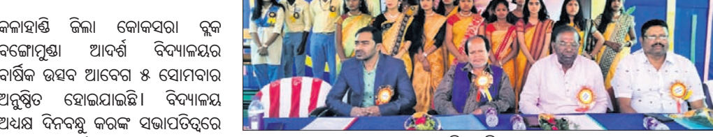
ଉତ୍ସବରେ ଉପସ୍ଥିତ ଅତିଥି ଓ ଛାତ୍ରଛାତ୍ରୀ।