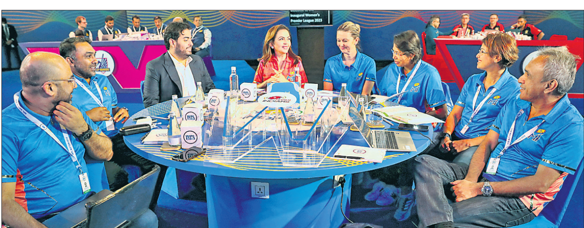
ପୁରୀ ଇଣ୍ଡିଆ ଲିଗ୍ ଓ ଓମେନ୍ସ୍ ପ୍ରିମିୟର ଲିଗ୍ ଖେଳାଳି ନିର୍ବାହୀ ଅବସରରେ ଅଧିକାରୀଙ୍କ ସହ ପୁରୀ ଇଣ୍ଡିଆ ମାଲିକାଣୀ ନାତା ଅଧ୍ୟକ୍ଷା, ଆକାଶ ଅଧ୍ୟକ୍ଷା ଓ ମାହେଶ୍ୱରୀ ଜୟବର୍ଦ୍ଧନେ।