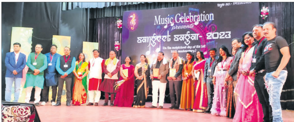
ବାର୍ଷିକୋତ୍ସବରେ ମହାଧ୍ୟାନ ଅତିଥି ଏବଂ ଅନ୍ୟମାନେ।