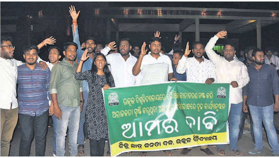
କେନ୍ଦ୍ରୀୟ ପ୍ରଫେସରଙ୍କୁ ମାଡ଼ ପ୍ରତିବାଦରେ ଉତ୍କଳ ବିଶ୍ୱବିଦ୍ୟାଳୟ ମୁଖ୍ୟ ଫାଟକ ସମ୍ମୁଖରେ ଛାତ୍ର କଂଗ୍ରେସ ଓ ବିଜୁ ଛାତ୍ର ଜନତା ଦଳ ପକ୍ଷରୁ ବିକ୍ଷୋଭ ପ୍ରଦର୍ଶନ।

ଉତ୍କଳ ବିଶ୍ୱବିଦ୍ୟାଳୟ ପିଲି କାଉନସିଲ୍ ହଲରେ ସିଟିଜେନ୍ସ ଫୋରମ୍ ପକ୍ଷରୁ ସେମିନାର ଚାଲିଥିବାବେଳେ ଅଖିଳ ଭାରତୀୟ ବିଦ୍ୟାର୍ଥୀ ପରିଷଦ (ଏବିଜିପି)ର ସଦସ୍ୟମାନେ କେନ୍ଦ୍ରୀୟ ପ୍ରଫେସର, କର୍ମକର୍ତ୍ତା ଓ ଅନ୍ୟ ଅତିଥିଙ୍କୁ ଚାଲିଥିବାକରି ମାଡ଼ ମାରିବା ଘଟଣାରେ କମିଶନରେଟ ପୋଲିସ ପକ୍ଷରୁ କାର୍ଯ୍ୟାନୁଷ୍ଠାନ ହୋଇଛି।