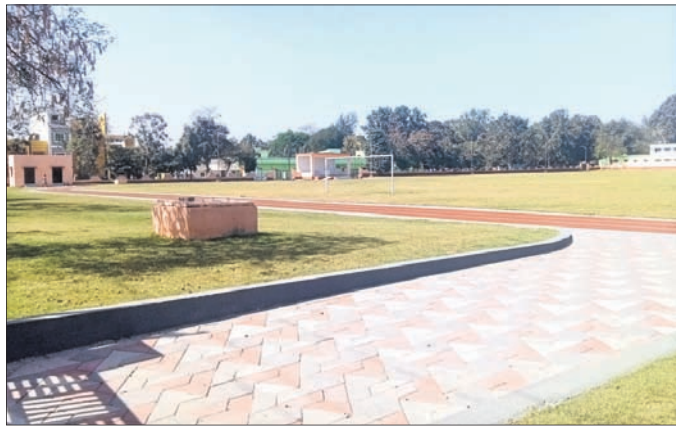
ଉଦ୍‌ଦିନଗର ପରେଡ଼ ଗ୍ରାଉଣ୍ଡ।

ରାଉରକେଲା ଉଦ୍‌ଦିନଗର ସ୍ଥିତ ପରେଡ଼ ଗ୍ରାଉଣ୍ଡ ଖେଳ ପଡ଼ିଆକୁ ବନ୍ଦ ରଖାଯାଇଥିବାରୁ ସ୍ଥାନୀୟ ଶିକ୍ଷାନୁଷ୍ଠାନ ଏବଂ କ୍ରୀଡାବିତ୍ତ ଖେଳକୁଦରେ ଅସୁବିଧା ହେଉଛି।