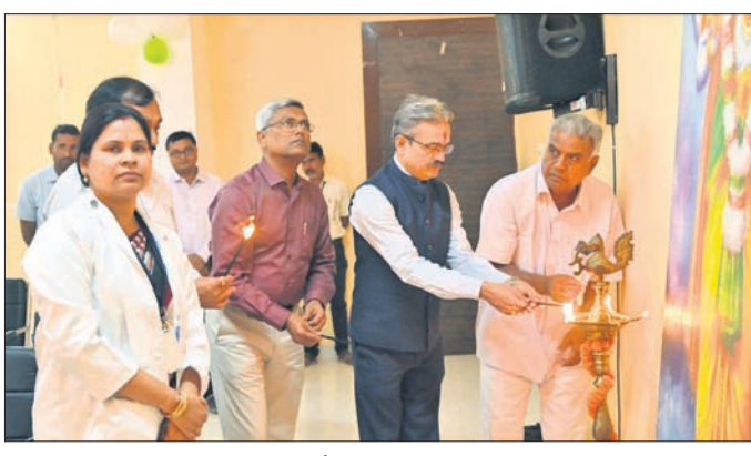
ଅତିଥିମାନେ ପ୍ରସାଦ ପ୍ରଦାନ କରି କର୍ମଶାଳାକୁ ଉଦ୍ଘାଟନ କରୁଛନ୍ତି।