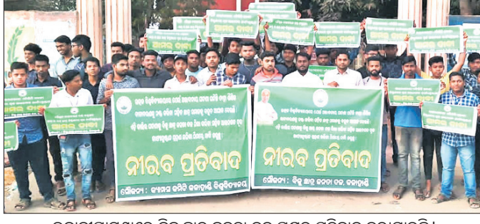
ଭବାନୀପାଟଣାରେ ବିଜୁ ଛାତ୍ର ଜନତା ଦଳ ପକ୍ଷରୁ ପ୍ରତିବାଦ କରାଯାଇଛି।