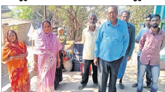
ପାନପୋଷ ଭାଗଲ ବସ୍ତିବାସୀ।

ରାଉରକେଲା ପାନପୋଷ ଭାଗଲ ବସ୍ତିବାସୀଙ୍କୁ ମୌଳିକ ସୁବିଧା ମିଳୁ ନ ଥିବା ଅଭିଯୋଗ ହେଉଛି। ଫଳରେ ସେମାନଙ୍କ ମଧ୍ୟରେ ଅସନ୍ତୋଷ ବଢିବାରେ ଲାଗିଛି।