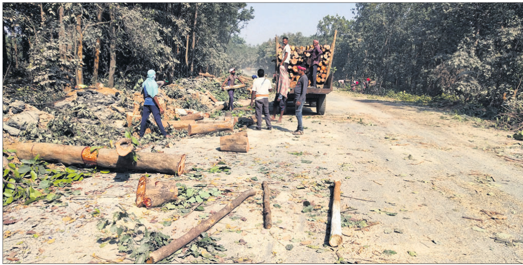
ରାସ୍ତାର ଉଭୟ ପାର୍ଶ୍ୱରେ ଥିବା ଶାଳ ଗଛଗୁଡ଼ିକୁ କାଟି ଟ୍ରକରେ ନିଆଯାଉଛି ।

ସୁବର୍ଣ୍ଣପୁର ଜିଲାର ଲାଲଫଲାଜନ କୁହାଯାଉଥିବା ଅର୍ଜୁନପୁର-ବିନିକା-ରାମପୁର-ତୁଙ୍ଗୁରପାଲି ମେଜର ଡିସ୍ଟ୍ରିକ୍ଟ ରୋଡ୍ (ଏମଡିଆର) ଓସାରିଆ ହେବ। ଅର୍ଜୁନପୁରରୁ ତୁଙ୍ଗୁରପାଲି ୫୪.୨୦୦ କିଲୋମିଟର ବିଶିଷ୍ଟ ଏହି ରାସ୍ତା ପାଇଁ ଦୁଇଟି ପର୍ଯ୍ୟାୟରେ ପ୍ରାୟ ୧୪୫୫ କୋଟି ଟଙ୍କାର ଡେଣ୍ଡର ଆହ୍ୱାନ ହୋଇଛି। ୨ ଆଡିଆ ରାସ୍ତା କାମ ଏବେ ଜୋରସୋରରେ ଚାଲିଛି। ଏଥିପାଇଁ ରାସ୍ତାର ଉଭୟ ପାର୍ଶ୍ୱରେ ଥିବା ୩୧୫୮ ଗଛ କଟାଯିବା ପାଇଁ ଚିହ୍ନଟ କରାଯାଇଛି। କଟା ହେବାକୁ ଥିବା ଶତାଧିକ ଗଛ ବହୁ ବର୍ଷର ପୁରୁଣା। ଏଗୁଡ଼ିକ ରାଜାରାଜୁଆ ଅମଳରୁ ଲାଗା ଯାଇଥିଲା। ଓଡ଼ିଶା ବନ ଉନ୍ନୟନ ନିଗମ ଏବେ ସେହି ଗଛ ଗୁଡ଼ିକୁ ମେସିନ ଦ୍ୱାରା କାଟିବା ଆରମ୍ଭ କରିଛି। ପରେ ଏହି ରାସ୍ତା ୪ ଆଡିଆ ହେବାର ଯୋଜନା ରହିଛି। ଫଳରେ ଏହି ଗୁରୁତ୍ୱପୂର୍ଣ୍ଣ ରାସ୍ତାର ଉଭୟ ପାର୍ଶ୍ୱ ଆଉ କିଛି ଦିନ ପରେ ବୃକ୍ଷ ଶୂନ୍ୟ ହେବ। ଉଭାପ ଆହୁରି ବୃଦ୍ଧି ପାଇବ। ଏହା ଜିଲାର ବୁଦ୍ଧିଜୀବୀ ଓ ପରିବେଶବିତଙ୍କ ଚିନ୍ତା ବଢ଼ାଇଛି। ସୁବର୍ଣ୍ଣପୁର ବନଖଣ୍ଡ ଅନ୍ତର୍ଗତ ସୋନପୁର ବନଖଣ୍ଡ ଅଞ୍ଚଳର ଅର୍ଜୁନପୁରରୁ