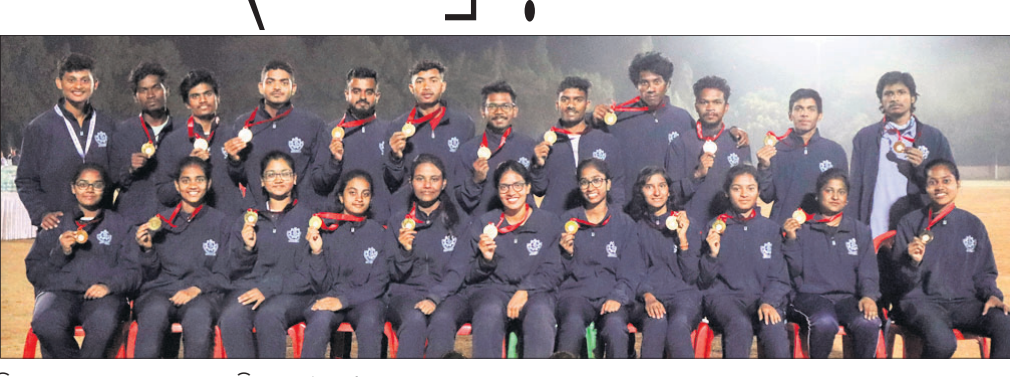
ବିଜେତା ରାଉରକେଲା ଏନ୍‌ଆଇଟିର ଛାତ୍ରାଛାତ୍ରୀ।

ରାଉରକେଲା ସ୍ଥିତ ଜାତୀୟ ପ୍ରଯୁକ୍ତି ପ୍ରତିଷ୍ଠାନ (ଏନ୍‌ଆଇଟି)ରେ ଗତ ୧୦ ତାରିଖଠାରୁ ଚାଲିଥିବା ସର୍ବଭାରତୀୟ ଆନ୍ତଃ ଏନ୍‌ଆଇଟି କ୍ରୀଡା ସମାରୋହ ଯୋଜନାରେ ଶେଷ ହୋଇଛି।