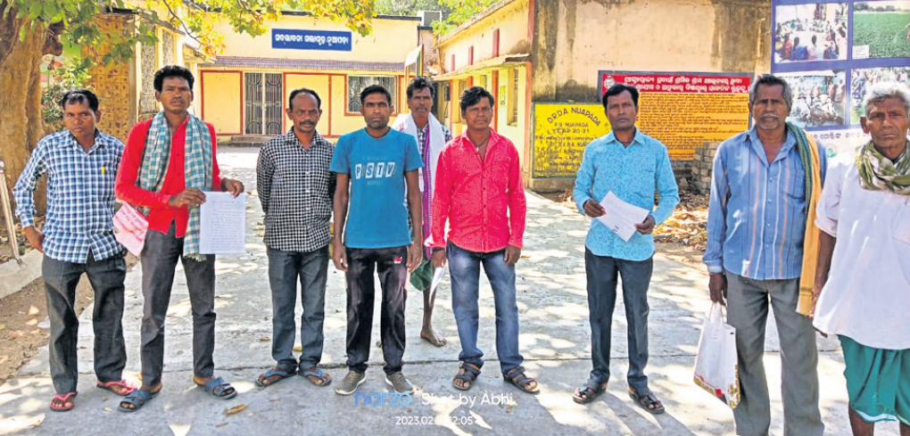
ଜିଲ୍ଲାପାଳଙ୍କଠାରେ ଅଭିଯୋଗ କରିବାକୁ ଆସିଥିବା ଶ୍ରମିକମାନେ।