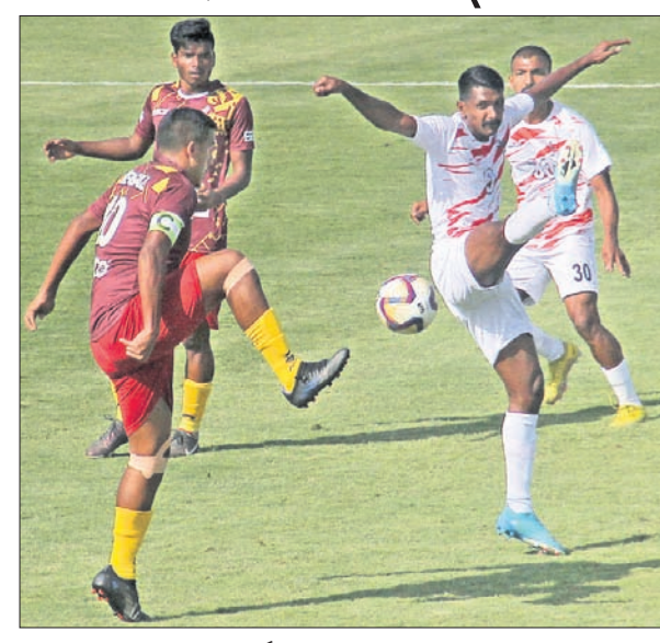
ବେଙ୍ଗାଳ ଓ ସର୍ଭସେସ୍ ମଧ୍ୟରେ ଅନୁଷ୍ଠିତ ମ୍ୟାଚ୍।

ଭୁବନେଶ୍ୱର, ୧୩୧୨ (ସ୍ପୋର୍ଟ୍ସ୍ ଡିଭିଜନ୍) ଭୁବନେଶ୍ୱରରେ ଅନୁଷ୍ଠିତ ସକ୍ରେଡିଟ୍ ଟ୍ରଫିର ଅନ୍ତିମ ପର୍ଯ୍ୟାୟ ଲିଗ୍ ମ୍ୟାଚ୍‌ରେ ବିଜୟୀ ହୋଇଛନ୍ତି ରେଲଓ୍ୱେ, ମେଘାଳୟ ଓ ସର୍ଭସେସ୍। କ୍ୟାପିଟାଲ ପୁଟବଲ ଆରେନାରେ ସକାଳ ୯ଟାରେ ଅନୁଷ୍ଠିତ ମ୍ୟାଚ୍‌ରେ ସର୍ଭସେସ୍