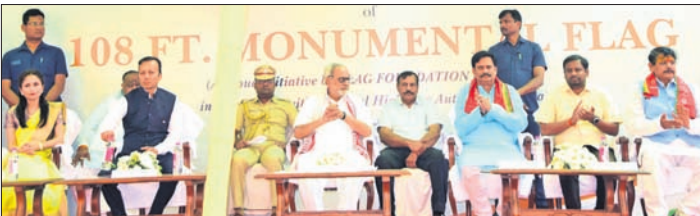
କାର୍ଯ୍ୟକ୍ରମରେ ରାଜ୍ୟପାଳ ପ୍ରଫେସର ରମେଶ ଲାଲ, ଶିଳ୍ପପତି ନବୀନ ଜିଲ୍ଲା ଏବଂ ଅନ୍ୟ ଅତିଥିବୃନ୍ଦ।