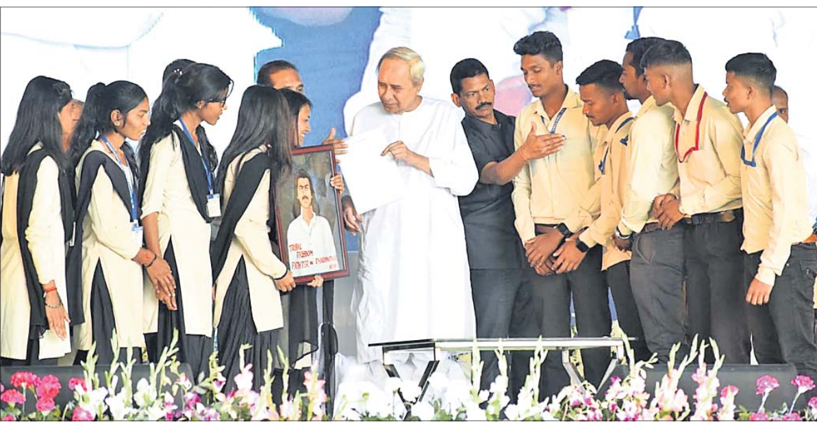
କେନ୍ଦୁଝରସ୍ଥିତ ଧରଣୀଧର ମହାବିଦ୍ୟାଳୟକୁ ବିଶ୍ୱବିଦ୍ୟାଳୟର ମାନ୍ୟତା ପ୍ରଦାନ ଅବସରରେ ସୋମବାର ପୁଖ୍ୟମନ୍ତ୍ରୀ ନବୀନ ପଟ୍ଟନାୟକ ଛାତ୍ରାଛାତ୍ରୀଙ୍କୁ ଅନୁମୋଦନପତ୍ର ଦେଉଛନ୍ତି। (ରିପୋର୍ଟ: ପୃଷ୍ଠା-୩)