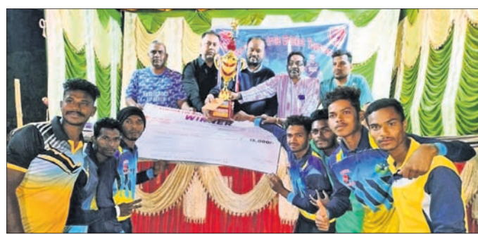
ଅତିଥି ବୃନ୍ଦ ଚାମ୍ପିୟନ ଟିମକୁ ପ୍ରଦାନ କରୁଛନ୍ତି।