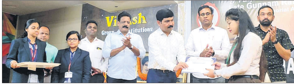
ବଜ୍ରତା ପ୍ରତିଯୋଗିତା କୃତା ପ୍ରତିଯୋଗୀଙ୍କୁ ପୁରସ୍କୃତ କରାଯାଇଛି।