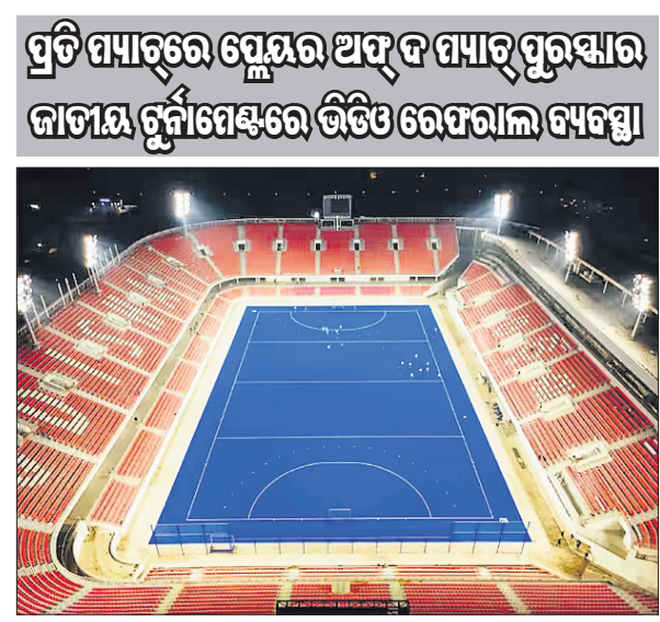
ଭୁବନେଶ୍ୱର, ୧୩୧୨ (ସ୍ପୋର୍ଟ୍ସ୍ ଡିଭିଜନ୍)

ପ୍ରତି ପ୍ୟାଚ୍‌ରେ ପ୍ଲେୟର ଅଫ୍ ଦ ପ୍ୟାଚ୍ ପୁରସ୍କାର ଜାତୀୟ ଚାମ୍ପିୟନଶିପ୍ରେ ଭିତ୍ତି ରେଫରାଲ ବ୍ୟବସ୍ଥା ସେ କହିଛନ୍ତି। ଅନ୍ତର୍ଜାତୀୟସ୍ତରରେ ଖେଳିବା ପୂର୍ବରୁ ଖେଳାଳିମାନଙ୍କୁ ଭିତ୍ତି ରେଫରାଲର ପ୍ରକ୍ରିୟା ସମ୍ପର୍କରେ ଜଣାଇବା ପାଇଁ ଏପରି କରାଯାଇଥିବା ସେ କହିଛନ୍ତି। ଫେବୃଆରୀ ୧୫ରୁ କାଳିକାଠାରେ ଖେଳାଯିବାକୁ ଥିବା ଜାତୀୟ ମହିଳା ଚାମ୍ପିୟନଶିପ୍ରେ ପ୍ରଥମେ ଭିତ୍ତି ରେଫରାଲ ବ୍ୟବସ୍ଥା କରାଯିବ। ଏଣିକି ସମସ୍ତ ବୟସ ବର୍ଗର