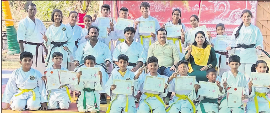
ଶିବିରରେ କୃତ୍ରି ହାସଲ କରି ପ୍ରମାଣପତ୍ର ପାଇଥିବା ଛାତ୍ରଛାତ୍ରୀଗଣ।