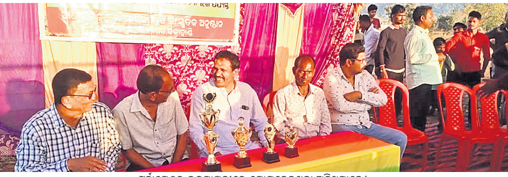
ଚୂନାମେଣ୍ଟର ଉଦ୍ଘାପନୀରେ ଯୋଗଦେଇଥିବା ଅତିଥିମାନେ।