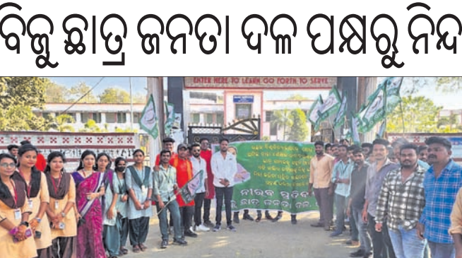
ଛାତ୍ର ସଂଗଠନର କର୍ମକର୍ତ୍ତା।