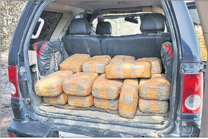
ଗାଡ଼ି ଉତ୍ତରୁ ଜବତ ଗଞ୍ଜେଇ।

ମିଳିଥିବା ସୂଚନା ମୁତାବକ ରବିବାର ବିକସିତ ରାତିରେ ଖୁଣ୍ଟା ନିକଟରେ ପୋଲିସ ପାଟ୍ରୋଲିଂ ଚାଲିଥିଲା। ସେ ସମୟରେ ଓଆର୍ଏସ୍‌ଏସ୍-୧୦୭୦ ନମ୍ବରବିଶିଷ୍ଟ ଏକ କାରୁ ସେହି ରାସ୍ତା ଅତିକ୍ରମ କରୁଥିଲା। ହେଲେ ପୋଲିସ ଟିମ୍‌କୁ ଦେଖି କାରୁ ଉତ୍ତରରେ ଥିବା ଦୁଇଜଣ ଦୁର୍ଭିକ୍ଷ ଗାଡ଼ି ଛାଡ଼ି ଫେରାର ହୋଇଯାଇଥିଲେ। ପୋଲିସ ସହେ