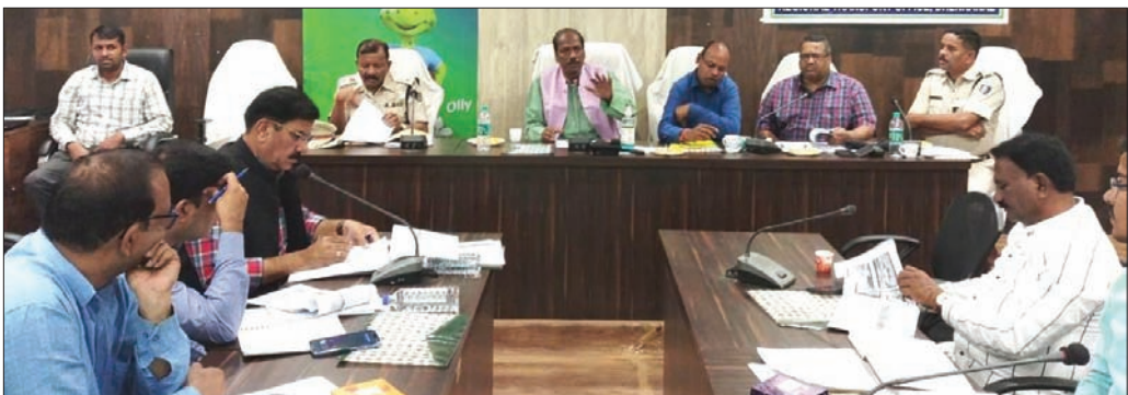
ବୈଠକରେ ଏମ୍‌ପିଙ୍କ ସମେତ ପ୍ରଶାସନିକ ଅଧିକାରୀମାନେ।