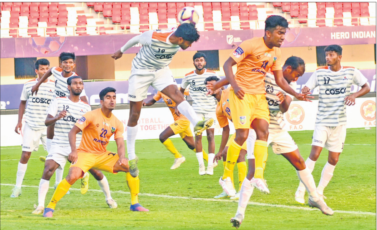
କଳିଙ୍ଗ ଷ୍ଟାଡ଼ିୟମରେ ମଙ୍ଗଳବାର କେରଳ ଓ ମହାରାଷ୍ଟ୍ର ମଧ୍ୟରେ ଅନୁଷ୍ଠିତ ସନ୍ତୋଷ ଟ୍ରଫି ଫୁଟବଲ ମ୍ୟାଚର ଏକ ସଂଘର୍ଷପୂର୍ଣ୍ଣ ମୁହୂର୍ତ୍ତ ।