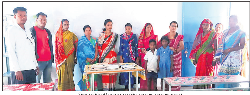
ଶିକ୍ଷା କମିଟି ବୈଠକରେ ଉପସ୍ଥିତ ସଦସ୍ୟା ସଦସ୍ୟମାନେ।

ଅନୁଗୋଳ ଜିଲ୍ଲା କିଶୋରନଗର ରୁକ୍ମିଣୀ ଗ୍ରାମରେ ଉଦ୍ଘାଟନ କରାଯାଇଥିଲା ବିଧାନ ସଭା ପ୍ରତିଷ୍ଠା ଦିନ ପୂର୍ବରୁ ଉଦ୍ଘାଟନ କରି କରାଯାଇଥିଲା। ଏହା ପରେ ଘଟଣାଟି ଘଟିଥିଲା ଯାହା ଫଳରେ ୩ ଛାତ୍ରୀ ଗୁରୁତର ହୋଇଥିଲା। ଘଟଣାଟି ଘଟିଥିଲା ଯାହା ଫଳରେ ୩ ଛାତ୍ରୀ ଗୁରୁତର ହୋଇଥିଲା। ଘଟଣାଟି ଘଟିଥିଲା ଯାହା ଫଳରେ ୩ ଛାତ୍ରୀ ଗୁରୁତର ହୋଇଥିଲା।