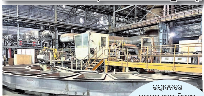
ଉତ୍ପାଦନରେ ସହାୟକ ହେବା ନିମନ୍ତେ ବ୍ୟାୟାମୀୟ ଲାଭ ପାଇବାକୁ ଚାହୁଁଛନ୍ତି ସ୍ୱକାଷ୍ଟି ପ୍ରଶ୍ନବାଚୀ।

୧୦ ବର୍ଷ ହେଲା ଅତଳ ପଢ଼ିଛି ଶହେ କୋଟିର ପ୍ରୋଜେକ୍ଟ