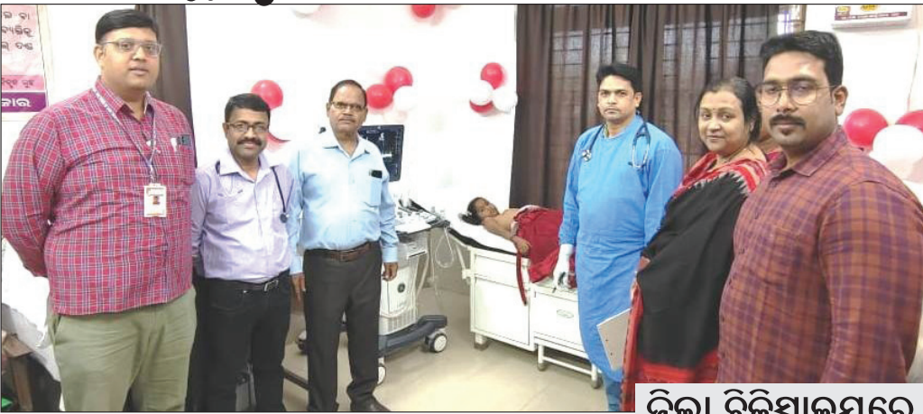
ପେଡ଼ିଆଟ୍ରିକ୍ ଜଙ୍କୋ ପରୀକ୍ଷା ଆରମ୍ଭ ଅବସରରେ ସ୍ୱାସ୍ଥ୍ୟ ବିଭାଗ ଅଧିକାରୀ ଓ ବିଶେଷଜ୍ଞ।