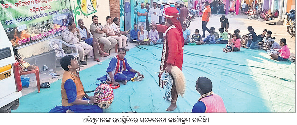
ଅତିଥିମାନଙ୍କ ଉପସ୍ଥିତିରେ ସଚେତନତା କାର୍ଯ୍ୟକ୍ରମ ଚାଲିଛି।

ପାଇଁ କୌଣସି ବିଜ୍ଞାନ ଶିକ୍ଷକ ନ ଥିବାରୁ ଉଦ୍ଘାଟନ କରାଯାଇଥିଲା ବିଧାନ ସଭା ପ୍ରତିଷ୍ଠା ଦିନ ପୂର୍ବରୁ ଉଦ୍ଘାଟନ କରି କରାଯାଇଥିଲା। ଏହା ପରେ ଘଟଣାଟି ଘଟିଥିଲା ଯାହା ଫଳରେ ୩ ଛାତ୍ରୀ ଗୁରୁତର ହୋଇଥିଲା।