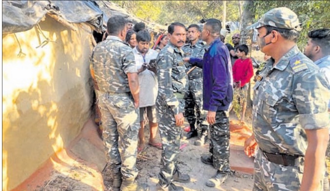
ଉଲ୍ଲେଦ ସମୟରେ ବିରୋଧକାରୀଙ୍କୁ ଚାକ୍ଷୁଷ୍ୟ କରାଯାଇଛି।

ଅନୁଗୋଳ ଅପିସ, ୧୫୧୨ ଅନୁଗୋଳ ସହର ୨୩ ନଂ. ଖର୍ଚ୍ଚରେ ଉଲ୍ଲେଦ ସମୟରେ ଉତ୍ତେଜନା ସୃଷ୍ଟି ହୋଇଥିଲା। ଉଲ୍ଲେଦ ପାଇଁ ପ୍ରଶାସନ ପକ୍ଷରୁ ୨ ଦିନ ସମୟ ପ୍ରଦାନ କରାଯିବା ପରେ ଛୁଟି ଶାନ୍ତ ପଡ଼ିଥିଲା। ପୁରୀ ଅନୁଗୋଳ, ଅନୁଗୋଳ ପୋଲିସ ଠିକାନାରେ ୨୩ ନଂ. ଖର୍ଚ୍ଚରେ ଉଲ୍ଲେଦ ପ୍ରଦାନ କରାଯିବା ପରେ ଉତ୍ତେଜନା ସୃଷ୍ଟି ହୋଇଥିଲା। ଉଲ୍ଲେଦ ପ୍ରଦାନ କରାଯିବା ପରେ ଉତ୍ତେଜନା ସୃଷ୍ଟି ହୋଇଥିଲା। ଉଲ୍ଲେଦ ପ୍ରଦାନ କରାଯିବା ପରେ ଉତ୍ତେଜନା ସୃଷ୍ଟି ହୋଇଥିଲା।