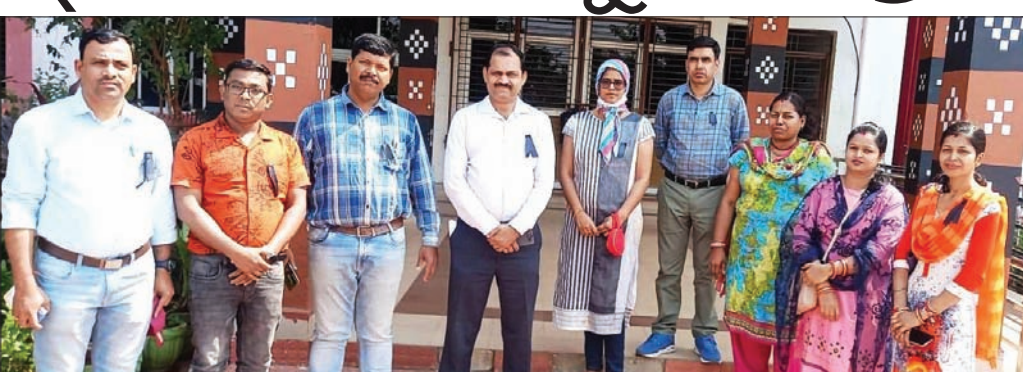
ଆୟୁଷ ଡାକ୍ତରମାନେ କଳାବ୍ୟାଜ୍ ପିନ୍ଧି ପ୍ରତିବାଦ କରୁଛନ୍ତି।