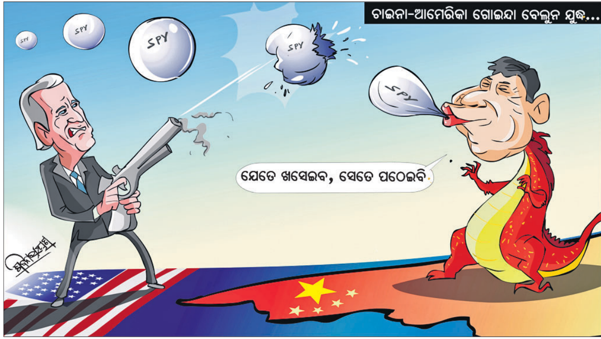
ଚାନ୍ଦନା-ଆମେରିକା ଗୋରାୟା ବେଲୁନ ଯୁଦ୍ଧ...

ନିର୍ବାଚିତ ଜଗଜ୍ଞମାଳି, ପ୍ରସାଦ, ପ୍ରବଚନ ଓ ଅନ୍ୟାନ୍ୟ - ପ୍ରାଣୀ ସାହିତ୍ୟ ପ୍ରତିଷ୍ଠାନ