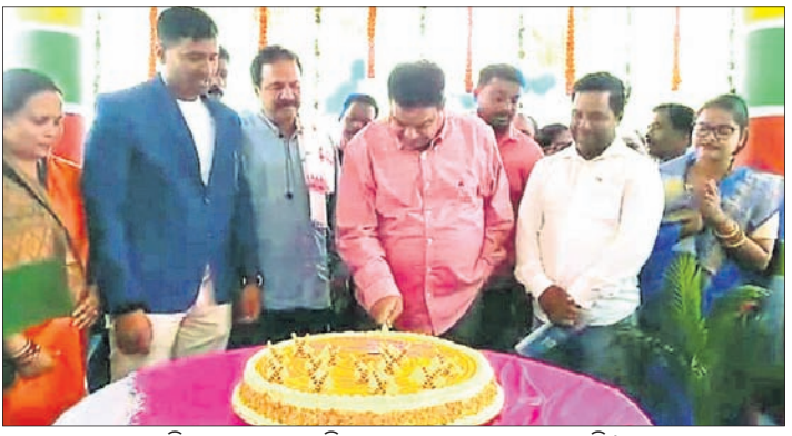
ବିଧାନ ସଭାରେ ଉଦ୍ଘାଟନ କରୁଥିବା ପ୍ଲେ' ସ୍କୁଲ ଲୋକାର୍ପିତ ପଲସ୍ତରା ଖସି ୩ ଛାତ୍ରୀ ଗୁରୁତର ହୋଇଥିଲା।

ଦେଶାନ୍ତର ସହର ରୁକ୍ମିଣୀ ଗ୍ରାମରେ ପଢ଼ାଉଛନ୍ତି ଉତ୍ତମ ଶିକ୍ଷା କର୍ମଚାରୀଙ୍କ ଦ୍ୱାରା ଲୋକାର୍ପିତ ହୋଇଥିଲା ବିଧାନ ସଭା ପ୍ରତିଷ୍ଠା ଦିନ ପୂର୍ବରୁ ଉଦ୍ଘାଟନ କରି କରାଯାଇଥିଲା। ଏହା ପରେ ଘଟଣାଟି ଘଟିଥିଲା ଯାହା ଫଳରେ ୩ ଛାତ୍ରୀ ଗୁରୁତର ହୋଇଥିଲା। ଘଟଣାଟି ଘଟିଥିଲା ଯାହା ଫଳରେ ୩ ଛାତ୍ରୀ ଗୁରୁତର ହୋଇଥିଲା। ଘଟଣାଟି ଘଟିଥିଲା ଯାହା ଫଳରେ ୩ ଛାତ୍ରୀ ଗୁରୁତର ହୋଇଥିଲା।