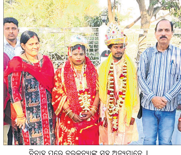
ବିବାହ ପରେ ବରକନ୍ୟାଙ୍କ ସହ ଅନ୍ୟମାନେ ।