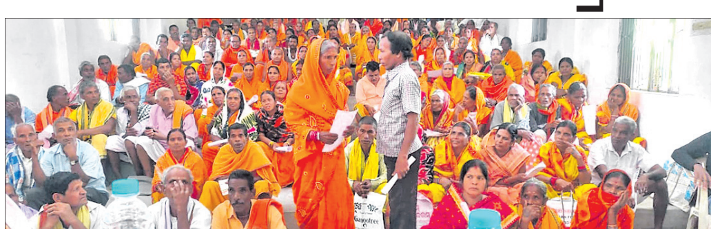
ପ୍ରତିଭା ପ୍ରଦର୍ଶନ ପାଇଁ ଆସିଥିବା କଳାକାରମାନେ।

କଟିପା, ୧୫୧୨ (ଡି.ଏନ.ଏ.) କଟିପା ରୁକ୍ମିଣୀ ଗ୍ରାମରେ ଉଦ୍ଘାଟନ କରାଯାଇଥିଲା ବିଧାନ ସଭା ପ୍ରତିଷ୍ଠା ଦିନ ପୂର୍ବରୁ ଉଦ୍ଘାଟନ କରି କରାଯାଇଥିଲା। ଏହା ପରେ ଘଟଣାଟି ଘଟିଥିଲା ଯାହା ଫଳରେ ୩ ଛାତ୍ରୀ ଗୁରୁତର ହୋଇଥିଲା। ଘଟଣାଟି ଘଟିଥିଲା ଯାହା ଫଳରେ ୩ ଛାତ୍ରୀ ଗୁରୁତର ହୋଇଥିଲା।