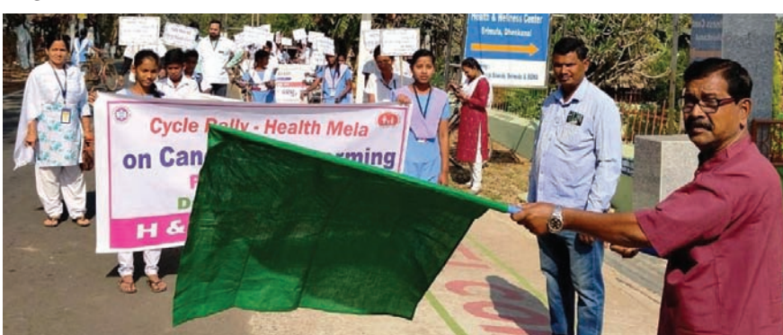
ସଚେତନତା ରାଲିର ଶୁଭାରମ୍ଭ କରାଯାଇଛି।