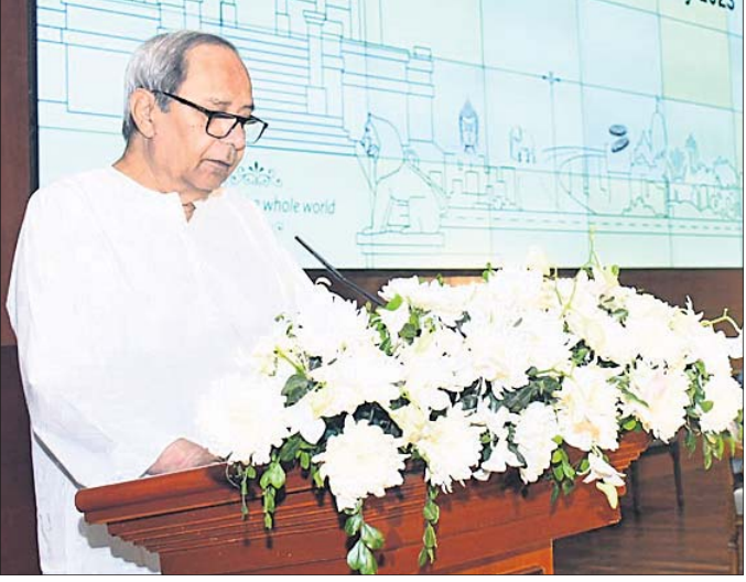
ଲୋକସେବା ଭବନରେ ମଙ୍ଗଳବାର ଅନୁଷ୍ଠିତ ବରିଷ୍ଠ ଅଧିକାରୀ ସମ୍ମିଳନୀରେ ମୁଖ୍ୟମନ୍ତ୍ରୀ ନବୀନ ପଟ୍ଟନାୟକ ଉଦ୍ଘାଟନା କରୁଛନ୍ତି।

କୃଷି, ମିଶନ ଶକ୍ତି, ସ୍ମାର୍ଟଅପ, ଦକ୍ଷତା ବିକାଶ ଉପରେ ଗୁରୁତ୍ୱ