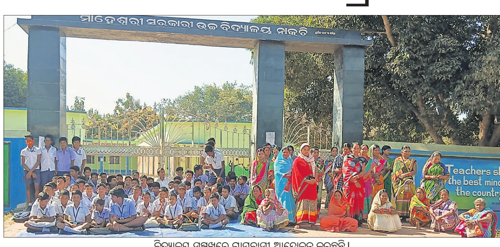
ବିଦ୍ୟାଳୟ ସମ୍ପୂର୍ଣ୍ଣ ଗ୍ରାମବାସୀ ଆୟୋଜନ କରୁଛନ୍ତି।

ଅନୁଗୋଳ ଜିଲ୍ଲା କିଶୋରନଗର ରୁକ୍ମିଣୀ ଗ୍ରାମରେ ଉଦ୍ଘାଟନ କରାଯାଇଥିଲା ବିଧାନ ସଭା ପ୍ରତିଷ୍ଠା ଦିନ ପୂର୍ବରୁ ଉଦ୍ଘାଟନ କରି କରାଯାଇଥିଲା। ଏହା ପରେ ଘଟଣାଟି ଘଟିଥିଲା ଯାହା ଫଳରେ ୩ ଛାତ୍ରୀ ଗୁରୁତର ହୋଇଥିଲା।