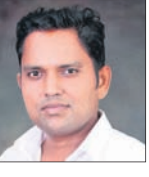
ରିପୋର୍ଟ: ରତନ ନାୟକ, ଡେକାନାଲ

ଏହି ଜଳ ପ୍ରପାତକୁ ଗମନା ଗମନା ପାଇଁ ସରକାର ପିଚୁ ରାସ୍ତା ନିର୍ମାଣ କରିବା ସହ ପିଲବା ପାଣି, ବିଦ୍ୟୁତ୍ ବ୍ୟବସ୍ଥା କରିବାର ଆବଶ୍ୟକତା ରହିଛି।