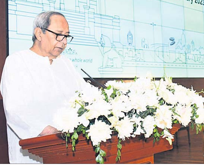
ଲୋକସେବା ଭବନରେ ମଙ୍ଗଳବାର ଅନୁଷ୍ଠିତ ବରିଷ୍ଠ ଅଧିକାରୀ ସମ୍ମିଳନୀରେ ମୁଖ୍ୟମନ୍ତ୍ରୀ ନବୀନ ପଟ୍ଟନାୟକ ଉଦ୍‌ଘାଟନ କରୁଛନ୍ତି।

କୃଷି, ମିଶନ ଶକ୍ତି, ସ୍ମାର୍ଟଅପ, ଦକ୍ଷତା ବିକାଶ ଉପରେ ଗୁରୁତ୍ୱ