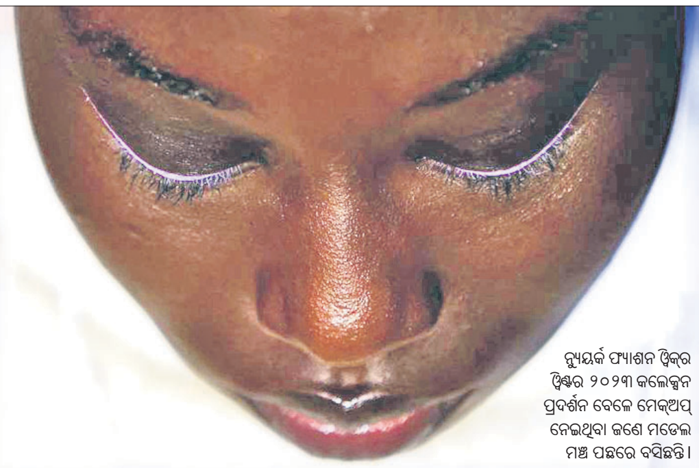
ସୁଧର୍ମକ ଫ୍ୟାଶନ ଫୁକ୍ସର ଫୁକ୍ସର ୨୦୨୩ କଲେକ୍ସନ୍ ପ୍ରଦର୍ଶନ ବେଳେ ମେକଅପ୍ ନେଇଥିବା ଜଣେ ମଡେଲ ମଞ୍ଚ ପଛରେ ବସିଛନ୍ତି।