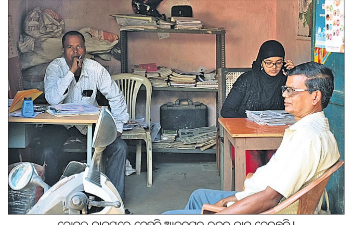
ବୋଲି ଡାକିବାରେ ଦେହୁଡ଼ି ଆନନ୍ଦପୁର ରନର ଡାକ ଦେଉଛନ୍ତି

ଭଦ୍ରକ ଜିଲା ଧାମନଗର ବ୍ଲକ୍ ଅଧୀନ ୧୧ ଗାଁର ଠିକଣା ବଦଳିଲା ବ୍ଲକ୍ ଅଧୀନ ୧୧ ଗାଁର ଠିକଣା ବଦଳିଲା