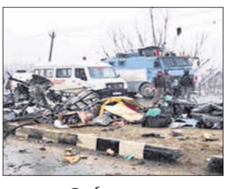
ସ୍ୱତନ୍ତ୍ର ନିର୍ଦ୍ଦେଶକ କେନ୍ଦେରାଲ ୪ ବର୍ଷ ପୂରିଛି। ୨୦୧୯ ଫେବୃଆରୀ ୧୪ରେ ଆତଙ୍କବାଦୀଙ୍କ ବିରୋଧରେ ସିଆର୍ପିଏଫ୍ ଅଧିକାରୀ ଏକ ଗାଡ଼ି ଧ୍ୱଂସ ହେବା ସହ ୪୦ ଯବାନ ଶହାଦ ହୋଇଥିଲେ। ମଙ୍ଗଳବାର ପ୍ରଧାନମନ୍ତ୍ରୀ ନରେନ୍ଦ୍ର ମୋଦି, ସିଆର୍ପିଏଫ୍ ଏବଂ ଅଧିକାରୀମାନେ ଶହାଦ ଯବାନମାନଙ୍କୁ ଶୁଖାଞ୍ଜଳି ଜଣାଇଛନ୍ତି। ବୀର ଯବାନମାନଙ୍କ ବଳିଦାନକୁ ଦେଶ କେବେ ଭୁଲିବ ନାହିଁ। ସେମାନଙ୍କ ସାହସ ଆମକୁ ସଶକ୍ତ ଓ ବିକଶିତ ଭାରତ ଗଠନ ଲାଗି ପ୍ରେରଣା ଯୋଗାଇଦେବା ବୋଲି ପ୍ରଧାନମନ୍ତ୍ରୀ ରୁଜ୍ଜର୍ କରିଛନ୍ତି।

କଟ୍ଟି-କଟ୍ଟୀର ପୁଲୁଖ୍ରାମରେ ଆତଙ୍କବାଦୀ ଆକ୍ରମଣକୁ ମଙ୍ଗଳବାର ୪ ବର୍ଷ ପୂରିଛି। ୨୦୧୯ ଫେବୃଆରୀ ୧୪ରେ ଆତଙ୍କବାଦୀଙ୍କ ବିରୋଧରେ ସିଆର୍ପିଏଫ୍ ଅଧିକାରୀ ଏକ ଗାଡ଼ି ଧ୍ୱଂସ ହେବା ସହ ୪୦ ଯବାନ ଶହାଦ ହୋଇଥିଲେ। ମଙ୍ଗଳବାର ପ୍ରଧାନମନ୍ତ୍ରୀ ନରେନ୍ଦ୍ର ମୋଦି, ସିଆର୍ପିଏଫ୍ ଏବଂ ଅଧିକାରୀମାନେ ଶହାଦ ଯବାନମାନଙ୍କୁ ଶୁଖାଞ୍ଜଳି ଜଣାଇଛନ୍ତି। ବୀର ଯବାନମାନଙ୍କ ବଳିଦାନକୁ ଦେଶ କେବେ ଭୁଲିବ ନାହିଁ। ସେମାନଙ୍କ ସାହସ ଆମକୁ ସଶକ୍ତ ଓ ବିକଶିତ ଭାରତ ଗଠନ ଲାଗି ପ୍ରେରଣା ଯୋଗାଇଦେବା ବୋଲି ପ୍ରଧାନମନ୍ତ୍ରୀ ରୁଜ୍ଜର୍ କରିଛନ୍ତି।