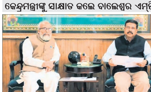
କେନ୍ଦ୍ରମନ୍ତ୍ରୀଙ୍କୁ ସାକ୍ଷାତ କଲେ ବାଲେଶ୍ୱର ଏମପି