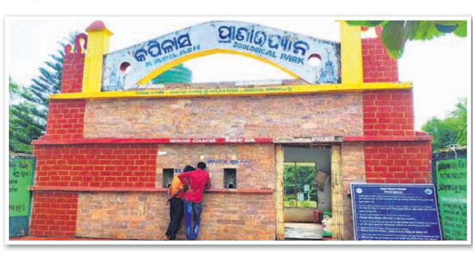
ପ୍ରାଣୀ ଉଦ୍ୟାନକୁ ନୂଆ ପ୍ରକାରିର ପ୍ରାଣୀ ଆସିଲେ ପର୍ଯ୍ୟଟକଙ୍କ ସଂଖ୍ୟା ଆହୁରି ବଢ଼ିବ, ଯାହା ରାଜ୍ୟ ଆଦାୟର ମାଧ୍ୟମ ପାଇଁ ବୋଲି ମତପ୍ରକାଶ ପାଇଛି। ସ୍ୱତନ୍ତ୍ର ଆନ୍ଦୋଳନ, ୧୯୭୯ ଜାନୁଆରୀ ୨୬ରେ ୫ ହେକ୍ଟର ପରିଧିରେ କପିଳାସ ପାଦଦେଶରେ ଡିମରପାର୍କରୁ ଆରମ୍ଭ ହୋଇଥିବା କପିଳାସ କୁରୁ ଐତିହାସିକ ଯାତ୍ରା। ପରବର୍ତ୍ତୀ ସମୟରେ ୨୪.୬୪ ହେକ୍ଟର ଜମିରେ ଏକ ମିନି କୁରୁ ନିର୍ମାଣ କରାଯାଇଥିଲା। ୧୯୯୫ ଏପ୍ରିଲ ୧ରେ ସେଣ୍ଟ୍ରାଲ କୁରୁ ଅଧିକାରୀ ଅଫ୍ ଇଣ୍ଡିଆ ଏହାକୁ ପୁଣିଥରେ ପ୍ରାଣୀ ଉଦ୍ୟାନର ମାନ୍ୟତା ଦେଇଥିଲା। ଏବେ ଏଠାରେ କାର୍ଯ୍ୟକ୍ରମ ଏଲିଫାଣ୍ଟ ରେସ୍‌କ୍ୟୁ ସେଣ୍ଟରରେ ୮ଟି ହାତୀ ଅଛନ୍ତି। ତନ୍ମଧ୍ୟରୁ ଡେକାନାଲ-ଅନୁଗୋଳ ସାମାନ୍ୟତା ମଣିଷ ମାରି ଆତଙ୍କ ସୃଷ୍ଟି କରିଥିବା ଦହାହାତୀ 'ରାଜେଶ' ମୂଳ ପରିବେଶରେ ଛଡ଼ାଯାଇଛି। ବନ ବିଭାଗର ଯତ୍ନରେ ଦାଦି ଉପବାପରେ ଏଥିଲାଗି ଦୃଷ୍ଟି ଆବଦ୍ଧ କରିଛନ୍ତି ରାଜ୍ୟ ସରକାର। ପ୍ରାୟ ୯୦ ଲକ୍ଷ ଟଙ୍କା ବ୍ୟୟରେ ହେବାକୁଥିବା ଉନ୍ନତମୂଳକ କାର୍ଯ୍ୟ ୨୪୭ ଜାବଜକୁ ଅଛନ୍ତି। ସେଥିରୁ ୧୨୪ଟି କୋରସୋରରେ ଆଗେଇ ଚାଲିଛି।

ବଦଳିବ କପିଳାସ ପ୍ରାଣୀ ଉଦ୍ୟାନର କଳେବର। ମାନ୍ୟତା ମିଳିବାର ଦୀର୍ଘ ୨୫ବର୍ଷ ପରେ କୁକୁ ଅଣାଯିବ କଲରାପତରିଆ। ଭୁବନେଶ୍ୱର, କୃଷ୍ଣସାଗର ମୁଖ, ଗୟଳ, କୋକିଶିଆଳି ଭଳି ଅନ୍ୟ ୧୦ ପ୍ରକାରିର ବନ୍ୟପ୍ରାଣୀ ଏହାର ବାଚାବରଣକୁ ସମୃଦ୍ଧ କରିବେ। ଏମାନଙ୍କ ରହିବା ପାଇଁ ନିର୍ମାଣ କରାଯାଇଛି ସ୍ୱତନ୍ତ୍ର ଏନ୍‌କ୍ଲୋଚର। ସୌକର୍ଯ୍ୟକରଣ କାମ ମଧ୍ୟ ଜୋରସୋରରେ ଆଗେଇ ଚାଲିଛି।