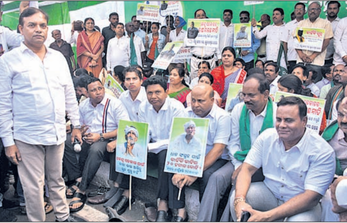
ରାଜଭବନ ଆଗରେ ଉଭୟ ଭାଜପା-ବିକ୍ଷୋଭ ପ୍ରଦର୍ଶନ କରିଛନ୍ତି। ଏହାପୂର୍ବରୁ ବିଜେଡିର ହଲ୍ଲୀବୋଲ ଦେଖିବାକୁ ମିଳିଛି।

ଏକ ଦାବିପତ୍ର ପ୍ରଦାନ କରିଛନ୍ତି। ରାଜଭବନ ଆଗରେ ଧାରଣା ପରେ ବୁଧବାର ରାଜ୍ୟର ସବୁ ପଞ୍ଚାୟତ ଅଧିକାରୀ ଓ ୧୬ରେ ବୁକ୍ ଓ ଜିଲ୍ଲାପାଳଙ୍କ ଅଧିକାରୀ ଆଗରେ ଦଳ ପକ୍ଷରୁ ବିକ୍ଷୋଭ କରାଯିବ।