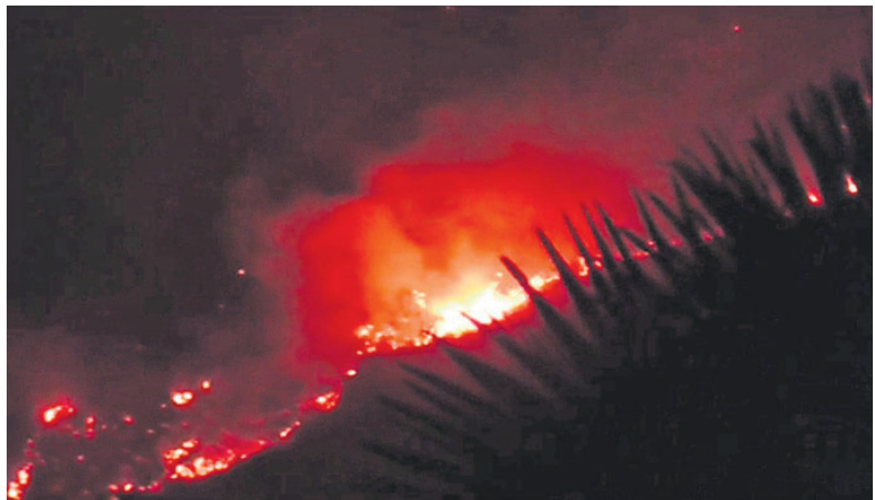
ନିଆଁ ଲାଗି ଶିମିଳିପାଳ ଜଙ୍ଗଲ କଳୁଛି।

ପ୍ରତିବର୍ଷ ନଭେମ୍ବରରୁ ଜୁନ୍ ମଧ୍ୟରେ ଘଟୁଥିବା ବନାଗ୍ନି ଓଡ଼ିଶାର ଜଙ୍ଗଲ ଅବକ୍ଷୟ ପ୍ରମୁଖ କାରଣ ସାଜିଛି। ବିଶେଷକରି ଫେବୃଆରୀରେ ତାତି ବଢ଼ିବା ସଙ୍ଗେ ଜଙ୍ଗଲରେ ନିଆଁ ଲାଗିବା ଘଟଣା ମଧ୍ୟ ବୃଦ୍ଧି ପାଇଛି। ଭାରତୀୟ ବନ ସର୍ବେକ୍ଷଣ (ଏସ୍‌ଏସ୍‌ଆଇ)ର ତଥ୍ୟ ଅନୁଯାୟୀ ଓଡ଼ିଶାରେ ଗତ ଫେବୃଆରୀ ୧୬ ୧୫ ଭିତରେ ୧,୯୩୯ଟି ବନାଗ୍ନି ଚିହ୍ନଟ ହୋଇଛି। ତେବେ ସବୁଠୁ ଚିନ୍ତାଜନକ ହୋଇଛି ଶିମିଳିପାଳ ଅଭୟାରଣ୍ୟରେ ଲାଗିଥିବା ନିଆଁ। ଏହା ୨ କି.ମି. ଅଞ୍ଚଳକୁ ପରିବ୍ୟାପ୍ତ ହୋଇ କୋର୍ ଏରିଆକୁ ମାଡ଼ିଚାଲିଛି। ୨୦୨୧ର ବନାଗ୍ନିରେ ଶିମିଳିପାଳ ଛାରଖାର ହୋଇଯାଇଥିବାବେଳେ ଏବେ ପୁଣି ଲାଗିଥିବା ନିଆଁ ଯୋଗୁ ଜଙ୍ଗଲ ଏବଂ ବନ୍ୟପ୍ରାଣୀ ବିପଦରେ ପଡ଼ିଛନ୍ତି।