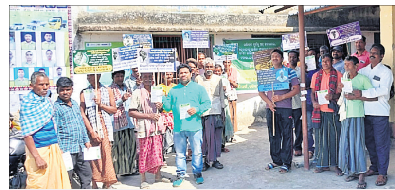
ବିରୋଧରେ ସାମିଲ ହୋଇଥିବା ଲୋକମାନେ।

ପକାୟକଙ୍କ ପରାମର୍ଶ କ୍ରମେ ବ୍ଲକ ଅଧୀନ ବିଭିନ୍ନ ପଞ୍ଚାୟତର ଚେଟା, କର୍ମୀ, ପଞ୍ଚାୟତ ବିଜେଡି ସଭାପତି, ପ୍ରାଥମିକ ଶିକ୍ଷା କୋଟାପ୍ରତିନିଧିମାନେ ସାମିଲ ହୋଇଥିଲେ।