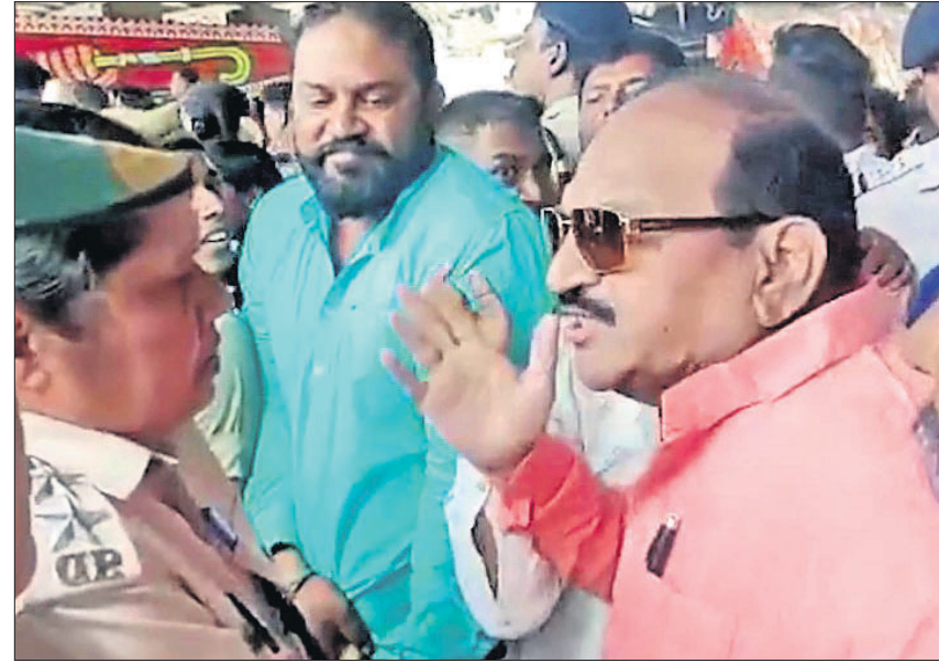
ବିରୋଧୀ ଦଳ ନେତା ହାତ ଉଠାଇଥିବାର ଦୃଶ୍ୟ।