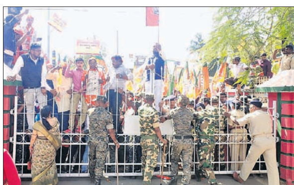
କେନ୍ଦୁଝର ଜିଲ୍ଲାପାଳଙ୍କ କାର୍ଯ୍ୟାଳୟ ପାଖରେ ଉପସ୍ଥିତ ଭାଙ୍ଗି ଦେବା ପାଇଁ ପ୍ରସ୍ତାବ ଦେଇଛନ୍ତି ବିଜେଡିର ନେତାମାନେ।

ପ୍ରଶ୍ନ କରୁଛନ୍ତି। ରାଜ୍ୟରେ ବିଜେଡିର ଉପସ୍ଥିତି ଉପରେ ବିଜେଡିର ନେତାମାନେ ପ୍ରସ୍ତାବ ଦେଇଛନ୍ତି।