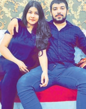
କଥା ହେଉଥିବାବେଳେ ସେମାନଙ୍କ ମଧ୍ୟରେ ମୁକ୍ତିଚର୍ଚ୍ଚା ହୋଇଥିଲା।