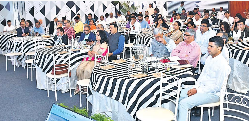
କୋଣାର୍କ ଇକୋ-ରିଟ୍ରିଭାରେ ବୁଧବାର ଅନୁଷ୍ଠିତ ବରିଷ୍ଠ ଅଧିକାରୀ ସମ୍ମିଳନୀରେ ଉପସ୍ଥିତ ଅଧିକାରୀମାନେ।

ଯୋଜନାକୁ ଆହୁରି ମଜବୁତ କରିବା ସକାଶେ ଆଜ୍ଞାପତ୍ର ଜଳ ପରିବହନକୁ ଏହି ଯୋଜନାରେ ସାମିଲ କରାଯାଇଛି। ଓଡ଼ିଶା ରାଜ୍ୟ ସଡ଼ିକ ପରିବହନ ନିଗମକୁ ବ୍ୟବସାୟିକ ଦୃଷ୍ଟିରୁ ଲାଭ ପ୍ରଦାନ କରୁଥିବା ମାର୍ଗଗୁଡ଼ିକରେ ବସ୍ ଚଳାଚଳ କରିବାକୁ ପ୍ରୋତ୍ସାହିତ କରାଯାଇଛି। ଏଥିସହିତ ସହର ପରିବହନ ବ୍ୟବସ୍ଥାରେ ଦ୍ୱିତୀୟ ଶ୍ରେଣୀ ସହରଗୁଡ଼ିକୁ ସାମିଲ କରାଯାଇଛି। ଯାନବାହନଗୁଡ଼ିକର ସମୟଭିତ୍ତିକ ସ୍ଥାନଗୁଡ଼ିକୁ ପୃଷ୍ଠା-୨