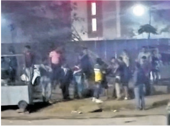
ସିପିଲି ପୁଲିସରେ କବଚ ହୋଇଥିବା ଆକ୍ରମଣ ସମୟର ଦୃଶ୍ୟ।

ଭୁବନେଶ୍ୱର ରେଳ ଷ୍ଟେଶନ ଅଞ୍ଚଳରେ ନିଶା କାରବାର ବଢ଼ିବାରେ ଲାଗିଛି। ଅନ୍ଧାଧୁଆ ଘ୍ନାନର ସୁଯୋଗ ନେଇ ଅପରାଧୀ ଯୁବକମାନେ ଅପରାଧ ଘଟାଇଛନ୍ତି। କମିଶନରେଟ ପୋଲିସ ପକ୍ଷରୁ ବିଳମ୍ବିତ ରାତିରେ ସେଠାରେ ଠିକ୍ ଭାବେ ପେଟ୍ରୋଲିଂ ହେଉ ନ ଥିବାରୁ ମା'ମଲା ପାଇକଆଖଡ଼ାକୁ ସମ୍ମାନିତ କରାଯାଇଥିଲା। ଶେଷରେ ମହିଳାମାନେ ପାଇକ ଆଖଡ଼ା ପ୍ରଦର୍ଶନ କରିଥିଲେ।