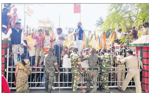
କେନ୍ଦୁଝର ଜିଲ୍ଲାପାଳଙ୍କ କାର୍ଯ୍ୟାଳୟ ଫାଟକ ଉପରେ ଭାଜପା କର୍ମୀ ଚଢ଼ୁଛନ୍ତି।