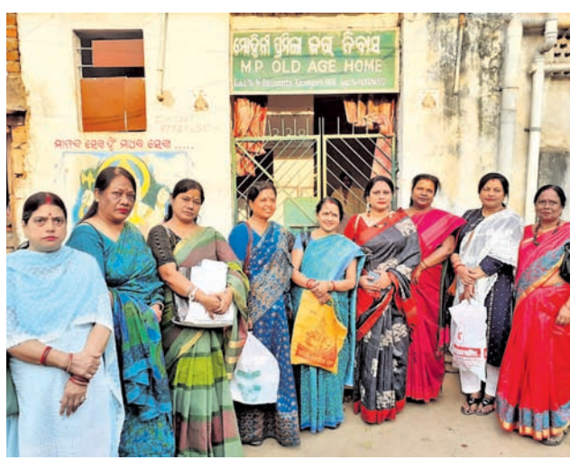
ଲକ୍ଷ୍ମୀସାଗର ସରୋଷବିହାରସ୍ଥିତ ମହିଳା ସଙ୍ଗଠନ 'ସମ୍ପୂର୍ଣ୍ଣା'ର ସଦସ୍ୟମାନେ ମାତୃପିତୃ ପୂଜନ ବିବସରେ ଉତ୍ସୁକଗତ ବାଲିଆପଡ଼ାସ୍ଥିତ ମୋହିନୀ ପ୍ରମିଳା ଜରାନିବାସରେ ଅନ୍ତେବାସୀଙ୍କୁ ଖାଦ୍ୟ ଏବଂ ବସ୍ତ୍ର ପ୍ରଦାନ କରିବା ଅବସରରେ।