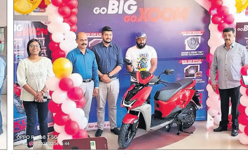
ହିରୋ ମୋଟୋକର୍ପର ସାକ୍ଷିପ୍ରାପ୍ତ କଟକ ସହରର ଡିଏମ୍ ପ୍ରମୁଖ ଡିଲର ଯଥା କେଏମ୍‌ଏଲ୍ ଅଗୋମୋବାଇଲ୍, ସନି ମୋଟର୍ସ ଏବଂ ଏସେନ ଅଗୋମୋବାଇଲ୍ ପରିସରରେ ହିରୋ ଜୁମ୍ ଅନାବରଣ ହୋଇଯାଇଛି।