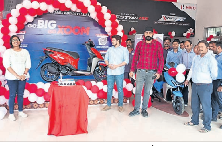
ହିରୋ ମୋଟୋକର୍ପର ସାକ୍ଷିପ୍ରାପ୍ତ କଟକ ସହରର ଡିଏମ୍ ପ୍ରମୁଖ ଡିଲର ଯଥା କେଏମ୍‌ଏଲ୍ ଅଗୋମୋବାଇଲ୍, ସନି ମୋଟର୍ସ ଏବଂ ଏସେନ ଅଗୋମୋବାଇଲ୍ ପରିସରରେ ହିରୋ ଜୁମ୍ ଅନାବରଣ ହୋଇଯାଇଛି।