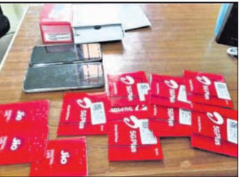
କରିଥିବାକୁ ଅଭିଯୁକ୍ତ କଥାକୁ ବିଶ୍ୱାସ କରି ସୁପ୍ରଭାତଙ୍କ କହିବା ମୁତାବକ ସରକାର କୁମାରଙ୍କ ନାମରେ ଥିବା

୮୮୭୩୦୭୭୦୭୮ ନମ୍ବରକୁ ଫୋନ୍-ପେ ମାଧ୍ୟମରେ ଭୁକଟି କିଛିରେ ୧ ଲକ୍ଷ ଟଙ୍କା ପଠାଇଥିଲେ। ଏହାପରେ ସେ ବ୍ୟାଙ୍କ ଯାଇ କାଣିବାକୁ ପାଇଥିଲେ ଯେ ତାଙ୍କୁ ଫୋନ୍ କରିଥିବା ବ୍ୟକ୍ତି ଜଣକ କୌଣସି ବ୍ୟାଙ୍କ ଅଧିକାରୀ ନୁହନ୍ତି। ତେଣୁ ସେ ଠକେଇର ଶିକାର ହେବା କାଣିବା ପରେ ସାଇବର ଥାନାରେ ଏନେଇ ଅଭିଯୋଗ କରିଥିଲେ। ଅଭିଯୋଗକୁ ଭିତ୍ତି କରି ସାଇବର ଥାନା ପୋଲିସ୍ ତଦନ୍ତ କରି ପୁରୀରୁ ୨ ଅଭିଯୁକ୍ତଙ୍କୁ ଗିରଫ କରିବାରେ ସକ୍ଷମ ହୋଇଥିଲା।