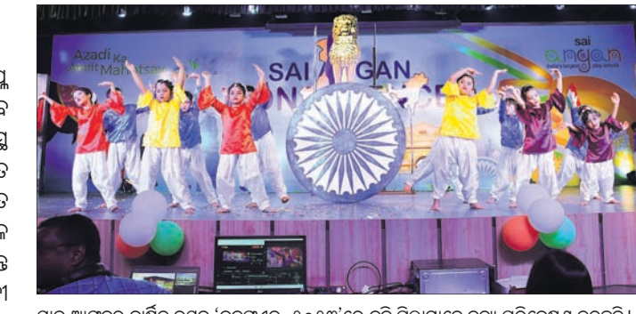
ସାଇ ଆଜ୍ଞାନୁର ବାର୍ଷିକ ଉତ୍ସବ 'କନଫୁଏନ୍ସ-୨୦୨୩'ରେ କୁଟି ପିଲାମାନେ ନୃତ୍ୟ ପରିବେଷଣ କରୁଛନ୍ତି। ରାଷ୍ଟ୍ର ଗଠନରେ ବଳିଦାନ ଦେଇଥିଲେ ତାହା ଉପରେ କାର୍ଯ୍ୟକ୍ରମ ପ୍ରସ୍ତୁତ କରାଯାଇଥିଲା। ଏହି ଅବସରରେ ସାଇ ଇଣ୍ଟରନାଶନାଲର ଚେୟାରମ୍ୟାନ୍

ସାଇ ଇଣ୍ଟରନାଶନାଲ ସ୍କୁଲର ଷ୍ଟୁଡେଣ୍ଟସ୍ ସାଇ ଆଜ୍ଞାନୁର ବାର୍ଷିକ ଉତ୍ସବ 'କନଫୁଏନ୍ସ-୨୦୨୩' ସ୍କୁଲର ଇନ୍ଦ୍ରପ୍ରସ୍ଥ ଅତିବୈଷୟିକ ପରିସରରେ ପାଳିତ ହୋଇଯାଇଛି। ରୁପସାର ଉତ୍ସାଦିତ ଏହି ଉତ୍ସବ ୩ ଦିନ ଧରି ଚାଲିଥିବାବେଳେ ଏଥିରେ ପ୍ରେତ୍ତପୁସ୍ତୁ କ୍ଲାସ୍-୩ ପର୍ଯ୍ୟନ୍ତ ଛାତ୍ରୀଛାତ୍ର ଭାଗ ନେଇଥିଲେ। ଆଜ୍ଞାନୁ କା ଅମୃତ ମହୋତ୍ସବ ଉପରେ ବିଭିନ୍ନ ପ୍ରକାର ଦେଶାତ୍ମବୋଧକ ସାଂସ୍କୃତିକ କାର୍ଯ୍ୟକ୍ରମ ଆୟୋଜନ କରାଯାଇଥିଲା। ମହାପୁସ୍ତୁ ଓ ଜନନେତାମାନେ କିପରି ଭାରତବର୍ଷକୁ ସ୍ୱାଧୀନତା ଓ ସ୍ୱତନ୍ତ୍ର