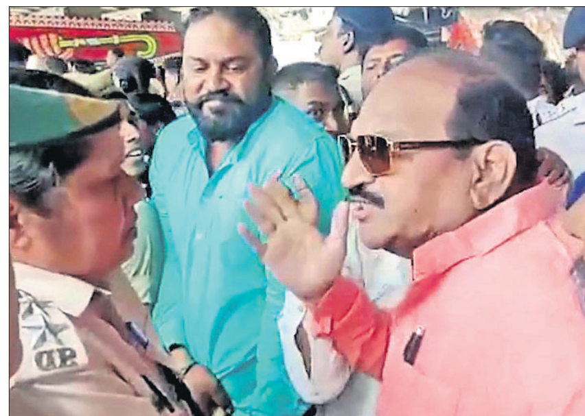
ବିରୋଧୀ ଦଳ ନେତା ହାତ ଉଠାଇଥିବାର ଦୃଶ୍ୟ।