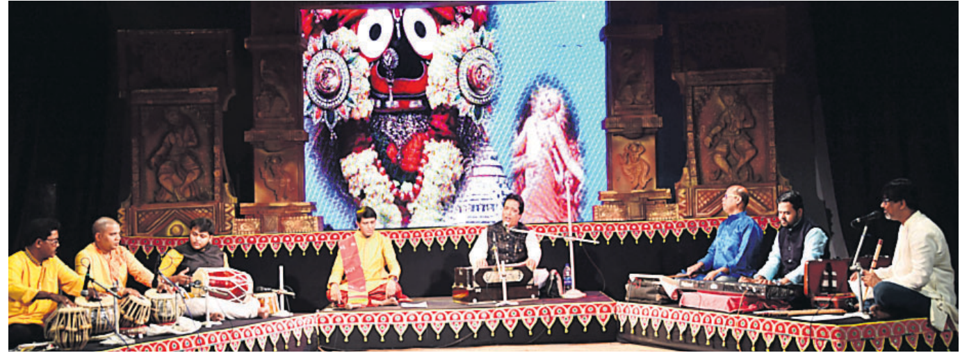
ଓଡ଼ିଆ ଭାଷା, ସାହିତ୍ୟ ଓ ସଂସ୍କୃତି ବିଭାଗ ଆନୁକୁଲ୍ୟରେ ଉତ୍କଳ ସଙ୍ଗୀତ ମହାବିଦ୍ୟାଳୟ ଦ୍ୱାରା ବୁଧବାର ମହାବିଦ୍ୟାଳୟ ପ୍ରେକ୍ଷାଳୟରେ ଆୟୋଜିତ ୨୦୨୨-୨୩ ଶିକ୍ଷାବର୍ଷର ଅନ୍ତିମ ସାଂସ୍କୃତିକ କାର୍ଯ୍ୟକ୍ରମ 'ସୁଗମ ସଙ୍ଗୀତ'ରେ କଣ୍ଠଶିଳ୍ପୀ ଓ ବାଦ୍ୟଶିଳ୍ପୀମାନେ।