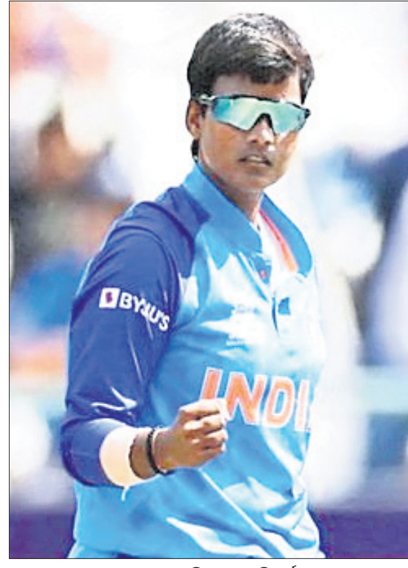
ଫ୍ରେଣ୍ଡ୍‌ସ୍‌ଫିଲ୍ଡରେ ଟି୨୦ ବିଶ୍ୱକପରେ ଭାରତର କ୍ରମାଗତ ବିଜୟ।