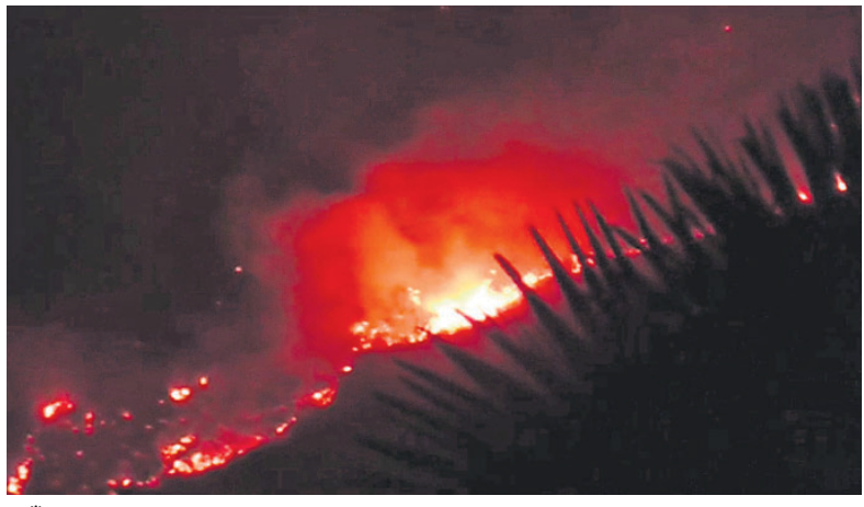
ନିଆଁ ଲାଗି ଶିମିଳିପାଳ ଜଙ୍ଗଲ କଳୁଛି।

ପ୍ରତିବର୍ଷ ନଭେମ୍ବରରୁ ଜୁନ୍ ମଧ୍ୟରେ ଘଟୁଥିବା ବନାଗ୍ନି ଓଡ଼ିଶାର ଜଙ୍ଗଲ ଅବକ୍ଷୟ ପ୍ରମୁଖ କାରଣ ସାଜିଛି। ବିଶେଷକରି ଫେବୃଆରୀରେ ତାତି ବଢ଼ିବା ସାଙ୍ଗକୁ ଜଙ୍ଗଲରେ ନିଆଁ ଲାଗିବା ଘଟଣା ମଧ୍ୟ ବୃଦ୍ଧି ପାଇଛି। ଭାରତୀୟ ବନ ସର୍ବେକ୍ଷଣ (ଏସ୍‌ଏସ୍‌ଆଇ)ର ତଥ୍ୟ ଅନୁଯାୟୀ ଓଡ଼ିଶାରେ ଗତ ଫେବୃଆରୀ ୧୬ ୧୫ ଭିତରେ ୧,୯୩୯ଟି ବନାଗ୍ନି ଚିହ୍ନଟ ହୋଇଛି। ତେବେ ସବୁଠୁ ଚିନ୍ତାଜନକ ହୋଇଛି ଶିମିଳିପାଳ ଅଭୟାରଣ୍ୟରେ ଲାଗିଥିବା ନିଆଁ। ଏହା ୨ କି.ମି. ଅଞ୍ଚଳକୁ ପରିବ୍ୟାପ୍ତ ହୋଇ କୋର୍ ଏରିଆକୁ ମାଡ଼ିଚାଲିଛି। ୨୦୨୧ର ବନାଗ୍ନିରେ ଶିମିଳିପାଳ ଛାରଖାର ହୋଇଯାଇଥିବାବେଳେ ଏବେ ପୁଣି ଲାଗିଥିବା ନିଆଁ ଯୋଗୁ ଜଙ୍ଗଲ ଏବଂ ବନ୍ୟପ୍ରାଣୀ ବିପଦରେ ପଡ଼ିଛନ୍ତି।