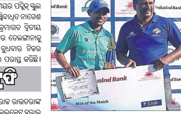
ଓଡ଼ିଶା କ୍ରମାଗତ ଦ୍ୱିତୀୟ ବିଜୟ ହାସଲ କରିଛି।

ରାଜଗ୍ଲାନର ଆଜ୍ଞାପତ୍ରରେ ଲରେଟ୍ ମେୟର ପଲିଟିକ୍ସ ଗ୍ରାଉଣ୍ଡରେ ଚାଲିଥିବା ଜାତୀୟ ଟି୨୦ ଦୃଷ୍ଟିବାସ୍ତୁ ନାଗେଶ ଟ୍ରଫି କ୍ରିକେଟ ଟୁର୍ନାମେଣ୍ଟରେ ଓଡ଼ିଶା କ୍ରମାଗତ ଦ୍ୱିତୀୟ ବିଜୟ ହାସଲ କରିଛି। ପ୍ରଥମ ମ୍ୟାଚରେ ତେଲଙ୍ଗାନାକୁ ୧୯୧ ରନ୍‌ରେ ହରାଇଥିବା ଓଡ଼ିଶା ବୁଧବାର ନିଜର ଦ୍ୱିତୀୟ ମ୍ୟାଚରେ ଦିଲ୍ଲୀକୁ ୬୫ ରନରେ ପରାସ୍ତ କରିଛି।