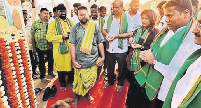
ଭୁବନେଶ୍ୱର, ୧୫.୧୨ (ବୁଧବେଳା): ଅବହେଳିତ ଅବସ୍ଥାରେ ଥିବା ବଡ଼ଗଡ଼ ଶ୍ଳାଗାନର ଭୂମିରୁ ନୂଆ ରୂପରେ ପାଇଥିବା ଶ୍ଳାଗାନକୁ ନୂଆ ଅଞ୍ଚଳ ବନ୍ଧୁ ପକ୍ଷୀ ଉଦ୍‌ଘାଟନ କରିଛନ୍ତି।