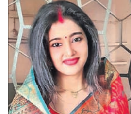
କଟକ ଅଧିକାରୀ, ୧୬୨

କେନ୍ଦ୍ରାପଡ଼ା ଅଧିକାରୀ ତଥା ଅଭିନେତା ଅନୁଭବ ମହାନ୍ତି ଓ ତାଙ୍କ ସ୍ତ୍ରୀ ଅଭିନେତ୍ରୀ ବର୍ଷା ପ୍ରିୟଦର୍ଶିନୀଙ୍କ ବିବାହ ବିଚ୍ଛେଦ ମାମଲାରେ କଟକ ପରିବାର ଅଦାଲତରେ ହୋଇଥିଲା।