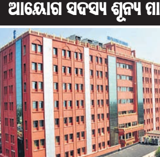
କଟକ ଅଫିସ, ୧୬୨୧