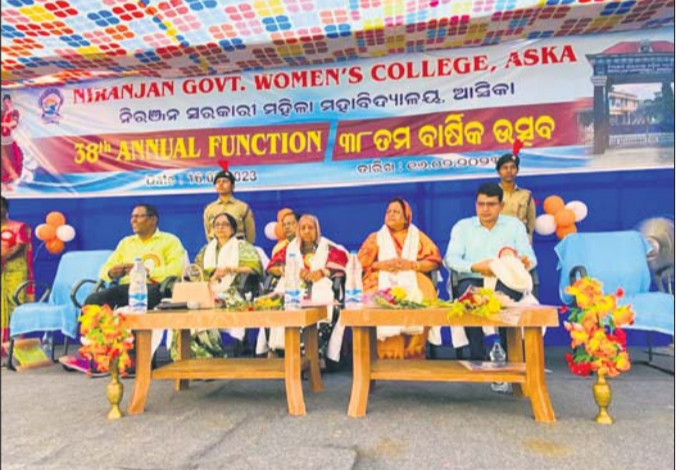
କାର୍ଯ୍ୟକ୍ରମରେ ମହାଧ୍ୟାନ ଅତିଥି ।