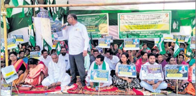
ଧାରଣାସ୍ଥଳରେ ବିଜେଡି କାର୍ଯ୍ୟକର୍ତ୍ତା ।

କେନ୍ଦ୍ର ସରକାର ପ୍ରଧାନମନ୍ତ୍ରୀ ଗରିବ କଲ୍ୟାଣ ଯୋଜନାରେ ୫ କେଜି ଚାଉଳ କାଟି ଦେଇଛନ୍ତି । ଆଗରୁ ୧୦ କେଜି ଚାଉଳ ଗରିବ ଲୋକଙ୍କୁ ମିଳୁଥିଲା ବେଳେ ଏଥିରୁ କାର୍ଯ୍ୟକ୍ରମ କଟାଯାଇ ସେ ଦିଗ୍‌ଦର୍ଶନ କରୁଛନ୍ତି ।