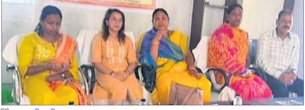
ଶିବିରରେ ଉପସ୍ଥିତ ଅତିଥି

କି.ଉଦୟଗିରି, ୧୬୨୨ ଗୁମ୍ଫା ବନଖଣ୍ଡ ଅଧୀନ ଯୋଜନା ବନଖଣ୍ଡ ପକ୍ଷରୁ ଗୁମ୍ଫା ବନଖଣ୍ଡ ଜଙ୍ଗଲ ଜମି ସୁରକ୍ଷା ନେଇ କଲେଜ ଛାତ୍ରଛାତ୍ରୀ ଓ ଯୁବଗୋଷ୍ଠୀଙ୍କୁ ନେଇ ଏକ ମିଳି ମାରାଧନ ଆୟୋଜିତ ହୋଇଯାଇଛି ।