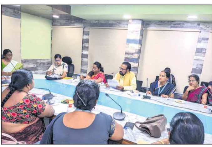
ବୈଠକରେ ଉପସ୍ଥିତ ଏଡିଏମ୍ ଓ ଅନ୍ୟମାନେ ।