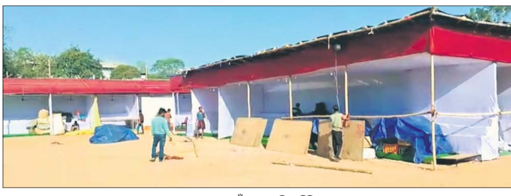
ମେଳା ପାଇଁ ଖୁଲ ପ୍ରସ୍ତୁତି ଚାଲିଛି ।

ଭଞ୍ଜନଗର କବିସମ୍ରାଟ ଆଧିକାରିକ ଆସୋସିଏସନ ଦ୍ୱାରା ପରିଚାଳିତ ଭଞ୍ଜନଗର କେଳି ପଢ଼ିଆକୁ ବାର୍ଷିକ ମେଳା ପାଇଁ ଅନୁମତି ଦିଆଯାଇଥିବା ବିଜ୍ଞାନ ମହଲରେ ଅବସ୍ଥାପନ କରାଯାଇଛି।