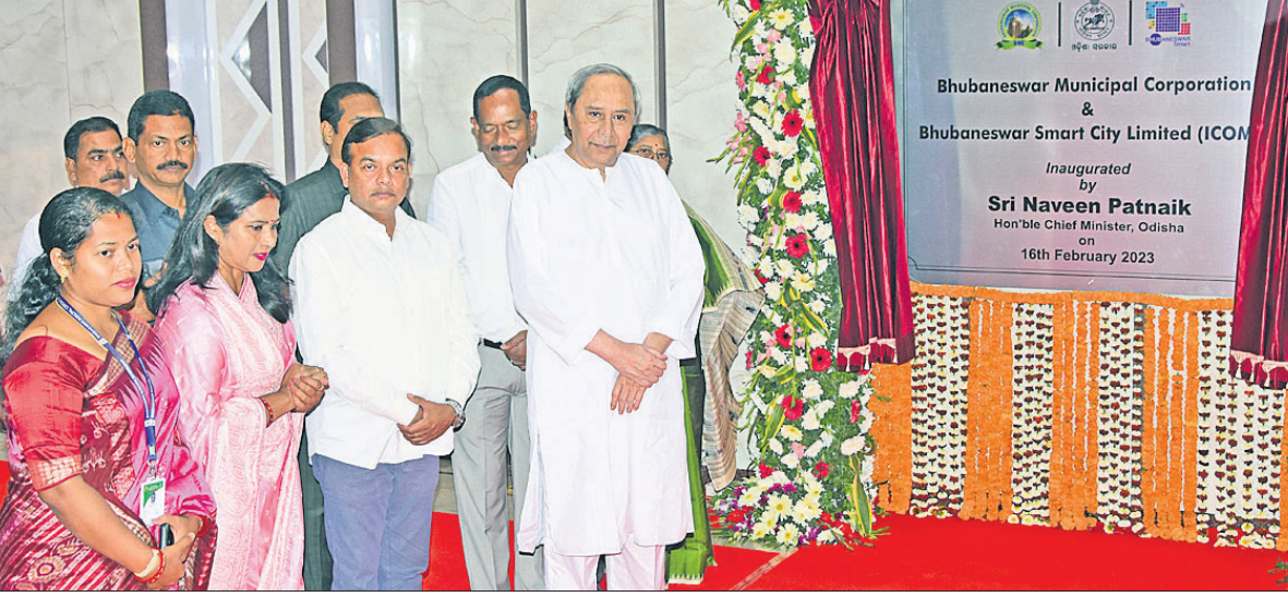
ଭୁବନେଶ୍ୱର ସତ୍ୟନଗରରେ ବିଏମ୍‌ସି ଆଇସିଏମ୍‌ସି ଟାଉରରୁ ରୁକୁବାର ମୁଖ୍ୟମନ୍ତ୍ରୀ ନବୀନ ପଟ୍ଟନାୟକ ଉଦ୍‌ଘାଟନ କରୁଛନ୍ତି।

ଭୁବନେଶ୍ୱର, ୧୬୨ (ବ୍ୟବସାୟ) ବହୁ ପ୍ରତୀକ୍ଷିତ ବିଏମ୍‌ସି ଆଇସିଏମ୍‌ସି ଟାଉର ରୁକୁବାର ମୁଖ୍ୟମନ୍ତ୍ରୀ ନବୀନ ପଟ୍ଟନାୟକଙ୍କ ଦ୍ୱାରା ଉଦ୍‌ଘାଟିତ ହୋଇଯାଇଛି।