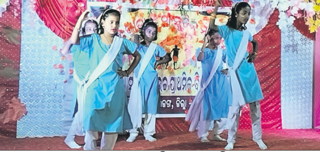
ଛାତ୍ରୀମାନେ ନୃତ୍ୟ ପରିବେଷଣ କରୁଛନ୍ତି।

ପରବର୍ତ୍ତୀ, ୧୬୧୨ (ଡି.ଏନ.ଏ.) ଦେଶାତ୍ମକ ଲିମା ପରବର୍ତ୍ତୀ ଲୁକ୍ମୁଦ୍ରା ପଞ୍ଚାୟତ ଅଧୀନ ବସନ୍ତପଢ଼ା ସ୍କୁଲର ବାର୍ଷିକ କ୍ରୀଡ଼ା ଏବଂ ସାଂସ୍କୃତିକ ମହୋତ୍ସବ ଅନୁଷ୍ଠିତ ହୋଇଯାଇଛି।