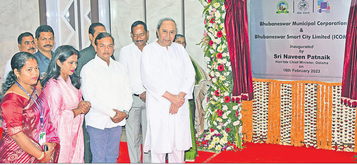
ଭୁବନେଶ୍ୱର ସତ୍ୟନଗରଠାରେ ବିଏମ୍‌ସି ଆଇସିଓଏମ୍‌ସି ଗାଞ୍ଜିପୁର ମୁଖ୍ୟମନ୍ତ୍ରୀ ନବୀନ ପଟ୍ଟନାୟକ ଉଦ୍ଘାଟନ କରୁଛନ୍ତି।

କେନ୍ଦ୍ରାପଡ଼ା ଏମ୍‌ପି ଚଥା ଅଭିନେତା ଅନୁଭବ ମହାନ୍ତି ଓ ତାଙ୍କ ସ୍ତ୍ରୀ ଅଭିନେତ୍ରୀ ବର୍ଷା ପ୍ରିୟଦର୍ଶିନୀଙ୍କ ବିବାହ ବିଚ୍ଛେଦ ମାମଲାରେ ଶୁଣାଣି ଚଳୁଥିବା କଚକ ପରିବାର ଅଦାଲତରେ ହୋଇଥିଲା।