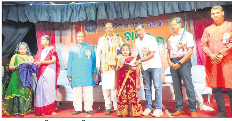
ଜଣେ କୁଟା ଛାତ୍ରୀଙ୍କୁ ଅତିଥି ପୁରସ୍କୃତ କରୁଛନ୍ତି।

ଦେଶାତ୍ମକ ଲିମା ଭୁବନ ସରକାରୀ ଶିଶୁ ବିଦ୍ୟାଳୟର ୩୦ତମ ବାର୍ଷିକ ଉତ୍ସବ ମହାଆଡ଼ମ୍ବରେ ପାଳିତ ହୋଇଯାଇଛି।