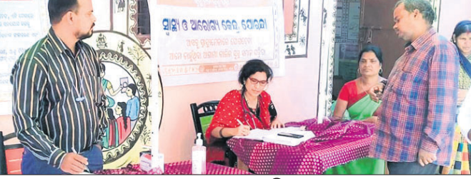
ଯୋରନ୍ଦା ସ୍ୱାସ୍ଥ୍ୟକେନ୍ଦ୍ରରେ ଆୟୋଜିତ ସ୍ୱାସ୍ଥ୍ୟମେଳା।

ଦେଶାତ୍ମକ ଅଧିକ, ୧୬୧୨ ଦେଶାତ୍ମକ ଲିମା ଯୋରନ୍ଦା ସ୍ୱାସ୍ଥ୍ୟ ଓ ଆରୋଗ୍ୟ କେନ୍ଦ୍ର ପରିସରରେ ମଙ୍ଗଳବାର ସ୍ୱାସ୍ଥ୍ୟମେଳା ଅନୁଷ୍ଠିତ ହୋଇଯାଇଛି।