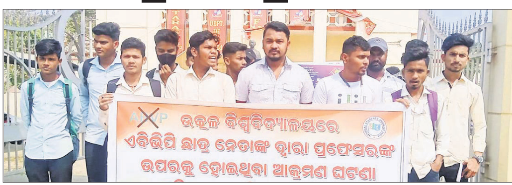
ଜିଲ୍ଲା ଛାତ୍ର କଂଗ୍ରେସ ପକ୍ଷରୁ ବିଶୋଭ ପ୍ରଦର୍ଶନ କରାଯାଇଛି।