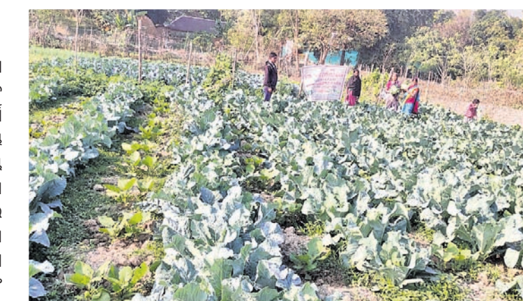
ବିଷୁପୁର ଗ୍ରାମରେ ମହିଳା ଗୋଷ୍ଠୀଙ୍କ ଦ୍ୱାରା ହୋଇଥିବା ବ୍ରକୋଲି ଚାଷ।

ଖଇରା, ୧୬/୧୨ (ଡି.ଏନ.ଏ.) ବାଲେଶ୍ୱର ଜିଲ୍ଲା ଅଧୀନ ଖଇରା ସଞ୍ଚୟିକା ମହାସଂଘର ସଦସ୍ୟମାନେ ସ୍ୱାଦଲୟା ହେବା ଲକ୍ଷ୍ୟରେ ଚଳିତବର୍ଷ ୨ଟି ସ୍ଥାନରେ ବ୍ରକୋଲି ଚାଷ ଆରମ୍ଭ ହୋଇଛି। ଖଇରା ପଞ୍ଚାୟତ କାର୍ଯ୍ୟାଳୟ ଓ ବିଷୁପୁର ଗ୍ରାମରେ ସ୍ୱୟଂ ସହାୟିକା ଗୋଷ୍ଠୀ ପ୍ରଥମ କରି ମାଟିରେ ସଫଳତାର ସହ ବ୍ରକୋଲି ଫଳାଇବା ଲକ୍ଷ୍ୟରେ ଦିନରାତି ଏକ କରିଦେଇଛନ୍ତି। ବିଷୁପୁରରେ ୮୯ଏକର ଜମିରେ ଏବଂ ଖଇରା ପଞ୍ଚାୟତ କାର୍ଯ୍ୟାଳୟ ନିକଟରେ ପାଖାପାଖି ୧୯ଏକର ଜମିରେ ଏହି ଚାଷ