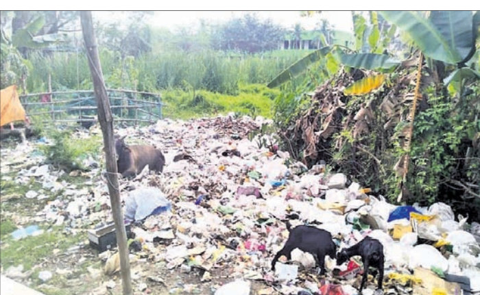
ଭୁଲପକା ମତ୍ତପ ରାସ୍ତାପାର୍ଶ୍ୱରେ ଆବର୍ଜନା। ୬୦କୋଟି ଟଙ୍କାର ନିର୍ମାଣ କାର୍ଯ୍ୟ କେତେ ଲାଗିବ ବୋଲି ସ୍ଥାନୀୟ ଅଧିବାସୀ ପ୍ରଶ୍ନ ଉଠାଇଛନ୍ତି। ଏପଡ଼େ ଆଉ ମାତ୍ର ଦିନକ ପରେ ପୀଠରେ ଜାଗର ଯାତ୍ରା। ଏହାକୁ ସୁଚାରୁରୂପେ ସମ୍ପାଦନ କରିବାକୁ

ଆରଡ଼ି, ୧୬/୧୨ (ଡି.ଏନ.ଏ.) ଭଦ୍ରକ ଜିଲ୍ଲା ଆରଡ଼ି ଆଖଣ୍ଡଳମଣି ପୀଠର ଉତ୍ତରାଂଗଣ ପାଇଁ ୬ ବର୍ଷ ତଳେ ୬ କୋଟି ଟଙ୍କା ବ୍ୟୟବରାଦ କରାଯାଇଥିଲା। ତଦନୁଯାୟୀ କାର୍ଯ୍ୟ ମଧ୍ୟ ଚାଲୁ ରହିଥିଲା। ନଭେମ୍ବର ସୁଦ୍ଧା ମନ୍ଦିର ବେଢ଼ା ସମ୍ପୂର୍ଣ୍ଣରୂପେ ଓ ଅନ୍ୟାନ୍ୟ ସୌନ୍ଦର୍ଯ୍ୟକରଣ କାର୍ଯ୍ୟ ସରିବ ବୋଲି ମୁଖ୍ୟ ଶାସନ ସଚିବ ଓ ୫-ଟି ସଚିବ ପୀଠ ଗସ୍ତ ଅବସରରେ ଘୋଷଣା କରିଥିଲେ। ହେଲେ ଫେବୃଆରୀ ସରିବାକୁ ବସିଥିଲେ ବି ନିର୍ମାଣ କାର୍ଯ୍ୟ ସରିନାହିଁ। ଏହାବ୍ୟତୀତ ପୀଠ ସୌନ୍ଦର୍ଯ୍ୟକରଣ ନିମନ୍ତେ ପୁନଃ ୬୦ କୋଟି ଟଙ୍କା ବ୍ୟୟବରାଦ କରାଯାଇ ଯଥାସାମ୍ମୁ କାର୍ଯ୍ୟ ଆରମ୍ଭ ହେବ ବୋଲି ମଧ୍ୟ ଭୁଲ ସଚିବ ଘୋଷଣା କରିଥିଲେ। ପ୍ରାଥମିକ ୬ କୋଟି ଟଙ୍କାର କାମ ୬ ବର୍ଷ ପୂରିଥିଲେ ବି ଆଦ୍ୟାବଧି ଶେଷ ହୋଇନାହିଁ। ସେହିଭଳି