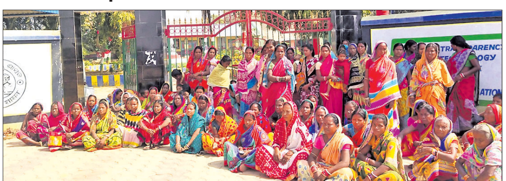
ଫାଟକ ଆଗରେ ସ୍ୱୟଂ ସହାୟକ ମହିଳା ବସିଛନ୍ତି।

କେନ୍ଦୁଝର ଜିଲ୍ଲା ସାହାରପଡ଼ା ବ୍ଲକ୍ କୁଣ୍ଡଳା ପଞ୍ଚାୟତ ମିରିଗିଣୋଇ କୁଣ୍ଡଳା ହାଲସୁଲରେ ଖୁବ୍ ମନାନ୍ ଓ ସୁଲଘର ନିୟୁକ୍ତି ନେଇ ବିବାହ ଦେଖାଯାଇଛି। ଏକ ନିର୍ଦ୍ଦିଷ୍ଟ ମହିଳା ଗୋଷ୍ଠୀକୁ ପ୍ରାଧ୍ୟାୟ ବିଆଯାଇଥିବା ଅଭିଯୋଗ କରି ଗୁରୁବାର ୧୨ ସ୍ୱୟଂ ସାହାୟକ ଗୋଷ୍ଠୀର ମହିଳା ବିଦ୍ୟାଳୟ ଫାଟକରେ ଚାଲି ପକାଇଥିଲେ। ଦାବି ପୂରଣ ନହେଲା ପର୍ଯ୍ୟନ୍ତ ଧାରଣା ଜାରି ରହିବ ବୋଲି ଚେତାବନୀ ଦେଇଛନ୍ତି। ଅଭିଯୋଗ ଅନୁଯାୟୀ, ଉଚ୍ଚ ବିଦ୍ୟାଳୟ ୫-୯ରେ ରୁପାନ୍ତରଣ ହେବା ପରେ କର୍ତ୍ତୃପକ୍ଷ ପୂର୍ବରୁ ପ୍ରାଥମିକ ବିଦ୍ୟାଳୟରେ ରୋଷେଇ କରୁଥିବା ନିର୍ଦ୍ଦିଷ୍ଟ ଗୋଷ୍ଠୀକୁ