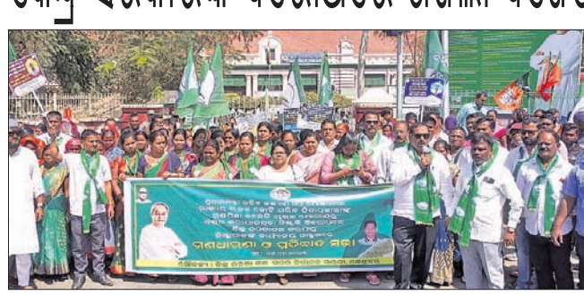
ଜିଲ୍ଲାପାଳଙ୍କ କାର୍ଯ୍ୟାଳୟ ଆଗରେ ବିଜେଡି ନେତା ଓ କର୍ମକର୍ତ୍ତା।

କେନ୍ଦ୍ରସର/ପାଟଣା/ଚଞ୍ଚୁଆ/ଯୋଡ଼ା/ବଡ଼ବିଲ/ ଚେଳକୋଇ, ୧୬୧୨(ସ.ପ୍ର./ଡି.ଏନ.ଏ.)