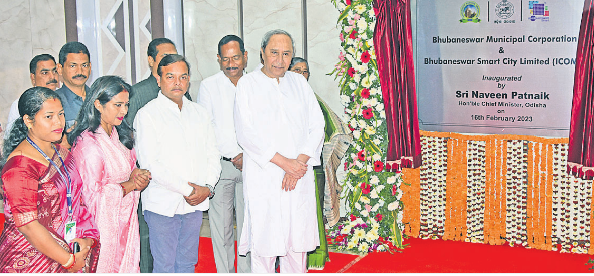
ଭୁବନେଶ୍ୱର ସତ୍ୟନଗରରୁ ବିଏମ୍ସି ଆଇସିଏମ୍ସି ଟାଉରକୁ ରୁକୁବାର ମୁଖ୍ୟମନ୍ତ୍ରୀ ନବୀନ ପଟ୍ଟନାୟକ ଉଦ୍ଘାଟନ କରୁଛନ୍ତି।

ସେହିପରି ୪ର୍ଥ ମହଲାରେ କମିଶନରଙ୍କ କକ୍ଷ ରହିବ। ଅପରପକ୍ଷେ ପ୍ରଥମ ଏବଂ ଦ୍ୱିତୀୟ ମହଲା ଆଇସିଏମ୍ସିକୁ ଦିଆଯାଇଥିବାବେଳେ ୫ମ ମହଲାରେ ଭୁବନେଶ୍ୱର ସ୍ମାର୍ଟସିଟି ଲିମିଟେଡ (ବିଏସିଏଲ)ର କାର୍ଯ୍ୟାଳୟ ଏବଂ ୬ଷ୍ଠରୁ ୧୦ମ ମହଲା ପର୍ଯ୍ୟନ୍ତ ଡେଲିଭେରି ପ୍ରଦାନ କରାଯାଇଛି। ପୂର୍ବରୁ ଡେଲିଭେରି ଏଠାରେ ଚା'ର କାର୍ଯ୍ୟାଳୟ ଆରମ୍ଭ କରି ସାରିଥିବାବେଳେ ପ୍ରାୟ ସପ୍ତାହତକେ ସ୍ମାର୍ଟସିଟି ଠିକଣା ଏଠାକୁ ବଦଳି ସାରିଛି। ବିଏମ୍ସିର ନୂତନ କୋଠା ଉଦ୍ଘାଟନ ପରେ ଆସନ୍ତା ୨୦ତାରିଖରେ ପ୍ରସ୍ତାବିତ କର୍ମଚାରୀଙ୍କ ଡିପ୍ୟୁଟି ନୂତନ ସମ୍ପୂର୍ଣ୍ଣ କକ୍ଷରେ ଅନୁଷ୍ଠିତ ହେବ ବୋଲି ସ୍ଥିର ହୋଇଛି। ସେହିଭଳି କଳ୍ପନା ଛକକୁ ବିଏମ୍ସି ମୁଖ୍ୟ କାର୍ଯ୍ୟାଳୟ ସ୍ଥାନାନ୍ତର ପରେ ସାମନ୍ତରାପୁରଠାରେ ଭଡ଼ାରେ ଚାଲିଥିବା ବିଏମ୍ସିର ଦକ୍ଷିଣ-ପୂର୍ବ ଜୋନାଲ କାର୍ଯ୍ୟାଳୟ ପୁରୁଣା ବିଏମ୍ସି କୋଠାକୁ ସ୍ଥାନାନ୍ତର ହେବ ବୋଲି ସୂଚନା ମିଳିଛି।