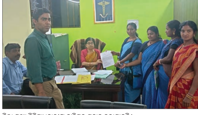
ଜିଲ୍ଲା ମୁଖ୍ୟ ଚିକିତ୍ସାଧିକାରୀଙ୍କୁ ଦାବିପତ୍ର ପ୍ରଦାନ କରାଯାଇଛି।

ଓଡ଼ିଶା ଆଶାକର୍ମୀ ଆସୋସିଏସନ ସିଆଇଟିସୁ ନୂଆପଡ଼ା ଜିଲ୍ଲା ବୁକ କମିଟି ପକ୍ଷରୁ ୧୩ ଦିନୀ ଦାବିପତ୍ର ଶୁକ୍ରବାର ଜିଲ୍ଲା ମୁଖ୍ୟ ଚିକିତ୍ସାଧିକାରୀଙ୍କୁ ପ୍ରଦାନ କରାଯାଇଛି।