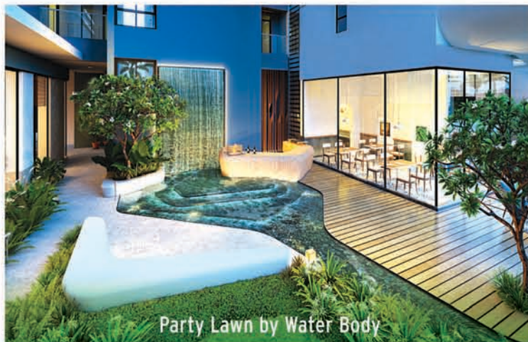
Party Lawn by Water Body