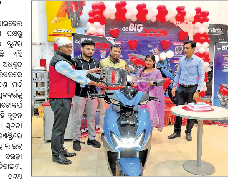
ହିରୋ ଜୁମ୍ ୧୧୦ସିସି ସ୍କୁଲର ବଜାର ପ୍ରବେଶର ଶୁଭାରମ୍ଭ କରାଯାଇଛି।