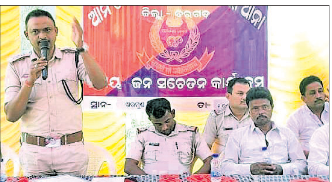
ଖରମୁଣ୍ଡାରେ ଅନୁଷ୍ଠିତ ଆମ ପୋଲିସ୍ ସମିତି କାର୍ଯ୍ୟକ୍ରମ।

ବରଗଡ଼ ଜିଲ୍ଲା ଅତୀତର ଥାନା ଖରମୁଣ୍ଡା ପଞ୍ଚାୟତ ଅଧିକାରୀଙ୍କ ସମ୍ମୁଖରେ ଶୁକ୍ରବାର ଆମ ପୋଲିସ୍ ସମିତି କାର୍ଯ୍ୟକ୍ରମ ଅନୁଷ୍ଠିତ ହୋଇଯାଇଛି। ଉଚ୍ଚ କାର୍ଯ୍ୟକ୍ରମରେ ସାଇବର ଅପରାଧ ରୋକିବାକୁ ଗୁରୁତ୍ୱ ଦିଆଯାଇଥିଲା।