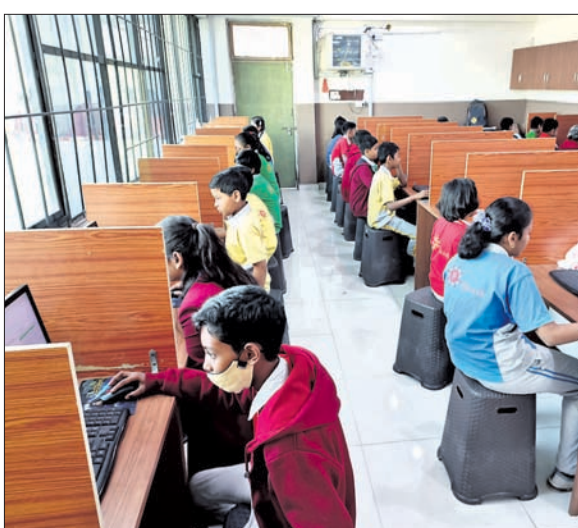
ବିକାଶରେ ଚାଲିଥିବା ସଫଳ ପରୀକ୍ଷାରେ ପରୀକ୍ଷାର୍ଥୀମାନେ।