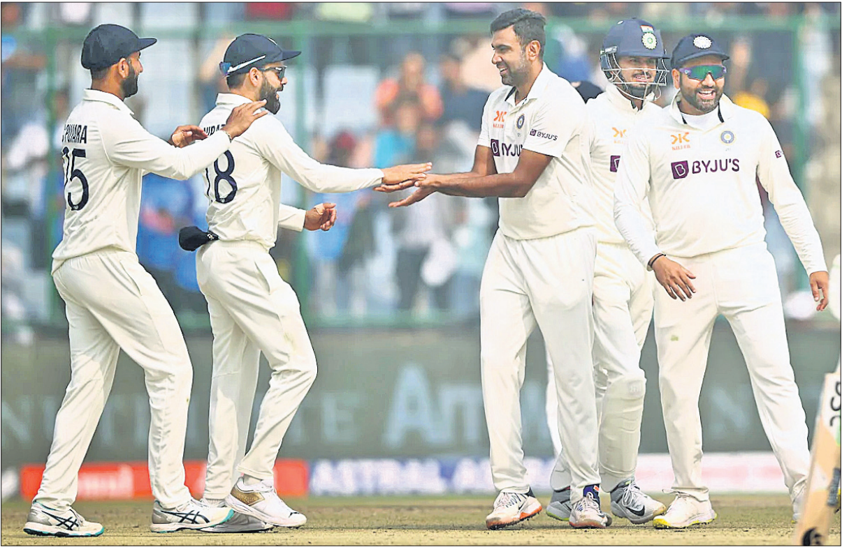
ଉଲ୍ଲେଖନୀୟ ନେତା ପରେ ରବିଚନ୍ଦ୍ରନ ଅଶ୍ୱିନଙ୍କୁ ସାଥୀ ଖେଳାଳିଙ୍କ ବଧେଇ।

ଟେଷ୍ଟ ସମସ୍ତ ଉଲ୍ଲେଖନୀୟ ପାଇଁ ଭାରତ ଏବେ ଅଷ୍ଟେଲିଆ ପ୍ରଥମ ଇନିଂସ ଘୋରଠାରୁ ୨୪୨ ରନରେ ପଛୁଆ ରହିଛି। ଟେଷ୍ଟ ଅଷ୍ଟେଲିଆ ବ୍ୟତିତ ନିଶ୍ଚିତ ନେଇଥିଲା। ମାତ୍ର ଉପମାନ ଖାଜାଙ୍କୁ ଛାଡ଼ିଦେଲେ ଟପ୍ ଅର୍ଡରର ଅନ୍ୟ କୌଣସି ବ୍ୟାଟର ଭାରତୀୟ ବୋଲରଙ୍କୁ ଉଚିତ ମୁକାବିଲା କରିପାରି ନ ଥିଲେ। ଫଳରେ ଓପନିଂ ଯୋଡ଼ିରେ ଡେଭିଡ୍ ଫାର୍ନର ଓ ଉପମାନ ଖାଜା ୫୦ ଏବଂ ୫୧ ରନରେ ଖାଜା ଓ ପିଟର ହ୍ୟାଣ୍ଡକମ୍ପ ୫୯ ରନ ଯୋଗ କରିଥିଲେ ହେଁ ୧୬୮ ରନ ମଧ୍ୟରେ ୬ଟି ଉଲ୍ଲେଖନୀୟ ହରାଇ ଭୁମିଶାଳୀ