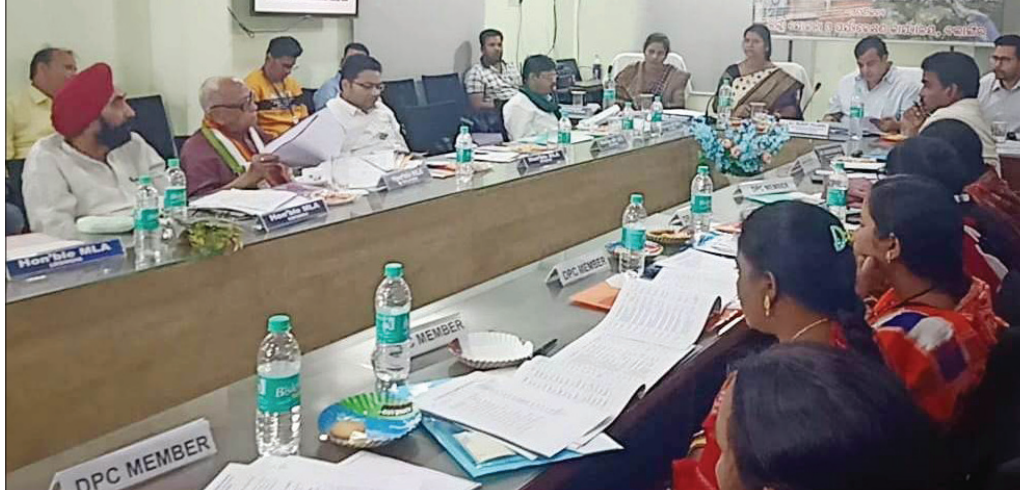
ଜିଲ୍ଲା ଯୋଜନା କମିଟି ବୈଠକରେ ମହାସାଧନ କମିଟି ସଦସ୍ୟ, ସଦସ୍ୟ।