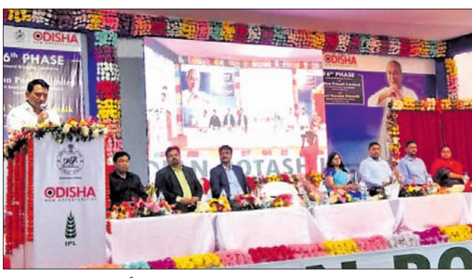
ଭିତ୍ତି ପ୍ରସ୍ତର ସ୍ଥାପନ କାର୍ଯ୍ୟକ୍ରମରେ ଅତିଥିଗଣ।