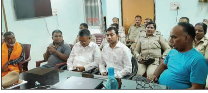
ଶିବରାତ୍ରି ସୁରକ୍ଷା ନେଇ ଆଲୋଚନା କରାଯାଇଛି।