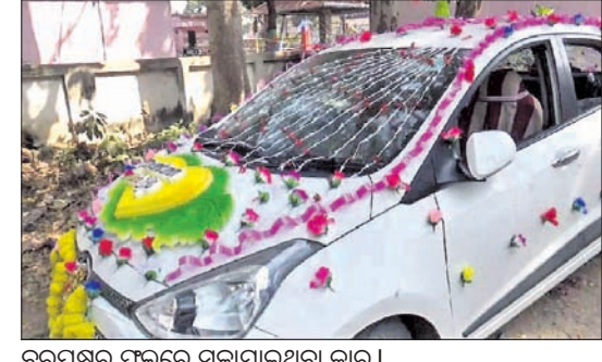
ବରପକ୍ଷର ପୁଲରେ ସଜାଯାଇଥିବା କାର।

■ ପ୍ରେମିକଙ୍କ ସହ ବାଇକ୍‌ରେ ପଳାଇଲେ ■ ଶିଶୁପାଳ ହୋଇ ଫେରିଲେ ବର ■ ଥାନାରେ ପଡ଼ିଯୋଗ କଲେ ଯୁବକ