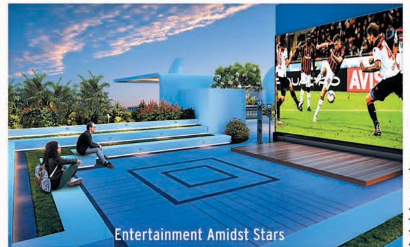
Entertainment Amidst Stars