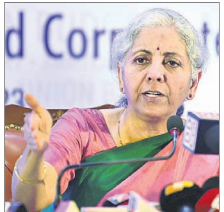
ଅର୍ଥମନ୍ତ୍ରୀ ନିର୍ମଳା ସୀତାରାମନ

■ ଏମ୍ପିଏନ୍ଆରଇସିଏସ୍ ଅର୍ଥ କମାୟାଜିଥିବା ନିର୍ମଳା ■ ରେକର୍ଡ ପରିମାଣ ଶସ୍ୟ ସଂଗ୍ରହ ହେଉଛି