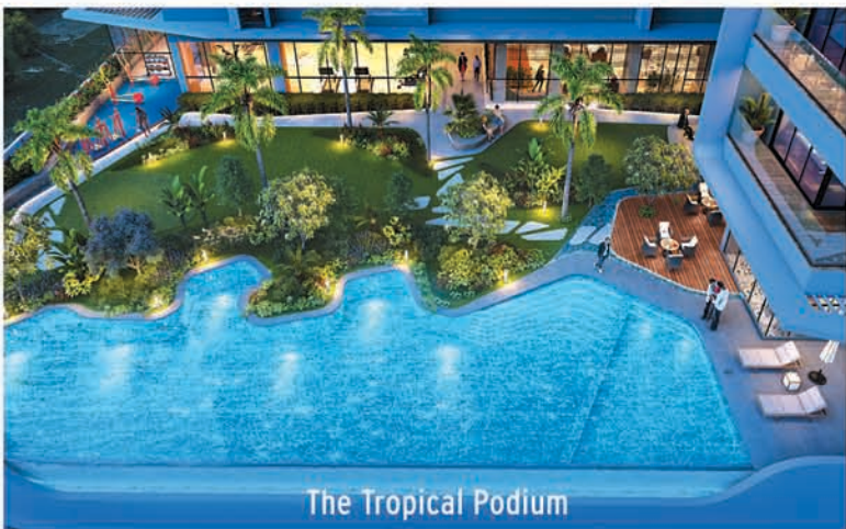
The Tropical Podium

ORERA No.: RP/19/2022/00840 | https://pacms.orera.in