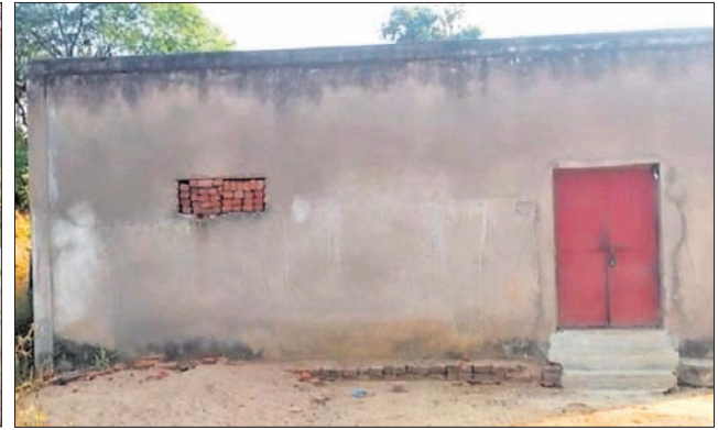
କାମ ମିଳୁନାହିଁ, ଦାଦନ ଖଟିବା ପାଇଁ ଗଲେ ତାମିଲନାଡୁ।