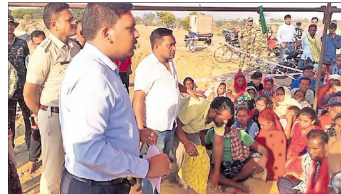
ଭୁମିହୀନ ସଂଘର୍ଷ ସମିତି ପକ୍ଷରୁ ବିକ୍ଷୋଭ କରାଯାଇଛି।

ଭବାନୀପାଟଣା, ୧୭/୨ (ସ.ପ୍ର.): କଳାହାଣ୍ଡି ଜିଲ୍ଲା ଭୁନାଗଡ଼ ବ୍ଲକ ଅନ୍ତର୍ଗତ ତଳକାରିଙ୍ଗାଠାରେ ଥିବା ଶତାଧିକ ଏକର ଜମିରେ ୨ଟି ପଞ୍ଚାୟତର ଲୋକେ ସରକାରଙ୍କୁ ଖଜଣା ପାଉଁଟି ବାଣ୍ଟି ପତରା ଜମିରେ ଗଣ୍ଠି କରି ଆସୁଥିଲେ।