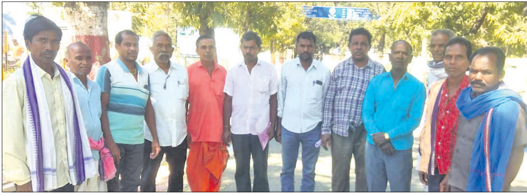
ସମବାୟ ସମିତି ଖୋଲିବା ଦାବିରେ ଜିଲ୍ଲାପାଳଙ୍କୁ ଫେରାଦ ହୋଇଥିବା ଗାଷ୍ଟୀ।