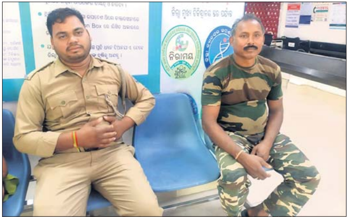
ଆହତ କର୍ମଚାରୀଦ୍ୱୟ ।