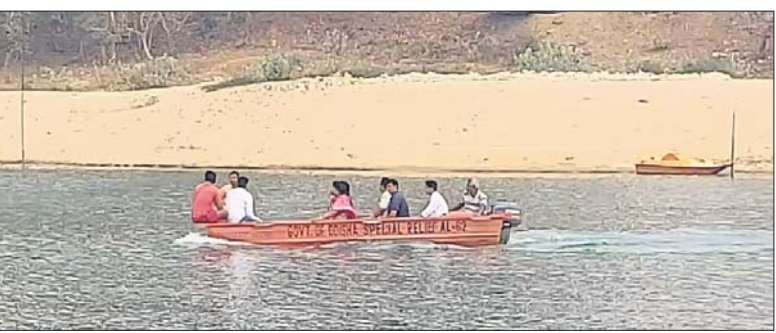
ବିନା ଲାଇଫ୍ ଜ୍ୟାକେଟରେ ତଙ୍ଗାରେ ଯାତ୍ରା କରୁଛନ୍ତି ମନ୍ତ୍ରୀ ଓ ଅନ୍ୟମାନେ।

ଖୁଷ୍ଣୁଣୀ, ୧୮/୨(ଡି.ଏନ୍.ଏ.) କଟକ ଜିଲାର ପ୍ରସିଦ୍ଧ ଶୈବପୀଠ ବାବା ଧରଲେଶ୍ୱରଙ୍କ ଶିବିର ଥିଲା ଜାଗର ଯାତ୍ରା। ଶ୍ରଦ୍ଧାଳୁଙ୍କ ସମାଗମକୁ ଦୃଷ୍ଟିରେ ରଖିବା ସହ ସୁଲୀପୋଲର ମରାମତି ଚାଲିଥିବାରୁ ପୂର୍ବରୁ ୧୪୪ ଧାରା ଲାଗିଥିବା ବେଳେ ତଙ୍ଗା ଯାତ୍ରାକୁ ମଧ୍ୟ ପ୍ରଶାସନ ବନ୍ଦ ରଖିଛି। କେହି ତଙ୍ଗାରେ ନଦୀ ପାର ହୋଇ ଦର୍ଶନ ପାଇଁ ଗଲେ ନିରାପଦ ଦୃଷ୍ଟିକୁ ଲାଇଫ୍ ଜ୍ୟାକେଟ ବାଧ୍ୟତାମୂଳକ କରାଯାଇଛି। ହେଲେ ଏହି ନିୟମ ସାଧାରଣ ଲୋକଙ୍କ ପାଇଁ କଡ଼ାକଡ଼ି ଥିବାବେଳେ ଶିବିରର ରାଜ୍ୟର ଜଣେ