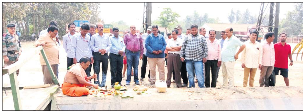
ଆଖୁ ନାଳି ନିକଟରେ ପୂଜାର୍ଚ୍ଚନା କରାଯାଇଛି ।