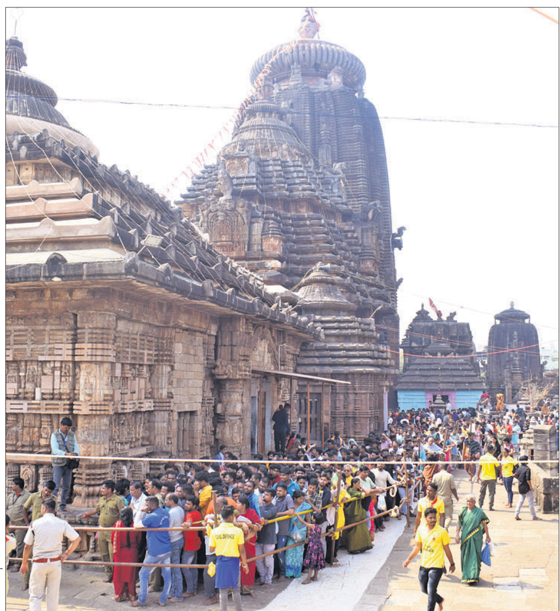
ମହାଶିବରାତ୍ରି ଅବସରରେ ଶନିବାର ଭୁବନେଶ୍ୱର ଲିଙ୍ଗରାଜ ମନ୍ଦିରରେ ଶ୍ରଦ୍ଧାଳୁଙ୍କ ଭିଡ଼।