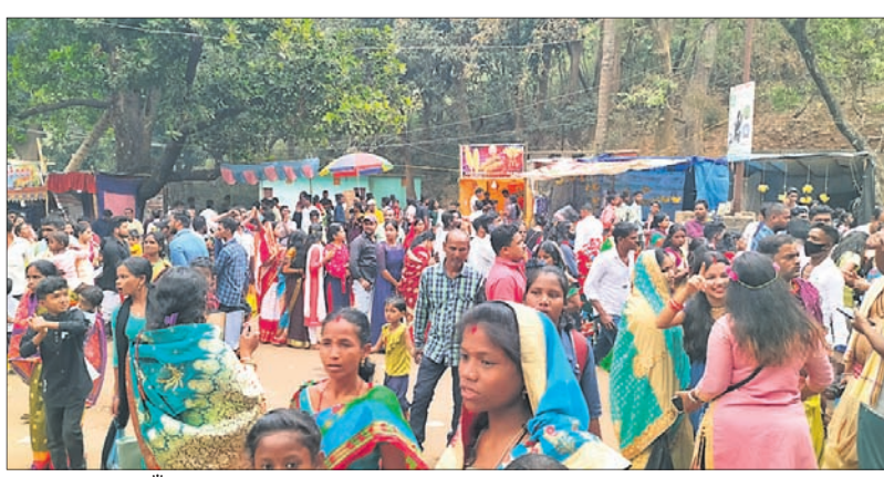
ଜାଗର ଯାତ୍ରା ପାଇଁ ମହାନ ପରିସରରେ ଭିଡ଼।