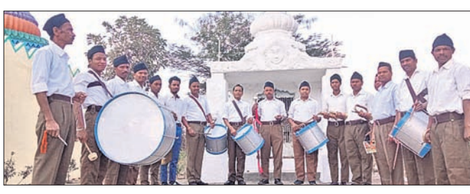
ଘୋଷ ବାଦନ କାର୍ଯ୍ୟକ୍ରମ

ରାମଗିରି, ୧୮୧୨ (ଡି.ଏନ.ଏ.) ରାଷ୍ଟ୍ରୀୟ ସ୍ୱୟଂ ସେବକ ସଂଘ ଗଜପତି ଜିଲ୍ଲା ତରଫରୁ ଘୋଷ ଦିବସ ଅବସରରେ ଘୋଷ ବାଦନ କାର୍ଯ୍ୟକ୍ରମ ହୋଇଯାଇଛି । ଏହି ଅବସରରେ ଗଜପତି ଜିଲ୍ଲା ଆଇ.ଏ.ଏ. ଉପଯୋଗୀ ପଞ୍ଚାୟତ ସଂଘର ଘୋଷ ବାଦନ ପରିସରରେ ସଂଘ ଶ୍ରୀରାମେଶ୍ୱର ମନ୍ଦିର ପରିସରରେ ସଂଘ ତରଫରୁ ଘୋଷ ବାଦନ କରାଯାଇଥିଲା । ଉକ୍ତ କାର୍ଯ୍ୟକ୍ରମରେ ଜିଲ୍ଲା କାର୍ଯ୍ୟବାହ ଅଧିକାରୀ କୁମାର ପାତ୍ର, ଜିଲ୍ଲା ଶାଗରିକ