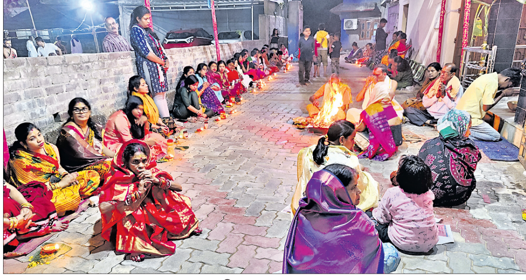
ଯାଜପୁରରୋଡ଼ ଦେବେଶ୍ୱର ପୀଠରେ ଶ୍ରଦ୍ଧାଳୁ ଦୀପ ଜାଳୁଛନ୍ତି।