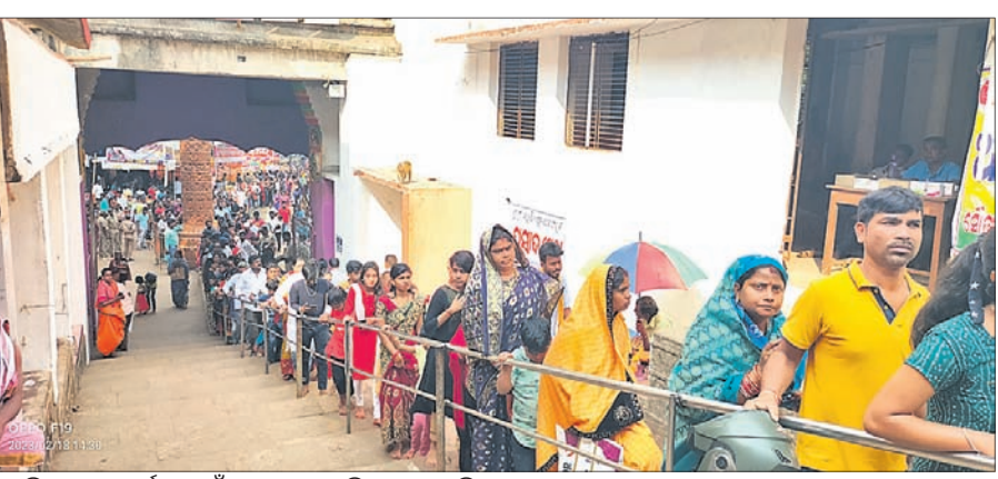
ମହାଦୀପ ଉଠିବାର ପ୍ରଥମ ଦିନ ଉପଲକ୍ଷେ ଶ୍ରଦ୍ଧାଳୁଙ୍କୁ ନିମନ୍ତ୍ରଣ କରାଯାଇଛି।

ପଲିଗ୍ରା ମେଳା ଉଦ୍ଘାଟିତ ପ୍ରତ୍ୟେକ ବର୍ଷ ଜାଗର ଯାତ୍ରା ଏବଂ ଆଇନ ଶୁଣାଇ ପାଇଁ ବ୍ୟାପକ ବ୍ୟବସ୍ଥା ଏଠାରେ ଲକ୍ଷାଧିକ ଭକ୍ତଙ୍କ ସମାଗମ ଦେଖିବାକୁ ମିଳିଛି। ଲୋକମାନଙ୍କୁ ପ୍ରସନ୍ନ କରିବା ପାଇଁ ପ୍ରଭୁଙ୍କୁ ନିମନ୍ତ୍ରଣ କରାଯାଇଛି।