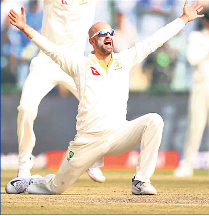
ଅଷ୍ଟ୍ରେଲିଆ ପକ୍ଷରୁ ୫ ଉଇକେଟ ହାସଲକାରୀ ନାଥାନ ଲିୟନ।

ଭାରତ ଓ ଅଷ୍ଟ୍ରେଲିଆ ମଧ୍ୟରେ ଅନୁଷ୍ଠିତ ବର୍ତ୍ତମାନ ଗାଭାସ୍କର ଟ୍ରଫିର ଦ୍ୱିତୀୟ ଟେଷ୍ଟରେ ସମ୍ମାନ ରକ୍ଷା କରିଛନ୍ତି ଅକ୍ଷର ପଟେଲ ଓ ଅଶ୍ୱିନଙ୍କ ଦଳ। ଅକ୍ଷର ପଟେଲଙ୍କ ଅର୍ଦ୍ଧଶତକ ଓ ଅଶ୍ୱିନଙ୍କ ଦୁଇ ଚାର୍ଜିଂ ବଲରେ ଭାରତ ପ୍ରଥମ ଇନିଂସରେ ୨୬୨ ରନ୍ କରି ଅଲଆଉଟ ହୋଇଥିଲା। ଦ୍ୱିତୀୟ ଦିନର ଷ୍ଟମ୍ପ ଅପସାରଣ ସୂଚୀ ଅଷ୍ଟ୍ରେଲିଆ ୧ ଉଇକେଟରେ ୬୧ ରନ୍ କରିବା ସହିତ ୬୨ ରନରେ ଆଗୁଆ ରହିଛି। ପ୍ରଥମ ଦିନର ଅପମାତ୍ର ଷ୍ଟୋର ବିନା ଉଇକେଟରେ ୨୧୧ ରୁ ଖେଳ ଆରମ୍ଭ କରି ଭାରତ ଆଉ ୨୫ ରନ୍ ଯୋଡ଼ିଥିଲା। ଲୋକେଶ ରାଘୁଲୁ ମାତ୍ର ୧୭ ରନ୍ କରି ସ୍ଥିର ନାଥନ୍ ଲିୟନଙ୍କ ଶିକାର ହୋଇଥିଲେ। ଏହାର