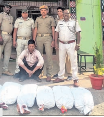
ଜବତ ଗଞ୍ଜେଇ ।

ଏହି ତ୍ରୁଲି ସଂପୂର୍ଣ୍ଣ ବାଇକ୍ ଯାଉଥିଲା । ପୋଲିସ୍ ସେହି ତ୍ରୁଲିକୁ ଅଟକାଇ ତନଖି କରିବାରେ ଏକ ସ୍ୱତନ୍ତ୍ର ଚାମରରେ ୩୧.୫ କେଜି ଗଞ୍ଜେଇ ଜବତ କରାଯାଇଥିଲା ।