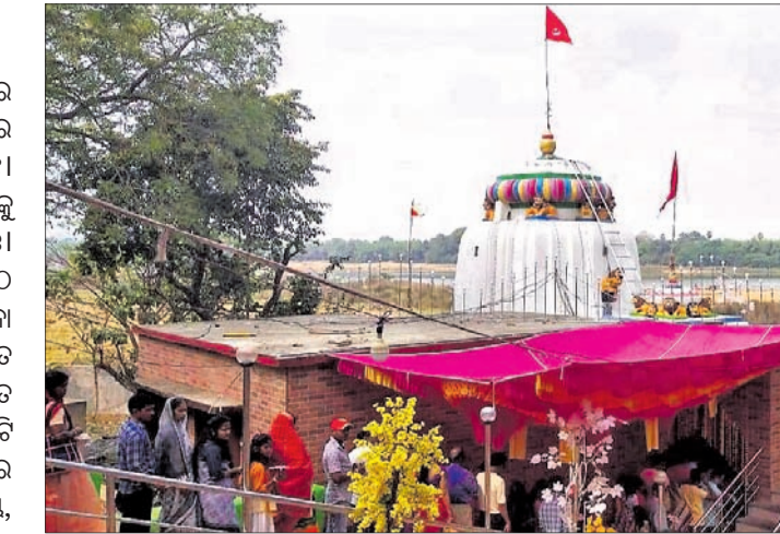
ଗୋକର୍ଣ୍ଣେଶ୍ୱରପୀଠରେ ଭକ୍ତ ଧାଡ଼ିରେ ଆସି ଠାକୁରଙ୍କୁ ଦର୍ଶନ କରୁଛନ୍ତି।