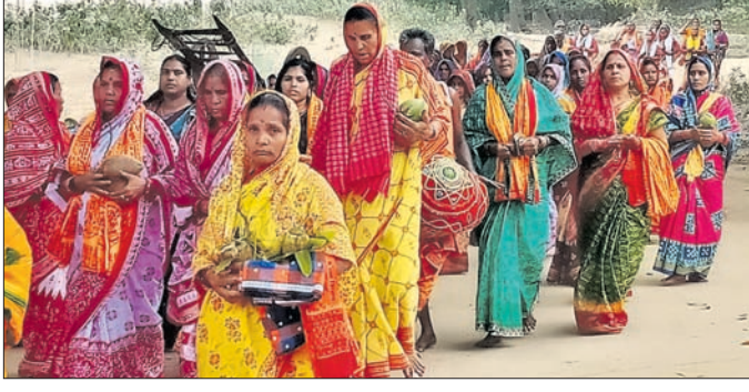
କଳସ ଶୋଭାଯାତ୍ରାରେ ସାମିଲ ଗ୍ରାମବାସୀ ।

ଖଣ୍ଡପଡ଼ା, ୧୮୧୨ (ସ.ପ୍ର.): ସିଦ୍ଧାର୍ଥ ଗ୍ରାମବାସୀଙ୍କ ଦ୍ୱାରା ସ୍ଥାନୀୟ ଜଗନ୍ନାଥ ମନ୍ଦିର ପ୍ରାଙ୍ଗଣରେ ପ୍ରଭୁ ଶ୍ରୀଚୈତନ୍ୟ ଠାକୁରଙ୍କ ଶନିବାରଠାରୁ ୩ ଦିନ ବ୍ୟାପୀ ଅଷ୍ଟପ୍ରହର ନାମୟଙ୍କ ଆରମ୍ଭ ହୋଇଛି । ଶତାଧିକ ମହିଳା, ପୁରୁଷ ନିକଟସ୍ଥ ମହାନଦୀ ଘାଟକୁ ଜଳ ଆଣି ଏକ ଶୋଭାଯାତ୍ରାରେ ଗ୍ରାମ ପରିକ୍ରମା କରିବା ପରେ ନାମୟଙ୍କ ସ୍ଥଳରେ ସ୍ଥାପନ