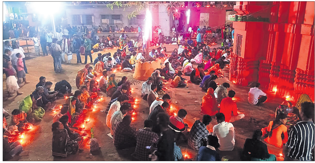
ମହାଦୀପ ଉଠିବାର ପ୍ରଥମ ଦିନ ଉପଲକ୍ଷେ ଶ୍ରଦ୍ଧାଳୁଙ୍କୁ ନିମନ୍ତ୍ରଣ କରାଯାଇଛି।

ମହାଦୀପ ଉଠିବାର ପ୍ରଥମ ଦିନ ବନ୍ଧୁଗଣ, ୧୮୨ (ଡି.ଏନ.ଏ.)