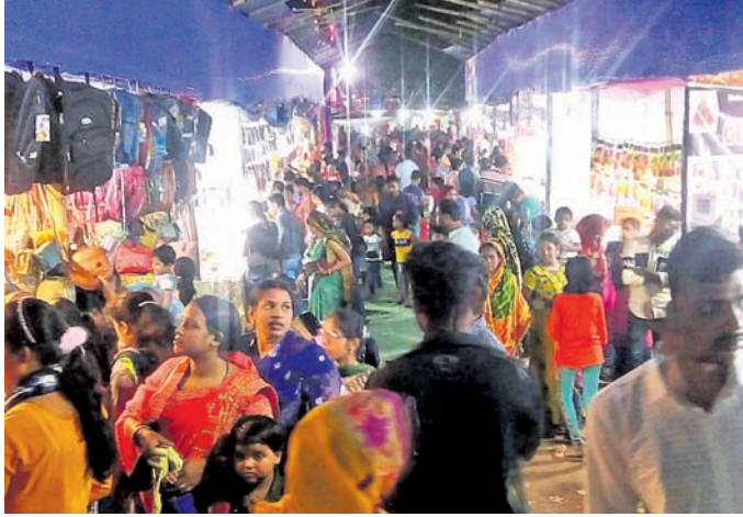
ମାଘମେଳାରେ ଲୋକଙ୍କ ଭିଡ଼ ।

କଣ୍ଠିଲୋ ନୀଳମାଧବ ଜାତକ ମୁଖ୍ୟ ପର୍ବ ଭାବେ ପରିଚିତ ଭୈମୀ ଏକାଦଶୀ ମେଳା ବା ମାଘମେଳା ଗତ ଫେବୃଆରୀ ୧୯ ରୁ ଆରମ୍ଭ ହୋଇଥିଲା । ରବିବାର ଫାଲ୍‌ଗୁନ ଚତୁର୍ଦ୍ଦଶୀ ତିଥିରେ ସେହି ମେଳା ଶେଷ ହେବ । ଏହି ମେଳାରେ ମୁଖ୍ୟତଃ ବିଭିନ୍ନ ଯାତ୍ରା ଦଳ ପକ୍ଷରୁ ନାଟକ ପରିବେଷଣ କରାଯାଇଥିବାରୁ ଭିତ ପରିଲକ୍ଷିତ ହୋଇଥିଲା । ମେଳା ପଡ଼ିଆରେ ଖୋଲିଥିବା ଅଗ୍ରାୟୀ ଦୋକାନରେ ବି ଭିଡ଼ ଲାଗି ରହିଥିଲା । ମେଳାର ଶେଷ ରାତିରେ କୋଣାର୍କ ଗଣନାଟ୍ୟ ନାଟକ ପରିବେଷଣ କରୁଥିବାରୁ ପ୍ରବଳ ଗହଳ ଲାଗି ରହିଛି ।