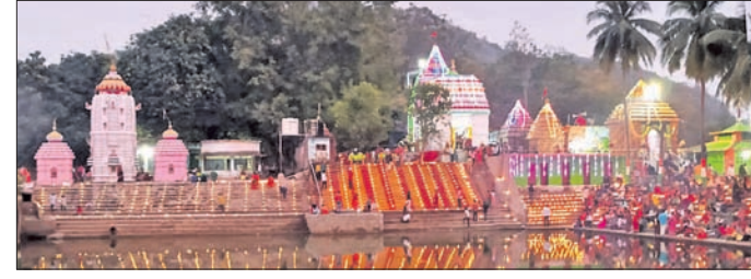
ମହାଶିବରାତ୍ରି ପାଇଁ ଓଡ଼ିଶାରେ ଏକ ଶୈବ ପୀଠକୁ ସଜା ଯାଇଛି ।