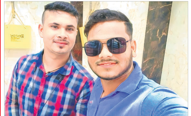
@ ଏମଡି ଭଦ୍ରକ