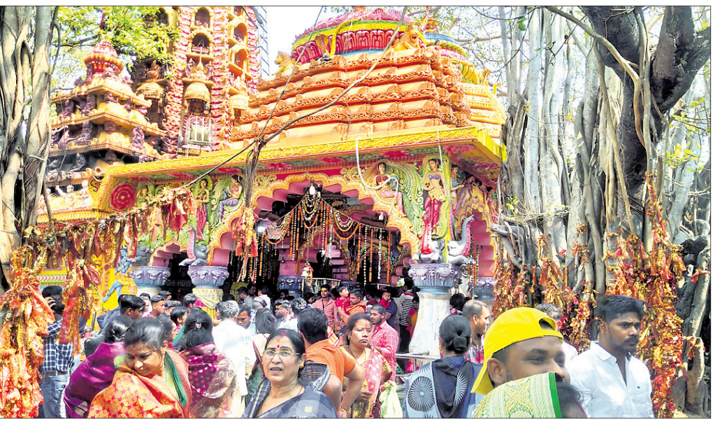
ରଘୁନାଥପୁର, ୧୮୨ (ଡି.ଏନ.ଏ.)