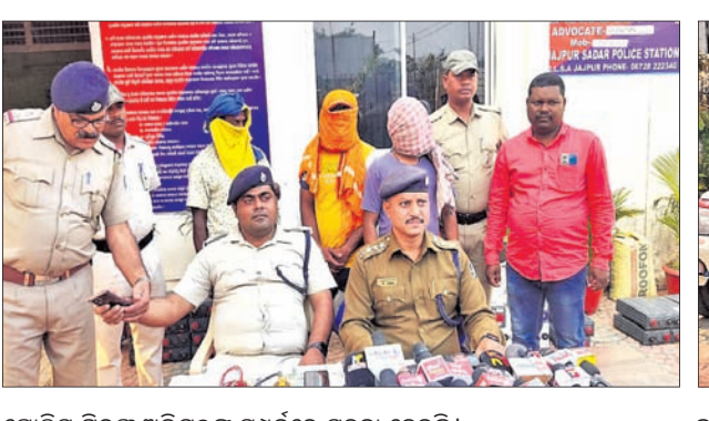
ପୋଲିସ୍ ଗିରଫ ଅଭିଯୁକ୍ତଙ୍କ ସମ୍ପର୍କରେ ସୂଚନା ଦେଇଛି।