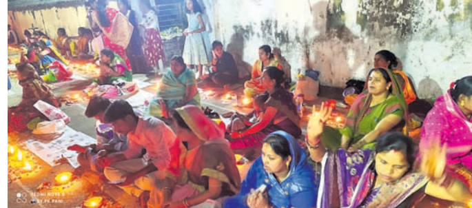
ଶ୍ରଦ୍ଧାଳୁମାନେ ମନ୍ଦିର ବେଢ଼ାରେ ପ୍ରଦୀପ ପ୍ରଜ୍ୱଳନ କରୁଛନ୍ତି ।