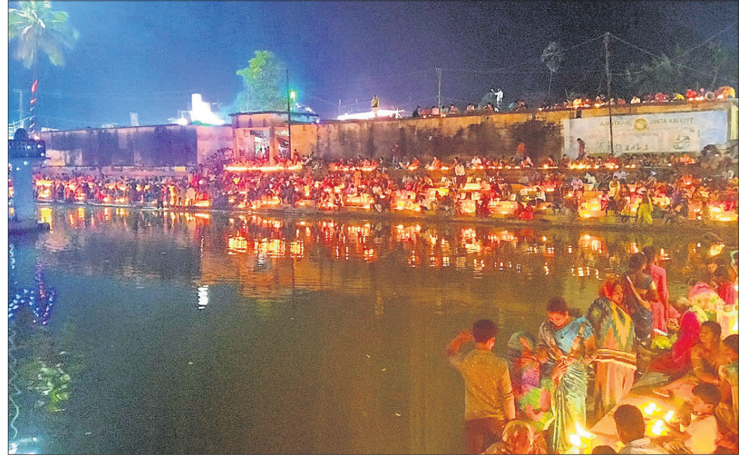
ମନ୍ଦିର ନିକଟସ୍ଥ ପୁଷ୍କରିଣୀ ପାର୍ଶ୍ୱରେ ଶ୍ରଦ୍ଧାଳୁମାନେ ଜାଗର କାଳୁଛନ୍ତି ।