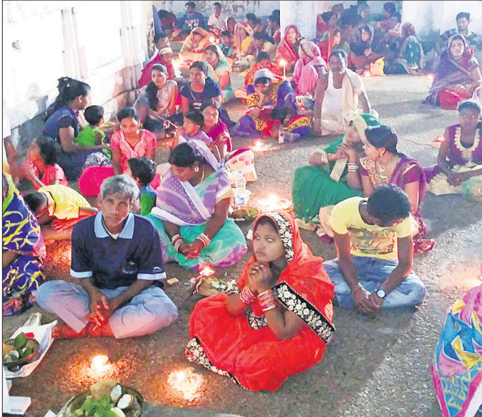
ଖଣ୍ଡପଡ଼ାର ଏକ ଶୈବପୀଠରେ ଶ୍ରଦ୍ଧାଲୁକମାନେ ଜାଗର କାଳିଛନ୍ତି ।

ରଣପୁର ଓ ଏହାର ଆଖପାଖ ଅଞ୍ଚଳ ଗୋପାଳପୁର, ବାନ୍ଦପୁର, ସୁନାଖଳା ଓ ଦର୍ପନାରାୟଣପୁର ଅଞ୍ଚଳରେ ଥିବା ବିଭିନ୍ନ ଶୈବ ପୀଠରେ ଜାଗର ଯାତ୍ରା ପାଳିତ ହୋଇଯାଇଛି । ସବୁଠି ଶ୍ରଦ୍ଧାଲୁକ ଭିଡ଼ ଲାଗି ରହିଥିଲା । ରଣପୁରରେ ବାବା ଚଣ୍ଡେଶ୍ୱର, ସ୍ୱପ୍ନେଶ୍ୱର, ପୁରୁଣାବସନ୍ତର ବାଲୁକେଶ୍ୱର, ମଝିଆଖଣ୍ଡର କମଳେଶ୍ୱର, ତାଳକଣ୍ଡର ବୈଦେଶ୍ୱରଙ୍କ ପୀଠରେ ଶ୍ରଦ୍ଧାଲୁକମାନେ ପୂଜାର୍ଚ୍ଚନା କରିବା ସହିତ ଜାଗର କାଳିଥିଲେ ।