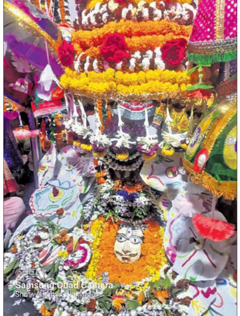
Sanskriti Odia Dharma

ବେଳପାଳର ଧବଳେଶ୍ୱର, ବରୁଣେଶ୍ୱର, ବରହମପୁରରୁ ଲୁଗିକେଶ୍ୱର, ଚାଉଁଡ଼ୋ ଛକରୁ ଆଖଣ୍ଡମଣା ଜୋଇମରା ନାଳକେଶ୍ୱର ଆଦି ପୀଠରେ ମହାସମାରୋହରେ ଶିବରାତ୍ରି ଜାଗର ପାଳନ କରାଯାଇଥିଲା। ଖରିଆଁରୁ ମହାଦେବ ପୀଠରେ ଭକ୍ତମାନେ ନିଆଁ ବାତେଇ ନିଜର ମନଃମାନା ପୂରଣ କରିଥିଲେ। ଏଥିସହ ବିଷ୍ଣୁରପୁର ଅଞ୍ଚଳର ଗଳିକନ୍ଦିରେ ଓ ବୁଝପୁର ପୂଜାପାଠସିବା ମହାଦେବଙ୍କ ନିକଟରେ ଆଖଣ୍ଡମଣା ମେଳା ମଧ୍ୟ ଆୟୋଜନ କରାଯାଇଥିଲା। ମହାଶିବ ରାତ୍ରି ଯେଉଁ ସମସ୍ତ ବିଷ୍ଣୁରପୁର ଅଞ୍ଚଳ ଉତ୍ସବ ପୂର୍ଣ୍ଣ ହୋଇ ପଡ଼ିଥିଲା।