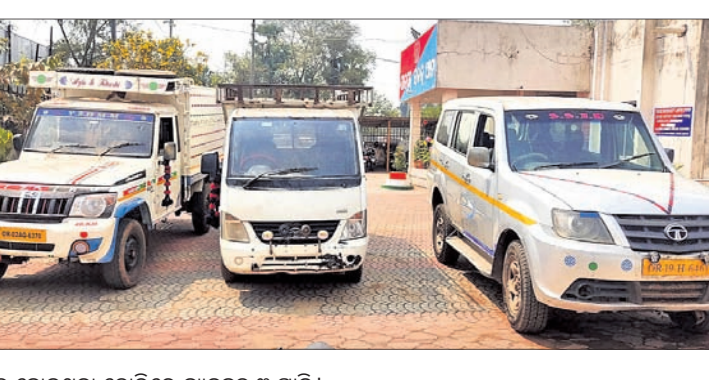
ଜବତ ହୋଇଥିବା ଚୋରିରେ ବ୍ୟବହୃତ ୩ ଗାଡ଼ି।