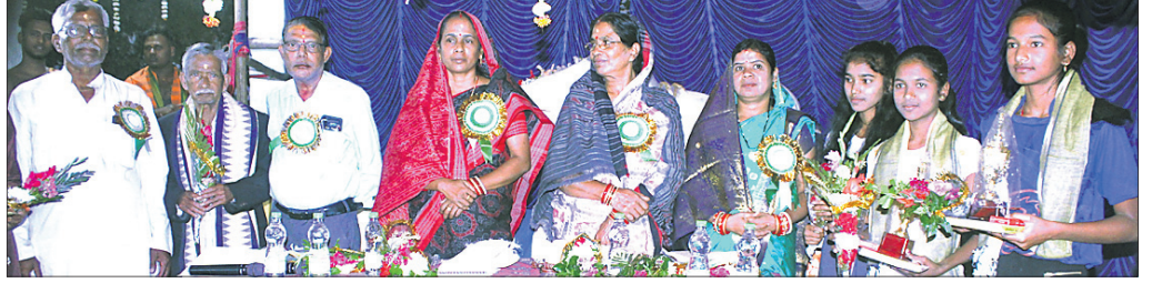
ସମର୍ଥନା ସଭାରେ ଯୋଗଦେଇଥିବା ଅତିଥି ଏବଂ ଅନ୍ୟମାନେ।