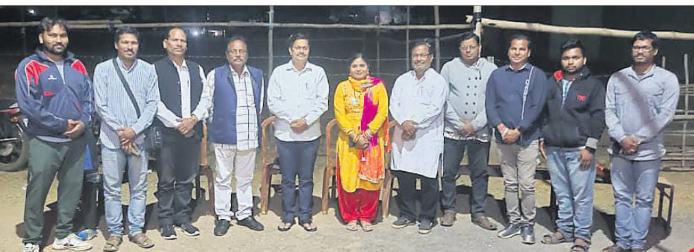
ପ୍ରସ୍ତୁତି ବୈଠକରେ ଯୋଗଦେଇଥିବା ଅତିଥି ।