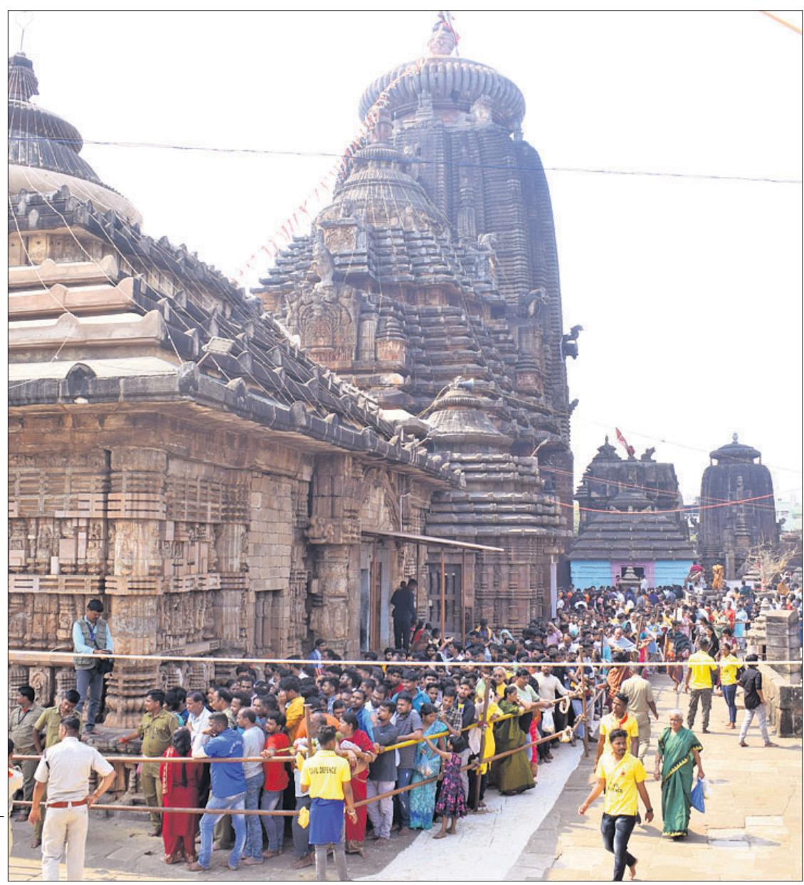
ମହାଶିବରାତ୍ରି ଅବସରରେ ଶନିବାର ଭୁବନେଶ୍ୱର ଲିଙ୍ଗରାଜ ମନ୍ଦିରରେ ଶ୍ରଦ୍ଧାଳୁଙ୍କ ଭିଡ଼।

ବେଲି ଅଭିନେତ୍ରୀ ଅଙ୍କିତା ଲୋଖଣ୍ଡେ ତାଙ୍କ ଗର୍ଭଧାରଣକୁ ନେଇ ହେଉଥିବା ଚର୍ଚ୍ଚାରେ ସେ ଏବେ ମୁହଁ ଖୋଲି ଜବାବ ରଖିଛନ୍ତି।