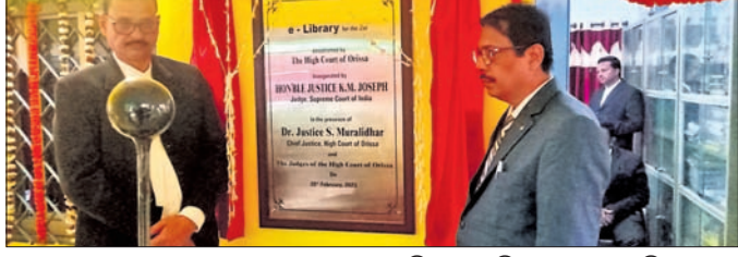
ଇ-ଲାଇବ୍ରେରୀ ଉଦ୍ଘାଟନ ସମୟରେ ଏଡିଜେ ଓ ଓଜିଲ ସଂଘ ସଭାପତି।

ଟିଟିଲାଗଡ଼, ୨୦୧୨ (ଡି.ଏନ.ଏ.): ବଲାଙ୍ଗୀର ଜିଲ୍ଲା ଟିଟିଲାଗଡ଼ କୋର୍ଟ ପରିସରରେ ଇ-ଲାଇବ୍ରେରୀ ଆଭାସୀ ମାଧ୍ୟମରେ ଯୋଜନା ଉଦ୍ଘାଟିତ ହୋଇଯାଇଛି।