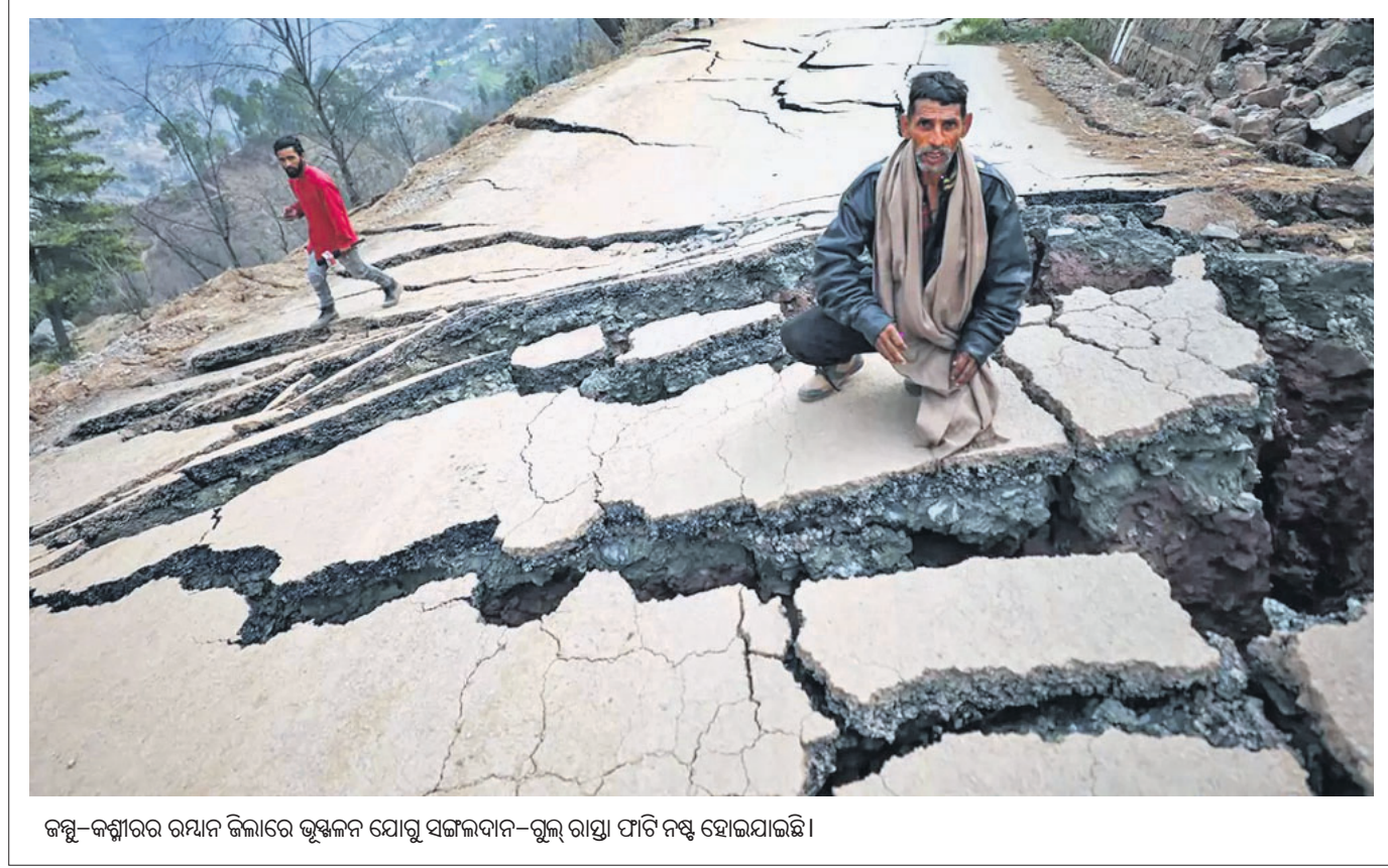
କମ୍ପୁ-କମ୍ପାରର ରଥାନ ଜିଲ୍ଲାରେ ଭୂସ୍ଥଳ ଯୋଗୁ ସଙ୍ଗଳାପାନ-ରୁଲ୍ଲା ରାସ୍ତା ଫାଟି ନଷ୍ଟ ହୋଇଯାଇଛି।