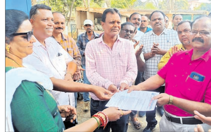
ଜିଲ୍ଲା ମୁଖ୍ୟ ପ୍ରାଣୀ ଚିକିତ୍ସା ଅଧିକାରୀଙ୍କୁ ଦାବିପତ୍ର ।

ସହିତ ଡିସେମ୍ବର କାର୍ଯ୍ୟକ୍ରମ ଗଠନ, ଓଡ଼ିଶା ପ୍ରାଣୀ ଚିକିତ୍ସା ବୈଷୟିକ ଅଧିକାରୀ, କର୍ମଚାରୀଙ୍କ ତାକରାକ୍ରମେ ଅନୁରୋଧ କରିଛନ୍ତି । ରାଜ୍ୟ ଅଣ ଗେଜେଟେଡ୍ ବୈଷୟିକ ପ୍ରାଣୀ ଚିକିତ୍ସା କର୍ମଚାରୀ ସଂଘ ପକ୍ଷରୁ ଭବାନୀପାଟଣାରେ ୫ଦିନୀ ଦାବି ନେଇ ଏକ ଶୋଭାଯାତ୍ରା କରାଯାଇଛି । ଶୋଭାଯାତ୍ରା ଜିଲ୍ଲାପାଳଙ୍କ କାର୍ଯ୍ୟାଳୟକୁ ବାହାରି ସହର ପରିକ୍ରମା କରିଥିଲା । ପରେ ମୁଖ୍ୟମନ୍ତ୍ରୀଙ୍କ ଉଦ୍ଦେଶ୍ୟରେ ଜିଲ୍ଲା ମୁଖ୍ୟ ପ୍ରାଣୀ ଚିକିତ୍ସା ଅଧିକାରୀଙ୍କୁ ଏକ ଦାବିପତ୍ର ପ୍ରଦାନ କରାଯାଇଥିଲା । ଏଥିରେ ତୁରନ୍ତ ବର୍ଷ ଡିସେମ୍ବର ପାଠ୍ୟକ୍ରମ ସହିତ ଡିସେମ୍ବର କାର୍ଯ୍ୟକ୍ରମ ଗଠନ, ଓଡ଼ିଶା ପ୍ରାଣୀ ଚିକିତ୍ସା ବୈଷୟିକ ଅଧିକାରୀ, କର୍ମଚାରୀଙ୍କ ତାକରାକ୍ରମେ ଅନୁରୋଧ କରିଛନ୍ତି । ରାଜ୍ୟ ଅଣ ଗେଜେଟେଡ୍ ବୈଷୟିକ ପ୍ରାଣୀ ଚିକିତ୍ସା କର୍ମଚାରୀ ସଂଘ ପକ୍ଷରୁ ଭବାନୀପାଟଣାରେ ୫ଦିନୀ ଦାବି ନେଇ ଏକ ଶୋଭାଯାତ୍ରା କରାଯାଇଛି । ଶୋଭାଯାତ୍ରା ଜିଲ୍ଲାପାଳଙ୍କ କାର୍ଯ୍ୟାଳୟକୁ ବାହାରି ସହର ପରିକ୍ରମା କରିଥିଲା । ପରେ ମୁଖ୍ୟମନ୍ତ୍ରୀଙ୍କ ଉଦ୍ଦେଶ୍ୟରେ ଜିଲ୍ଲା ମୁଖ୍ୟ ପ୍ରାଣୀ ଚିକିତ୍ସା ଅଧିକାରୀଙ୍କୁ ଏକ ଦାବିପତ୍ର ପ୍ରଦାନ କରାଯାଇଥିଲା । ଏଥିରେ ତୁରନ୍ତ ବର୍ଷ ଡିସେମ୍ବର ପାଠ୍ୟକ୍ରମ