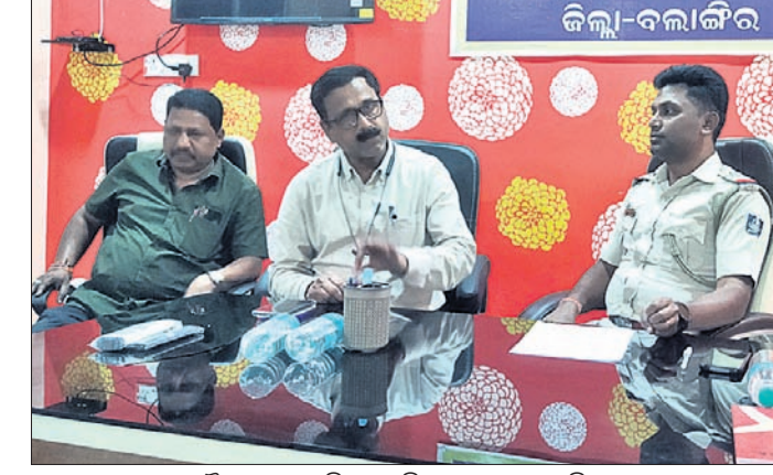
ବୈଠକରେ ଉପସ୍ଥିତ ପୋଲିସ୍ ଅଧିକାରୀ ଓ ଅତିଥି।

ଖମ୍ବ୍ରାଗୋଡ଼, ୨୦୧୨ (ଡି.ଏନ.ଏ.): ଆମ ପୋଲିସ୍ ସମିତି ବୈଠକ ଆଲୋଚନା ହୋଇଥିଲା। ଜନସାଧାରଣ ନିଜ ଅଞ୍ଚଳରେ ଆଇନଶୃଙ୍ଖଳା ନେଇ ବିଭିନ୍ନ ସମସ୍ୟା ଉପସ୍ଥାପନ କରୁଥିଲେ।