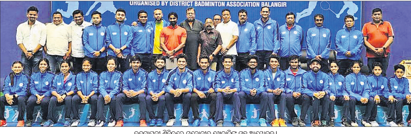
ଉଦ୍ଘାଟନା ଶିବିରରେ ମନୋନୀତ ଖେଳାଳିଙ୍କ ସହ ଆୟୋଜକ।