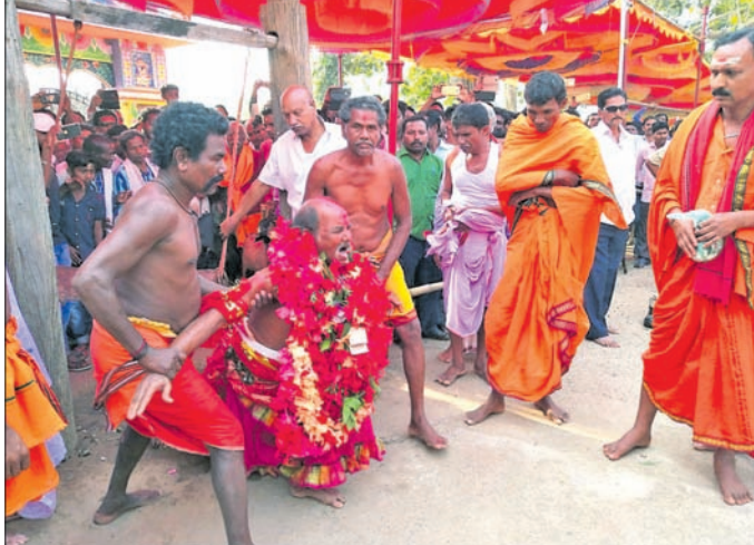
ସପ୍ତମାତୃକା ଶୈବପୀଠରେ ପୂଜା କରାଯାଇଛି ।

କଳାହାଣ୍ଡି ଜିଲ୍ଲା କେସିଙ୍ଗା ବ୍ଲକ୍ ବେଲଖଣ୍ଡିରେ ତେଲ ଉତ୍ତେଜ ନଦୀ ସାଙ୍ଗମସ୍ଥଳରେ ଥିବା ସପ୍ତମାତୃକା ଶୈବପୀଠରେ ସୋମବାର ଶହ ଶହ ପଶୁ ପକ୍ଷୀଙ୍କୁ ବଳି ଦିଆଯାଇଛି । ବଳି ଯୋଗୁ ଶୈବପୀଠ ରକ୍ତ ରକ୍ତ ହୋଇପଡ଼ିଛି । ଓଡ଼ିଶାରେ ଶୈବ ପୀଠରେ ବଳି ଦେବା ପରମ୍ପରା ବିରଳ ହୋଇଥିବା ବେଳେ ଏଠାରେ ଶୈବ ଓ ଶାକ୍ତର ମିଳନ ଦେଖିବାକୁ ମିଳିଛି । ଆଦିବାସୀଙ୍କ ବିଶ୍ୱାସ ଅନୁସାରେ ମହାଶିବରାତ୍ରି ସମୟରେ ଅମାବାସ୍ୟା ପରବର୍ତ୍ତୀ ଦିନ ଏଠାରେ ବଳି ଦେବା ପ୍ରଥା ରହିଛି । ସକାଳୁ ପୂଜାର୍ଚ୍ଚନା ପରେ ଧବଳେଶ୍ୱର ମନ୍ଦିରରୁ ଚଣ୍ଡୀ କାଳସାଳୁ କାନ୍ଧରେ ବୋହି ଦେବ ପୂଜା ପର୍ଯ୍ୟନ୍ତ ଅଣାଯାଇଥିଲା । ଦେବ ମୁହାଣରେ ପ୍ରଥମେ କଳାହାଣ୍ଡି ରାଜାଙ୍କ ଦ୍ୱାରା ପ୍ରେରିତ ବୋଦାକୁ ବଳି ଦିଆଯାଇଥିଲା । ପରମ୍ପରା ଅନୁଯାୟୀ କଳାହାଣ୍ଡି, ବଳାଙ୍ଗୀର, ବୌଦ୍ଧ ଓ ପୁଲକାଶୀର ଅଠର ମାଝି ଷୋହଳ ପ୍ରଧାନୀ ଆଦିବାସୀମାନଙ୍କଠାରୁ ଅନୁଆ ବାଜଳ, ଫୁଲ, ସିନ୍ଦୂର ଓ ଗାଞ୍ଜିଆ ଆଦିବାସୀ ପରେ ସିକେଶ୍ୱରୀ ପୀଠରେ ପୂଜା କରାଯାଇଥିଲା । ସେହିଭଳି ଗୁରୁତ୍ୱରେ ଆଦିବାସୀ ନିଶାନରେ ଦେବା ଦିବିବା ପରେ କଷ୍ଟା ଦୋଳିରେ ଖେଳିଥିଲେ । ପରେ ଚଣ୍ଡୀଙ୍କଠାରେ ମନଃମାନା