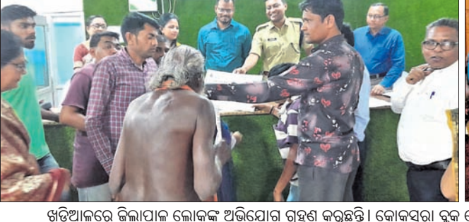
ଖଡ଼ିଆଳରେ ଜିଲ୍ଲାପାଳ ଲୋକଙ୍କ ଅଭିଯୋଗ ଗ୍ରହଣ କରୁଛନ୍ତି । କୋକସରା ବ୍ଲକ୍ ରେଙ୍ଗାଳପାଲି ପଞ୍ଚାୟତ ରାଜାବ ଗାନ୍ଧୀ ସେବାକେନ୍ଦ୍ରରେ ଆୟୋଜିତ ଜନ ଶୁଣାଣୀ ଶିବିର ।