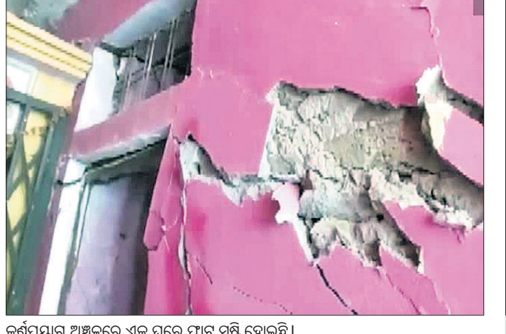
କର୍ଣ୍ଣପ୍ରୟାଗ ଅଞ୍ଚଳରେ ଏକ ଘରର ଫାଟ୍ ସୃଷ୍ଟି ହୋଇଛି।