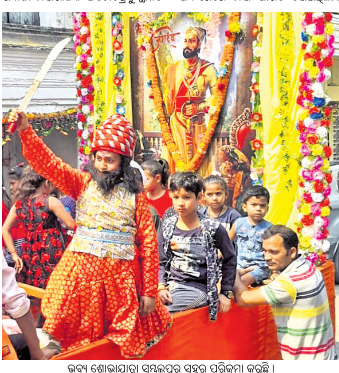
ଭବ୍ୟ ଶୋଭାଯାତ୍ରା ସମ୍ବଲପୁର ସହର ପରିକ୍ରମା କରୁଛି।

ସମ୍ବଲପୁର, ୨୦୧୨ (ବ୍ୟୁରୋ) ଛତ୍ରପତି ଶିବାଜୀ ମହାରାଜ ଜୟନ୍ତୀ ଉପଲକ୍ଷେ ଭବ୍ୟ ଶୋଭାଯାତ୍ରା ସମ୍ବଲପୁର ପରିକ୍ରମା କରିଛି। ସମ୍ବଲପୁର ସହର ହାଟପଡ଼ାଠାରୁ ଗୁଲୁମା ମରାଠା ସମାଜ ଓ ବୀର ବଜରଜ ସଂଘ ପକ୍ଷରୁ କାର୍ଯ୍ୟକ୍ରମ ହୋଇଥିଲା। ପୁସ୍ତକ ବିନାମରେ ଛତ୍ରପତି ଶିବାଜୀ ମହାରାଜଙ୍କ ପଠାଟିକ୍ରମ ଗୁଲୁମା ନୁବକ ଓ ବାଳକମାନେ ଶୋଭାଯାତ୍ରାରେ ସାମିଲ ହୋଇଥିଲେ। ଶୋଭାଯାତ୍ରା ହାଟପଡ଼ାଠାରୁ ବାହାରି ବଡ଼ସଡ଼କ, ସାନସଡ଼କ ହାଟପଡ଼ାଠାରେ ଗୁଲୁମା ମରାଠା ସମାଜ ଓ ବୀର ବଜରଜ ସଂଘ ଓ ମରାଠା ସମାଜର ସଭ୍ୟମାନେ ସାମିଲ ଥିଲେ। ଏହି ଶିବାଜୀ ମହାରାଜଙ୍କ ପଠାଟିକ୍ରମ ଗୁଲୁମା ନୁବକ ଓ ବାଳକମାନେ ଶୋଭାଯାତ୍ରାରେ ସାମିଲ ହୋଇଥିଲେ। ଏଥିରେ ବୀର ବଜରଜ ସଂଘ ଓ ମରାଠା ସମାଜର ସଭ୍ୟମାନେ ସାମିଲ ଥିଲେ। ଏହି ଅବସରରେ ମହା ଆରତି ହୋଇଥିଲା।