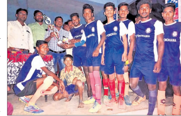
ଚାମ୍ପିୟନ ଦଳ ଖେଳାଳିମାନେ ଅତିଥିଙ୍କୁ ଚୁପ୍ ଗ୍ରହଣ କରୁଛନ୍ତି।

ପୂରିବାହାଲ, ୨୦୧୨ (ଡି.ଏନ.ଏ.): ବଲାଙ୍ଗୀର ଜିଲ୍ଲା ପୂରିବାହାଲ ବୁକ୍ସପ୍ରାୟ ମୁକ୍ତ ସଂଗଠନ ତରଫରୁ ପ୍ରଥମ ବାର୍ଷିକ ପାଠଶାଳା ପୁସ୍ତକ ଚୁପ୍ ଗ୍ରହଣ କରାଯାଇଛି।