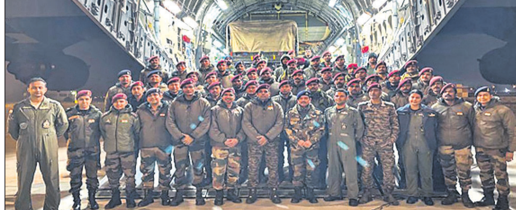
ତୁର୍କୀରେ 'ଅପରେଶନ୍ ଦୋସ୍ତ'ରେ ସାମିଲ ଆର୍ମି ମେଡିକାଲ ଚିଫ୍ ସୋମବାର ଗାଜିଆବାଦସ୍ଥିତ ହିଷ୍ଟୋନ ଏୟାରବେସ୍ରେ ପହଞ୍ଚିଲେ।