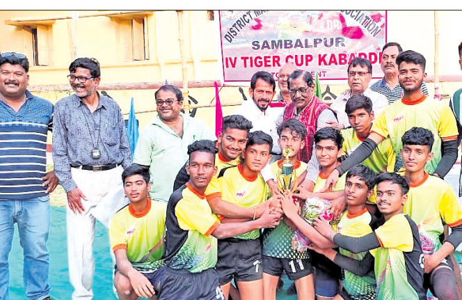
ପ୍ରତି ସହ ବିଜୟ ଦଳ।

ସମ୍ବଲପୁର, ୨୦୧୨ (ବ୍ୟୁରୋ) ସମ୍ବଲପୁର ଜିଲ୍ଲା ବର୍ଷିୟାନ ଗ୍ରାହୀ ସଂଘ ଆୟୋଜିତ ଗଜଗର କପ କବାଡି ଚୁନାମଣିରେ ଗୁରୁନାନକ ପଢ଼ିକ ସ୍କୁଲ