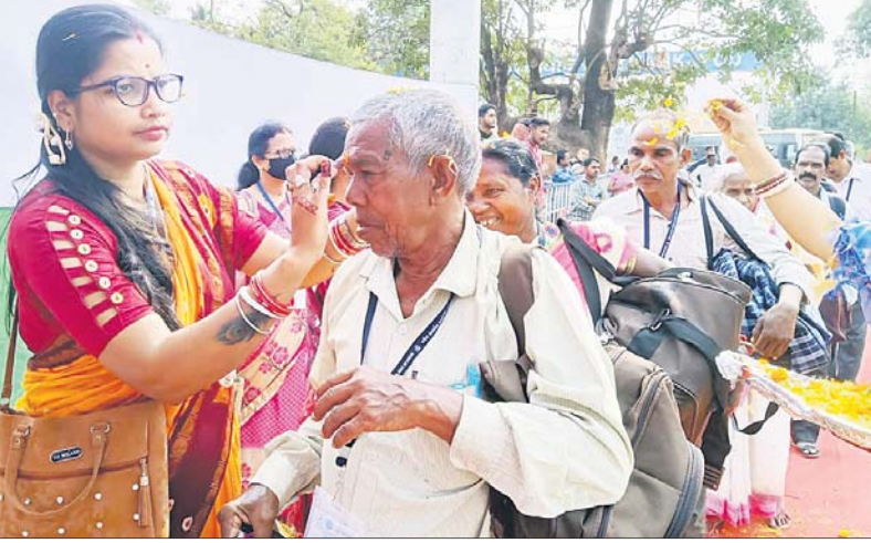
ତୀର୍ଥଯାତ୍ରୀଙ୍କୁ ଫୁଲ ଓ ଚନ୍ଦନ ଦେଇ ସ୍ୱାଗତ କରାଯାଉଛି ।