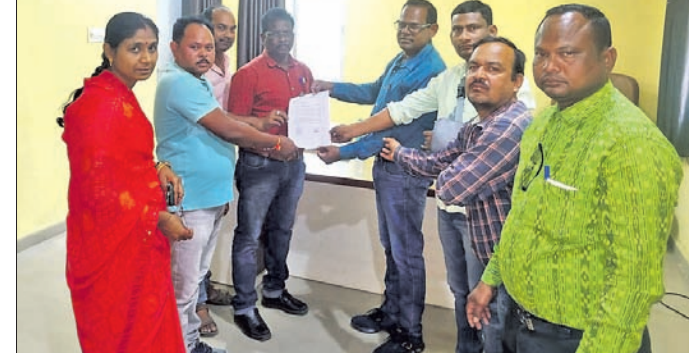
ଦାବିପତ୍ର ପ୍ରଦାନ କରାଯାଇଛି ।