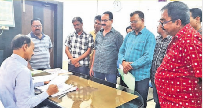
ଅତିରିକ୍ତ ଜିଲ୍ଲାପାଳଙ୍କୁ ଦାବିପତ୍ର ପ୍ରଦାନ କରାଯାଇଛି।

ସମ୍ବଲପୁର, ୨୦୧୨ (ବ୍ୟୁରୋ) ସମ୍ବଲପୁର ମହାନଗର ନିଗମ ୩୯୯.୯୯ ଖର୍ଚ୍ଚକାରୀ ସୋମବାର ଜିଲ୍ଲା ପ୍ରଶାସନର ଦ୍ୱାରକୁ ହୋଇଛି। ସିଟି ଷ୍ଟେସନଠାରୁ ଠେମରା ଗ୍ରାମ ଦେଇ ପୁରୁଣା ରାସ୍ତା ପର୍ଯ୍ୟନ୍ତ ଆରୁଡ଼ି ରାସ୍ତା ମରାମତି କରିବାକୁ ଦାବି କରିଛନ୍ତି। ସେମାନେ ଅଭିଯୋଗ କରିଛନ୍ତି, ଏହି ରାସ୍ତା ଉପରେ ଠେମରା ଗ୍ରାମ ସହିତ କୁଡ଼ିଆ, ଗୁଡ଼ିଆ, ତରକା, ପରମାଣପୁର, କୁକୁଡ଼ାପାଲି, ଶିଳିପାପାଲି, ବରଷାପାଲି ଆଦି ଅଞ୍ଚଳର ଲୋକମାନେ ନିର୍ଭର କରନ୍ତି। ଏହି ରାସ୍ତା ମରାମତି ହେଲେ ଅଞ୍ଚଳବାସୀଙ୍କୁ ସହର ସହିତ ହାରାକୁଦ ଓ ବୁଲି ମେଡିକାଲ ଯିବାଆସିବାରେ ସୁବିଧା ହେବ। ଠେମରା ସ୍କୁଲ ଓ କଲେଜ ଛାତ୍ରଛାତ୍ରୀ ମଧ୍ୟ ଉପକୃତ ହୋଇପାରିବେ। ତେଣୁ ଭୁବନେଶ୍ୱର ରାସ୍ତା ମରାମତି କରିବାକୁ ଅତିରିକ୍ତ ଜିଲ୍ଲାପାଳଙ୍କୁ ଦାବିପତ୍ର ଦେଇଥିଲେ।