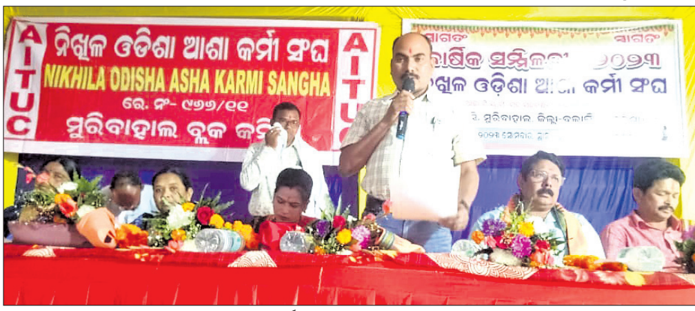
ପୂରିବାହାଲ ଗୋଷ୍ଠୀ ସ୍ୱାସ୍ଥ୍ୟକେନ୍ଦ୍ରରେ ନିଆଯାଇଥିଲା। ଏଥିପାଇଁ ନାରୀ ସଂଗଠିତ ହୋଇ କାର୍ଯ୍ୟ କରିବାକୁ ଆହ୍ୱାନ ଦିଆଯାଇଥିଲା। ଏହି ଅବଲମ୍ବନ କରାଯାଉଥିବା ଆଗାମୀ ଦିନରେ ଜିଲ୍ଲାପାଳ କାର୍ଯ୍ୟାଳୟ, ବିଧାନସଭା ଘେରାଉ ପାଇଁ ନିଷ୍ପତ୍ତି ନିଆଯାଇଥିଲା।

ବଲାଙ୍ଗୀର ଜିଲ୍ଲା ବୁକ୍ସପ୍ରାୟ ଆଶା କର୍ମୀ ବାର୍ଷିକ ସମ୍ମିଳନୀ ଯୋଜନା ହେବା କଳ୍ୟାଣ ମଣ୍ଡପରେ ଅନୁଷ୍ଠିତ ହୋଇଯାଇଛି। ନିଖୁଳ ଓଡ଼ିଆ ଆଶାକର୍ମୀ ସଂଘ ଓ ଗୋଷ୍ଠୀ ସ୍ୱାସ୍ଥ୍ୟ କମିଟି ପୂରିବାହାଲ ରୁକ୍ମିଣୀ ପ୍ରାୟୋଗୀ ଶିବିରରେ ଆୟୁର୍ବେଦ ଶିକ୍ଷା ପ୍ରଦାନ କରାଯାଇଥିଲା।