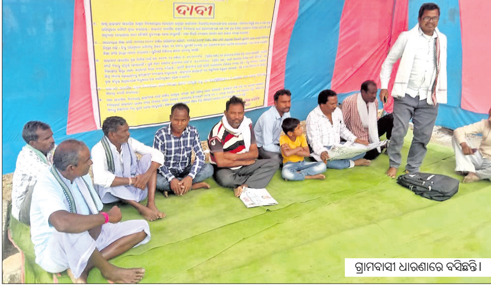
ଗ୍ରାମବାସୀ ଧାରଣାରେ ବସିଛନ୍ତି ।