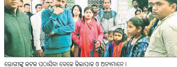
ରୋଗୀଙ୍କୁ କଟକ ପଠାଯିବା ବେଳେ ଜିଲ୍ଲାପାଳ ଓ ଅନ୍ୟମାନେ।

ବୌଦ୍ଧ, ୨୧.୧.୨୩ (ସ.ପ୍ର.): ପଠାଯାଇଥିବା ଜଣାଯାଇଛି। ମଙ୍ଗଳବାର ପ୍ରତ୍ୟୁଷରେ ଜିଲ୍ଲାପାଳ ପୁଷ୍ପ ଚିକିତ୍ସାକର ପରିସରରେ ପଞ୍ଚିତ୍ୱ ଚିକିତ୍ସିତ ହେଉଥିବା ୫ ଜଣ ଶିଶୁଙ୍କୁ ଉନ୍ନତ ଚିକିତ୍ସା ପାଇଁ ଜିଲ୍ଲା ପ୍ରଶାସନ କରାଇଥିଲେ। ୫ ଜଣ ଶିଶୁଙ୍କ ମଧ୍ୟରୁ ୪ ଜଣଙ୍କୁ ଶିଶୁଭବନକୁ ପଠାଯାଇଛି। ଜିଲ୍ଲାପାଳ ସତ୍ୟ ରଞ୍ଜନ ସାହୁଙ୍କ ନିର୍ଦ୍ଦେଶକ୍ରମେ ଏହି ଶିଶୁମାନଙ୍କୁ ପଠାଯାଇଥିବା ଜଣାଯାଇଛି।