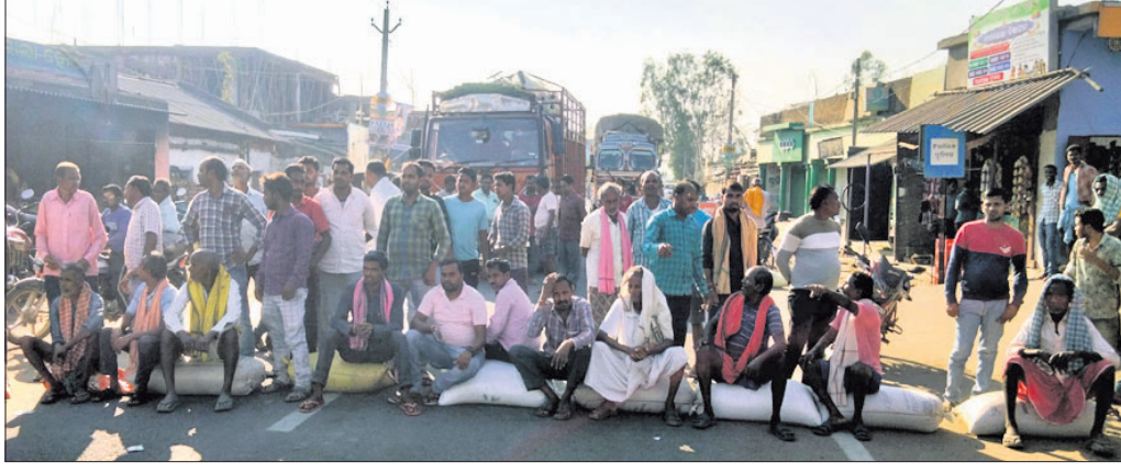
ଚାଷୀମାନେ ରାସ୍ତାରେକୋରୁ ହଟିବୁ ନାହିଁ ବୋଲି ଅଭିଯୋଗ କରିଛନ୍ତି।