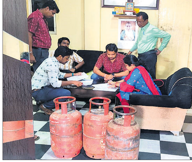
ଯୋଗାଣ ବିଭାଗ ଅଧିକାରୀ ମାନେ ହୋଟେଲରେ ଯାଞ୍ଚ କରୁଛନ୍ତି।