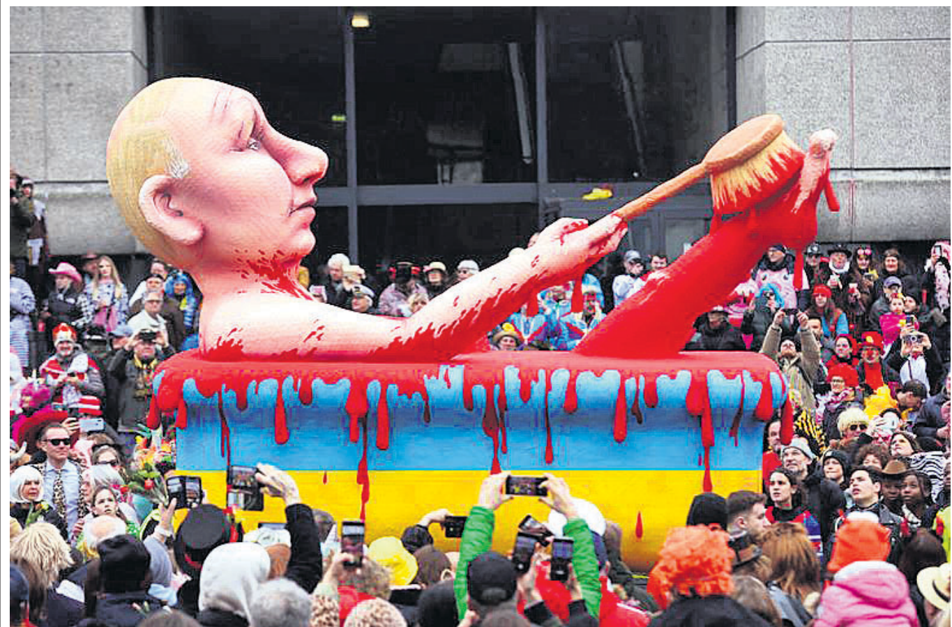
ଜର୍ମାନୀର ଡସେଲଡୋର୍ଫରେ ଆୟୋଜିତ ଏକ କାର୍ନିଭାଲ ପରେ ଉପସ୍ଥିତ ରାଷ୍ଟ୍ରପତି ଭାଉତିମିର ପୁଟିନ୍ ରଭୁସାନ କରୁଥିବା ଭଳି ଦୃଶ୍ୟକୁ ସ୍ଥାନିତ କରାଯାଇଛି।

ଜନ୍ମିତ ରଶ୍ମିତିଙ୍କୁ ଧରାଇଦେଲେ ବହୁ କୋଟି ଟଙ୍କା ପୁରସ୍କାର ଦିଆଯିବ ବୋଲି ଘୋଷଣା କରାଯାଇଥିଲା। ଫଳରେ ୯ ବର୍ଷ ଯାଏ ଔପନ୍ୟାସିକ ବ୍ରିଟିଶ ପୋଲିସ ପୁରସ୍କାରେ ଲୁଚି ରହିଥିଲେ। ୯୦ ଦଶକ ଶେଷ ଭାଗରେ ଇରାନ ରାଷ୍ଟ୍ରପତି ମହମ୍ମଦ ଖାତମି ଫତ୍ୱାଠାରୁ ନିଜକୁ ଦୂରେଇ ରଖିଥିଲେ। ତେବେ ଫତ୍ୱାକୁ ପ୍ରତ୍ୟାହାର କରାଯାଇ ନାହିଁ ବୋଲି ପରବର୍ତ୍ତୀ ସୁପ୍ରିମ କିରୀ ଆଇଡୋଲ ଅଲି ଖୋମେନି କହିବା ପରେ ୨୦୧୯ରେ ତାଙ୍କୁ ବୁଲ୍ଡେଇଁ ସମ୍ବେଷ୍ଟ କରାଯାଇଥିଲା।