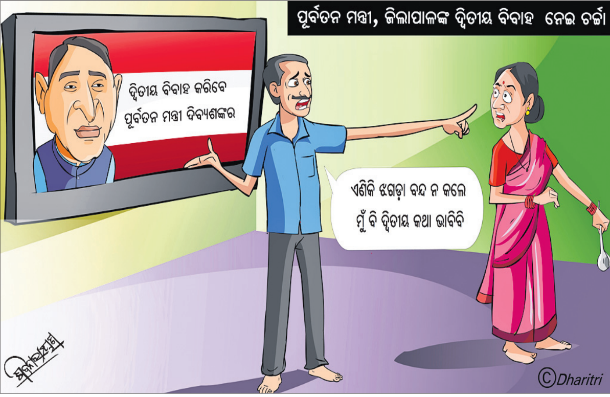
ପୂର୍ବତନ ମନ୍ତ୍ରୀ, ଜିଲ୍ଲାପାଳଙ୍କ ଦ୍ୱିତୀୟ ବିବାହ ନେଇ ଚର୍ଚ୍ଚା

ଏଣିକି ଝଗଡ଼ା ବନ୍ଦ ନ କଲେ ମୁଁ ବି ଦ୍ୱିତୀୟ କଥା ଭାବିବି