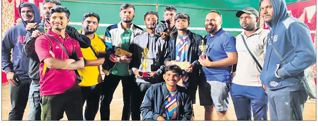
କୃତୀ ଖେଳାଳିଙ୍କୁ ପୁରସ୍କୃତ କରାଯାଇଛି।