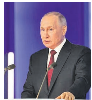
ଫୋଟୋଗ୍ରାଫ ଆସେମ୍ବ୍ଲିରେ ରୁଷିଆ ରାଷ୍ଟ୍ରପତି ଭ୍ଲାଡିମିର ପୁଟିନ୍ ।

ରୁଷିଆ ରାଷ୍ଟ୍ରପତି ଭ୍ଲାଡିମିର ପୁଟିନ୍ ଆମେରିକା ସହ ସ୍ୱାକ୍ଷରିତ ଶେଷ ଆଣବିକ ଅସ୍ତ୍ର ନିୟନ୍ତ୍ରଣ ଚୁକ୍ତିକୁ ମଙ୍ଗଳବାର ରଦ୍ଦ କରିଦେଇଛନ୍ତି । ଏଥିସହ ନୂଆ ଭୃତ୍ୟୁଗୁଡ଼ିକ ରଣନୈତିକ ଆଣବିକ ଅସ୍ତ୍ରଗୁଡ଼ିକୁ ମୁକ୍ତ ପାଇଁ ପ୍ରସ୍ତୁତ କରି ରଖିଥିବା ନେଇ ଓଡ଼ିଶାରେ ସେ ଧମକ ଦେଇଛନ୍ତି ।