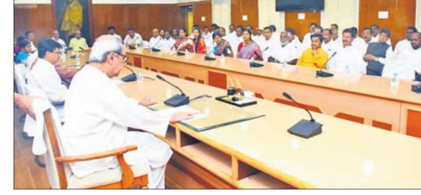
ମୁଖ୍ୟମନ୍ତ୍ରୀ ନବୀନ ପଟ୍ଟନାୟକଙ୍କ ଅଧ୍ୟକ୍ଷତାରେ ବିଧାନସଭାରେ ୫୪ ନମ୍ବର ପ୍ରକୋଷ୍ଠରେ ଆୟୋଜିତ ବିଚ୍ଚେଟି ବିଧାୟକ ଦଳ ବୈଠକ।