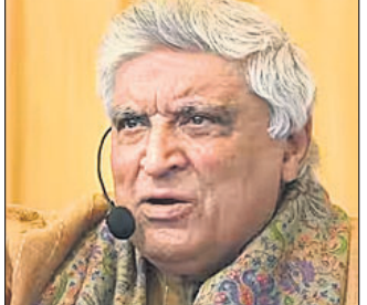
କିପି ଅକ୍ଷତର, ଆମେ ପରସ୍ପରକୁ ଦୋଷ ଦେବା ଉଚିତ ନୁହେଁ, କାରଣ ଏହାଦ୍ୱାରା ସମସ୍ୟାର ସମାଧାନ ହେବ ନାହିଁ। ଉତ୍ତରଜନପୂର୍ଣ୍ଣ ବାତାବରଣକୁ ଶାନ୍ତ କରିବାକୁ ହେବ ଶ୍ରେଣୀଗାମନେ ଅଖତରଙ୍କୁ କହିବାକୁ ସେ ଉପରୋକ୍ତ ମନ୍ତବ୍ୟ ଦେଇଥିଲେ। ଅଖତର

ଲାହୋର, ୨୧/୨ ୨୬/୧୧ ମୁମ୍ବାଇ ଆକ୍ରମଣକାରୀ ଆକ୍ରମଣର ଅପରାଧୀମାନେ ପାକିସ୍ତାନରେ ଅବାଧରେ ବିଚରଣ କରୁଛନ୍ତି ବୋଲି କିପି ଓ ଗାଡିକାର ଜାଭେଦ ଅଖତର ଲାହୋରରେ ଏକ କାର୍ଯ୍ୟକ୍ରମରେ ଘୋର ଦେଇ କହିଛନ୍ତି। ଉର୍ଦ୍ଦୁ କିପି ଫଏଜ ଅହମ୍ମଦ ଫଏଜଙ୍କ କୁଟିରେ ଆୟୋଜିତ ସମ୍ମତ ଫଏଜ ଉପରେ ଭିଡ଼ି ଓ ଭାଇରାଲ ହୋଇଛି। ଏଠାରୁ ଶାନ୍ତିର ବାଣୀ ନେଇ ଯିବା ସହ ପାକିସ୍ତାନ ଏକ ସକାରାତ୍ମକ, ବହୁପୂର୍ଣ୍ଣ ଓ ପ୍ରିୟ ଦେଶ ବୋଲି ଭାରତୀୟମାନଙ୍କୁ କହିବାକୁ ଶ୍ରେଣୀଗାମନେ ଅଖତରଙ୍କୁ କହିବାକୁ ସେ ଉପରୋକ୍ତ ମନ୍ତବ୍ୟ ଦେଇଥିଲେ। ଅଖତର