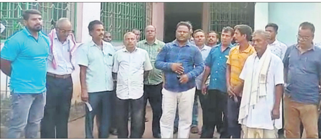
ପିପୁଲ୍ସ ପାକ୍ କାର୍ଯ୍ୟକ୍ରମ ଆଗରେ ଚାଷୀମାନେ ଧାରଣା ଦେଇଛନ୍ତି।