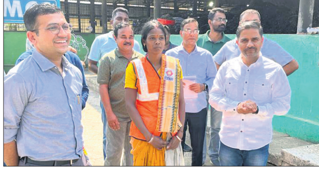
ବିଏମ୍ପି ପକ୍ଷରୁ ସ୍ୱଚ୍ଛତା ପୂଜା ଦିନକୁ ସଫର୍ଦ୍ଦିତ କରାଯାଇଛି।

ଫଟୋ ପାଖରେ ଗଦା ହୋଇଥିବା ଦେଖି ଏବଂ ଅନ୍ୟାନ୍ୟ ସାମଗ୍ରୀ ସମେତ ଚେନ୍‌କୁ ନେଇ ସେ ଘର ଡେଇଁବାକୁ ଚାହୁଁଥିଲେ। ପରେ ତତ୍ତ୍ୱବିତ୍‌ଙ୍କୁ ଅଳିଆ ବିଏମ୍ପି ସଫେଇ ଗାଡ଼ି ଏବଂ ଚନ୍ଦ୍ରଶେଖରପୁରସ୍ଥିତ ଏମ୍‌ଏସ୍‌ଏ ଯାଇଥିଲା। ବିଭୂତି ଚେନ୍ ପାଇଁ ଖୋଜିବାବେଳେ ଭୁଲବଶତଃ ଅଳିଆ ସମେତ ଚେନ୍‌କୁ ଡେଇଁବାକୁ ଚାହୁଁଥିଲେ। ପରେ ପକ୍ଷରୁ ଚେନ୍‌କୁ ଡେଇଁବାକୁ ଅନୁମତି ଦିଆଯାଇଥିଲା। ଏପରେ ପୂଜା ଏମ୍‌ଏସ୍‌ଏରେ ଅଳିଆ ପୂଜାକାରଣ କରିବା ସମୟରେ ଏହି ଚେନ୍‌କୁ ପାଇଥିଲେ। ସେ ଏନେଇ ଉପରିସ୍ଥ ଅଧିକାରୀଙ୍କୁ ଜଣାଇବା ପରେ ବିଭୂତିଙ୍କୁ ଯୋଗାଯୋଗ କରାଯାଇ ଚେନ୍‌କୁ ଫେରାଇ ଦିଆଯାଇଛି। ପୂଜାକାର ଏଭଳି କାର୍ଯ୍ୟ ପାଇଁ ତାଙ୍କୁ ମେୟର, କମିଶନର, ଅତିରିକ୍ତ କମିଶନର ଏବଂ ଅନ୍ୟ ଅଧିକାରୀମାନେ ସଫର୍ଦ୍ଦିତ କରିବା ସହ ସାଧୁତା ଜଣାଇଥିଲେ।