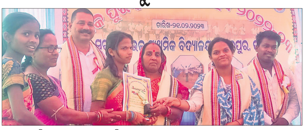
ଜଣେ ଛାତ୍ରୀଙ୍କୁ ଅତିଥିମାନେ ପୁରସ୍କାର ପ୍ରଦାନ କରୁଛନ୍ତି।