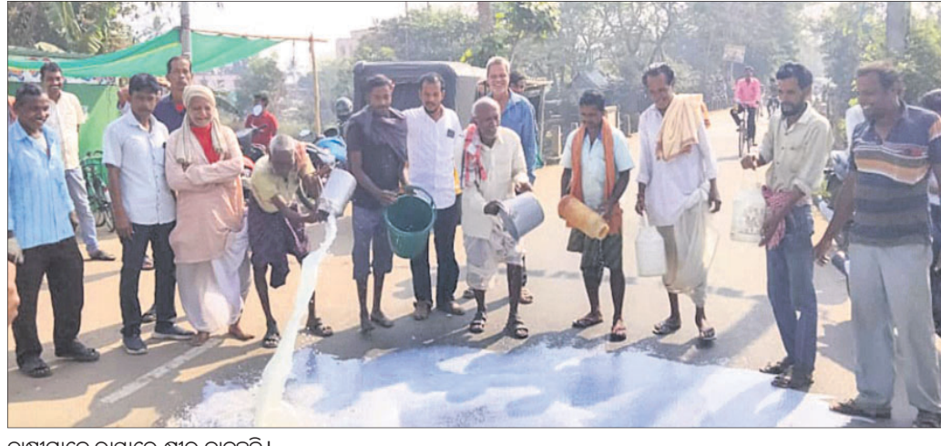
ରାସ୍ତାମାନେ ରାସ୍ତାରେ କ୍ଷୀର ଭାଳୁଛନ୍ତି।

ମାହାଙ୍ଗା/ନିଷ୍ଠିତକୋଇଲି, ୨୧।୨(ସ.ପ୍ର.) କଟକ ଜିଲ୍ଲା ମାହାଙ୍ଗା ବ୍ଲକ ଅନ୍ତର୍ଗତ ଏରକଣା ବଜାରରେ ମଙ୍ଗଳବାର ଓମ୍‌ଫେଡ଼ର ଦୁଗ୍ଧଚାଷୀମାନେ ରାସ୍ତାରେ କ୍ଷୀର ଭାଳି ପ୍ରତିବାଦ କରିଛନ୍ତି। ସେମାନଙ୍କ ଅଭିଯୋଗ ଅନୁଯାୟୀ, ଏବେ ଖୋଲା ବଜାରରେ ଗୋଷାଦାୟ, ଔଷଧ ଆଦି ମୂଲ୍ୟ ଦ୍ୱିଗୁଣିତ ହୋଇଯାଇଛି। ଏସବୁ ଅଧିକ ଦରରେ କିଣିବାକୁ ପଡୁଥିବାରୁ କର୍ମ ଦାମରେ କ୍ଷୀର ବିକ୍ରି କରିବାକୁ ପଡୁଛି। ଦୁଗ୍ଧ ସଂଗ୍ରହ