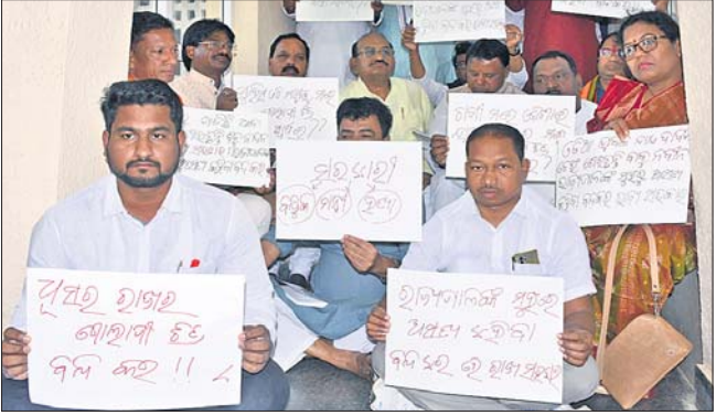
ବିଧାନସଭା ପରିସରରେ ମଙ୍ଗଳବାର ଧାରଣାରେ ବସିଥିବା ଭାଜପା ବିଧାୟକମାନେ।