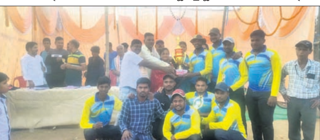
ଚାମ୍ପିୟନ ଦଳକୁ ଅଭିନୂତନ ପୁରସ୍କୃତ କରୁଛନ୍ତି।

ପରଜଙ୍ଗ ବ୍ଲକ୍ ସରାଙ୍ଗ ପଞ୍ଚାୟତ ଗଠିଆ ଗ୍ରାମସ୍ଥିତ ପିତାବଳୀ ଖେଳପଡ଼ିଆରେ ବିଭିନ୍ନ କ୍ରିକେଟ କ୍ଲବ୍ ଆନୁକୂଲ୍ୟରେ ଚାମ୍ପିୟନ୍ କ୍ରିକେଟ ଟୁର୍ନାମେଣ୍ଟ ରୁଧିର ଚାମ୍ପିୟନ୍ ହୋଇଯାଇଛି।