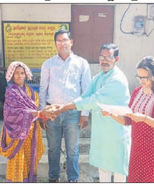
ବାପୁର ପଞ୍ଚାୟତର ବିଭିନ୍ନ ଗ୍ରାମରେ ଚିଆଁ ବଣ୍ଟନ। ଆଠମଲିକ ବ୍ଲକ୍ ମାଧପୁର ବନାଞ୍ଚଳ ଅଧୀନ ମାଧପୁର ଗ୍ରାମଠାରେ ବୁକୁଡ଼ା ଚିଆଁ ବଣ୍ଟନ।

ଆଠମଲିକ ବନଖଣ୍ଡ ମାଧପୁର ବନାଞ୍ଚଳ ଅଧୀନ ମାଧପୁର ଗ୍ରାମଠାରେ ରୁଧିର ବାଡ଼ି ଅରଣ୍ୟରେ ବୁକୁଡ଼ା ଚାଷ ନିମନ୍ତେ ୯ଟି ପଞ୍ଚାୟତର ୫୧ ଜଣ ହିତାଧିକାରୀଙ୍କୁ ୨୫ଟି ଲେଖାଏଁ ବୁକୁଡ଼ା ଚିଆଁ ବଣ୍ଟନ କରାଯାଇଛି।