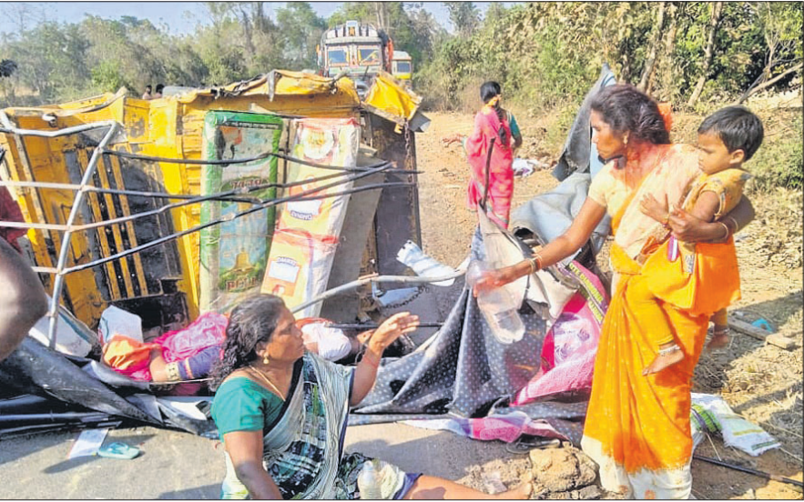
ଗୋଲପଦର ଗ୍ରାମ ନିକଟରେ ରୁଧିରା ଟ୍ରକ୍ ଧକ୍କାରେ ଦୁର୍ଘଟଣାର ଶିକାର ହୋଇଥିବା ଅଟୋ ଓ ଯାତ୍ରୀ ।