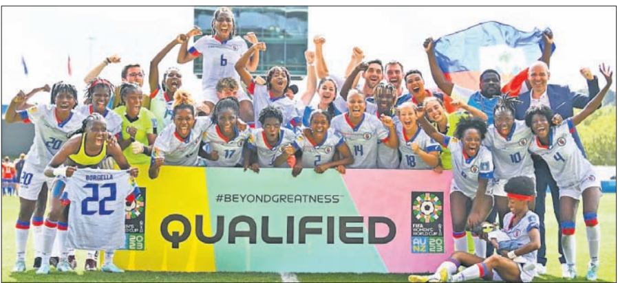
ପିଫା ମହିଳା ପୁରସ୍କାର ବିଶ୍ୱକପ ପାଇଁ ଯୋଗ୍ୟତା ହାସଲ ପରେ ହାଇଡି ଦଳ।