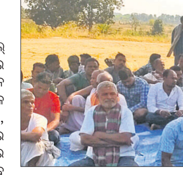
ଆୟୋଜନରେ ବସିଥିବା ଖଣି କ୍ଷତିଗ୍ରସ୍ତମାନେ।

ନାଲକୋକୁ ମିଳିଥିବା ଉତ୍ତମ-ତ କୋଲ୍ ରୁକ୍ଷରେ ଖଣି ଖନନ କରୁଥିବା ଘରୋଇ କମ୍ପାନୀରେ ନିୟୁତ୍ତି, କ୍ଷତିପୂରଣ ଓ ଅଭିଧାନ ଦାବିରେ ଅନୁଗୋଳ ଜିଲ୍ଲା ଛେଷ୍ଟିପଦା ବ୍ଲକ୍ ରାଜକୋରଣ ପଞ୍ଚାୟତର ରାଜକୋରଣ କାର୍ଯ୍ୟକ୍ରମ ଓ ଗୋଳାଗଡ଼ିଆର କ୍ଷତିଗ୍ରସ୍ତମାନେ ସୋମବାରଠାରେ ଆୟୋଜନ ଚଳାଇଛନ୍ତି।