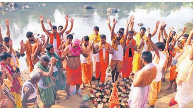
କଳସ ଶୋଭାଯାତ୍ରା ପୂର୍ବରୁ ନଦୀରେ ପୂଜାର୍ଚ୍ଚନା କରାଯାଇଛି।

ଡେକାନାଲ ଜିଲ୍ଲା କାମାକ୍ଷାନଗରସ୍ଥିତ ଶ୍ରୀରାମ ମନ୍ଦିର ପରିସରରେ ସୋମବାର ଠାରୁ ଆରମ୍ଭ ହୋଇଛି।