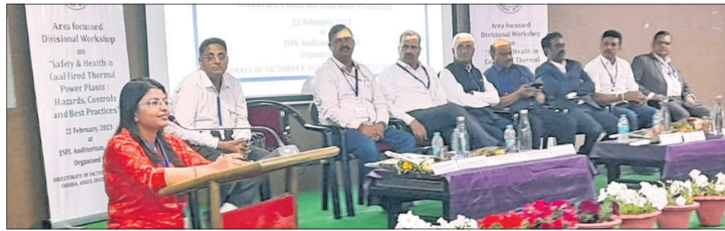
ଉପଖଣ୍ଡପ୍ରଦାର କର୍ମଶାଳାରେ ମହାସାଧନ ପ୍ରଶାସନିକ ଓ ବିଭିନ୍ନ ଶିଳ୍ପ ସଂସ୍ଥାର ଅଧିକାରୀମାନେ।

କାରଖାନା ଓ ବାଣ୍ଟିତ୍ର ବିଭାଗ ଅନୁଗୋଳ ପକ୍ଷରୁ ଏକ ଉପଖଣ୍ଡପ୍ରଦାର କର୍ମଶାଳା ଡିଲ୍ କ୍ଷ୍ମି ଆଣ୍ଡ ପାଠା (ଜେଏସ୍ପି) ସମ୍ମିଳନୀ କକ୍ଷରେ ଗୁପ୍ତାବାର ଅନୁଷ୍ଠିତ ହୋଇଯାଇଛି।