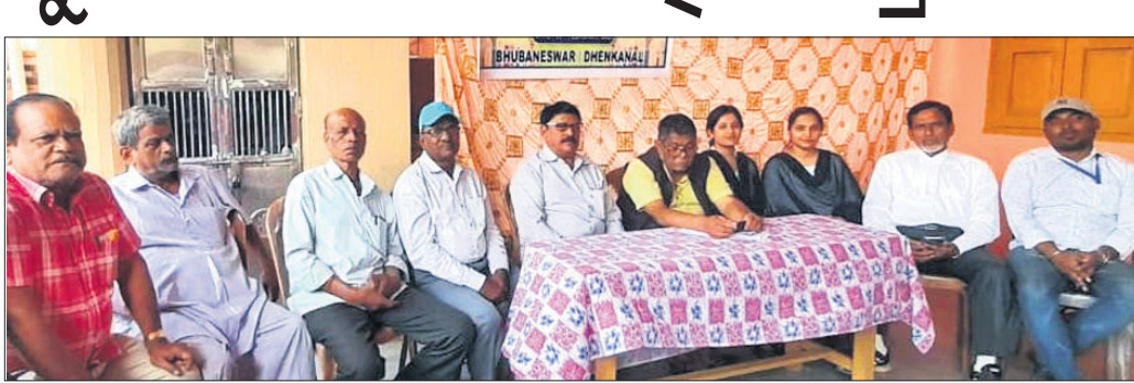
ବିଶ୍ୱ ସାମାଜିକ ନ୍ୟାୟ ଦିବସ ପାଳନ ଅବସରରେ ମହାସାଧନ ଅଭିନୂତନ।