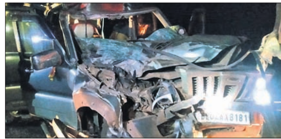
ବଡ଼ବିଲ/ଯୋଡ଼ା, ୨୨୧୨ (ଡି.ଏନ୍.ଏ)

କେନ୍ଦୁଝର ଜିଲ୍ଲା ରୁରୁଡ଼ି ଥାନା ଅନ୍ତର୍ଗତ ୫୨୦ନଂ. ଜାତୀୟ ରାଜପଥର ବାରବାଙ୍କ ଘାଟିରେ ରୁଧିରା ଟ୍ରକ୍ ପଛରେ ଝୁର୍ପିଓ ଧକ୍କା ହୋଇଥିବା ଘଟଣାରେ ୩ ଜଣଙ୍କ ମୃତ୍ୟୁ ହୋଇଛି । ଘଟଣାରେ ୨ ଜଣ ଝୁର୍ପିଓ ଓ ୩ ଜଣ ଟ୍ରକ୍ ଚଳାଏତକର ଯାତ୍ରୀଙ୍କ ମୃତ୍ୟୁ ହୋଇଛି । ଘଟଣାରେ ୨ ଜଣ ଝୁର୍ପିଓ ଓ ୩ ଜଣ ଟ୍ରକ୍ ଚଳାଏତକର ଯାତ୍ରୀଙ୍କ ମୃତ୍ୟୁ ହୋଇଛି । ଘଟଣାରେ ୨ ଜଣ ଝୁର୍ପିଓ ଓ ୩ ଜଣ ଟ୍ରକ୍ ଚଳାଏତକର ଯାତ୍ରୀଙ୍କ ମୃତ୍ୟୁ ହୋଇଛି ।