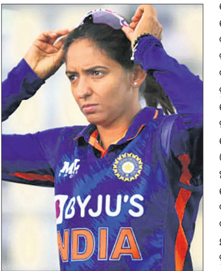
ଭାରତ ଅଧିନାୟିକା ହରମନପ୍ରୀତ୍ କୌର୍।

କରିବାରେ ବିଫଳ ହୋଇଛନ୍ତି। ଏହା ସହିତ ତତ୍ ବଲ୍ ଭାରତର ଏକ ବଡ଼ ସମସ୍ୟା ରହିଛି। ଭାରତୀୟ ଖେଳାଳିମାନେ ଷ୍ଟାଇଲ୍ କରିବାରେ ବିଫଳ