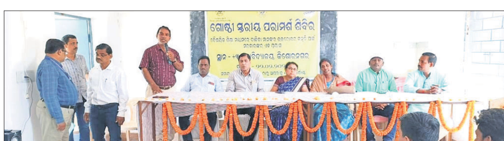
ରୁକ୍ଷପ୍ରଦାର ପରାମର୍ଶ ଶିବିରରେ ମହାସାଧନ ଲୋକ ପ୍ରତିନିଧି ଓ ପ୍ରଶାସନିକ ଅଧିକାରୀମାନେ।