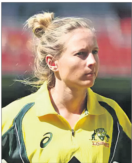
ଅଷ୍ଟ୍ରେଲିଆ ଅଧିନାୟିକା ମେଗ୍ ଲାଇନିଂ।

ଯୋଗ୍ୟତା ହାସଲ କରିଥିବା ବେଳେ ଭାରତ ୪ଟି ମ୍ୟାଚ୍ ଜିତିଥିଲା। ଭାରତ ଇଙ୍ଗଲଣ୍ଡ ନିକଟରୁ ହାରିଥିବା ବେଳେ ପାକିସ୍ତାନ, ଓଷ୍ଟ୍ରେଲିଆ ଓ ଆୟର୍ଲ୍ୟାଣ୍ଡକୁ ପରାସ୍ତ କରିଥିଲା।