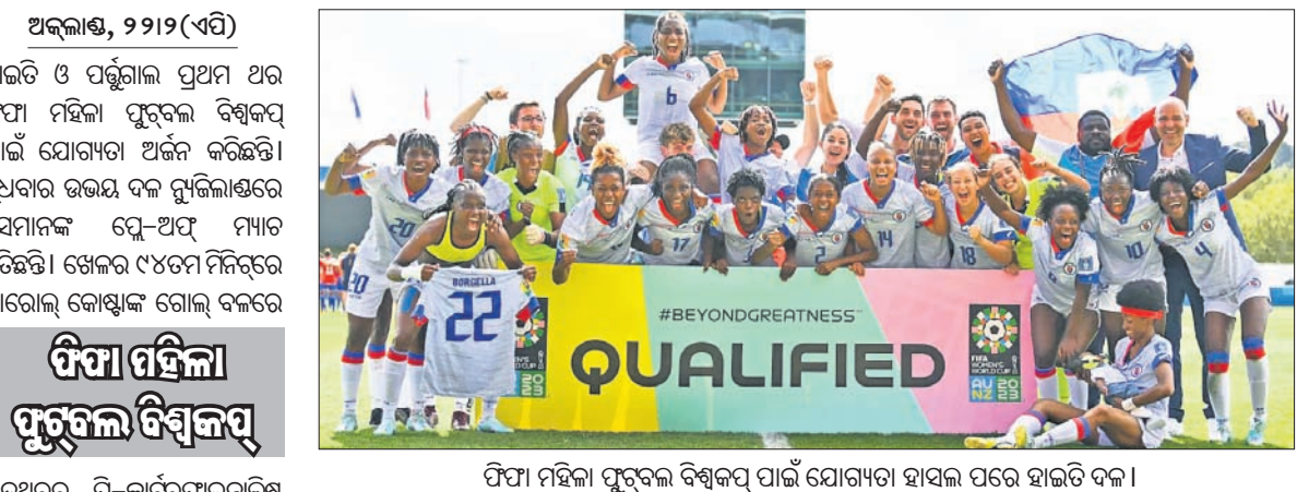
ଫିଫା ମହିଳା ପୂର୍ବକଳ ବିଶ୍ୱକପ୍ ପାଇଁ ଯୋଗ୍ୟତା ହାସଲ ପରେ ହାଇଡି ଦଳ ।

ଫିଫା ମହିଳା ପୂର୍ବକଳ ବିଶ୍ୱକପ୍ ପାଇଁ ଯୋଗ୍ୟତା ହାସଲ ପରେ ହାଇଡି ଦଳ । ଉମୋନେ ବୁଇଗୋରା ଗୋଲ୍ ଷ୍ଟୋର କରିଥିଲେ। ୫୫ ର୍ୟାଙ୍କିଙ୍ଗ୍‌ପ୍ରାପ୍ତ ହାଇଡି ବିଶ୍ୱକପ୍ ଗୁପ୍ତ ଡିଏଲ୍ ଇଙ୍ଗ୍ଲଣ୍ଡ, ଚାଇନା ଓ ଡେନମାର୍କ ବିପକ୍ଷରେ ଖେଳିବ। ଆସନ୍ତା ଜୁଲାଇ ଓ ଅଗଷ୍ଟରେ ଅଷ୍ଟ୍ରେଲିଆ ଓ ନ୍ୟୁଜିଲାଣ୍ଡ ମିଳିତ ଭାବେ ମହିଳା ପୂର୍ବକଳ ବିଶ୍ୱକପ୍ ଆୟୋଜନ କରୁଛନ୍ତି। ଏଥରେ ୩୨ଟି ଦଳ ଭାଗ ନେବେ। ଖାଲିଥିବା ୩ଟି ସ୍ଥାନ ପାଇଁ ନ୍ୟୁଜିଲାଣ୍ଡରେ ୧୦ଟି ଦଳକୁ ନେଇ ଇଣ୍ଡିଆନାରେଖାଇ ଟ୍ରେ-ଅଫ୍ ଖେଳାଯାଇଛି। ସେଥିମଧ୍ୟରୁ ଦୁଇଟି ହାଇଡି ଓ ପର୍ଡୁଗାଲ ପୁରଣ କରିଛନ୍ତି। ଅବଶିଷ୍ଟ ଗୋଟିଏ ସ୍ଥାନ ପାରାଗୁଏ ଓ ପାନାମା ମଧ୍ୟରେ ଗୁରୁବାର ଖେଳାଯିବାରୁ ଥିବା ମ୍ୟାଚର ବିଜେତା ପୁରଣ କରିବ।