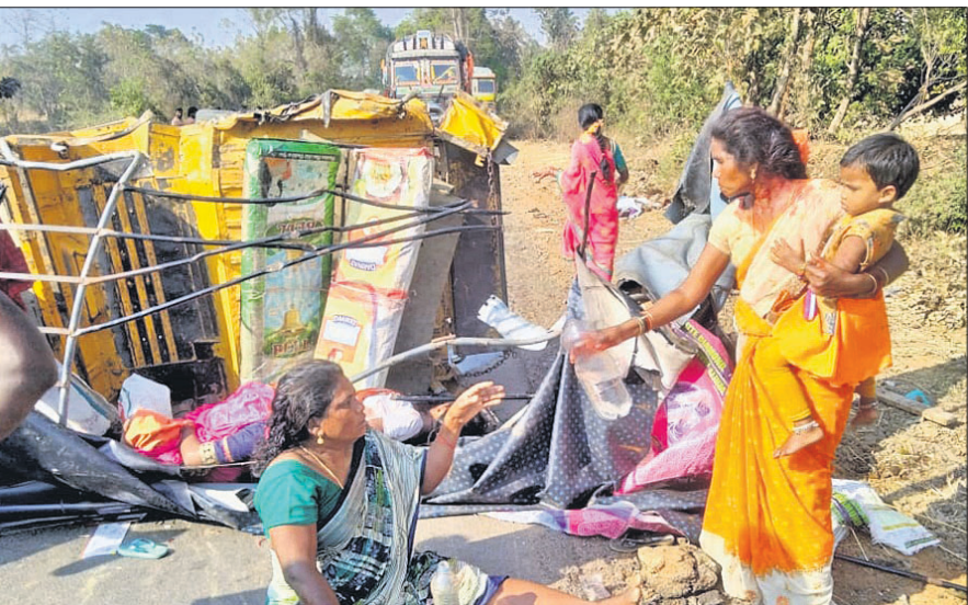
ଗୋଲପଦର ଗ୍ରାମ ନିକଟରେ ରୁଧିରା ଟ୍ରକ୍ ଧକ୍କାରେ ଦୁର୍ଘଟଣାର ଶିକାର ହୋଇଥିବା ଅଟୋ ଓ ଯାତ୍ରୀ ।