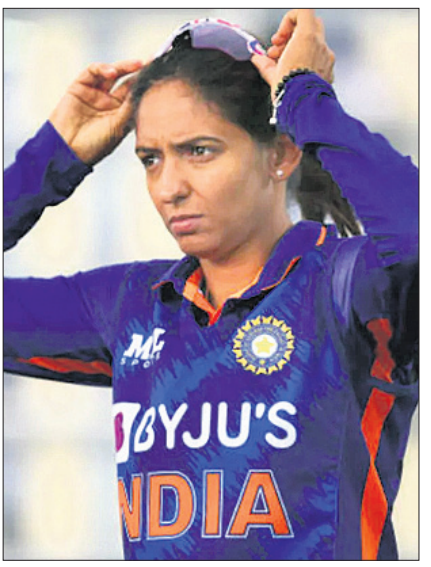
ଭାରତ ଅଧିନାୟିକା ହରମନପ୍ରିୟା କୋର୍ ।