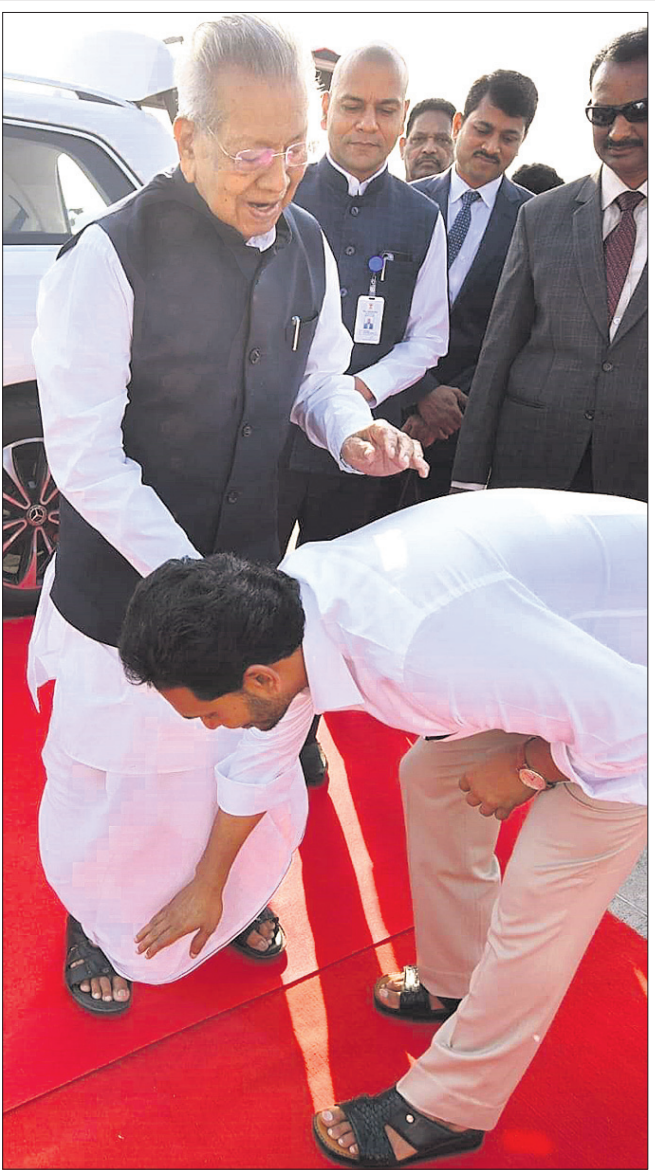
ଆନ୍ତ୍ରପ୍ରବେଶ ରାଜ୍ୟପାଳ ବିଶ୍ୱଭୂଷଣ ହରିଚନ୍ଦନଙ୍କୁ ଛତିଶଗଡ଼ ରାଜ୍ୟପାଳ ଭାବେ ନିଯୁକ୍ତି ଦିଆଯାଇଛି । ରୂପବାର ବିବାହୀ ଦିନରେ ଆନ୍ତ୍ରପ୍ରବେଶ ମୁଖ୍ୟମନ୍ତ୍ରୀ ଜଗନମୋହନ ରେଡ୍ଡୀ ତାଙ୍କ ପାଦ ଛୁଇଁ ଆଶୀର୍ବାଦ ଦେଇଛନ୍ତି ।