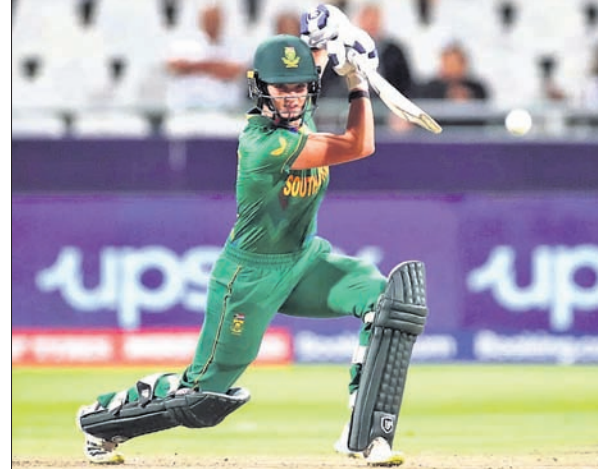
ମୁୟର୍ ଅଫ୍ ଦ ମ୍ୟାଚ କୋରା ଓଲଭାତର୍ଟି ।

ମହିଳା ଟି୨୦ ବିଶ୍ୱକପ ମ୍ୟାଚ ସ୍ଥାନ: ଗୁଲ୍ୟାଣ୍ଡ୍, କେପଟାଉନ ମ୍ୟାଚ ସମୟ: ସନ୍ଧ୍ୟା ୬.୩୦ ପ୍ରସାରଣ: ୟୁଟିଭି