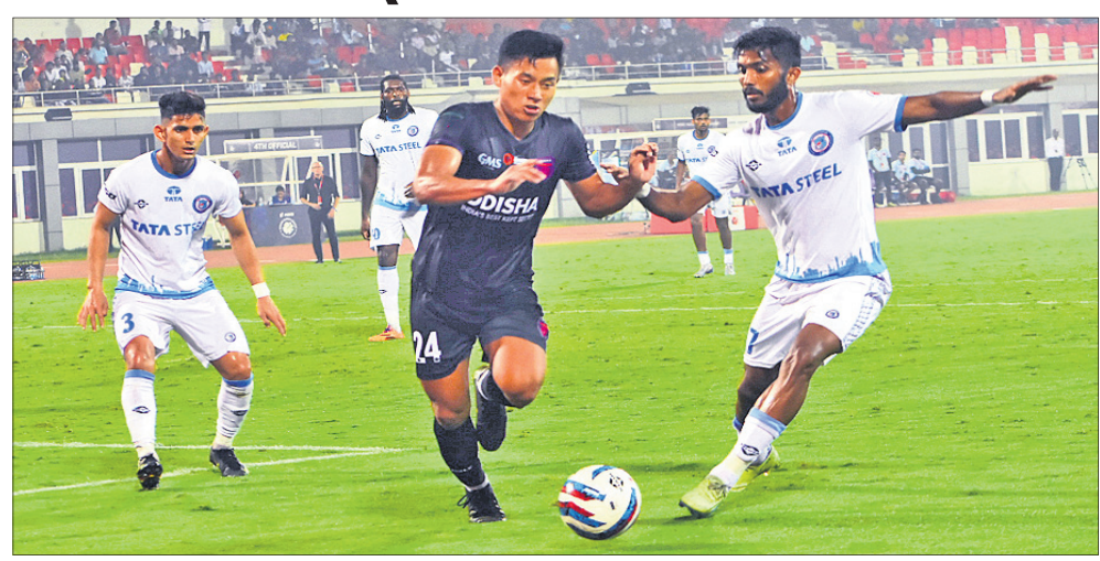
ଓଡ଼ିଶା ଏଫସି ଓ ଜାମସେଦପୁର ଏଫସି ମଧ୍ୟରେ ଅନୁଷ୍ଠିତ ମ୍ୟାଚର ସଂଘର୍ଷପୂର୍ଣ୍ଣ ମୁହୂର୍ତ୍ତ।

କଳିଙ୍ଗ ଷ୍ଟାଡ଼ିୟମରେ ଅନୁଷ୍ଠିତ ଇଣ୍ଡିଆନ ସୁପର ଲିଗ୍ ମ୍ୟାଚରେ ଜାମସେଦପୁର ଏଫସି ନିକଟରୁ ୨-୦ ଗୋଲରେ ହାରିଛି ଓଡ଼ିଶା ଏଫସି(ଏଫସି)।