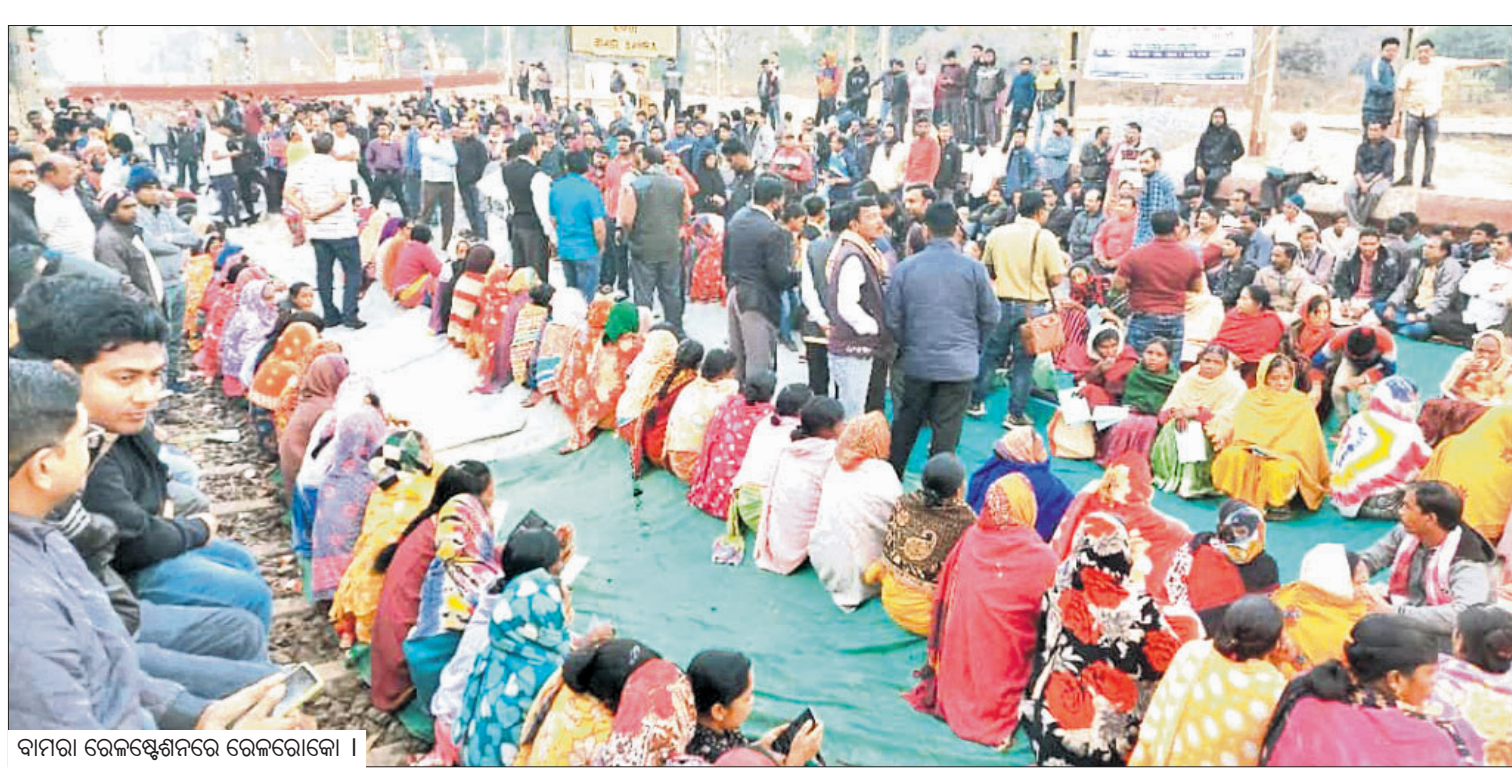
ବାମନା ରେଳଷ୍ଟେଶନରେ ରେଳରୋକ୍ତ।

ସମ୍ବଲପୁର, ୨୨୧୨(ଭୁବନେଶ୍ୱର) ଚକ୍ରଧରପୁର ରେଳ ମଣ୍ଡଳ ଅନ୍ତର୍ଗତ ସମ୍ବଲପୁର ଜିଲ୍ଲା ବାମନା ଷ୍ଟେଶନରେ ଏକ ପ୍ରତିବାଦୀ ଦଳର ପ୍ରତିବାଦୀମାନଙ୍କୁ ରେଳରୋକ୍ତ କରାଯାଇଥିଲା।