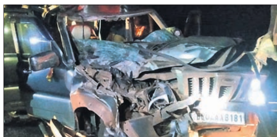
ବଡ଼ବିଲ/ଯୋଡ଼ା, ୨୨୧୨ (ଡି.ଏନ୍.ଏ)

କେନ୍ଦୁଝର ଜିଲ୍ଲା ରୁରୁଡ଼ି ଥାନା ଅନ୍ତର୍ଗତ ୫୨୦ନଂ. ଜାତୀୟ ରାଜପଥର ବାରବାଙ୍କ ଘାଟିରେ ରୁଧିରା ଟ୍ରକ୍ ପଛରେ ଝୁର୍ପିଓ ଧକ୍କା ହୋଇଥିବା ଘଟଣାରେ ୩ ଜଣଙ୍କ ମୃତ୍ୟୁ ହୋଇଛି । ଘଟଣାରେ ୨ ଜଣ ଝୁର୍ପିଓ ଓ ୩ ଜଣ ଟ୍ରକ୍ ଚାଳକଙ୍କ ମୃତ୍ୟୁ ହୋଇଛି । ଘଟଣାରେ ୨ ଜଣ ଝୁର୍ପିଓ ଓ ୩ ଜଣ ଟ୍ରକ୍ ଚାଳକଙ୍କ ମୃତ୍ୟୁ ହୋଇଛି । ଘଟଣାରେ ୨ ଜଣ ଝୁର୍ପିଓ ଓ ୩ ଜଣ ଟ୍ରକ୍ ଚାଳକଙ୍କ ମୃତ୍ୟୁ ହୋଇଛି ।