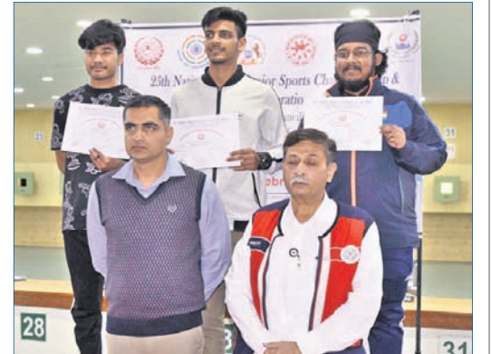
ଅଥିଲୁ ସହ ପଦକ ବିଜେତା।