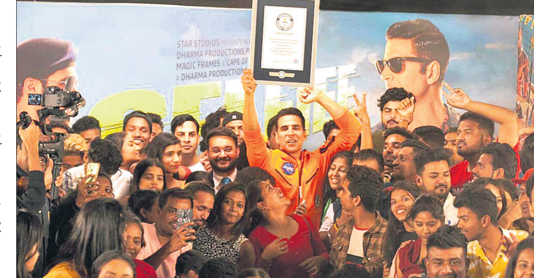
ସେଠାରେ ମଧ୍ୟ ସେହି ୩ ମିନିଟ୍ରେ କରିଥିଲେ । ତାଙ୍କ ପୂର୍ବରୁ ବଲିଉଡ୍ ମିନିଟ୍ରେ ୧୦୫ ସେଲ୍ ଉଠାଇ ଏଭଳି ୧୨୮ ସେଲ୍ ଉଠାଇ ରେକର୍ଡ୍ ଅଭିନେତା ତଥା ନିର୍ଦ୍ଦେଶକ ମାତ୍ର ୩ ରେକର୍ଡ୍ ଅଧିକାରୀ ହୋଇଥିଲେ ।

ବଲିଉଡ୍ ଅଭିନେତା ଅକ୍ଷୟ କୁମାର ତାଙ୍କ ଅଭିନୟ ଜରିଆରେ ବହୁ ଲୋକଙ୍କ ହୃଦୟ ଜିତିପାରିଛନ୍ତି । ସେଥିପାଇଁ ତାଙ୍କ ବହୁତ ପ୍ୟାନ ଫଲୋଇଂ ରହିଛନ୍ତି । ତେବେ ରୁଧ୍ରାବାର ସେ ଏକ ବିନିର୍ଦ୍ଦିତ ରେକର୍ଡ୍ କରିଛନ୍ତି । ଆସନ୍ତା ୨୪ ଡିଗ୍ରୀରେ ବିନିର୍ଦ୍ଦିତ ହେବାକୁ ଥିବା ତାଙ୍କ ଆଗାମୀ ଫିଲ୍ମ 'ସେଲ୍'ର ପ୍ରମୋଶନ ପାଇଁ ସେ ମୁମ୍ବାଇର ଏକ ସ୍ଥାନକୁ ଯାଇଥିଲେ । ସେଠାରେ ସେ ମାତ୍ର ୩ ମିନିଟ୍ ମଧ୍ୟରେ ତାଙ୍କ ଫ୍ୟାନ୍ସ୍କ ସହ ୧୮୪ ସେଲ୍ ଉଠାଇ ବିନିର୍ଦ୍ଦିତ ରୁକ୍ ଅର୍ଦ୍ଧିନ୍ ରେକର୍ଡ୍ରେ ଅଧିକାରୀ ହୋଇଛନ୍ତି । ଏହା ପୂର୍ବରୁ ୨୨ ଜାନୁଆରୀ ୨୦୧୮ରେ ଆମେରିକାରେ କରିଥିବା ପୂର୍ବ ବିନିର୍ଦ୍ଦିତ ରେକର୍ଡ୍ ସେ ଛାଡ଼ିବାରେ ସକ୍ଷମ ହୋଇଛନ୍ତି । ସେ