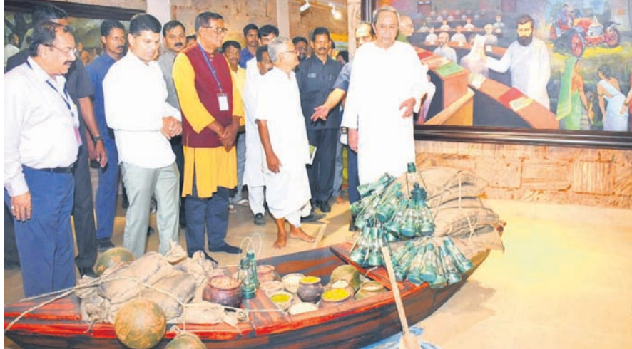
କୁଟୁଣ୍ଡୀ ଗ୍ରାମ ପରିବର୍ତ୍ତନ କରି ମୁଖ୍ୟମନ୍ତ୍ରୀ ନବୀନ ପଟ୍ଟନାୟକ ଗୋପବନ୍ଧୁଙ୍କ ସଂଗ୍ରହାଳୟକୁ ବୁଲି ଦେଖୁଛନ୍ତି।

ମାନବ ସମ୍ପାଦନ ମଣି ଥିଲେ ଉତ୍କଳମଣି ପଞ୍ଚେ ଗୋପବନ୍ଧୁ ଦାସ। ତାଙ୍କ ଖ୍ୟାତି, ଦେଶଭକ୍ତି, ସେବା ଓ ଜାତିପ୍ରୀତିର ତୁଳନା ନାହିଁ। ସାଧାରଣ ସଂଗ୍ରାମୀଙ୍କୁ ଆରମ୍ଭ କରି ଓଡ଼ିଶାର ଶିକ୍ଷା, ସାହିତ୍ୟ, ସଂସ୍କୃତି, ରାଜନୀତି, ସେବା ଓ ମାନବିକତାର ନୂଆ କାହାଣୀ ଗ୍ରାହଣ କରିବାକୁ ଓଡ଼ିଶାରେ କାହାଣୀଗୋପାଳ ଗୋପବନ୍ଧୁ କର୍ମଧାର ଥିଲେ ବୋଲି ମୁଖ୍ୟମନ୍ତ୍ରୀ ନବୀନ ପଟ୍ଟନାୟକ ଗୁରୁବାର ପୂର୍ବାଞ୍ଜଳୀ ସତ୍ୟବାଦୀ କ୍ଳବ ଗୋପବନ୍ଧୁଙ୍କ ଗୁପ୍ତାଚରଣ ଛନ୍ଦପାଠ କୁଟୁଣ୍ଡୀ ଗ୍ରାମକୁ ଲୋକାର୍ପିତ ଅବସରରେ ଆୟୋଜିତ ଏକ ଜନସଭାରେ ଘୋଷଣା କରାଯାଇଥିଲା।