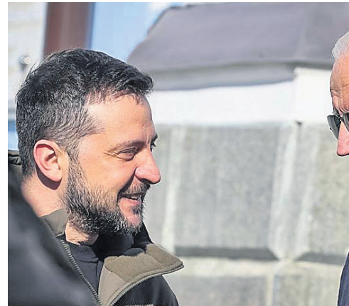
୨୦୨୩ ଫେବୃଆରୀ ୨୦ରେ ଆମେରିକା ରାଷ୍ଟ୍ରପତି ଜୋ ବାଇଡେନ୍ କିଭ୍ ରାସ୍ତା ବେଳେ ଯୁକ୍ତେନ୍ ପ୍ରତିପକ୍ଷ ଭୋଲୋଡିନିର କେଲେନ୍ସ୍କିଙ୍କ ସହ ଏକ ଚର୍ଚ୍ଚକୁ ଯାଇଥିଲେ ।

ରୁଷ୍‌ଆକୁ ଭରଣ ସମେତ କେତେକ ପାଶ୍ଚାତ୍ୟ ବିରୋଧୀ ଦେଶ ଅତ୍ୟାଧୁନିକ ସୁଦ୍ଧା ଓ ଘାତକ ଡ୍ରୋନ୍ ଯୋଗାଇଥାଉଥିବାବେଳେ ଏହାର ପୂର୍ବପୁରୁଷ ପାଇଁ ଯୁକ୍ତେନ୍ ମଧ୍ୟ ଅତ୍ୟନ୍ତୀୟ ସମୁଦାୟର ସହଯୋଗ ଲୋଡ଼ିଛି । ସେପଟେ ଚାଇନା ମଧ୍ୟ ରୁଷ୍‌ଆକୁ ଅସ୍ତ୍ରତ୍ରଣ ସୁଯୋଗ ପାରେ ବୋଲି ଆଶଙ୍କା କରାଯାଉଛି । ତେଣୁ ଆମେରିକା ରାଷ୍ଟ୍ରପତି ଜୋ ବାଇଡେନ୍ ଯୁଦ୍ଧ ପ୍ରଭାବିତ ଯୁକ୍ତେନ୍କୁ ଅଚାନକ ଗପ୍ତ ବେଳେ ଅତିରିକ୍ତ ସାମରିକ ସହାୟତାର ପ୍ରତିଷ୍ଠିତ ଦେଇଥିଲେ । ହେଲେ ଦ୍ୱିତୀୟ ବର୍ଷରେ ପହଞ୍ଚୁଥିବା ଯୁଦ୍ଧର ଅତ୍ୟନ୍ତ ଆଶା ଦିଶୁ ନ ଥିବାରୁ ଯୁକ୍ତେନ୍କୁ ଆଉ ସାମରିକ ସହଯୋଗ ନ କରିବା ପାଇଁ ଆମେରିକାମାନେ ଗପ୍ତ ପକାଇବା ଆରମ୍ଭ କଲେଣି । ଯୁକ୍ତେନ୍କୁ ସାମରିକ ସହାୟତା ଦେବା ସପକ୍ଷରେ ଜନମତ ଏବେ ୫୮%କୁ ଖସିଯାଇଛି । ଫେବୃଆରୀ ୨୪ ୧୩ ମଧ୍ୟରେ ୪,୦୦୦ ଆମେରିକାୟଙ୍କୁ ନେଇ କରାଯାଇଥିବା ଏକ ସତେଇ ଏହା ଜଣାପଡ଼ିଛି । ୨୦୨୨ ଏପ୍ରିଲରେ ଅସ୍ତ୍ର ପ୍ରୋତ୍ତରଣ ସପକ୍ଷରେ ୭୩% ଆମେରିକୀୟ ମତ ଦେଇଥିଲେ । ଉପରୋକ୍ତ ଫାଟିକୁ ରାଷ୍ଟ୍ରପତି ପ୍ରାଣୀ ହେବାକୁ ଆଗ୍ରହୀ ଫୋରିଡା ଗଭର୍ନର ରୋନ୍ ଡେ'ସାଷ୍ଟିୟାକ ମତରେ ଯୁକ୍ତେନ୍କୁ ନେଇ ବାଇଡେନ୍‌ଙ୍କ 'ରାଜ ଟେକ୍' ପଲସି ଆମେରିକା ପାଇଁ କ୍ଷତିକାରକ । ଆମେରିକା ସମେତ କ୍ରିମେନ୍, ତୁର୍କୀ, କାନାଡା, ଜର୍ମାନୀ, ସ୍ପେନ୍, ଫ୍ରାନ୍ସ, ବେଲ୍‌ଜିୟମ, ନେଦରଲାଣ୍ଡ, ଇଟାଲୀ, ନରୱେ ମଧ୍ୟ ଯୁକ୍ତେନ୍କୁ ସୁଦ୍ଧା ଓ ଅନ୍ୟ ଉପକରଣ ପଠାଇସାରିଛନ୍ତି । ଆମେରିକା ନେତୃତ୍ୱାଧୀନ ନାଟୋ ହେଉଛି ଯୁକ୍ତେନ୍‌ର ବଡ଼ ଶତ୍ରୁ । କିନ୍ତୁ ଚାଇନା ରୁଷ୍‌ଆକୁ ଅସ୍ତ୍ର ଯୋଗାଇଲେ ଯୁକ୍ତେନ୍‌ର ତିତ୍ତା ଆହୁରି ବଢ଼ିଯିବ ବୋଲି କୁହାଯାଉଛି ।