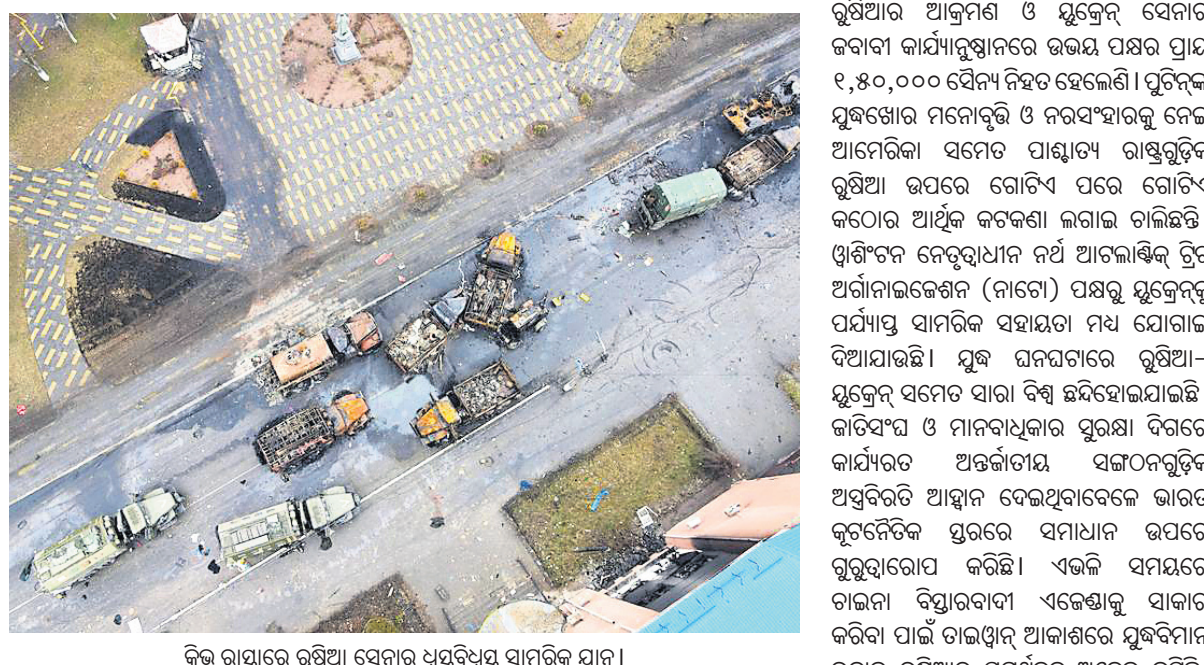
କିଭ୍ ରାସ୍ତାରେ ରୁଷ୍‌ଆ ସେନାର ଧସିଥିବା ସାମରିକ ଯାନ ।

କାଟିସଂଘ ମହାସଭା ଆଞ୍ଚଳିକ ଗୁଡ଼ିକରେ ରୁଷ୍‌ଆର ଯୁକ୍ତେନ୍ ଆକ୍ରମଣକୁ ନିରା କରିଛନ୍ତି । ବହୁପାକ୍ଷିକ ବ୍ୟବସ୍ଥା କାଟିସଂଘ ଯେଉଁ ବିଭାଗଗୁଡ଼ିକର ଆଧାରଶିଳ୍ପରେ ଦକ୍ଷତାମାନ ଚାକୁ ରୁଷ୍‌ଆ ଉଲ୍ଲଙ୍ଘନ କରିଥିବା ଗୁଡ଼ିକରେ କହିଛନ୍ତି । ୧୯୩୩ ସଦସ୍ୟ ବିଶିଷ୍ଟ କାଟିସଂଘ ସାଧାରଣ ସଭାରେ ଯୁକ୍ତେନ୍ ଉପରେ ଏମବେଟ୍ଟି ହେଉଛି ସେସର୍ ଚାଲିଥିବାବେଳେ ନିଜ ସମ୍ପର୍କରେ ଗୁଡ଼ିକରେ କହିଛନ୍ତି, ବର୍ଷକ ତଳେ ଆରମ୍ଭ ହୋଇଥିବା ଯୁଦ୍ଧ ଏବେ କ୍ଷେତ୍ରୀୟ ସ୍ଥିରତା ପ୍ରତି ବିପଦ ସୃଷ୍ଟି କରିବା ସହ ବିଶ୍ୱିକ ଉତ୍ତେଜନା ଓ ବିଭାଜନକୁ ଉତ୍ସୁକାଉଛି । ଯୁଦ୍ଧର ବର୍ଷପୂର୍ଣ୍ଣ ଯୁକ୍ତେନ୍‌ମୟ ଓ ଅତ୍ୟନ୍ତୀୟ ସମୁଦାୟକୁ ମର୍ମାହତ କରିଛି । ରୁଷ୍‌ଆର ମାନବାଧିକାର ଉଲ୍ଲଙ୍ଘନର ଦୁଷ୍ପରିଶାମ ଯୁକ୍ତେନ୍ ବାହାରେ ମଧ୍ୟ ଅତି ନୀଚକାରୀ ଭାବେ ଅନୁଭୂତ ହୋଇଛି । ପ୍ରକାଶ ଯେ, ଗତବର୍ଷ ଫେବୃଆରୀ ୨୪ରେ ଯୁକ୍ତେନ୍ ଉପରେ ଆକ୍ରମଣ ପରଠାକୁ କାଟିସଂଘରେ ରୁଷ୍‌ଆ ବିରୋଧରେ ଅନେକ ସଂକଳ୍ପନାମା ଅଣାଯାଇଛି । ଯୁକ୍ତେନ୍‌ର କ୍ଷେତ୍ରୀୟ ଅଖଣ୍ଡତା, ସାଧାନତା ଓ ସାର୍ବଭୌମତ୍ୱକୁ ସୁରକ୍ଷା ଦେବା ନିମନ୍ତେ କାଟିସଂଘ ସବୁ ପ୍ରକାର ଉପାୟ ନେବୁଛି । ଭାରତ ଏହି ପ୍ରସ୍ତାବଗୁଡ଼ିକରେ ମତଦାନରୁ ବିରତ ରହିବା ସହ ଆଲୋଚନା କରିଥାଉ ଯଦାଧାରଣ ବାଟ ଖୋଜିବାକୁ ପରାମର୍ଶ ଦେଇଆସିଛି ।