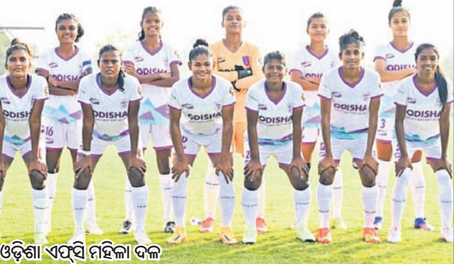
ଓଡ଼ିଶା ଏପ୍‌ସି ମହିଳା ଦଳ

ପେନାଲ୍ଟି ଶୁର୍ ଆଉଟରେ ପରାଜୟ ଦଳକୁ ବିଦାୟ ପାଏ ଦେଖାଇଥିଲା। କମ୍ପାନୀ ଆଉଟ୍‌ରେ: ପୁରବଳର ଭିକ୍ଟୋରି କ୍ଲବ୍ କରେବା ପାଇଁ ସର୍ବଦା ପ୍ରାୟାସ କରିଆସୁଥିବା ଓଏସ୍‌ସି ଷ୍ଟାଡ଼ିୟମ୍ ଅବସରରେ ବିଭିନ୍ନ ବସ୍ତ୍ର ଓ ଆଦିବାସୀ ଅଧିକାର ଅନୁମତି ପ୍ରାପ୍ତ ହେବା ପରେ ୧୫ ବର୍ଷରୁ କମ୍ ବୟସ ବର୍ଗର ଏକ ରୁନିମେଣ୍ଟ କରାଯାଇଛି।