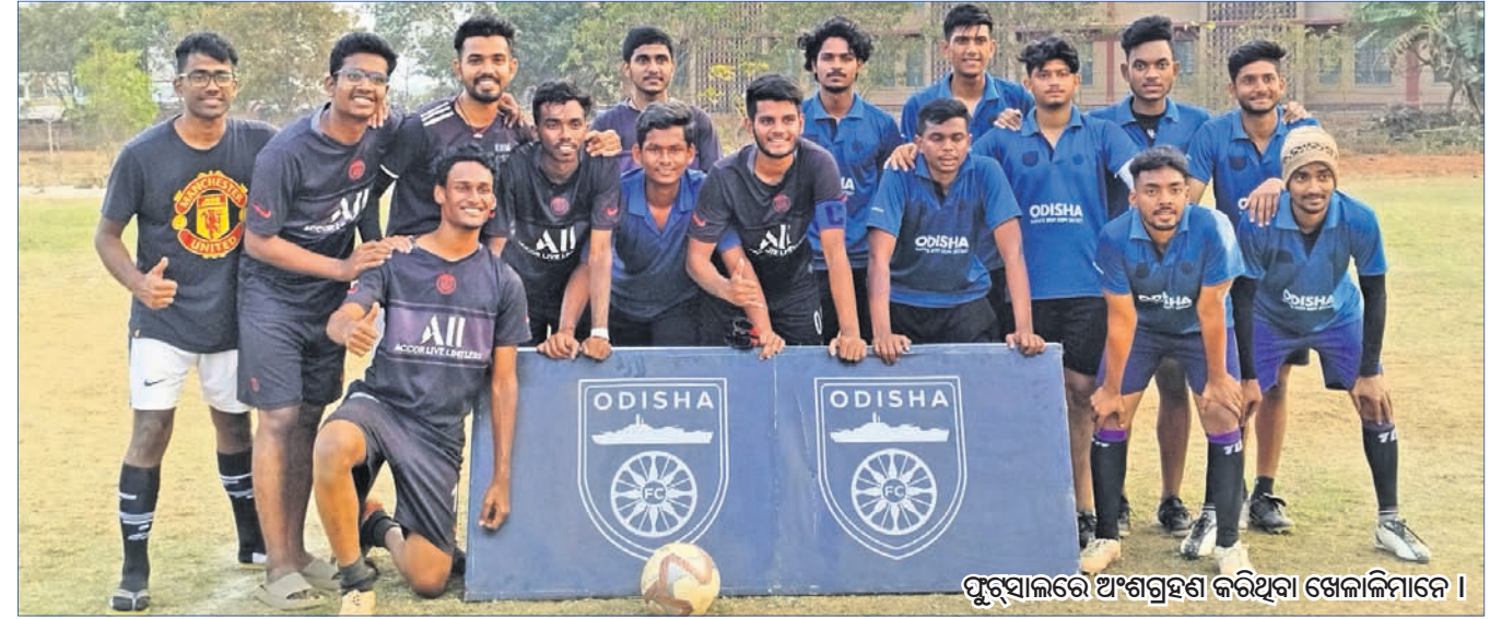
ପୁରବଳରେ ଅଂଶଗ୍ରହଣ କରିଥିବା ଖେଳାଳିମାନେ।