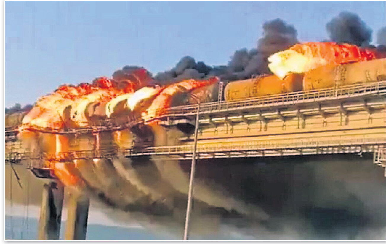
୨୦୨୨ ଅପ୍ରେଲର ୮ରେ ତୈଜ ଟ୍ୟାଙ୍କର ଧ୍ୟାରେ ବିକ୍ଷୋଭା ଘଟି କ୍ରିମିଆ ବ୍ରିଜ୍ ଜଳି ଉଠିଥିଲା ।