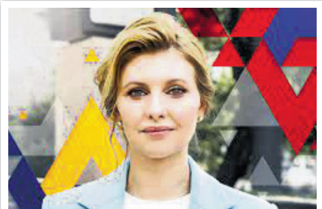
ଯୁକ୍ତେନ୍ ଫାଷ୍ଟ ଲେଟ୍ ଓଲେନା କେଲେନ୍ସ୍କା ରୁଷ୍‌ଆର ଯୁଦ୍ଧ ଅପରାଧ ଉପରେ ଶୁଣାଣି ପାଇଁ ଏକ ସ୍ୱତନ୍ତ୍ର ଟ୍ରିବ୍ୟୁନାଲ ପ୍ରତିଷ୍ଠା କରିବାକୁ କାଟିସଂଘକୁ ଅନୁରୋଧ କରିଛନ୍ତି । ଏହା କେବଳ ଆମ ପାଇଁ ନୁହେଁ, ବରଂ ସବୁ ରାଷ୍ଟ୍ରକୁ ଏପରି ଟ୍ରିବ୍ୟୁନାଲର ଆବଶ୍ୟକତା ରହିଛି ବୋଲି ସେ ପ୍ରକାଶ କରିଛନ୍ତି ।

ଯୁକ୍ତେନ୍ ବିରୋଧୀ ଯୁଦ୍ଧରେ ମହୋ ବିପ୍ଳବ ଅର୍ଥ ଖର୍ଚ୍ଚ କରୁଛି । ସାମାଜିକ ପର୍ଯ୍ୟାୟ ସୈନ୍ୟ ଓ ସାମରିକ ଉପକରଣ ପଠାଉଛି । ଅତ୍ୟନ୍ତୀୟ ସମୁଦାୟର କଟକଣା ଯୋଗୁ ରୁଷ୍‌ଆର ଆର୍ଥିକ ମେରୁଦଣ୍ଡ ଦୋହଲି ଯାଇଥିବାବେଳେ ତେଜ ଓ ଗ୍ୟାସ୍ ରପ୍ତାନି ଭଳି ରାଜସ୍ୱର ପ୍ରାଥମିକ ଉତ୍ପାଦ ମଧ୍ୟ ପାଶ୍ଚାତ୍ୟ ଟାର୍ଗେଟ୍ କରିଛି । ଫଳରେ ରୁଷ୍‌ଆର ଆର୍ଥିକ ଅଭିବୃଦ୍ଧି ହୋଇପାରୁ ନାହିଁ । ରୁଷ୍‌ଆ ରାଷ୍ଟ୍ରପତି ଭୁତିନିର ପୂର୍ବ ତଥାପି ଯୁଦ୍ଧକୁ ଆଗକୁ ବଢ଼ାଇବା ପାଇଁ ନିଷ୍ପତ୍ତି ନେଇଥିବାରୁ ଦେଶ ଭିତରେ ମଧ୍ୟ ଲୋକଙ୍କ ସମାଲୋଚନାର ପାତ୍ର ହୋଇଛନ୍ତି ।