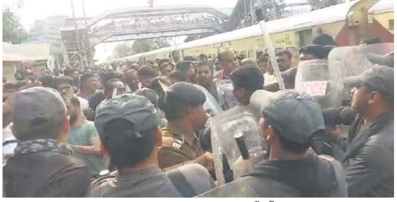
ବାମରା ରେଳଖେତ୍ରରେ ପୋଲିସ୍-ଜନତା ମୁହାଁମୁହିଁ ହୋଇଛି।

ପ୍ରତ୍ୟହ ରାଉରକେଲା-ଭୁବନେଶ୍ୱର ଇଣ୍ଟରସିଟି ପେନାଲ୍ ଡ୍ରମ୍‌କୁ ଧସେଇ ପଶି ଭଙ୍ଗାଗୁଡ଼ା କରିଥିଲେ। ଟ୍ରେନ୍‌ରେ ଯାତାୟତ କରୁଥିବା ଶତାଧିକ ମହିଳା ପରେ ସେମାନେ କର୍ମଚାରୀଙ୍କୁ ବାହାର କରିଦେଇ ଓ ପୁରୁଷ ଶ୍ରମିକ ଗଠବ୍ୟସ୍ଥକୁ ଯିବାରେ ବଞ୍ଚିତ ହେବାକୁ ଉତ୍ତେଜିତ ହୋଇ ଚିକେଟ କାଉଣ୍ଟର ଓ ହେବା ପରେ ବାମରା ରେଳ