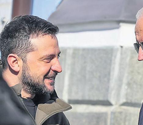
୨୦୨୩ ଫେବୃଆରୀ ୨୦ରେ ଆମେରିକା ରାଷ୍ଟ୍ରପତି ଜୋ ବାଇଡେନ୍ କିଭ୍ ଗସ୍ତ ବେଳେ ଯୁକ୍ତେନ୍ ପ୍ରତିପକ୍ଷ ଭୋଲୋଡିମିର ଜେଲେନ୍ସ୍କିଙ୍କ ସହ ଏକ ଚର୍ଚ୍ଚକୁ ଯାଇଥିଲେ ।