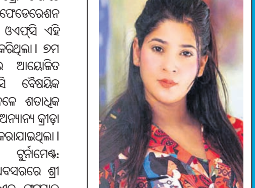
ଡିନ ମିନିପରେ ଶହେ ତୌରାଶଖୀ ସେଲ୍ଫି ପାରିବାନି କଳି