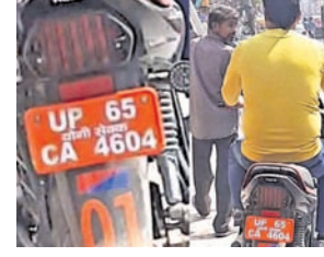
ଅଟକାଇଲା । ପୋଲିସ୍ ଉଚ୍ଚ ବ୍ୟକ୍ତିଙ୍କ ଗାଡ଼ି କାଗଜପତ୍ର ଯାଞ୍ଚ କରିବା ସହ ନିୟର ପୂର୍ତ୍ତ ରଙ୍ଗ ଏପରି ଥିବାରୁ ୬ ହଜାର ଟଙ୍କା ଚାଲାଇ କାଟିଲା ।