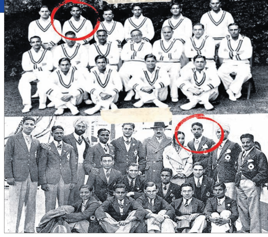
ଭାରତୀୟ କ୍ରିକେଟ (ଉପର-ବାମକୁ ଦୃଶ୍ୟ) ଏବଂ ହକି (ତଳ-ଡାହାଣକୁ ଦୃଶ୍ୟ) ଦଳ ସହ ଏମ୍.ଜେ. ଗୋପାଳନ୍।

ସୌଭାଗ୍ୟ ହାସଲ କରିଥିଲେ। ୧୯୩୪ରେ କଲିକତା ସହରରେ ଇଲୁଷ୍ଟର ବିପକ୍ଷରେ ଭାରତ ପକ୍ଷରୁ ଏକମାତ୍ର ଟେଷ୍ଟ ମ୍ୟାଚ୍ ଖେଳିଥିଲେ। ୧୯୩୬ରେ ଇଲୁଷ୍ଟର ଗସ୍ତରେ ଯାଇଥିବା ଭାରତୀୟ ଦଳର ସଦସ୍ୟ ହୋଇଥିଲେ ମଧ୍ୟ ମ୍ୟାଚ୍ ଖେଳିବାର ସୁଯୋଗ ପାଇ ନ ଥିଲେ।