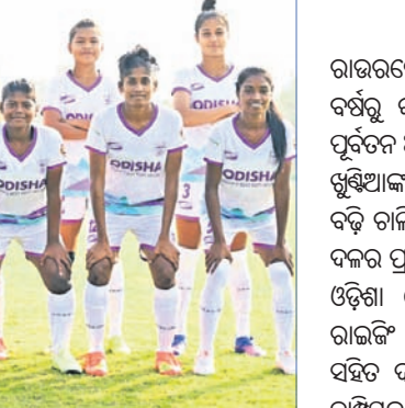
ଓଡ଼ିଶା ଏସିଏସି ମହିଳା ଦଳ

ପେନାଲ୍ଟି ଶୁଭ୍ ଆରମ୍ଭରେ ପରାଜୟ ଦଳକୁ ବିବାଦିତ ପଥ ଦେଖାଇଥିଲା। କମ୍ପ୍ୟୁଟର ଆଡ଼ଭାନ୍ସରେ ପୁରୁଷ ଟେନିସ ଟିମ୍ ପରିବର୍ତ୍ତନ ଆଣି ଓଡ଼ିଶା ଏସି (ଏସିଏସି) ୨୦୧୪ରୁ ଦିଲ୍ଲୀ ଡାକ୍ତାନାମୋସ୍ ନାମରେ ପରିଚିତ ଏହି କ୍ଲବ୍ କଲିକ୍ଟ ଷ୍ଟାଡ଼ିୟମକୁ ନିଜର ହୋମ୍ ଟର୍ଚ୍ଚ୍ ଭାବେ ବାଛିବା ପରେ ଦଳର ନାମ ୨୦୧୯ରୁ ଓଡ଼ିଶା ପୁରୁଷ କ୍ଲବ୍ (ଏସିଏସି) ରହିଛି।