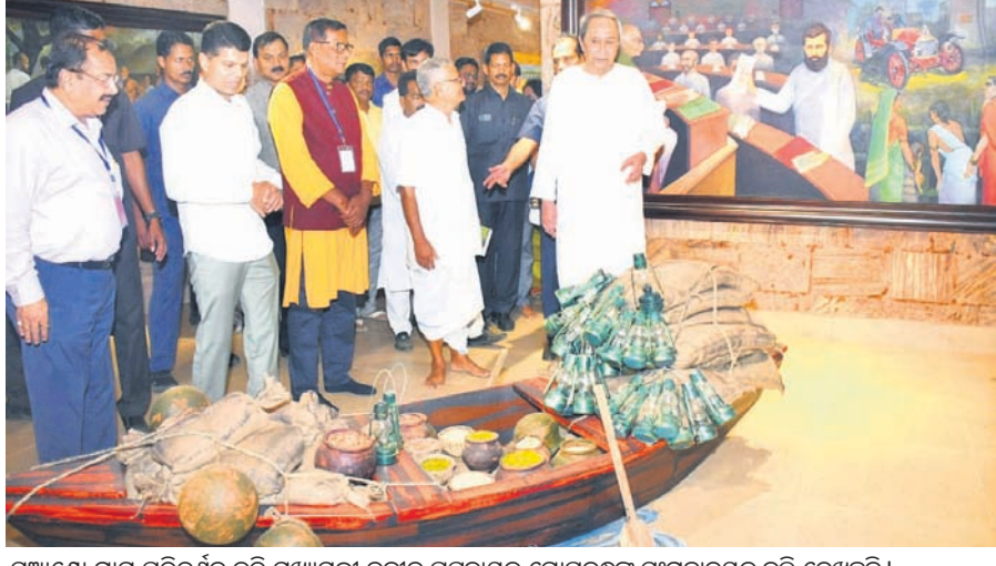
ସୁଆଖୋ ଗ୍ରାମ ପରିବର୍ତ୍ତନ କରି ପୁସ୍ତକାଳୟ ନବୀନ ପଢ଼ନାଳୟ ଗୋପବନ୍ଧୁଙ୍କ ସଂଗ୍ରହାଳୟକୁ ବୁଲି ଦେଖୁଛନ୍ତି।

ମାନବ ସମାଜର ମଣି ଥିଲେ ଉତ୍କଳମଣି ପଣ୍ଡିତ ଗୋପବନ୍ଧୁ ଦାସ। ତାଙ୍କ ଖ୍ୟାତି, ଦେଶଭକ୍ତି, ସେବା ଓ ଇତିହାସିତ ଚଳଣି ନାହିଁ। ସାଧାରଣ ସଂଗ୍ରାମରୁ ଆରମ୍ଭ କରି ଓଡ଼ିଶାର ଶିକ୍ଷା, ସାହିତ୍ୟ, ସଂସ୍କୃତି, ରାଜନୀତି, ସେବା ଓ ମାନବିକତାର ନୂଆ କାହିଁ ସ୍ଥାପନ କରିଯାଇଛନ୍ତି। ଓଡ଼ିଶାରେ କାତାୟନୀ ଚେତନାର ବିକାଶରେ ଗୋପବନ୍ଧୁ କର୍ଣ୍ଣଧାର ଥିଲେ ବୋଲି ପୁସ୍ତକାଳୟ ନବୀନ ପଢ଼ନାଳୟ ଗୁରୁବାର ପୂରା ଜିଲ୍ଲା ସତ୍ୟବାଦୀ କ୍ଳବ ଗୋପବନ୍ଧୁଙ୍କ ଚୁପାକାଶିତ ଜନ୍ମପୀଠ ସୁଆଖୋ ଗ୍ରାମକୁ ଲୋକାର୍ପଣ ଅବସରରେ ଆୟୋଜିତ ଏକ ଜନସଭାରେ ଯୋଗଦେଇ ସେ କହିଛନ୍ତି। ଭୋଗ ନୁହେଁ, ଖୋଗ ହିଁ ମହାନ, ସେବା ହିଁ ଶ୍ରେଷ୍ଠ- ଏହା ହିଁ ହେଉଛି ଗୋପବନ୍ଧୁଙ୍କ ଜୀବନର ବାଣୀ। ସେ ସବୁବେଳେ ଆମ ପାଇଁ ପ୍ରେରଣା ହୋଇ ରହିଛନ୍ତି ଓ ରହିଥିବେ। ଗୋପବନ୍ଧୁଙ୍କ 'ଭାର୍ତୀୟ ସଂକଳ୍ପ'କୁ ଜୀବନର ବ୍ରତ କରି ଏକ ନୂଆ ଓ ସଶକ୍ତ ଓଡ଼ିଶା ଗଠନ ପାଇଁ କାମ କରିବାକୁ ପୁସ୍ତକାଳୟ ଆହ୍ୱାନ ଦେଇଥିଲେ।