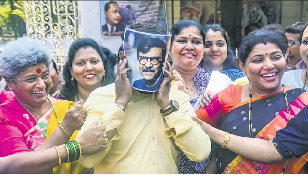
ମହାରାଷ୍ଟ୍ର ଠାଣେଠାରେ ଗୁରୁବାର ଶିବ ସେନା (ଶିବେ ଗୋଷ୍ଠୀ ତଥା ଏବେ ଶିବ ସେନା ଦଳ ଭାବେ ନିର୍ବାଚନ କମିଶନ ଦ୍ୱାରା ସ୍ୱୀକୃତ) ପକ୍ଷରୁ ଶିବ ସେନା (ଉତ୍ତର ଗୋଷ୍ଠୀ) ଏମ୍ପି ସଞ୍ଜୟ ରାଉତଙ୍କ ବିରୋଧରେ ବିଶେଷତା ପ୍ରଦର୍ଶନ କରାଯାଇଛି ।