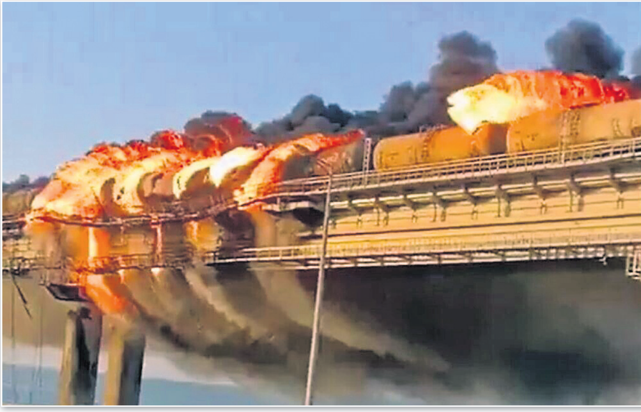
୨୦୨୨ ଅକ୍ଟୋବର ୮ରେ ତୈଳ ଟ୍ୟାଙ୍କର ଧସ୍ତରେ ବିସ୍ଫୋରଣ ଘଟି କ୍ରିମିଆ ବ୍ରିକ୍ ଜଳି ଉଠିଥିଲା ।

ଥିବାରୁ ଯୁକ୍ତେନ୍‌କୁ ଆଉ ସାମରିକ ସହଯୋଗ ନ କରିବା ପାଇଁ ଆମେରିକାମାନେ ଗପ୍ତ ପକାଇବା ଆରମ୍ଭ କଲେଣି । ଯୁକ୍ତେନ୍‌କୁ ସାମରିକ ସହାୟତା ଦେବା ସପକ୍ଷରେ ଜନମତ ଏବେ ୫୮%କୁ ଖସିଯାଇଛି । ଫେବୃଆରୀ ୨୨ ୧୩ ମଧ୍ୟରେ ୪,୦୦୦ ଆମେରିକୀୟଙ୍କୁ ନେଇ କରାଯାଇଥିବା ଏକ ସର୍ବେକ୍ଷ୍ଣ ଏହା ଜଣାପଡ଼ିଛି । ୨୦୨୨ ଏପ୍ରିଲରେ ଅସ୍ତ୍ର ପ୍ରେରଣ ସପକ୍ଷରେ ୭୩% ଆମେରିକୀୟ ମତ ଦେଇଥିଲେ । ଡିପ୍‌ଟିକାନ୍ ପାର୍ଟିରୁ ରାଷ୍ଟ୍ରପତି ପ୍ରାର୍ଥୀ ହେବାକୁ ଆଗ୍ରହୀ ସ୍ପୋରିଡି ଗଜର୍ନର ରୋନ୍ ଡେ’ସାଷ୍ଟିକ୍ ମତରେ ଯୁକ୍ତେନ୍‌କୁ ନେଇ ବାଇଡେନ୍‌ଙ୍କ ‘ସ୍ଵାକ୍ଷର’ ପଲସି ଆମେରିକା ପାଇଁ କ୍ଷତିକାରକ । ଆମେରିକା ସମେତ ବ୍ରିଟେନ୍, ଫ୍ରାନ୍ସ, କାନାଡା, ଜର୍ମାନୀ, ସ୍ପେନ୍, ପ୍ରାନ୍ସ, ବେଲ୍‌ଜିୟମ, ନେଦରଲାଣ୍ଡ, ଇଟାଲୀ, ନରୱେ ମଧ୍ୟ ଯୁକ୍ତେନ୍‌କୁ ମୁକ୍ତାସ୍ତ୍ର ଓ ଅନ୍ୟ ଉପକରଣ ପଠାଇସାରିଛନ୍ତି । ଆମେରିକା ନେତୃତ୍ଵାଧୀନ ନାଟୋ ହେଉଛି ଯୁକ୍ତେନ୍‌ର ବଡ଼ ଶକ୍ତି । କିନ୍ତୁ ତାଙ୍କ ନିଷ୍ଠାକୁ ଅସ୍ତ୍ର ଯୋଗାଇଲେ ଯୁକ୍ତେନ୍‌ର ଚିନ୍ତା ଆହୁରି ବଢ଼ିଯିବ ବୋଲି କୁହାଯାଇଛି ।