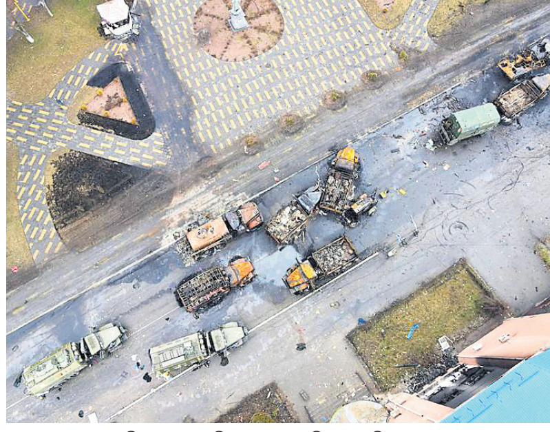
କିଭ୍ ରାସ୍ତାରେ ରୁଷ୍‌ଆ ସେନାର ଧସ୍ତବିଧସ୍ତ ସାମରିକ ଯାନ ।

“ ଚଳିତ ବର୍ଷକ ତଳେ ଅର୍ଥାତ୍ ୨୦୨୨ ଫେବୃଆରୀ ୨୪ରେ ରୁଷ୍‌ଆ ରାଷ୍ଟ୍ରପତି ଭ୍ଲାଡିମିର ପୁଟିନ୍ ନିଜ ସେନାକୁ ଯୁକ୍ତେନ୍‌ରେ ‘ସ୍ଵତନ୍ତ୍ର ସାମରିକ ଅପରେଶନ୍’ ଚଳାଇବାକୁ ନିର୍ଦ୍ଦେଶ ଦେଇଥିଲେ । ସେତେବେଳେ ପୁଟିନ୍ ଭାବିଥିଲେ ଦିନ କେଜାତା ଭିତରେ ସମଗ୍ର ଯୁକ୍ତେନ୍‌କୁ ଦଖଲ କରିନେବେ । କିନ୍ତୁ ଯୁକ୍ତେନ୍ ରାଷ୍ଟ୍ରପତି ଭୋଲୋଡିମିର ଜେଲେନ୍ସ୍କିଙ୍କ ପରାକ୍ରମ, ଅସାମାନ୍ୟ ସୈନ୍ୟ ଓ ସାହସ ଆଗରେ ରୁଷ୍‌ଆ ସୈନ୍ୟ ଏକପ୍ରକାର ହାରି ମାରିଛନ୍ତି । ପୁଟିନ୍‌ଙ୍କ ସାମରିକ ବାହିନୀ ଯୁକ୍ତେନ୍‌ରେ ଯେଉଁ ଅଞ୍ଚଳକୁ ଦଖଲ କରୁଛନ୍ତି, ଜେଲେନ୍ସ୍କିଙ୍କ ସୈନ୍ୟ ସେମାନଙ୍କୁ ସେଠାରୁ ଘରଢ଼ାଇ ପୁନଃ ନିଜ ଅଧିକାରକୁ ଆଣୁଛନ୍ତି । ଆକାଶ ମାର୍ଗରୁ ରୁଷ୍‌ଆର ଘନ ଘନ ମିଶାଇଲ ଓ ରକେଟ୍ ମାଡ଼ ଯୁକ୍ତେନ୍‌କୁ ବସ୍ତୁତ୍ୟ ଏକ ଧ୍ଵଂସପୁତ୍ରରେ ପରିଣତ କରିଦେଇଥିବାବେଳେ ଜେଲେନ୍ସ୍କିଙ୍କ ଉତ୍ତମତ ମଧ୍ୟେ ଉଚ୍ଚତର ସୂଚକ କରିଦେଇଛି । ରୁଷ୍‌ଆର ଆକ୍ରମଣ ଓ ଯୁକ୍ତେନ୍ ସେନାର ଜବାବା କାର୍ଯ୍ୟାଳୟରେ ଉଭୟ ପକ୍ଷର ପ୍ରାୟ ୧,୫୦,୦୦୦ ସୈନ୍ୟ ନିହତ ହେଲେଣି । ପୁଟିନ୍‌ଙ୍କ ଯୁଦ୍ଧଖୋର ମନୋବୃତ୍ତି ଓ ନରସଂହାରକୁ ନେଇ ଆମେରିକା ସମେତ ପାଶ୍ଚାତ୍ୟ ରାଷ୍ଟ୍ରଗୁଡ଼ିକ ରୁଷ୍‌ଆ ଉପରେ ଗୋଟିଏ ପରେ ଗୋଟିଏ କଠୋର ଆର୍ଥିକ କଟକଣା ଲଗାଇ ଚାଲିଛନ୍ତି । ଓ଼ିଂଟନ ନେତୃତ୍ଵାଧୀନ ନର୍ଥ ଆଟଲାଣ୍ଟିକ୍ ଟ୍ରାଏ ଅର୍ଗାନାଇଜେଶନ (ନାଟୋ) ପକ୍ଷରୁ ଯୁକ୍ତେନ୍‌କୁ ପର୍ଯ୍ୟାପ୍ତ ସାମରିକ ସହାୟତା ମଧ୍ୟ ଯୋଗାଇ ଦିଆଯାଇଛି । ଯୁଦ୍ଧ ଘନଘଟାରେ ରୁଷ୍‌ଆ-ୟୁକ୍ତେନ୍ ସମେତ ସାରା ବିଶ୍ଵ ଛନ୍ଦିହୋଇଯାଇଛି । କାଟିସଂଘ ଓ ମାନବାଧିକାର ସୁରକ୍ଷା ଦିଗରେ କାର୍ଯ୍ୟରତ ଅନ୍ତର୍ଜାତୀୟ ସଙ୍ଗଠନଗୁଡ଼ିକ ଅସ୍ଵାଭାବିକ ଆହ୍ଵାନ ଦେଇଥିବାବେଳେ ଭାରତ କୃତନୈତିକ ସ୍ତରରେ ସମାଧାନ ଉପରେ ଗୁରୁତ୍ଵାରୋପ କରିଛି । ଏଭଳି ସମୟରେ ତାଙ୍କ ନିଷ୍ଠାପୂର୍ଣ୍ଣତା ଏକେଣ୍ଡାକୁ ସାକାର କରିବା ପାଇଁ ତାଙ୍କଠାରୁ ଆକାଶରେ ଯୁଦ୍ଧବିମାନ ଉଡ଼ାଇ ରୁଷ୍‌ଆର ସମର୍ଥନକୁ ଅନେଇ ଦସିଛି ।