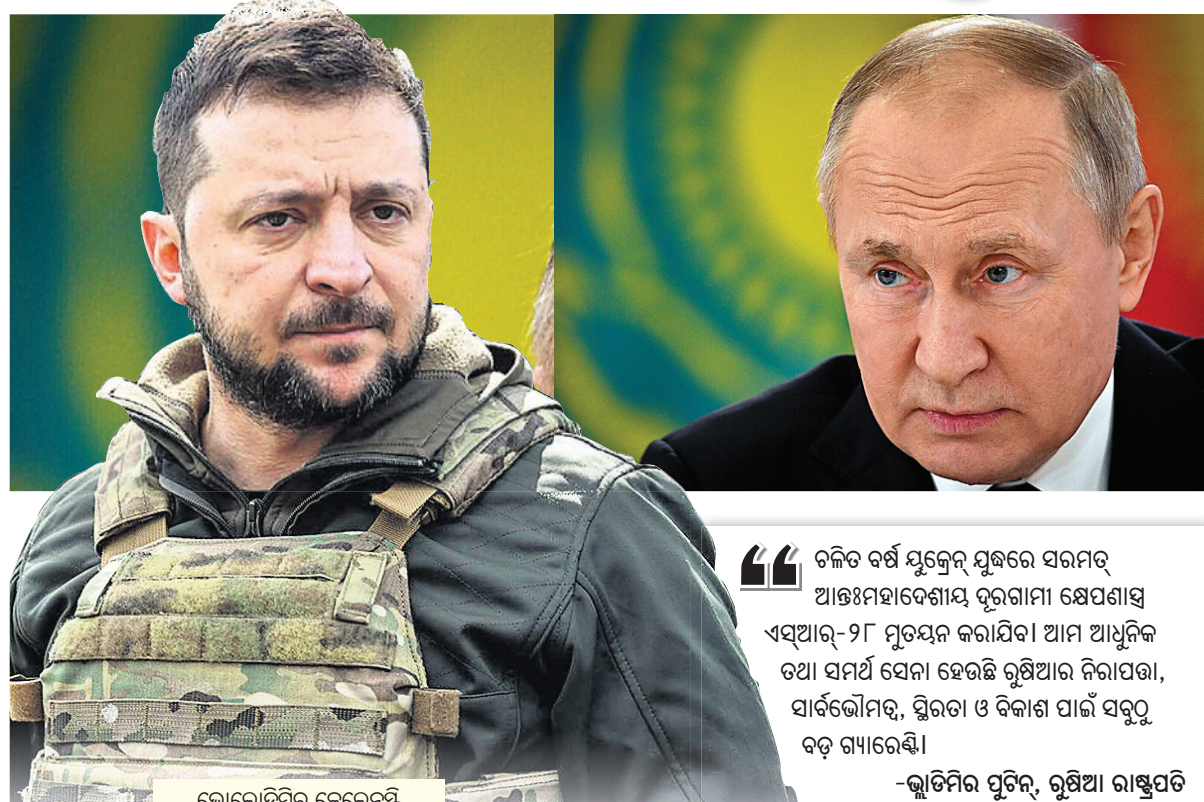
ଭୋଲୋଡିମିର ଜେଲେନ୍ସ୍କି (ବାମ) ଓ ଭ୍ଲାଡିମିର ପୁଟିନ୍, ରୁଷ୍‌ଆ ରାଷ୍ଟ୍ରପତି

ଯୁକ୍ତେନ୍ ବିରୋଧୀ ଯୁଦ୍ଧରେ ମଧ୍ୟେ ବିପୁଳ ଅର୍ଥ ଖର୍ଚ୍ଚ କରୁଛି । ସାମାଜିକ ପର୍ଯ୍ୟାପ୍ତ ସୈନ୍ୟ ଓ ସାମରିକ ଉପକରଣ ପଠାଉଛି । ଅନ୍ତର୍ଜାତୀୟ ସମୁଦାୟର କଟକଣା ଯୋଗୁ ରୁଷ୍‌ଆର ଆର୍ଥିକ ମେରୁଦଣ୍ଡ ଦୋହଲି ଯାଇଥିବାବେଳେ ତେଜ ଓ ଗ୍ୟାସ୍ ରପ୍ତାନି ଭଲ ରାଜସ୍ଵର ପ୍ରାଥମିକ ଉତ୍ପାଦ ମଧ୍ୟ ପାଶ୍ଚାତ୍ୟ ଚାଗେଟ୍ କରିଛି । ଫଳରେ ରୁଷ୍‌ଆର ଆର୍ଥିକ ଅଭିବୃଦ୍ଧି ହୋଇପାରୁ ନାହିଁ । ରୁଷ୍‌ଆ ରାଷ୍ଟ୍ରପତି ଭ୍ଲାଡିମିର ପୁଟିନ୍ ତଥାପି ଯୁଦ୍ଧକୁ ଆଗକୁ ବଢ଼ାଇବା ପାଇଁ ନିଷ୍ପତ୍ତି ନେଇଥିବାରୁ ଦେଶ ଭିତରେ ମଧ୍ୟ ଲୋକଙ୍କ ସମାଲୋଚନାର ପାତ୍ର ହୋଇଛନ୍ତି ।