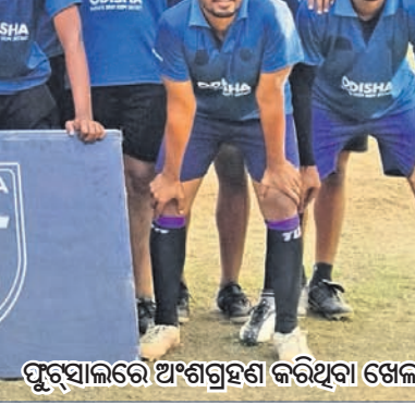
ପୁରୁସାଳରେ ଅଂଶଗ୍ରହଣ କରିଥିବା ଖେଳାଳିମାନେ।

ଅଂଶଗ୍ରହଣ କରିଥିବା ବେଳେ ଆଉଥରେ ଚାମ୍ପିୟନ ଆଖ୍ୟା ଅର୍ଜନ କରିଥିଲେ। ୨୦୨୧-୨୨ ସିଜନରେ ଷ୍ଟୁଡେଣ୍ଟସ୍ ଓଡ଼ିଶା ପକ୍ଷରୁ ଖେଳି ଇଣ୍ଡିଆନ୍ ଓପେନିଂ ଲିଗ୍ରେ ୪ଟି ଗ୍ଲାନ ହାସଲ କରିଥିଲେ। ପ୍ୟାସ୍ ଖାଖା: ଓଡ଼ିଶାର ଆଦିବାସୀ ଅଧିକାର ସୁଧାରଣ ଲିଗ୍ ଆସିଥିବା ପ୍ୟାସ୍ ଖାଖା ଏବେ ଭାରତୀୟ ପୁରବଳ ଦଳର ଜଣେ ନିୟମିତ ସଦସ୍ୟ। ୨୦୧୪ରେ ୧୯ ବର୍ଷରୁ କମ୍ ଏପିସି କପ୍ ଭାରତୀୟ ଦଳ ପାଇଁ ଅଭିଯାନ ଆରମ୍ଭ କରିଥିଲେ। ୨୦୧୫ରେ ସର୍ବଭାରତୀୟ ପୁରବଳ ଫେଡେରେଶନ ପକ୍ଷରୁ ଶ୍ରେଷ୍ଠ ମୂର୍ତ୍ତି ଖେଳାଳି ଭାବେ