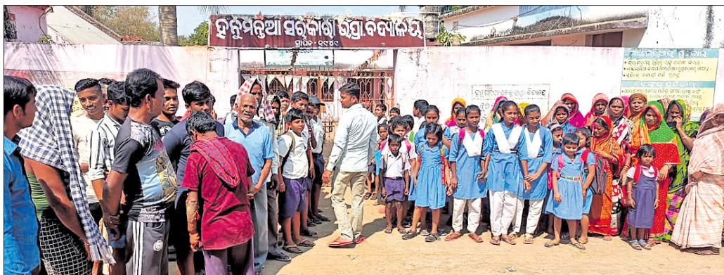
ସ୍କୁଲ ଫାଟକରେ ତାଲା ପକାଇ ଛାତ୍ରଛାତ୍ରୀ ଓ ଅଭିଭାବକଙ୍କ ବିକ୍ଷୋଭ ।