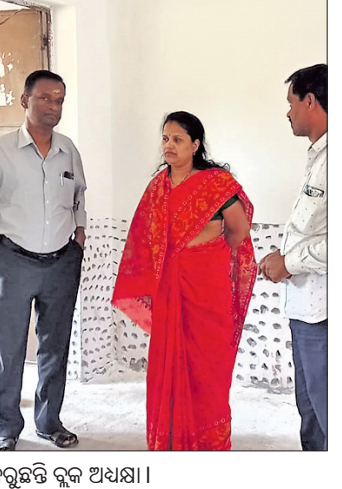
୫-ଟି ସ୍କୁଲ ଉନ୍ନତୀକରଣ କାର୍ଯ୍ୟର ତଦାରଖ କରୁଛନ୍ତି ବୁକ୍ ଅଧିକାରୀ ।

ଦଶପଲ୍ଲୀ, ୨୩/୨ (ଡି.ଏନ୍.ଏ.) ରୁଜୁର ଦଶପଲ୍ଲୀ ବୁକ୍ ପ୍ରଶାସନ ତରଫରୁ ଦଶପଲ୍ଲୀ ବୁକ୍‌ର ୫-ଟି ଅନୁଷ୍ଠାନ ହୋଇଥିବା ବିଭିନ୍ନ ବିଦ୍ୟାଳୟର କାର୍ଯ୍ୟ ତଦାରଖ କରାଯାଇଛି । ଦଶପଲ୍ଲୀ