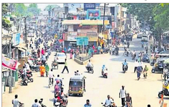
ଜଗତ୍ସିଂହପୁର ସହର ଥାନା ଆଗ ଦେଇ ଯାଇଥିବା ରାସ୍ତାରେ ରହିଛି।

ବର୍ଷ ତିନି ମାସର ପୂର୍ବ ପ୍ରସ୍ତୁତିରେ ବାଧ୍ୟତା ସୃଷ୍ଟି ହୋଇଥିବା କୁହାଯାଇଥିଲେ ମଧ୍ୟ ଏ ପର୍ଯ୍ୟନ୍ତ ଏହାର ରୂପରେଖ ଦୃଶ୍ୟ ହୋଇ ନ ପାରିବା ଅସନ୍ତୋଷର କାରଣ ହୋଇଛି।