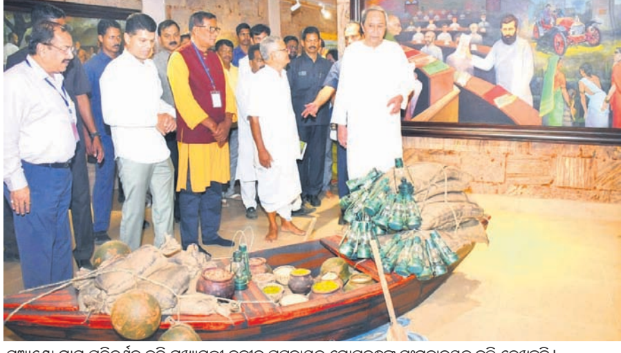
ସୁଆଣ୍ଡୋ ଗ୍ରାମ ପରିବର୍ତ୍ତନ କରି ପୁଖ୍ୟମନ୍ତ୍ରୀ ନବୀନ ପଟ୍ଟନାୟକ ଗୋପବନ୍ଧୁଙ୍କ ସଂଗ୍ରହାଳୟକୁ ବୁଲି ଦେଖୁଛନ୍ତି।

ମାନବ ସମାଜର ମଣି ଥିଲେ ଉତ୍କଳମଣି ପଣ୍ଡିତ ଗୋପବନ୍ଧୁ ଦାସ। ତାଙ୍କ ଖ୍ୟାତି, ଦେଶଭକ୍ତି, ସେବା ଓ ଇତିହାସିତ ଚଳନା ନାହିଁ। ସାଧାରଣ ସଂଗ୍ରାମୀରୁ ଆରମ୍ଭ କରି ଓଡ଼ିଶାର ଶିକ୍ଷା, ସାହିତ୍ୟ, ସଂସ୍କୃତି, ରାଜନୀତି, ସେବା ଓ ମାନବିକତାର ନୂଆ କାହିଁ ସ୍ଥାପନ କରିଯାଇଛନ୍ତି। ଓଡ଼ିଶାରେ କାତାୟନୀ ଚେତନାର ବିକାଶରେ ଗୋପବନ୍ଧୁ କର୍ଣ୍ଣଧାର ଥିଲେ ବୋଲି ପୁଖ୍ୟମନ୍ତ୍ରୀ ନବୀନ ପଟ୍ଟନାୟକ ଗୁରୁବାର ପୂର୍ବା ଜିଲ୍ଲା ସତ୍ୟବାଦୀ ବ୍ଲକ ଗୋପବନ୍ଧୁ ଚୁପାଠର ଉପପ୍ରଧାନ ଗ୍ରାମକୁ ଲୋକାର୍ପିତ ଅବସରରେ ଆୟୋଜିତ ଏକ ଜନସଭାରେ ଯୋଗଦେଇ ସେ କହିଛନ୍ତି। ଭୋଗ ନୁହେଁ, ଖୋଗ ହିଁ ମହାନ, ସେବା ହିଁ ଶ୍ରେଷ୍ଠ- ଏହା ହିଁ ହେଉଛି ଗୋପବନ୍ଧୁଙ୍କ ଜୀବନର ବାଣୀ। ସେ ସବୁବେଳେ ଆମ ପାଇଁ ପ୍ରେରଣା ହୋଇ ରହିଛନ୍ତି ଓ ରହିଥିବେ। ଗୋପବନ୍ଧୁଙ୍କ 'ଭାର୍ତୀୟ ସଂକଳ୍ପ'କୁ ଜୀବନର ବ୍ରତ କରି ଏକ ନୂଆ ଓ ସଶକ୍ତ ଓଡ଼ିଶା ଗଠନ ପାଇଁ କାମ କରିବାକୁ ପୁଖ୍ୟମନ୍ତ୍ରୀ ଆହ୍ୱାନ ଦେଇଥିଲେ।