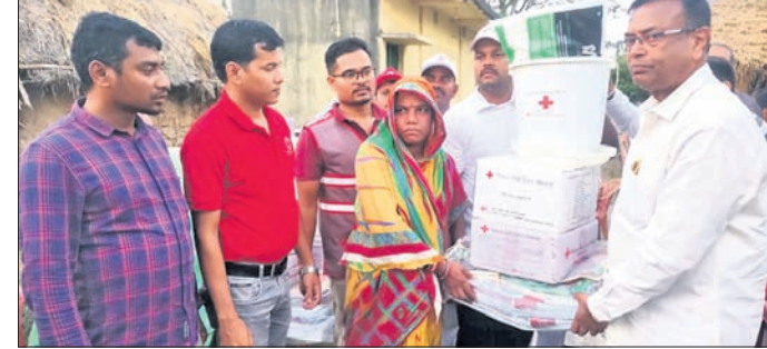
ଅଗ୍ନି ବିପନ୍ନଙ୍କୁ ସହାୟତା ପ୍ରଦାନ କରାଯାଇଛି ।