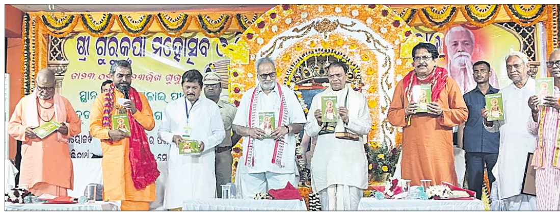
ମହୋତ୍ସବରେ ରାଜ୍ୟପାଳ ପ୍ରଫେସର ଗଣେଶୀ ଲାଲ ଓ ଅନ୍ୟମାନେ ।

ସେଲ୍ଫି ପଠାଇବା ସମୟରେ ନିଜର ନାମ ଏବଂ ମୋବାଇଲ ନମ୍ବର ଦେବାକୁ କୁଳକୁ ନାହିଁ । ଯୋଗାଯୋଗରେ ପଡ଼େ ପ୍ରକାଶ ପାଇବ ।