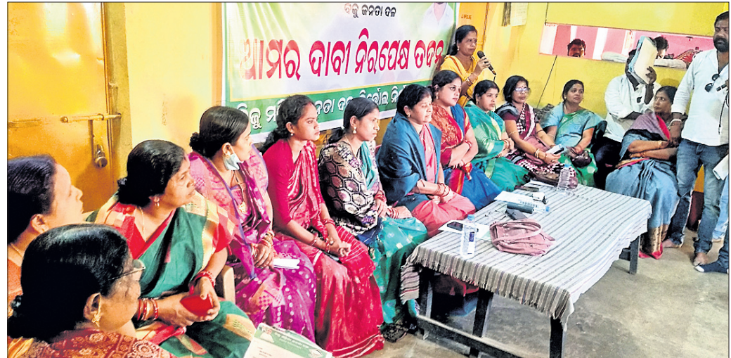
ଖବରଦାତା ସମ୍ମିଳନୀରେ ମହିଳା ବିଜେଡିର ସଦସ୍ୟମାନେ।

ବାଲିକୁଦା, ୨୩।୨ (ସ.ପ୍ର.): ବାଲିକୁଦା ବ୍ଲକ୍ ଅନ୍ତର୍ଗତ ଅନୁସୂଚୀ ପଞ୍ଚାୟତରେ ମହାତ୍ମା ଗାନ୍ଧୀ ଜାତୀୟ ଗ୍ରାମୀଣ ନିକ୍ଷେପ କର୍ମ ନିୟୁକ୍ତି ଯୋଜନା (ଏକଜିଏନଆରକିଏସ୍) ଅନିୟମିତତା ହୋଇଥିବା ଅଭିଯୋଗ ହୋଇଛି।