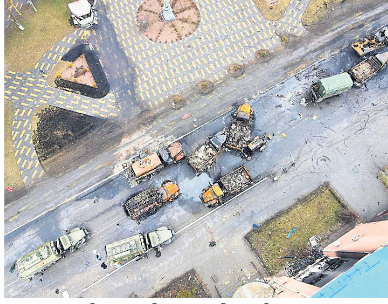
କିଭ୍ ଗ୍ରାମରେ ରୁଷ୍ଟିଆ ସେନାର ଧସିଥିବା ସାମରିକ ଯାନ ।

“ ଚଳିତ ବର୍ଷକ ତଳେ ଅର୍ଥାତ୍ ୨୦୨୨ ଫେବୃୟାରୀ ୨୪ରେ ରୁଷ୍ଟିଆ ରାଷ୍ଟ୍ରପତି ଭୂମିକା ପୂର୍ଣ୍ଣ ନିଜ ସେନାକୁ ଯୁକ୍ତେନ୍ଦ୍ରରେ ‘ସ୍ୱତନ୍ତ୍ର ସାମରିକ ଅପରେଶନ୍’ ଚଳାଇବାକୁ ନିର୍ଦ୍ଦେଶ ଦେଇଥିଲେ । ସେତେବେଳେ ପୂର୍ଣ୍ଣ ଭାବିଥିଲେ ଦିନ କେଜାତା ଭିତରେ ସମଗ୍ର ଯୁକ୍ତେନ୍ଦ୍ର ଦଖଲ କରିନେବେ । କିନ୍ତୁ ଯୁକ୍ତେନ୍ଦ୍ର ରାଷ୍ଟ୍ରପତି ଭୋଲୋଡିମିର ଜେଲେନସ୍କିଙ୍କ ପରାକ୍ରମ, ଅସାମାନ୍ୟ ଯୌଦ୍ଧ୍ୟ ଓ ସାହସ ଆଗରେ ରୁଷ୍ଟିଆର ସୈନ୍ୟ ଏକପ୍ରକାର ହାରି ମାରିଛନ୍ତି । ପୂର୍ଣ୍ଣଙ୍କ ସାମରିକ ବାହିନୀ ଯୁକ୍ତେନ୍ଦ୍ର ଯେଉଁ ଅଞ୍ଚଳକୁ ଦଖଲ କରୁଛନ୍ତି, ଜେଲେନସ୍କିଙ୍କ ସୈନ୍ୟ ସେମାନଙ୍କୁ ସେଠାରୁ ଘରଢ଼ାଇ ପୁନଃ ନିଜ ଅଧିକାରକୁ ଆଣୁଛନ୍ତି । ଆକାଶ ମାର୍ଗରୁ ରୁଷ୍ଟିଆର ଘନ ଘନ ମିଶାଇଲ ଓ ରକେଟ୍ ମାଡ଼ ଯୁକ୍ତେନ୍ଦ୍ରକୁ ବସ୍ତୁତ୍ୟ ଏକ ଧ୍ୟାନସୂତ୍ରରେ ପରିଣତ କରିଦେଇଥିବାବେଳେ ଜେଲେନସ୍କିଙ୍କ ଉତ୍ତମତା ମଧ୍ୟେ ଉଚ୍ଚତର ସୂଚକ କରିଦେଇଛି । ରୁଷ୍ଟିଆର ଆକ୍ରମଣ ଓ ଯୁକ୍ତେନ୍ଦ୍ର ସେନାର ଜବାବା କାର୍ଯ୍ୟାନୁଷ୍ଠାନରେ ଉଭୟ ପକ୍ଷର ପ୍ରାୟ ୧,୫୦,୦୦୦ ସୈନ୍ୟ ନିହତ ହେଲେଣି । ପୂର୍ଣ୍ଣଙ୍କ ଯୁଦ୍ଧଖୋର ମନୋବୃତ୍ତି ଓ ନରସଂହାରକୁ ନେଇ ଆମେରିକା ସମେତ ପାଶ୍ଚାତ୍ୟ ରାଷ୍ଟ୍ରଗୁଡ଼ିକ ରୁଷ୍ଟିଆ ଉପରେ ଗୋଟିଏ ପରେ ଗୋଟିଏ କଠୋର ଆର୍ଥିକ କଟକଣା ଲଗାଇ ଚାଲିଛନ୍ତି । ଖୁମ୍ବିତ ନେତୃତ୍ୱାଧୀନ ନର୍ଥ ଆଟଲାଣ୍ଟିକ୍ ଟ୍ରଷ୍ଟ ଅର୍ଗାନାଇଜେଶନ୍ (ନାଟୋ) ପକ୍ଷରୁ ଯୁକ୍ତେନ୍ଦ୍ରକୁ ପର୍ଯ୍ୟାପ୍ତ ସାମରିକ ସହାୟତା ମଧ୍ୟ ଯୋଗାଇ ଦିଆଯାଇଛି । ଯୁଦ୍ଧ ଘନଘଟାରେ ରୁଷ୍ଟିଆ-ଯୁକ୍ତେନ୍ଦ୍ର ସମେତ ସାରା ବିଶ୍ୱ ଛନ୍ଦିହୋଇଯାଇଛି । କାଟିସଂଘ ଓ ମାନବାଧିକାର ସୁରକ୍ଷା ଦିଗରେ କାର୍ଯ୍ୟକାରୀ ଅତ୍ୟନ୍ତ ଧୀର ସମୁଦାୟର ଅସ୍ତବିରତି ଆହ୍ୱାନ ଦେଇଥିବାବେଳେ ଭାରତ କୃତନୈତିକ ଗ୍ରହରେ ସମାଧାନ ଉପରେ ଗୁରୁତ୍ୱାହାରୀ କରିଛି । ଏଭଳି ସମୟରେ ତାଙ୍କ ନିଷ୍ପାଦନା ଏକେଣ୍ଡାକୁ ସାକାର କରିବା ପାଇଁ ତାଙ୍କଠାରୁ ଆକାଶରେ ଯୁଦ୍ଧବିମାନ ଉଡ଼ାଇ ରୁଷ୍ଟିଆର ସମର୍ଥନକୁ ଅନେଇ ଦସିଛି ।