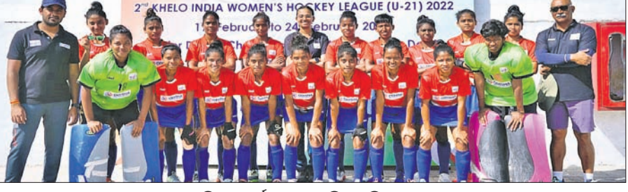
ଓଡ଼ିଶା ସ୍କୋର୍ସ୍ ହଷ୍ଟେଲ ମହିଳା ହକି ଦଳ।