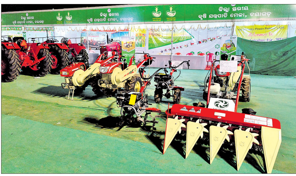
ମେଳାରେ ବିକ୍ରି ପାଇଁ ରଖାଯାଇଥିବା କୃଷି ଯନ୍ତ୍ରପାତି ।

ଜିଲ୍ଲାପ୍ରଧାନ କୃଷି ଯନ୍ତ୍ରପାତି ମେଳାରେ ଚାଷୀଙ୍କୁ ଦେଖିବାକୁ ମିଳୁଛି । ୩ୟ ଧର ମେଳା ଚାଲିଥିବାବେଳେ ଶୁକ୍ରବାର ମେଳା ଉଦ୍‌ଘାଟନ ହେବ । ହେଲେ ଚାଷୀ କାହିଁକି ଆସୁ ନାହାନ୍ତି ପଚାରିଲେ କୃଷି ବିଭାଗ ପକ୍ଷରୁ ଉତ୍ତର ମିଳୁଛି । ସ୍କୁଲଗୁଡ଼ିକ ଖାଁ ଖାଁ ଦେଖା ଯାଉଛି । ପ୍ରତ୍ୟହ ୧୦୦ ଚାଷୀଙ୍କ ପାଇଁ ପାଠଶାଳା ବ୍ୟବସ୍ଥା କରାଯାଉଥିଲେ ହେଁ ହାତ ଗଣତି କେତେଜଣ ଚାଷୀଙ୍କୁ ଛାଡ଼ିଦେଲେ ଅଣଚାଷୀଙ୍କୁ ନେଇ ଚାଲିଛି ମେଳା ବୋଲି ଅଭିଯୋଗ ହେଉଛି । ମେଳାରେ ୨୦ ଲକ୍ଷ ଟଙ୍କା ଖର୍ଚ୍ଚ ହେବା ପାଇଁ ଅବକଳ ରହିଥିବାବେଳେ ସଚେତନତା ଅଭାବରୁ ଚାଷୀ ନ ଆସିବାରୁ ୨୦ ଲକ୍ଷ ଟଙ୍କା ପାଣିରେ ପଡ଼ିଲା ବୋଲି କୁହାଯାଇଛି । ଏହି ଅବସ୍ଥାରେ ଜିଲ୍ଲା କୃଷି ବିଭାଗ ପକ୍ଷରୁ ଏକ ଖବରଦାତା ସମ୍ମିଳନୀ ସୋମବାର ଜିଲ୍ଲାପାଳଙ୍କ ସଭାଦାନା କକ୍ଷରେ ଅନୁଷ୍ଠିତ ହୋଇଯାଇଛି । ଜିଲ୍ଲାପ୍ରଧାନ କୃଷି ଯନ୍ତ୍ରପାତି ମେଳା ନେଇ ଜିଲ୍ଲାପାଳ ଓ ଜିଲ୍ଲା ପୂଷ୍ୟ କୃଷି ଅଧିକାରୀ ଏକ ଖବରଦାତା ସମ୍ମିଳନୀ କରି କହିଥିଲେ ଫେବୃୟାରୀ ୨୧ରୁ ମେଳା ଆରମ୍ଭ ହୋଇ ୨୪ରେ ଶେଷ