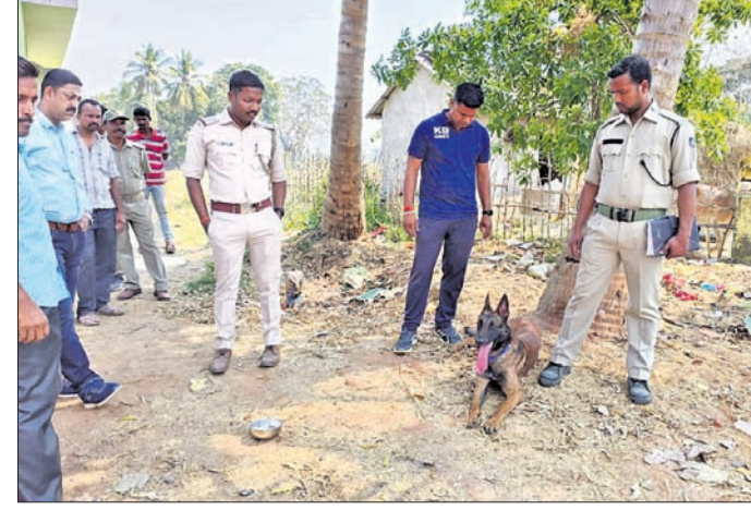
ସମ୍ପାଦକ କୁଳଦେବ ସହାୟତାରେ ପୋଲିସ୍‌ର ତଦନ୍ତ ।