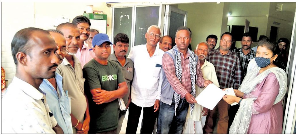
ରଘୁନାଥପୁର ତହସିଲଦାଋଣୀ ଗାନ୍ଧୀମାନେ ଅଭିଯୋଗ ପତ୍ର ଦେଉଛନ୍ତି।

ଭାରତମାଳା ପ୍ରକଳ୍ପ ଜାତୀୟ ରାଜପଥ ନିର୍ମାଣ ପାଇଁ ଜମି ଅଧିଗ୍ରହଣ ପ୍ରକ୍ରିୟାରେ ପ୍ରଶାସନିକ ଅଧିକାରୀଙ୍କ ଦାୟିତ୍ୱାବଳୀ ତଥା ଖାମୁଖିଆଳ ମନୋଭାବ ପ୍ରତିରୋଧ କରୁଛନ୍ତି।