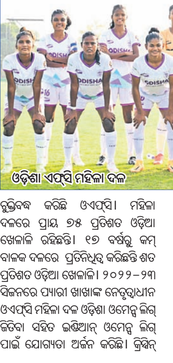
ଓଡ଼ିଶା ଏପିସି ମହିଳା ଦଳ

ପୁରୁସାଳ ନୂନାମୋଷ୍: ସାଧାରଣତନ୍ତ୍ର ଦିବସ ଅବସରରେ ଶ୍ରୀ ଶ୍ରୀ ବିଶ୍ୱବିଦ୍ୟାଳୟରେ ଏକ ପୁରୁସାଳ ନୂନାମୋଷ୍ ଆୟୋଜନ କରାଯାଇଥିଲା। ୩ ଦିନିଆ ନୂନାମୋଷ୍ରେ ବିଭିନ୍ନ କଲେଜ ଅଂଶଗ୍ରହଣ କରିଥିଲେ। -ସରୋଜ କୁମାର ଜେନା