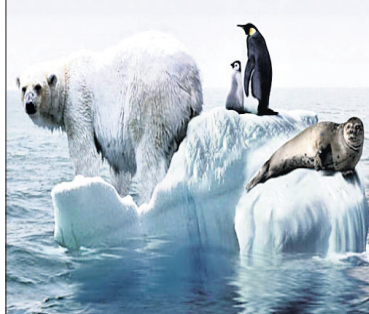
କୋଇଲା, ପେଟ୍ରୋଲିୟମ ଏବଂ ପ୍ରାକୃତିକ ବାଷ୍ପ ପରି ଜୀବାଣୁ ଇନ୍ଦ୍ର ଉପ ମୁଖ୍ୟ ଭୂମିକା ନିର୍ବାହ କରୁଛି।

କୋଇଲା, ପେଟ୍ରୋଲିୟମ ଏବଂ ପ୍ରାକୃତିକ ବାଷ୍ପ ପରି ଜୀବାଣୁ ଇନ୍ଦ୍ର ଉପ ମୁଖ୍ୟ ଭୂମିକା ନିର୍ବାହ କରୁଛି। ଜୀବାଣୁ ଇନ୍ଦ୍ରର ଦହନରେ ଅକ୍ଷୀରକାମ୍ପ ପରି ସବୁଜଗୃହ ବାଷ୍ପ ବାୟୁମଣ୍ଡଳକୁ ନିର୍ଗତ ହେଉଛି, ଯାହା ବାୟୁମଣ୍ଡଳରେ ଜମିରହି ପୃଥିବୀର ତାପମାତ୍ରା ବୃଦ୍ଧିକରୁଛି। ୨୦୧୮ରେ ବିଶ୍ୱ ଅକ୍ଷୀରକାମ୍ପ ନିର୍ଗମନ ୮୯% ଜୀବାଣୁ ଇନ୍ଦ୍ର ଏବଂ ଶିଳ୍ପ ଉତ୍ପାଦନ ହିଁ ଉତ୍ପତ୍ନ ହୋଇଥିଲା। ଏପରି ଅପ୍ରାକୃତିକ, ମାନବୀୟ ପ୍ରକ୍ରିୟା ଦ୍ୱାରା ଉତ୍ପାଦିତ ବୃଦ୍ଧି ଘଟି ପ୍ରାୟ-ଶିଳ୍ପବିଦ୍ୟୁତ୍ ଗୁଳନାରେ ସମ୍ପୃତ ତାପମାତ୍ରା ହାରାହାରି ୧.୨ ଡିଗ୍ରୀ ସେଲସିୟସ୍ ବୃଦ୍ଧି ପାଇଲାଣି, ଯାହାର ପରିଣାମରେ ବିଶ୍ୱ ଜଳବାୟୁରେ ବିନାଶକାରୀ ବିପର୍ଯ୍ୟୟ ସଂଘଟିତ ହେଉଛି। ଜଳବାୟୁ ପରିବର୍ତ୍ତନ ଉପରେ କାର୍ଯ୍ୟକାରୀ ଆକ୍ଷର ସରକାରୀ ଗୋଷ୍ଠୀ (ଆଇପିପିସି)ର ଅନୁସନ୍ଧାନ ବ୍ୟକ୍ତ କରେ ଉତ୍ତପତନ ହେଉଥିବା ବାଷ୍ପସବୁ ହିଁ ବିଶ୍ୱତାପନର କାରଣ। ଏହି କ୍ରମରେ ଏକ ଗଠନର ଘଟଣା ହେଉଛି ମହାସାଗର ଓ ସମୁଦ୍ର ଜଳ ପତନର କ୍ରମବୃଦ୍ଧି, ଯାହା ଉପକୂଳବର୍ତ୍ତୀ ଅଞ୍ଚଳ ଏବଂ କ୍ଷୁଦ୍ର ଦ୍ୱୀପ ରାଷ୍ଟ୍ରଗୁଡ଼ିକରେ ଆଗାମୀ ସମୟରେ ପ୍ରକଣ୍ଡକାରୀ ପରିସ୍ଥିତି ସୃଷ୍ଟିର ସମ୍ଭାବନା ବହନ କରେ। ଭାରତ, ବାଲ୍ୟାଦେଶ, ଚାଇନା, ଇଣ୍ଡିଆ, ନେଦରଲାଣ୍ଡ, ଆମେରିକା, ବ୍ରାଜିଲ, ଅଷ୍ଟ୍ରେଲିଆ, ନ୍ୟୁଜିଲାଣ୍ଡ ଏବଂ ପ୍ରଶାନ୍ତ ମହାସାଗରୀୟ ଦ୍ୱୀପପୁଞ୍ଜ, ଯେପରିକି ଚୋକା, ତୁଆଲୁ ଏବଂ ଫିଜି, ଅଧିକ ବିପଦପୂର୍ଣ୍ଣ ଦେଶଗୁଡ଼ିକ ମଧ୍ୟରେ ଅନ୍ତର୍ଭୁକ୍ତ। ସମୁଦ୍ର ପତନ ବୃଦ୍ଧି ଉପକୂଳ ଆର୍ଦ୍ରଭୂମି ଓ ନିମ୍ନାଞ୍ଚଳକୁ ଜଳମଗ୍ନ ତଥା ଉପକୂଳ ଅବସ୍ଥାକୁ ଦୁର୍ଭିତ୍ତ କରୁଛି ଏବଂ ବନ୍ୟା ସୃଷ୍ଟିରେ ସହାୟକ ହେଉଛି; ଏହାଦ୍ୱାରା ସମୁଦ୍ର ତଟବର୍ତ୍ତୀ ସ୍ଥଳଭାଗ ଓ ନିକଟସ୍ଥ ଭୂତଳ ଜଳ ମଧ୍ୟକୁ ଲୁଚି ଜଳର ପ୍ରବାହରେ ବୃଦ୍ଧି ଘଟୁଛି। ଗୁଡେରସ ସତର୍କ କରିଛନ୍ତି ଯେ, ବହୁଥିବା