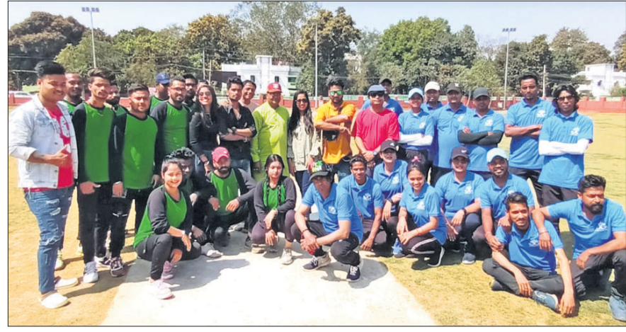
ରାଉରକେଲା ଉତ୍କଳ ଆର୍ଟିଷ୍ଟ ସଂଘ ପକ୍ଷରୁ ଆୟୋଜିତ କ୍ରିକେଟ ଟୁର୍ନାମେଣ୍ଟରେ ବିଜୟୀ ସେଲିକ୍ସିଟି ଦଳର ଖେଳାଳିମାନେ।