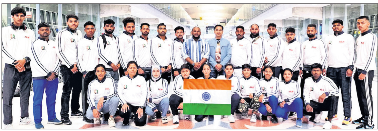
ବ୍ୟାଙ୍କଠାରେ ଶୁକ୍ରବାର ଆରମ୍ଭ ହୋଇଥିବା ଏସୀୟ କୁ-କୁଟ୍ସୁ ପ୍ରତିଯୋଗିତା ପାଇଁ ମନୋନୀତ ଭାରତୀୟ ଦଳ

ଭୁବନେଶ୍ୱର, ୨୪.୧୨ (କ୍ରୀଡ଼ା ପ୍ରତିନିଧି): ସେଣ୍ଟାଲ ସିଲ୍ ସର୍ଭିସେସ୍ ଆଣ୍ଡ୍ ସ୍ପୋର୍ଟ୍ସ୍ ବୋର୍ଡ୍ ଆନୁକୂଲ୍ୟରେ ତେରାଭୁନଠାରେ ସର୍ବଭାରତୀୟ ବେସାମରିକ କବାଡ଼ି ପ୍ରତିଯୋଗିତା ଉଦ୍‌ଘାଟିତ ହୋଇଛି।