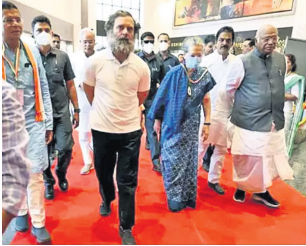
କଂଗ୍ରେସର ୮୫ତମ ମହାଅଧିବେଶନରେ ଯୋଗଦେବା ପାଇଁ ଶୁକ୍ରବାର ରାୟପୁରଠାରେ ପହଞ୍ଚିଥିବା ଅଧ୍ୟକ୍ଷ ମଲ୍ଲିକାର୍ଜୁନ ଖାର୍ଦ୍ଦୋ, ପୂର୍ବତନ ଅଧ୍ୟକ୍ଷ ସୋନିଆ ଗାନ୍ଧୀ, ରାହୁଲ ଗାନ୍ଧୀ ଓ ଦଳୀୟ ନେତୃବୃନ୍ଦ।

■ କଂଗ୍ରେସ ସମିଧାନ ସଂଗୋଧନକୁ ଝିଅରି କମିଟିର ମଞ୍ଚୁରୀ ■ ପୂର୍ବତନ ପ୍ରଧାନମନ୍ତ୍ରୀ, ଦଳ ଅଧ୍ୟକ୍ଷ ସିତଲ୍ୟସି ସଦସ୍ୟ ରହିବେ