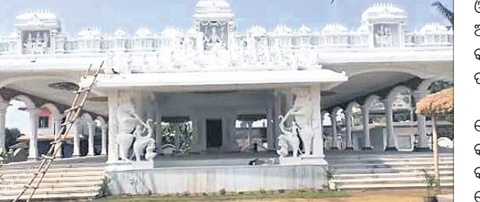
ସନ୍ତୋଷୀ ମା' ମନ୍ଦିର।

ଏକ ମନ୍ଦିର ନିର୍ମାଣ କରିଦେବା ପାଇଁ ପ୍ରତିଶ୍ରୁତି ଦେଇଥିଲେ। ୨୦୦୮ରୁ ଏହିଠାରେ ମନ୍ଦିର ନିର୍ମାଣ ଆରମ୍ଭ ହୋଇଥିବାବେଳେ ଏବେ ତାହା ଶେଷ ପର୍ଯ୍ୟାୟରେ ପହଞ୍ଚିଛି। ମନ୍ଦିରର ପୁଖ୍ୟାଳୀ ୪୬୫୫ ହୋଇଥିବାବେଳେ ଉଚ୍ଚତା ୬୫ ଫୁଟ୍ ରହିଛି। ସନ୍ତୋଷୀ ମା'ଙ୍କ ମନ୍ଦିର ସହ ଶିବ, ଗଣେଶ ଏବଂ ନବଗ୍ରହ ଏହି ମନ୍ଦିରରେ ନିର୍ମାଣ କରାଯାଇଛି। ୨୦୦୮ରେ ଏହି ମନ୍ଦିର ନିର୍ମାଣ ପାଇଁ ୩୦ ଲକ୍ଷ ଟଙ୍କା ବଜେଟ୍ ଥିବାବେଳେ କାର୍ଯ୍ୟ ୧୫ ବର୍ଷ ପରେ କାର୍ଯ୍ୟ ସମ୍ପୂର୍ଣ୍ଣ ହେବାବେଳକୁ ତାହା ବଡ଼ି ୭କୋଟି ଟଙ୍କାକୁ ଉର୍ଦ୍ଧ୍ୱରେ ପହଞ୍ଚି ଆସିଛି। ୨୮ ଚାରିଖରେ ମନ୍ଦିର ପ୍ରତିଷ୍ଠା କରାଯିବ। ପରେ ଏହା ଗ୍ରାମବାସୀ ଓ ଶ୍ରଦ୍ଧାଳୁଙ୍କ ଲାଗି ଉନ୍ନତ ହେବ।