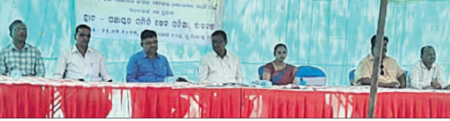
ଶିବିରରେ ମଞ୍ଚାଧୀନ ଅତିଥିବୃନ୍ଦ।