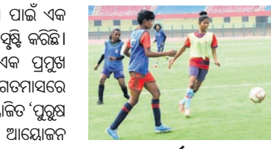
ବୃତ୍ତାନ୍ତ ପର୍ଯ୍ୟାୟରେ ୮୯ ବହୁପୁଖୀ ଲକ୍ଷ୍ମଣୀୟା ଷ୍ଟାଡ଼ିୟମ୍

ଗତ କିଛି ବର୍ଷ ମଧ୍ୟରେ କ୍ରୀଡ଼ା ଓଡ଼ିଶା ପାଇଁ ଏକ ଅଭିନବ ଏବଂ ଅସାଧାରଣ ପରିଚୟ ସୃଷ୍ଟି କରିଛି। ସାରା ଦେଶରେ ଓଡ଼ିଶା କ୍ରୀଡ଼ାର ଏକ ପ୍ରମୁଖ ଲକ୍ଷ୍ୟସ୍ଥଳୀ ଭାବେ ଉଦ୍ଧୃତ ହୋଇଛି। ଗତମସାରେ ଭୁବନେଶ୍ୱର ଓ ରାଉରକେଲାରେ ଆୟୋଜିତ 'ପୁରୁଷ ବିଶ୍ୱକପ୍' ହକି-୨୦୨୩ର ସଫଳ ଆୟୋଜନ ରାଜ୍ୟର କ୍ରୀଡ଼ା ଇତିହାସରେ ଏକ ନୂତନ ମାଇଲ୍‌ଷ୍ଟୋକ୍ ଭାବେ ସାବ୍ୟସ୍ତ ହୋଇଛି। କୋଭିଡ୍ ଏବଂ ପ୍ରତିକୂଳ ପାଣିପାଗର ପ୍ରତିବନ୍ଧକ ସତ୍ତ୍ୱେ ରାଉରକେଲା 'ବିର୍ସାପୁଣ୍ଡା ହକି ଷ୍ଟାଡ଼ିୟମ୍' ୧୫ ମାସରେ ନିର୍ମାଣ କରାଯାଇଥିଲା, ଯାହାକି ପୃଥିବୀର ସର୍ବବୃହତ୍ ଆସନ ସଂଖ୍ୟା ବିଶିଷ୍ଟ ଷ୍ଟାଡ଼ିୟମ ଭାବେ ଗିନିସ୍ ବୁକ୍ ଅଫ୍ ୱାର୍ଲ୍ଡ୍ ରେକର୍ଡ୍‌ସ୍‌ରେ ସ୍ଥାନ ପାଇଛି। କ୍ରୀଡ଼ା କ୍ଷେତ୍ରରେ ପ୍ରଗତିକୁ ନିରବଚ୍ଛିନ୍ନ ରଖିବା ପାଇଁ କ୍ରୀଡ଼ା ଓ ଯୁବସେବା ନିମନ୍ତେ ବଜେଟରେ ୧୨୧୭ କୋଟି ଟଙ୍କା ହୋଇଛି। ଏଥିପାଇଁ ୨୦୧୭-୧୮ ବଜେଟରେ ୧୪୯ କୋଟି ଟଙ୍କା ବ୍ୟୟବରାଦ ହୋଇଥିଲା। ଅର୍ଥାତ୍ ବ୍ୟୟବରାଦ ଏବେ ୮ ଗୁଣ ବୃଦ୍ଧି ପାଇଛି। ଓଡ଼ିଶା କ୍ରୀଡ଼ାରେ ବୃହତ୍ ନିବେଶ ଅନୁସାରେ ଅଗ୍ରଣୀ ରାଜ୍ୟ ହୋଇଛି, ଯାହାର ସୁପକ ଆଗାମୀ ଦଶନ୍ଧିରେ ମିଳିପାରିବ ବୋଲି ଅର୍ଥମନ୍ତ୍ରୀ ନିରଞ୍ଜନ ପୂଜାରୀ କହିଛନ୍ତି।