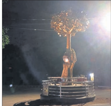
ଲାଇଟ୍ ନ ଥିବାରୁ ସେଲ୍ଫି ପଏଣ୍ଟ ଅନ୍ଧାରରେ ରହିଛି। ଲାଗିଥିବା ଲାଇଟ୍ ନାହିଁ।