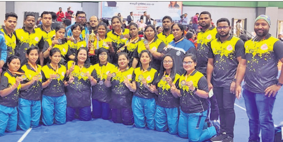
ତେରାଭୁନଠାରେ ଅନୁଷ୍ଠିତ ସର୍ବଭାରତୀୟ ବେସାମରିକ କବାଡ଼ିରେ ବ୍ରୋଞ୍ଜ ପଦକ ଜିତିଥିବା ଓଡ଼ିଶା ମହିଳା ଦଳ

ପାରିବାରିକ କାରଣରୁ ଅଷ୍ଟ୍ରେଲିଆ ଅଧିନାୟକ ପ୍ୟାଟ୍ କୁମ୍ଭିନୁ ଭାରତ ବିପକ୍ଷ ତୃତୀୟ କ୍ରିକେଟ୍ ଟେଷ୍ଟରୁ ମଧ୍ୟ ଓହରିଯାଇଛନ୍ତି। ତାଙ୍କ ଡେବ୍ୟୁ ଷ୍ଟିଭ୍ ସ୍ମିଥ୍ ଇନ୍ଦୋରରେ ମାର୍ଚ୍ଚ ୧ରୁ ଆରମ୍ଭ ହେବାକୁଥିବା ଏହି ମ୍ୟାଚରେ ଦଳର ନେତୃତ୍ୱ ନେବେ।