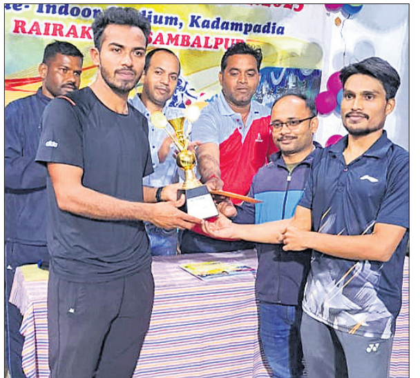
ଚାମ୍ପିୟନ ଯୋଡ଼ିକୁ ପୁଷ୍ପାଧିଷ୍ଠିତ ରୁପି ପ୍ରଦାନ କରୁଛନ୍ତି

ରେଭାଖୋଲ ୨୪.୧୨ (ଡି.ଏନ.ଏ) ରେଭାଖୋଲର ପଞ୍ଚଶତା ବ୍ୟାଡ଼ମିଣ୍ଟନ ଆସୋସିଏଶନ ଆନୁକୂଲ୍ୟରେ ରାଜ୍ୟ ବ୍ୟାଡ଼ମିଣ୍ଟନ ସଂଘର ଅନୁମୋଦନ କ୍ରମେ ସ୍ଥାନୀୟ ଇନ୍ଦ୍ରପୋର ସ୍ଥାଡ଼ିୟମରେ ଗୁରୁବାର ସପ୍ତମ ରାଜ୍ୟସ୍ତରୀୟ ପୁରୁଷ ଡବଲ୍ ବ୍ୟାଡ଼ମିଣ୍ଟନ ଚାମ୍ପିୟନଶିପ୍ ଅନୁଷ୍ଠିତ ହୋଇଯାଇଛି।