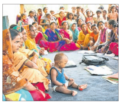
ସ୍ୱୟଂ ସହାୟକ ଗୋଷ୍ଠୀର ସଭାରେ ମହିଳାମାନେ ସଭାରେ ଯୋଗଦେଇଛନ୍ତି।

ମହିଳାଙ୍କ ସଶକ୍ତକରଣ ବିନା କୌଣସି ପରିବାର, ସମାଜ, ରାଜ୍ୟ କିମ୍ବା ଦେଶ ଅଗ୍ରଗତି କରିପାରିନାହିଁ। ତେଣୁ ପୁଖ୍ୟମନ୍ତ୍ରୀ ନବୀନ ପଟ୍ଟନାୟକ ବିଶ୍ୱାସ କରନ୍ତି ଯେ, ମହିଳାମାନେ ସାମାଜିକ ପରିବର୍ତ୍ତନ ପାଇଁ ଅତ୍ୟନ୍ତ ଗୁରୁତ୍ୱପୂର୍ଣ୍ଣ। ୬ ଲକ୍ଷରୁ ଅଧିକ ସ୍ୱୟଂ ସହାୟକ ଗୋଷ୍ଠୀ (ଏସ୍‌ଏଚ୍‌ସି) ଗଠନ କରାଯାଇ ମିଶନ ଶକ୍ତି ମାଧ୍ୟମରେ ୭୦ ଲକ୍ଷରୁ ଅଧିକ ମହିଳାଙ୍କୁ ଆୟ ସୃଷ୍ଟିକାରୀ କାର୍ଯ୍ୟକ୍ରମ ଜରିଆରେ ସଶକ୍ତ କରାଯାଇଛି। ଏହାଦ୍ୱାରା ସେମାନଙ୍କ ଆୟର ୫ ବର୍ଷ ମଧ୍ୟରେ ସ୍ୱୟଂ ସହାୟକ ସରକାର ସ୍ୱୟଂ ସହାୟକ ଗୋଷ୍ଠୀଗୁଡ଼ିକୁ ୧୦ ହଜାର କୋଟି