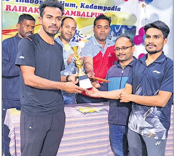
ଚାମ୍ପିୟନ ଯୋଡ଼ିକୁ ପୁଷ୍ପାଧିପ୍ତି ଗ୍ରହଣ ପ୍ରଦାନ କରୁଛନ୍ତି।

ରେଭାଖୋଲ ୨୪/୧୨ (ଡି.ଏନ.ଏ) ରେଭାଖୋଲର ପଞ୍ଚଶତା ବ୍ୟାଡ଼ମିଣ୍ଟନ ଆସୋସିଏସନ ଆନୁକୂଲ୍ୟରେ ରାଜ୍ୟ ବ୍ୟାଡ଼ମିଣ୍ଟନ ସଂଘର ଅନୁମୋଦନ କ୍ରମେ ସ୍ଥାନୀୟ ଇନ୍ଦ୍ରପାଠ୍ୟ ସ୍ଥାପନାରେ ଗୁରୁବାର ସପ୍ତମ ରାଜ୍ୟସ୍ତରୀୟ ପୁରୁଷ ଡବଲ୍ ବ୍ୟାଡ଼ମିଣ୍ଟନ ଚାମ୍ପିୟନସ୍ଥିପ୍ ଅନୁଷ୍ଠିତ ହୋଇଯାଇଛି।