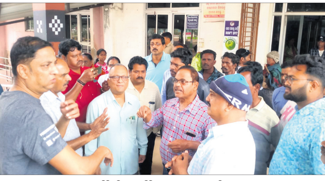
ମିଳିତ ଟିମ୍ ପକ୍ଷରୁ ସିଟିଂରୁମ୍ ଘେରାଇ କରାଯାଇଛି।

ସାତ ମହଲା କୋଠା ଖର୍ଚ୍ଚ ହୋଇଛି ୫୦ କୋଟି ଟଙ୍କା। ତଳେ ଛିଡ଼ା ହୋଇ ଦେଖିଲେ ଆଖି ପାଉରାହିଁ। ବାହାରି ଝଟୁଥିବା ଦେଢ଼ାମାଳ ଜିଲ୍ଲା ସ୍ୱାସ୍ଥ୍ୟସେବାର ମୁଖ୍ୟ ପ୍ରତିଷ୍ଠାନର ଭିତର ଅବସ୍ଥା କିନ୍ତୁ ଜମାଉ ଭଲ ନୁହେଁ। ରୋଗୀଙ୍କୁ ଗୁଣାମୂଳକ ସେବା ପ୍ରଦାନ ତ ଦୂରର କଥା, ଖାଦ୍ୟ ମଧ୍ୟ ଠିକ୍ ସମୟରେ ଦିଆଯାଉନାହିଁ। ଅଧା ଡାକ୍ତର ପଦବୀ ଥିବା ବେଳେ ସେମାନଙ୍କ ମଧ୍ୟରୁ ଅନେକଙ୍କ ପୂର୍ବାହ୍ନ ୮ଟା ପୂର୍ବରୁ ଦେଖାମିଳୁନାହିଁ। ଆବଶ୍ୟକ ସମୟରେ ସେବା ନ ପାଇ ରୋଗୀ କଲବଲ ହେଉଥିବା ଅଭିଯୋଗ ହୋଇଆସୁଛି। ଶୁକ୍ରବାର ସକାଳେ ୭ଟାରେ ଜିଲ୍ଲା ଓଜଳ ସଂଘ ଆହ୍ୱାନରେ ଜିଲ୍ଲା ଶିଳ୍ପ