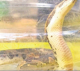
ଦେଢ଼ାମାଳ ଅଫିସ, ୨୪୧୨

ଡାକ୍ତରଖାନା ସୂତ୍ରରୁ ମିଳୁଥିବା ସୂଚନା ଅନୁଯାୟୀ, ଶୁକ୍ରବାର ସକାଳେ ସମ୍ପୂର୍ଣ୍ଣ ବ୍ୟକ୍ତିଙ୍କୁ ସାପ କାମୁଡ଼ି ଦେଇଥିଲା। ଏହାପରେ ସେ ଚିକିତ୍ସା ପାଇଁ ଜିଲ୍ଲା ମୁଖ୍ୟ ଚିକିତ୍ସାଳୟକୁ ଆସିଥିଲେ। ଏଥିରେ କାମୁଡ଼ିଥିବା ସାପକୁ କୌଶଳକ୍ରମେ ଏକ ଡବାରେ ବନ୍ଦ କରି ସାଙ୍ଗରେ ନେଇ ଆସିଥିଲେ। ସାପକୁ ଦେଖିବାକୁ ଚିକିତ୍ସାଳୟରେ ଭିଡ଼ ଜମିଥିଲା। ହେଲେ ଚିକିତ୍ସିତ ହେବା ପରେ ରୋଗୀଜଣକ ସାପକୁ ଡାକ୍ତରଖାନାରେ ଛାଡ଼ି ଦେଇଥିଲେ। ଜଣେ ମହିଳା ଡବାରେ ବନ୍ଦ ଥିବା ସାପ ସମ୍ପର୍କରେ ଡାକ୍ତରଖାନା କର୍ମଚାରୀଙ୍କୁ ସୂଚନା ଦେଇଥିଲେ। ସୂଚନାପାଇ ସର୍ପ ଉଦ୍ଧାରକାରୀ ଦଳର ସଦସ୍ୟ ପହଞ୍ଚି ସାପଟିକୁ ଉଦ୍ଧାର କରିଥିଲେ। ସଦର ରେଞ୍ଜି ବନ୍ଦ କର୍ମଚାରୀଙ୍କ ଉପସ୍ଥିତିରେ ଏହାକୁ ମୋଡ଼ା ସଂରକ୍ଷିତ ଜଙ୍ଗଲରେ ଛାଡ଼ି ଦିଆଯାଇଥିବା ଜଣାପଡ଼ିଛି।