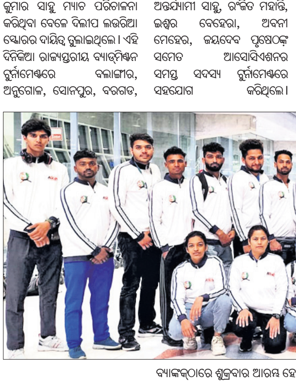
ବ୍ୟାଙ୍କଠାରେ ଶୁକ୍ରବାର ଆରମ୍ଭ ହୋଇଥିବା ଏସୀୟ କୁ-କୁଟ୍ସୁ ପ୍ରତିଯୋଗିତା ପାଇଁ ମନୋନୀତ ଭାରତୀୟ ଦଳ।