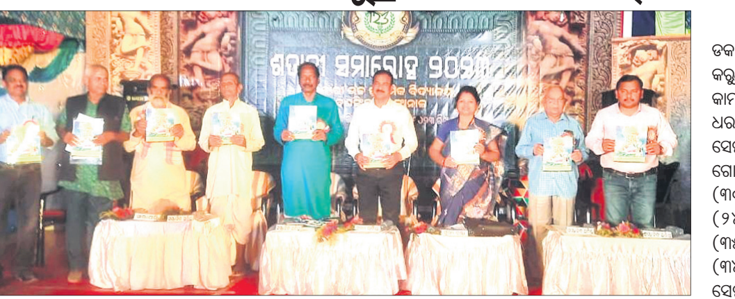
ଅତିଥିମାନେ ସ୍ୱରଶିଳା ଉନ୍ମୋଚନ କରୁଛନ୍ତି।

ଡାକ୍ତରଖାନା ସୂତ୍ରରୁ ମିଳୁଥିବା ସୂଚନା ଅନୁଯାୟୀ, ଶୁକ୍ରବାର ସକାଳେ ସମ୍ପୂର୍ଣ୍ଣ ବ୍ୟକ୍ତିଙ୍କୁ ସାପ କାମୁଡ଼ି ଦେଇଥିଲା। ଏହାପରେ ସେ ଚିକିତ୍ସା ପାଇଁ ଜିଲ୍ଲା ମୁଖ୍ୟ ଚିକିତ୍ସାଳୟକୁ ଆସିଥିଲେ। ଏଥିରେ କାମୁଡ଼ିଥିବା ସାପକୁ କୌଶଳକ୍ରମେ ଏକ ଡବାରେ ବନ୍ଦ କରି ସାଙ୍ଗରେ ନେଇ ଆସିଥିଲେ। ସାପକୁ ଦେଖିବାକୁ ଚିକିତ୍ସାଳୟରେ ଭିଡ଼ ଜମିଥିଲା। ହେଲେ ଚିକିତ୍ସିତ ହେବା ପରେ ରୋଗୀଜଣକ ସାପକୁ ଡାକ୍ତରଖାନାରେ ଛାଡ଼ି ଦେଇଥିଲେ। ଜଣେ ମହିଳା ଡବାରେ ବନ୍ଦ ଥିବା ସାପ ସମ୍ପର୍କରେ ଡାକ୍ତରଖାନା କର୍ମଚାରୀଙ୍କୁ ସୂଚନା ଦେଇଥିଲେ। ସୂଚନାପାଇ ସର୍ପ ଉଦ୍ଧାରକାରୀ ଦଳର ସଦସ୍ୟ ପହଞ୍ଚି ସାପଟିକୁ ଉଦ୍ଧାର କରିଥିଲେ। ସଦର ରେଞ୍ଜି ବନ୍ଦ କର୍ମଚାରୀଙ୍କ ଉପସ୍ଥିତିରେ ଏହାକୁ ମୋଡ଼ା ସଂରକ୍ଷିତ ଜଙ୍ଗଲରେ ଛାଡ଼ି ଦିଆଯାଇଥିବା ଜଣାପଡ଼ିଛି।