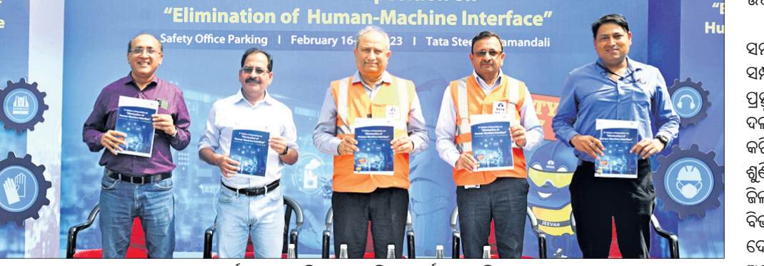
କାର୍ଯ୍ୟକ୍ରମରେ ଅତିଥିମାନେ ପୂର୍ବକା ପ୍ରଦର୍ଶନ କରୁଛନ୍ତି।