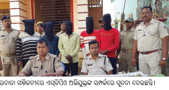
ଖବରଦାତା ସମ୍ମିଳନୀରେ ଏସ୍‌ପିଏ ଅଭିଯୁକ୍ତଙ୍କ ସମ୍ପର୍କରେ ସୂଚନା ଦେଇଛନ୍ତି।