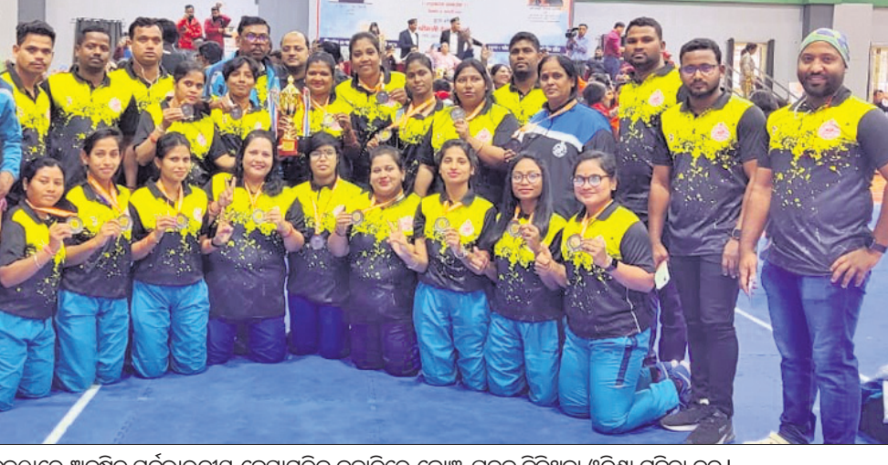
ତେରାଭୁନଠାରେ ଅନୁଷ୍ଠିତ ସର୍ବଭାରତୀୟ ବେସାମରିକ କବାଡ଼ିରେ ବ୍ରୋଞ୍ଜ ପଦକ ଜିତିଥିବା ଓଡ଼ିଶା ମହିଳା ଦଳ।

ପାରିବାରିକ କାରଣରୁ ଅଷ୍ଟ୍ରେଲିଆ ଅଧିନାୟକ ପ୍ୟାଟ୍ କୁମ୍ଭିନୁ ଭାରତ ବିପକ୍ଷ ତୃତୀୟ କ୍ରିକେଟ ଚେଷ୍ଟରୁ ମଧ୍ୟ ଓହରିଯାଇଛନ୍ତି। ତାଙ୍କ ଚେତୁରି ସ୍ମିଥ୍ ଇନ୍ଦୋରରେ ମାର୍ଚ୍ଚ ୧ରୁ ଆରମ୍ଭ ହେବାକୁଥିବା ଏହି ମ୍ୟାଚରେ ଦକ୍ଷିଣ ନେତୃତ୍ୱ ନେବେ। ଗତ ସପ୍ତାହରେ ଦ୍ୱିତୀୟ ଚେଷ୍ଟରେ ଅଷ୍ଟ୍ରେଲିଆର ପରାଜୟ ପରେ କୁମ୍ଭିନୁ ସ୍ୱେଚ୍ଛା ଫେରିଥିଲେ।