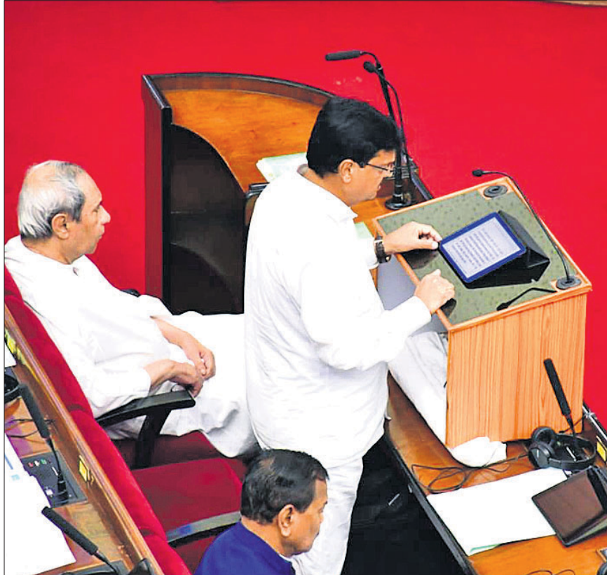
ଅର୍ଥମନ୍ତ୍ରୀ ନିରଞ୍ଜନ ପୂଜାରୀ ଶୁକ୍ରବାର ବିଧାନସଭାରେ ୨୦୨୩-୨୪ ପୁଞ୍ଜୀକୃତ ବଜେଟ୍ ଉପସ୍ଥାପନ କରୁଛନ୍ତି ।

ଲୋକଙ୍କ ବଜେଟ୍: ପୁଞ୍ଜୀକୃତ ୨୦୨୩-୨୪ ଆର୍ଥିକ ବର୍ଷ ପାଇଁ ଶୁକ୍ରବାର ବିଧାନ ସଭାରେ ବଜେଟ୍ ଆଗତ ହୋଇଛି । ଏହି ବଜେଟ୍ ଉପରେ ପ୍ରତିକ୍ରିୟା ଦେଇ ପୁଞ୍ଜୀକୃତ ନବୀନ ପଟ୍ଟନାୟକ କହିଛନ୍ତି ଯେ, ଏହା ଏକ ଲୋକାଭିମୁଖୀ ବଜେଟ୍ । ଏହି ବଜେଟ୍ ଲୋକଙ୍କର, ଲୋକଙ୍କ ଦ୍ୱାରା ଏବଂ ଲୋକମାନଙ୍କ ପାଇଁ । ଏହି ବଜେଟ୍ ଓଡ଼ିଶାର ବିକାଶକୁ ଆଗକୁ ନେବ ।