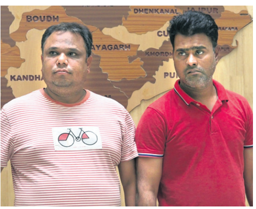
ଚିରଫ ବୁଲ ଅଭିଯୁକ୍ତ।

ଭୁବନେଶ୍ୱର, ୨୪/୧ (ବୁଧବୋ) ଫୁଟବଲ୍ ବେଟିଂ/ବେଟିଂ ଆସ୍ତ (18football.com) ମାଧ୍ୟମରେ ଦେଶବ୍ୟାପୀ ୧ହଜାର କୋଟିରୁ ଉର୍ଦ୍ଧ୍ୱ ଟଙ୍କାର ଠକେଇ ହୋଇଛି। ଓଡ଼ିଶାର କେବଳ ଗଞ୍ଜାମ ଜିଲାରୁ ୮୦୦ରୁ ଉର୍ଦ୍ଧ୍ୱ ବ୍ୟକ୍ତି ଠକେଇର ଶିକାର ହୋଇ ୨୦ କୋଟିରୁ ଅଧିକ ଟଙ୍କା ହରାଇଛନ୍ତି। ଏହି ଠକେଇରେ ସମ୍ପୂର୍ଣ୍ଣ ୨ ସହଯୋଗୀଙ୍କୁ ଜାଇମଗ୍ରାଣ୍ଡ ଇଣ୍ଡଷ୍ଟ୍ରି ପଶ୍ଚିମବଙ୍ଗର ହାଣ୍ଡିଆରୁ ଚିରଫ କରିବା ପରେ ରାଜକେଟ ସମ୍ପର୍କରେ ବହୁ ଗଞ୍ଜାମୀକର ତଥ୍ୟ ମିଳିଛି। ଚିରଫ ଅଭିଯୁକ୍ତଙ୍କୁ ହେଲେ ରୁଣ୍ଡୁମ୍ ଖାନ୍ ଓ ଏମ୍. ସି.ଏମ୍. ରାଜକେଟର ମାଷ୍ଟରମାଇଣ୍ଡ ରାଜନୀତ ହିଁ କେନ୍ଦ୍ରରେ ରହି ଏହି ଠକେଇ ଆସ୍ତ ଠକାଣ୍ଡକୁ ଜାଇମଗ୍ରାଣ୍ଡର ଅଧିନିତ ଅପରାଧ ଶାଖା (ଇଓଡିଏଲ୍) ଜାଣିବା ପରେ ତଦତତ୍ତ୍ୱ କୋରଦାନ କରିଛି। ମାଷ୍ଟରମାଇଣ୍ଡଙ୍କ ପରାମର୍ଶରେ ଅଭିଯୁକ୍ତଙ୍କୁ ହିଁ ଏହି ରୁଣ୍ଡୁମ୍ ଫାକ୍ରିକ୍ସ ପ୍ରାଇଭେଟ୍ ଲିମିଟେଡ୍ ନାମରେ ଏକ ସେଲ୍ କମ୍ପାନୀ ଖୋଲି ଉଭୟ ନିର୍ଦ୍ଦେଶକ ରହିବା ସହ ଏହା ମାଧ୍ୟମରେ ଠକେଇ ପ୍ରାକ୍ତ୍ୟକ୍ତ ବଜାର ଚାଲିଥିଲେ। ତେବେ ଅଭିଯୁକ୍ତଙ୍କୁ ବୁଧବାର ଚିରଫ କରିବା ପରେ ଇଓଡିଏଲ୍ ହାତରେ ଚିରଫ କୁଟିଆଇଲ୍ ମାନ୍ଦିଷ୍ଟ୍ରିକ୍ କୋର୍ଟରେ ହାଜର କରିଥିଲା। ସେଠାରୁ ଉଭୟଙ୍କୁ ୫ବର୍ଷର ଗ୍ରାଣ୍ଡିଂ ରିମାଣ୍ଡରେ ଓଡ଼ିଶା ଆଣି ଶୁଣ୍ଠିଦାନ ବ୍ରହ୍ମପୁର ଓଡ଼ିଆଇଡି କୋର୍ଟରେ ହାଜର କରାଯାଇଥିଲା। ଜାମିନ ନାମାଣ୍ଡର ହେବାରୁ ସେମାନଙ୍କୁ ବିଚାର ବିଚାରାଳୟ ହାଜରକୁ ପଠାଇ ଦିଆଯାଇଛି। ତେବେ ତଦବେଳେ ୧୫୦ଟି ବ୍ୟାଙ୍କ ଆକାଉଣ୍ଟକୁ ଠକେଇ ଟଙ୍କା ଯାଇଥିବା ଜଣାପଡିବା ପରେ ୧୭ଟି ଆକାଉଣ୍ଟକୁ ଇଓଡିଏଲ୍ ଯାଞ୍ଚ କରିଛି। ସେଥିରେ ୧୦୮ କୋଟି ଟଙ୍କାର ଆର୍ଥିକ କାରବାର ସମ୍ଭବ କରନ୍ତି।