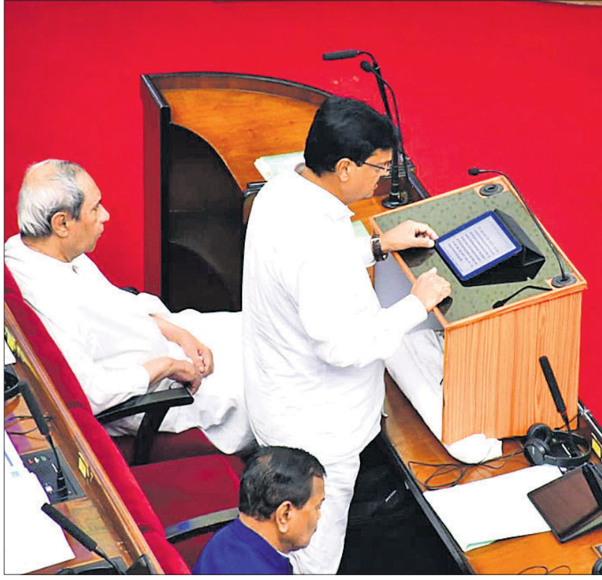
ଅର୍ଥମନ୍ତ୍ରୀ ନିରଞ୍ଜନ ପୂଜାରୀ ଶୁକ୍ରବାର ବିଧାନସଭାରେ ୨୦୨୩-୨୪ ପୁଞ୍ଜାମନ୍ତ୍ରୀ ବଜେଟ୍ ଉପସ୍ଥାପନ କରୁଛନ୍ତି ।

ଲୋକଙ୍କ ବଜେଟ୍: ପୁଞ୍ଜାମନ୍ତ୍ରୀ ୨୦୨୩-୨୪ ଆର୍ଥିକ ବର୍ଷ ପାଇଁ ଶୁକ୍ରବାର ବିଧାନ ସଭାରେ ବଜେଟ୍ ଆଗତ ହୋଇଛି । ଏହି ବଜେଟ୍ ଉପରେ ପ୍ରତିକ୍ରିୟା ଦେଇ ପୁଞ୍ଜାମନ୍ତ୍ରୀ ନବୀନ ପଟ୍ଟନାୟକ କହିଛନ୍ତି ଯେ, ଏହା ଏକ ଲୋକାଭିମୁଖୀ ବଜେଟ୍ । ଏହି ବଜେଟ୍ ଲୋକଙ୍କର, ଲୋକଙ୍କ ଦ୍ୱାରା ଏବଂ ଲୋକମାନଙ୍କ ପାଇଁ । ଏହି ବଜେଟ୍ ଓଡ଼ିଶାର ବିକାଶକୁ ଆଗକୁ ନେବ ।