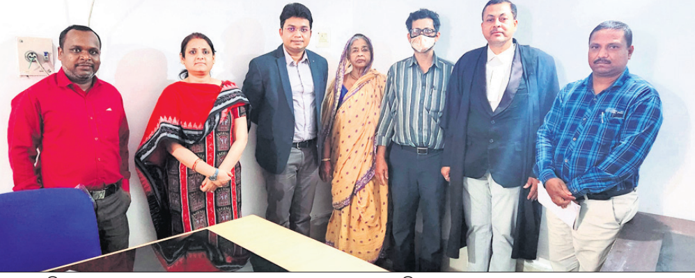
କଟକ ଜିଲ୍ଲା ଆଇନ ସେବା ପ୍ରାଧିକରଣରେ ଆପୋସ ସମାଧାନକର୍ତ୍ତା ଉପସ୍ଥିତ ବୃଦ୍ଧା ମାଆ, ତାଙ୍କ ପୁଅବୋହୁ ଓ ଅନ୍ୟମାନେ।

କଟକ ଅଫିସ୍, ୨୪୧୨: ବିକଳ ବିବାହ ସମାଧାନ ମାଧ୍ୟମରେ ବୃଦ୍ଧା ମା'ଙ୍କୁ ତାଙ୍କ ପୁଅ ଘରକୁ ନେଇଛନ୍ତି। ଆପୋସ ବୁଦ୍ଧାମଣା ମାଧ୍ୟମରେ ରାଜ୍ୟ ଆଇନସେବା ପ୍ରାଧିକରଣ (ଓଏସଏଲଏସଏ) ଦ୍ୱାରା ଏହା କରାଯାଇଛି।