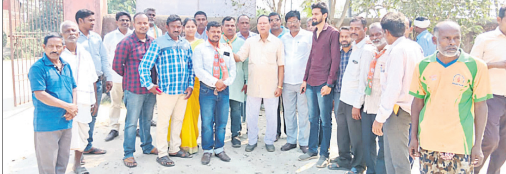
ରାଜନିକାରେ ଭାଜପା ପ୍ରତିନିଧି ଦଳ ଧାନ ମଣ୍ଡି ଦେଖିଛନ୍ତି।