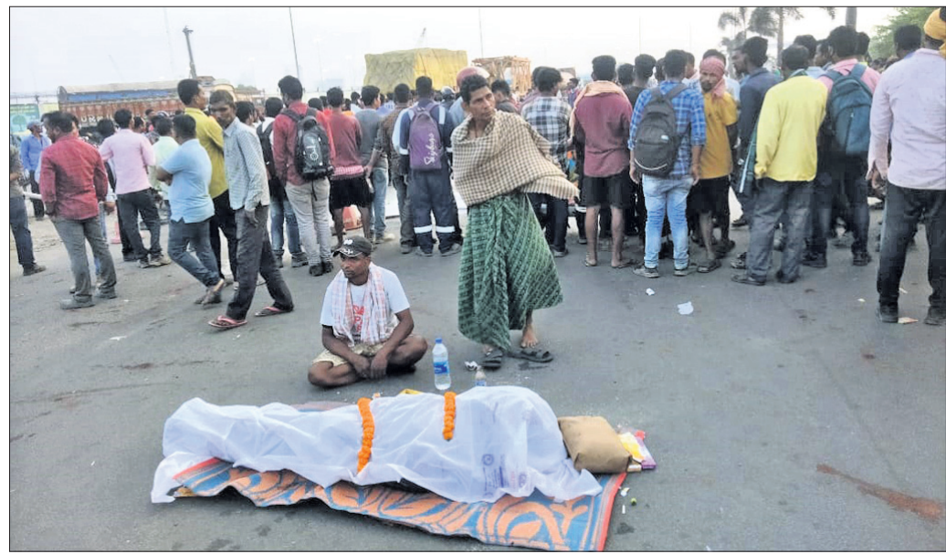
ମୃତଦେହ ରଖି ପରିବାର ସଦସ୍ୟ, ଗ୍ରାମବାସୀ ଆଇଓସିଏଲ୍ ମୁଖ୍ୟ ଫାଟକ ଅବରୋଧ କରିଛନ୍ତି ।