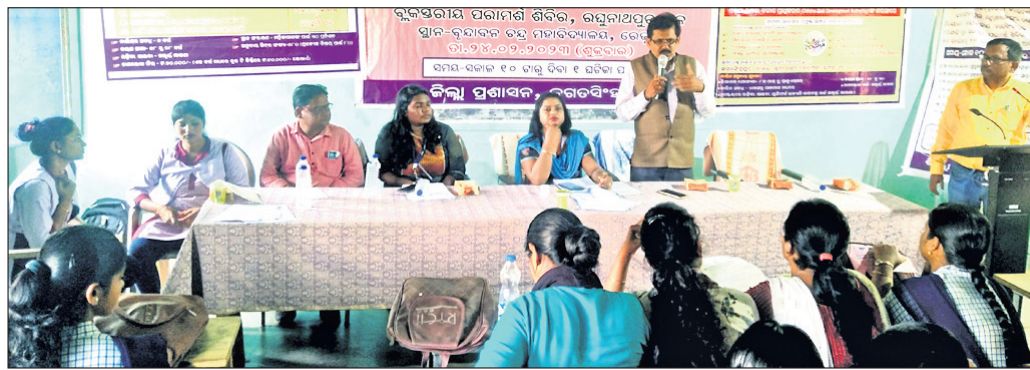
ଶିବିରରେ ଯୋଗଦେଇଥିବା ଅତିଥି ଓ ଅନ୍ୟମାନେ ।