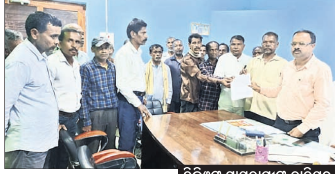
ରାଜନିକା, ୨୪୧୨ (ଡି.ଏନ.ଏ.)

ରାଜନିକା ବୃକ୍ଷ ଅଞ୍ଚଳରେ ୫-ଟି ସ୍କୁଲ ରୂପାନ୍ତରଣରେ ପାତରଅନ୍ତର କରାଯାଇଛି। ଏ ନେଇ ଶୁକ୍ରବାର ବୃକ୍ଷ ଅଞ୍ଚଳର ପଞ୍ଚାୟତ ପଞ୍ଚାୟତର ବଡ଼ହଳପଡ଼ା ଗାଁରେ ଥିବା ମା' କୁଞ୍ଜକାଳିକା ହାଇସ୍କୁଲରେ ଏହାର ବ୍ୟକ୍ତିଗତ ବେଶ୍ୱାବାକୁ ମିଳିଛି। ଗ୍ରାମବାସୀଙ୍କ କହିବା ଅନୁଯାୟୀ, ୧୯୯୨ରୁ ନିର୍ମିତ ଏହି ହାଇସ୍କୁଲଟି ଆଜି ବି ଚାଲୁ ରହିଛି। ହେଲେ ଚଞ୍ଚଳତା କରି ଏହି ସ୍କୁଲ ପରିବର୍ତ୍ତେ ମା' କୁଞ୍ଜକାଳିକା ଉଚ୍ଚ ବିଦ୍ୟାଳୟ ପାଠ୍ୟପୁସ୍ତକ ୫-ଟିରେ ରୂପାନ୍ତରଣ କରାଯାଇଛି। ଏ ନେଇ ଶିକ୍ଷାର ମାନ ବୃଦ୍ଧି ଲକ୍ଷ୍ୟରେ ରାଜ୍ୟ ପରିବେଶ ପ୍ରଦୂଷିତ ହେଉଛି। ଏଥିଯୋଗୁଁ ବିଜ୍ଞାନ ପ୍ରକାରର ରୋଗ ସୃଷ୍ଟି ହେଉଛି।