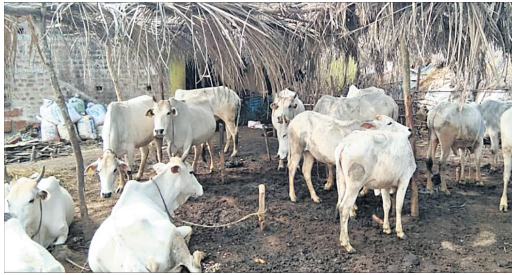
କଣେ ଲୋକଙ୍କର ଗାଈ ଅଛନ୍ତି ଗୁହାଳ ହୋଇପାରୁନି ।

ଗୋଟାଏ ଗାଈ ପାଖରେ ମହାତ୍ମା ଗାନ୍ଧୀ ଜାତୀୟ ଗ୍ରାମାଣ ନିର୍ମୂଳ ନିଯୁକ୍ତି ଯୋଜନା (ଏନଏସ୍‌ଆଇଏସ୍‌ଏସ୍) ମିଳୁଥିବା ମୋ ଗୁହାଳ ଯୋଜନା ଅପହସ୍ତ ହୋଇଗଲା । ଏଥିପାଇଁ ସରକାର ୧ ଲକ୍ଷ ୧୫ ହଜାର ଟଙ୍କା ଅନୁଦାନ ଯୋଗାଇ ଦେଇଥିଲେ ମଧ୍ୟ ଗୋଟାଏ ଗାଈ ଯୋଜନାର ସୁଫଳ ପାଇ ପାରୁନାହାନ୍ତି । ବାରମ୍ବାର ଆବେଦନ ପରେ ବି କାହିଁକି ଯୋଜନାର ସୁଫଳ ମିଳୁନି ସେନେଇ ପ୍ରଶ୍ନକାରୀ ସୃଷ୍ଟି ହୋଇଛି । କେତେଜଣ ଶ୍ରମିକମାନେ ନିଜକୁ ଗାଈ ଦର୍ଶାଇ ସରକାରୀ ବାବୁଙ୍କୁ ଧରାଧରା କରି ଯୋଜନାର ସୁଫଳ ନେଉଛନ୍ତି ବୋଲି ଅଭିଯୋଗ ହୋଇ ଆସୁଛି । ଅନ୍ୟପକ୍ଷେ କ୍ଷେତ୍ର ପରିଦର୍ଶନ କରାଯାଇ ନ ଥିବାରୁ ଯୋଜନାର ସୁଫଳ ମିଳୁନି ବୋଲି ଅଭିଯୋଗ ହେଉଛି । ନୟାଗଡ଼ ଜିଲାର ଆଦିବାସୀ ଅଧିକାଂଶ ନୂଆଗାଁ, ଦଶପଲ୍ଲୀ, ରଣପୁର, ଗଣିଆ ଓ ଖଣ୍ଡପଡ଼ା ବ୍ଲକର ଆଦିବାସୀ ଗାଁଗୁଡ଼ିକରେ ଥିବା ଗୁହାଳର ଉପରେ ବଦଳି ପାରୁନି । ସେହିପରି ଓଡ଼ିଶା, ଭାରତ, ନୟାଗଡ଼ ବ୍ଲକରେ ମଧ୍ୟ ଯୋଜନାର କାର୍ଯ୍ୟକାରୀ ଉପରେ ପ୍ରଶ୍ନ ହେଉଛି । ସରକାର କ୍ଷମାଧିକାରୀ ଟଙ୍କା ଅନୁଦାନ ଯୋଗାଉଥିଲେ ମଧ୍ୟ କାହିଁକି ଗୋଟାଏ ଗାଈ ପାଖରେ ଯୋଜନା ଅପହସ୍ତ ହୋଇ ରହିଛି ତା'ର ସମାଧାନ ଦେବା ସରକାରୀ ପୁଣି ଯୋଜନାରେ ଏ ଯୋଜନାରେ ଗୁହାଳ କରୁଛନ୍ତି ସେଥିରୁ ଅଧିକାଂଶ ଶେଷ ହୋଇପାରୁନି । ସମସ୍ତ ଯୋଜନାକୁ ସଫଳ କରିବାକୁ ଜିଲାର ବିତିପୋଳକର ଆଡ଼ିକଟା ଥିବା ପରି ମନେ ହେଉଛି ବୋଲି କୁହାଯାଉଛି । ପ୍ରକୃତ ଗାଈ ସରକାରୀ ଯୋଜନାର ସୁଫଳ ନେଇପାରୁନାହାନ୍ତି ।