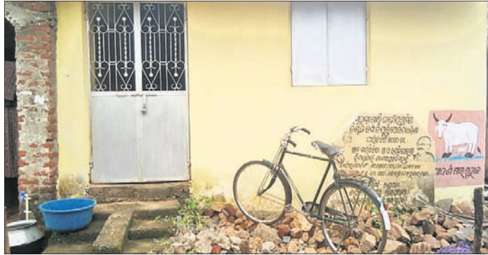
ମାଲ୍‌ଷିବନ୍ଦୀ ଗାଁରେ ମୋ ଗୁହାଳ ଯୋଜନାରେ ନିର୍ମିତ ଘରେ ଲୋକ ରହୁଛନ୍ତି ।

ଯୋଜନାର ସୁଫଳ ପାଉଛନ୍ତି । ନୂଆଗାଁ ବ୍ଲକ କୁଡ଼ିପୁର ଉତ୍ତର ପ୍ରଧାନ କୁହନ୍ତି, ସରକାର ମୋ ଗୁହାଳ ଯୋଜନାରେ କେତେ ଟଙ୍କା ଅନୁଦାନ ଦେଉଛନ୍ତି ଆମେ ଜାଣିନୁ । ହେଲେ ଗୁହାଳ ଯୋଜନା ଅଛି ବୋଲି