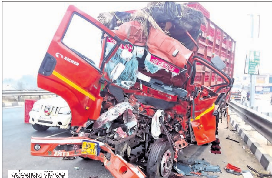
ଦୁର୍ଘଟଣାଗ୍ରସ୍ତ ମିନି ଟ୍ରକ

ଦୁର୍ଘଟଣାଗ୍ରସ୍ତ ଟ୍ରକକୁ ଧକ୍କାଦେଲା ମିନିଟ୍ରକ