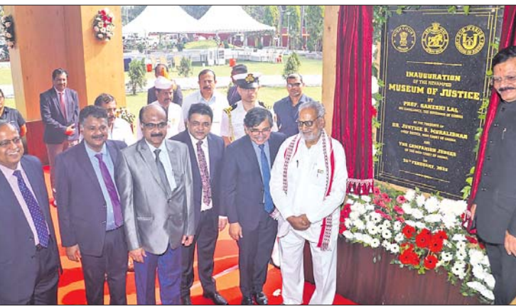
ମୁଖିୟମ ଅଫ୍ ଜଷ୍ଟିସ୍ ଉଦ୍ଘାଟନା ଅବସରରେ ରାଜ୍ୟପାଳ ପ୍ରଫେସର ଗଣେଶ ଲାଲ, ହାଇକୋର୍ଟ ମୁଖ୍ୟ ବିଚାରପତି ଏସ୍. ମୁରଲୀଧର ଓ ଅନ୍ୟମାନେ।

କଟକ ବାରବାଟୀ ଦୁର୍ଗ ପରିସରରେ ମୁଖିୟମ ଅଫ୍ ଜଷ୍ଟିସ୍ ଶନିବାର ଉଦ୍ଘାଟନା ହୋଇଯାଇଛି। ରାଜ୍ୟପାଳ ପ୍ରଫେସର ଗଣେଶ ଲାଲ ଏହାକୁ ଉଦ୍ଘାଟନା କରି କହିଥିଲେ, ମୁଖିୟମ ଅଫ୍ ଜଷ୍ଟିସ୍ ଦେଶର ଗର୍ବ। ଏଥିସହ ସେ ନାଗରିକର ଅଧିକାର ଅନ୍ତର୍ଭୁକ୍ତ ରହିବା ଉପରେ ସଚେତନତା ସୃଷ୍ଟି କରାଯିବା ଉପରେ ଗୁରୁତ୍ୱରୋପ କରିଥିଲେ। ସେହିପରି ହାଇକୋର୍ଟ ମୁଖ୍ୟ ବିଚାରପତି ଏସ୍. ମୁରଲୀଧର କହିଥିଲେ, ମୁଖିୟମ ଅଫ୍ ଜଷ୍ଟିସ୍ ମାଧ୍ୟମରେ ଇତିହାସକୁ କେବଳ ସମ୍ମାନ ଦିଆଯାଇନାହିଁ ବରଂ ଇତିହାସ ସୃଷ୍ଟି କରାଯାଇଛି। ହାଇକୋର୍ଟ ଓ ଜିଲ୍ଲାକୋର୍ଟଗୁଡ଼ିକର ରେକର୍ଡ ରୁମ୍‌ରେ ଥିବା ଉନବିଂଶ ଶତାବ୍ଦୀ ପୂର୍ବର ପୁରୁଣା ରେକର୍ଡଗୁଡ଼ିକୁ ମୁଖିୟମରେ ସ୍ଥାନିତ କରାଯାଇଛି। ଓଡ଼ିଶାର ସାଧାଧାରଣ ସଂଗ୍ରାହଣୀ, ପ୍ରସିଦ୍ଧ ବ୍ୟକ୍ତିତ୍ୱ ଓ ଘଟଣାବଳୀ ସମ୍ପର୍କିତ ବହୁ ଲୁଚାଯିତ ରେକର୍ଡଗୁଡ଼ିକୁ ଏଠାରେ ସ୍ଥାନିତ କରାଯାଇ ଓଡ଼ିଶାର ନ୍ୟାୟିକ ବ୍ୟବସ୍ଥାର ବୈପ୍ଳବିକ ପରିବର୍ତ୍ତନକୁ ଉପସ୍ଥାପନା କରିବାର ପ୍ରୟାସ କରାଯାଇଛି। ଏହି ମୁଖିୟମ କେବଳ ଓଡ଼ିଶାର ନୁହେଁ, ସାରା ଦେଶର ନ୍ୟାୟିକ ବ୍ୟବସ୍ଥାର ପ୍ରତିଫଳନ। କାରଣ ଯେକୌଣସିଠାରେ ସଂଗୃହୀତ ଘଟଣାବଳୀର ବର୍ତ୍ତମାନ ହେଉଛି ଓଡ଼ିଶା। ଏହି ମୁଖିୟମ ଅଧ୍ୟୟନ, ଅଧ୍ୟାପନା