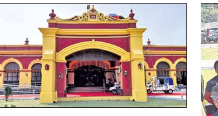
କଟକ ଅଫିସ୍, ୨୫।୨