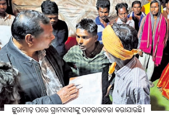
ଛୁରାମାଡ଼ ପରେ ଗ୍ରାମବାସୀଙ୍କୁ ପରାଉତରା କରାଯାଇଛି।