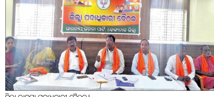
ଜିଲା ଭାଜପା ପଦାଧିକାରୀ ବୈଠକ ।

ଦେମାତୃକ ମନୋଭାବ ଅତ୍ୟନ୍ତ ନିୟମାୟ ଓ ଦୁର୍ଭାଗ୍ୟକରକ ବୋଲି କମିଟି ପକ୍ଷରୁ କୁହାଯାଇଛି । ସେହିପରି ଜିଲାର ସମସ୍ତ ଘରୋଇ ଉପଭୋକ୍ତାଙ୍କୁ ଦେହମୁକ୍ତ ବିଦ୍ୟୁତ୍ ନିମନ୍ତେ ନାଗର ପ୍ରାର୍ଥନା କରାଯାଇଥିଲା । ଏହାପରେ ଶିଳ୍ପ ସମ୍ପୂର୍ଣ୍ଣ ଅନୁଗୋଳ ଜିଲାର ଦୀର୍ଘ ଦିନର ଦାରି ତାଳରେ ମେଡିକାଲ କଲେଜକୁ ଚଳିତବର୍ଷ କାର୍ଯ୍ୟକ୍ଷମ କରିବା ସମସ୍ତ ଉପଖଣ୍ଡ ଡାକ୍ତରଖାନା, ଗୋଷ୍ଠୀ ପାଇଁ ରାଜ୍ୟ ସରକାରଙ୍କ ଯୋଷ୍ଟିଶାଳୁ କମିଟି ପକ୍ଷରୁ ନିର୍ଦ୍ଦେଶ କରାଯାଇଥିଲା । ରାଜ୍ୟ ରାଜକୋଷକୁ ଅନୁଗୋଳ ଜିଲା ସର୍ବାଧିକ ରାଜସ୍ୱ ଦେଉଥିବାବେଳେ ଅନୁଗୋଳ ଜିଲା ପ୍ରତି ସରକାରଙ୍କ