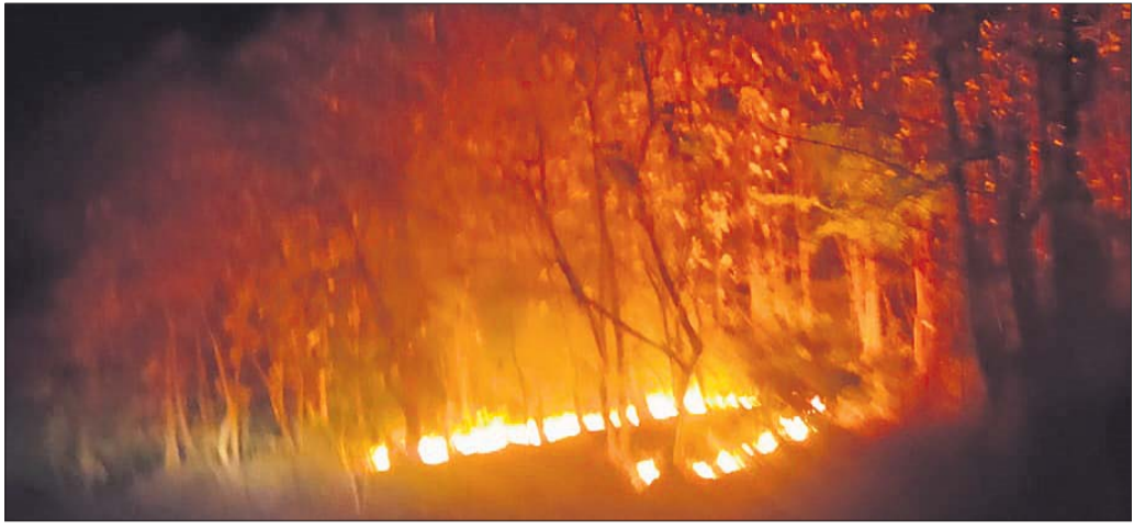
ଜଙ୍ଗଲରେ ଲାଗିଥିବା ନିଆଁ।

ଗଞ୍ଜାମ ଜିଲ୍ଲା ଚିକିତ୍ସ ଅଞ୍ଚଳରେ ଚଳିତବର୍ଷ ଫେବୃଆରୀରୁ ଗ୍ରୀଷ୍ମ ପ୍ରକୋପ ବୃଦ୍ଧି ପାଇବାରେ ଲାଗିଛି। ପ୍ରବଳ ଖରା ଯୋଗୁ ସାଧାରଣ ଜୀବନ ପ୍ରଭାବିତ ହେଉଛି। ଦିନପହଣ୍ଡି ବନାଞ୍ଚଳ ଚିକିତ୍ସା ସେକ୍ଟର ଅଧୀନରେ ଥିବା ଉତ୍ତରଲେଖା ଓ ଧାନ୍ୟରାଣିଆ ଜଙ୍ଗଲରେ ନିଆଁ ଦେଖିବାକୁ ମିଳିଛି। ଏଥିଯୋଗୁ ବହୁ ମୂଲ୍ୟବାନ ବୃକ୍ଷ ନଷ୍ଟ ହେବା ସଙ୍ଗେ ସଙ୍ଗେ ବନ୍ୟ ଜୀବଜନ୍ତୁ ସ୍ତବ୍ଧ ହେଉଛନ୍ତି। ଜଙ୍ଗଲରେ ନିଆଁ ଯେପରି ନ ଲାଗିବ ସେଥିପ୍ରତି ସ୍ଥାନୀୟ ଲୋକଙ୍କ ସଚେତନତା ଜରୁରୀ ହୋଇପାରୁଛି। ଜଙ୍ଗଲ ବିଭାଗ ପକ୍ଷରୁ ଏଥି ନିମନ୍ତେ ପଦକ୍ଷେପ ନେବାର ଆବଶ୍ୟକତା ରହିଛି ବୋଲି ଅଞ୍ଚଳ କେତେକ ବୃକ୍ଷଜୀବୀ ମତବଦ୍ଧ କରିଛନ୍ତି। ଜଙ୍ଗଲ ବିଭାଗ ନିକଟସ୍ଥ ଗ୍ରାମବାସୀଙ୍କୁ ନେଇ ବନବୃକ୍ଷା ସମିତି ଗଠନ କରି ସେମାନଙ୍କ ସହ ଉଦ୍ଧାରଣ କାର୍ଯ୍ୟରେ ସହଯୋଗ ଦାୟିତ୍ୱ ଗ୍ରହଣ କରିବାକୁ ନିଆଁ ଦେଖିବାକୁ ନିଷ୍ପତ୍ତ ହୋଇଛି।