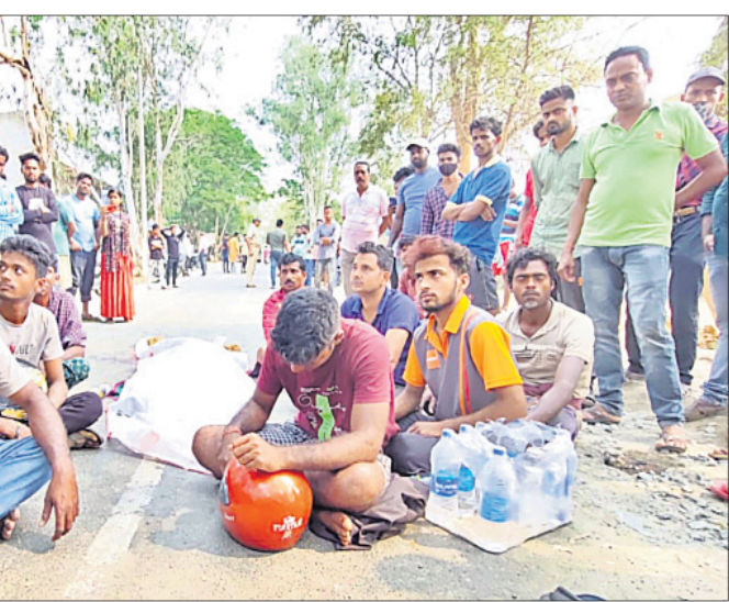
ମୃତଦେହ ରଖି ସ୍ଥାନୀୟ ଲୋକ ରାସ୍ତା ଅବରୋଧ କରିଛନ୍ତି।