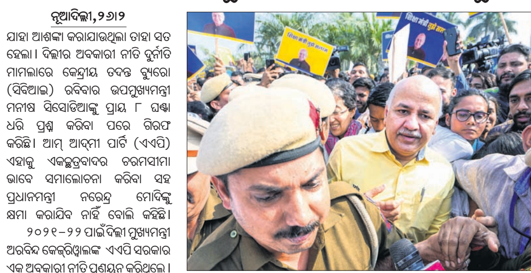
ସିବିଆଇ ନିକଟରେ ହାଜର ହେବାକୁ ଯାଉଛନ୍ତି ଦିଲ୍ଲୀ ଉପଯୁକ୍ତମନ୍ତ୍ରୀ ମନୀଷ ସିସୋଡିଆ।

ଦିଲ୍ଲୀ ଅବକାରୀ ନୀତି ଦୁର୍ନୀତି ମାମଲାରେ କାର୍ଯ୍ୟାନୁଷ୍ଠାନ