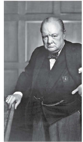
ସାର୍ ଫ୍ରେଡ଼୍ ରିସୋର ଚର୍ଚ୍ଚିତ

ଭୁବନେଶ୍ୱର, ୨୭/୨ ବ୍ରିଟିଶ ବିଶ୍ୱାସୀଙ୍କର ଭୟାନକତାକୁ ଯାଦୁ ବିଶ୍ୱାସୀ ଅତି ନିକଟରୁ ଦେଖିଛନ୍ତି। ଏହା ଯୋଗୁଁ ବିଶ୍ୱାସୀଙ୍କ ମୁଣ୍ଡ ଟେକିଥିଲା। ମୁଖ ପରେ ରାଷ୍ଟ୍ରଗୁଡ଼ିକ ନିଜ ପୂର୍ବ ଭିତରୁ ଫେରିବା ପାଇଁ ବହୁ ସମୟ ମଧ୍ୟ ଲାଗିଥିଲା। ନିକଟରେ ପ୍ରକାଶ ପାଇଥିବା ଏକ ସର୍ବେକ୍ଷଣରୁ ସର୍ବୋଚ୍ଚ ସ୍ତରୀୟ ବିଶ୍ୱାସୀଙ୍କ କେବେ ହୋଇଥିଲା ସେ ସମ୍ପର୍କରେ ବ୍ରିଟିଶ୍ ୩୭% ମୁତପିଡ଼ି ଅବଗତ ହୁଅନ୍ତି। ବେନି କମ୍ପାନୀ ସେବା ମୁରୋପ ଲିମିଟେଡ୍ ପକ୍ଷରୁ ଏହି ସର୍ବେକ୍ଷଣ କରାଯାଇଛି। ସେହିପରି ବ୍ରିଟିଶ ବିଶ୍ୱାସୀଙ୍କ ସମୟରେ ସାର୍ ଫ୍ରେଡ଼୍ ରିସୋର ଚର୍ଚ୍ଚିତ ପ୍ରଧାନମନ୍ତ୍ରୀ ଥିଲେ ବୋଲି ୩୨% ମୁତପିଡ଼ି ଜାଣିନାହାନ୍ତି। ଚର୍ଚ୍ଚିତ ହୁଇଥିବା ବ୍ରିଟିଶ୍ ପ୍ରଧାନମନ୍ତ୍ରୀ ଭାବେ ଦାୟିତ୍ୱ ଗ୍ରହଣ କରିଥିଲେ। ୧୯୪୦ରୁ ୧୯୫୫ ବ୍ରିଟିଶ ବିଶ୍ୱାସୀ ସମୟରେ ସେ ପ୍ରଧାନମନ୍ତ୍ରୀ ଥିଲେ। ପରେ ୧୯୫୧ରୁ ୧୯୫୫ ପର୍ଯ୍ୟନ୍ତ ମଧ୍ୟ ସେ ଏହି ଦାୟିତ୍ୱ ନିର୍ବାହ କରିଥିଲେ। ବ୍ରିଟିଶ ବିଶ୍ୱାସୀଙ୍କର ବ୍ରିଟିଶ୍ ବିକ୍ରୟ ପଛରେ ଚର୍ଚ୍ଚିତଙ୍କ ବଡ଼ ଭୂମିକା ଥିବା କୁହାଯାଏ। ୧୮୭୫ ନଭେମ୍ବର ୩୦ରେ ଲୁନହେମ ରାଜପ୍ରାଧ୍ୟାୟରେ ଚର୍ଚ୍ଚିତଙ୍କ କନ୍ୟା ଜଣେ ସେନା ଅଧିକାରୀ ଓ ସେବାରେ ଖବରଦାତା ହେବା ଯୋଗୁଁ ସେ ବହୁ ଦେଶ ଭ୍ରମଣ କରିଥିଲେ। ୧୯୦୦ ମସିହାରେ ତାଙ୍କ ରାଜନୈତିକ କ୍ୟାରିୟର ଆରମ୍ଭ ହୋଇଥିଲା। ୧୯୩୯ରେ ବ୍ରିଟିଶ ବିଶ୍ୱାସୀ ଆରମ୍ଭ ହୋଇଥିବାବେଳେ ୧୯୫୫ରେ ଶେଷ ହୋଇଥିଲା। ୩୦ ଦେଶର ପାଖାପାଖି ୧୦୦ ନିୟୁତ ଲୋକ ଉଚ୍ଚ ମୁକ୍ତରେ