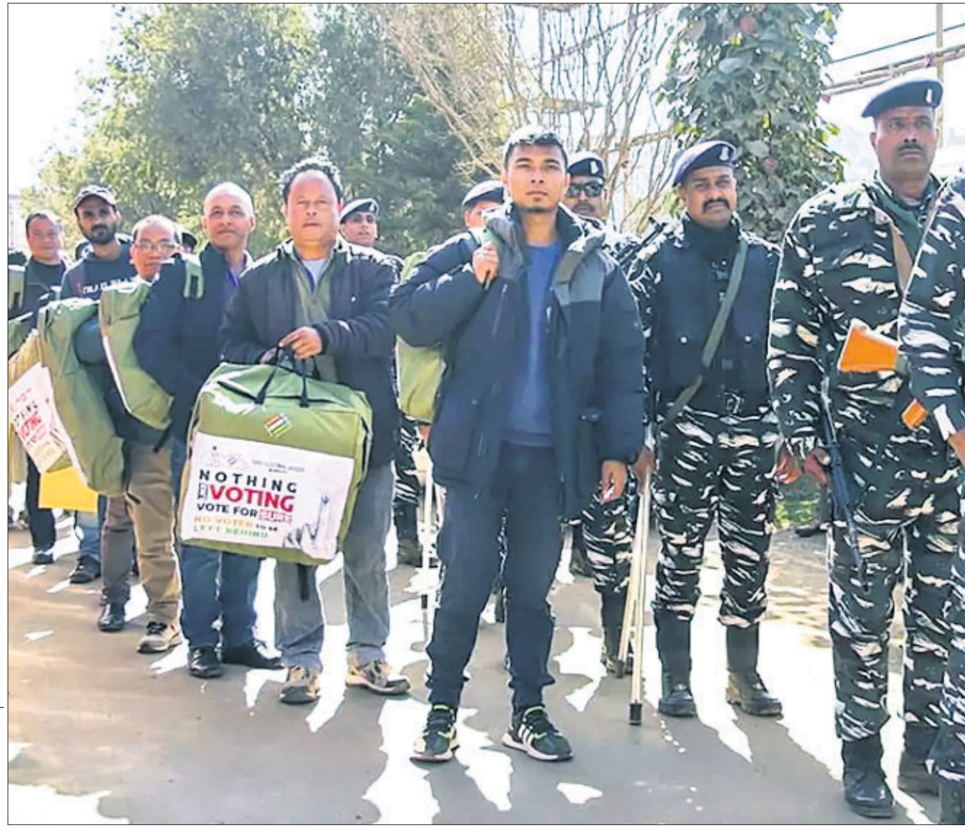
ମେଘଲୟ ବିଧାନସଭା ନିର୍ବାଚନ ପାଇଁ ସୋମବାରଠାରୁ ମତଦାନ ଆରମ୍ଭ ହେବାକୁ ଥିବାବେଳେ ଇଷ୍ଟ ଖାସି ହିଲ୍ ଗୋଟି କେନ୍ଦ୍ର ପାଇଁ ନିୟୁକ୍ତ ସୁରକ୍ଷା କର୍ମୀ ସହ ବାହାରିଥିବା ଯୋଗୁଁ ଅଧିକାଂଶମାନେ ନିର୍ବାଚନ ପାଇଁ ସୋମବାରଠାରୁ ମତଦାନ ଆରମ୍ଭ ହେବାକୁ ଥିବାବେଳେ ଇଷ୍ଟ ଖାସି ହିଲ୍ ଗୋଟି କେନ୍ଦ୍ର ପାଇଁ ନିୟୁକ୍ତ ସୁରକ୍ଷା କର୍ମୀ ସହ ବାହାରିଥିବା ଯୋଗୁଁ ଅଧିକାଂଶମାନେ

ସିସୋଡିଆଙ୍କୁ ଚିରଫ କଲା ସିବିଆଇ ଦିଲ୍ଲୀ ଅବକାରୀ ନୀତି ଦୁର୍ନୀତି ମାମଲାରେ କାର୍ଯ୍ୟାନୁଷ୍ଠାନ ନେବାର ସମ୍ଭାବନା ରହିଛି। ସିସୋଡିଆଙ୍କୁ ଚିରଫ କରିବା ପାଇଁ ସିବିଆଇର ପୁରୀପୁରୀ ଡିଭିଜନ୍ ଅଧିକାରୀଙ୍କୁ ନିର୍ଦ୍ଦେଶ ଦିଆଯାଇଛି।