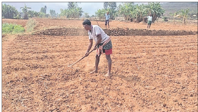
ସୁବେରି ଗାଧ ପାଇଁ ଜମି ସମତୁଳ୍ୟ କରାଯାଉଛି।