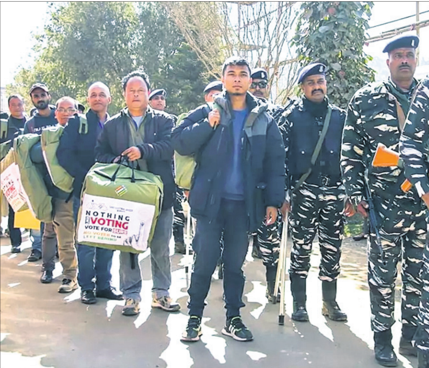
ମେଘାଳୟ ବିଧାନସଭା ନିର୍ବାଚନ ପାଇଁ ସୋମବାରଠାରୁ ମତଦାନ ଆରମ୍ଭ ହେବାକୁ ଥିବାବେଳେ ଉତ୍ତମ ଖାସି ହିଲ୍ ଭୋଟ କେନ୍ଦ୍ର ପାଇଁ ନିଯୁକ୍ତ ପୁରୁଷା କର୍ମୀ ସହ ବାହାରିଥିବା ଯୋଗୁଁ ଅଧିକାରୀମାନେ।