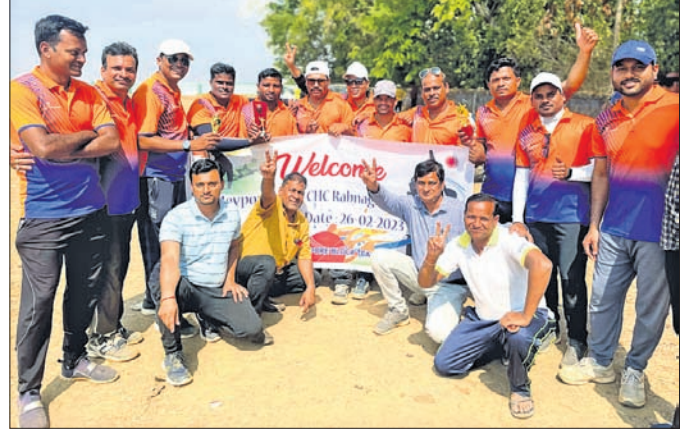
ଅତିଥି ଗଞ୍ଜେଇ ଓ ଗିରଫ ଅଭିଯୁକ୍ତ ।