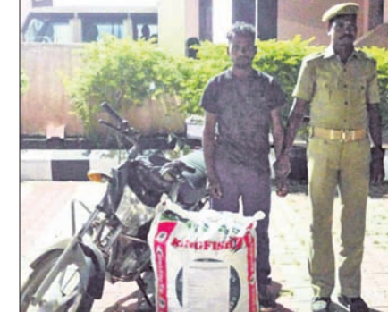
ଜବତ ଗଞ୍ଜେଇ ଓ ଗିରଫ ଅଭିଯୁକ୍ତ ।

ମାଲକାନଗିରି ଜିଲ୍ଲା କାଲିମେଳା ରୁକ୍ ଏମଜି-୭୯ ପୋଲିସ୍ ଏମଜି-୨୭ ଗ୍ରାମରୁ ୩୩ କେଜି ଗଞ୍ଜେଇ ଶନିବାର ରାତିରେ ଜବତ କରିଛି। ଜାକାଲକୁଣ୍ଡ ଗ୍ରାମର ଏମଜି-୨୭ ରାସ୍ତାରେ ଏକ ବାଇକ୍ ରହିଥିଲା। ତେବେ ପୋଲିସ୍