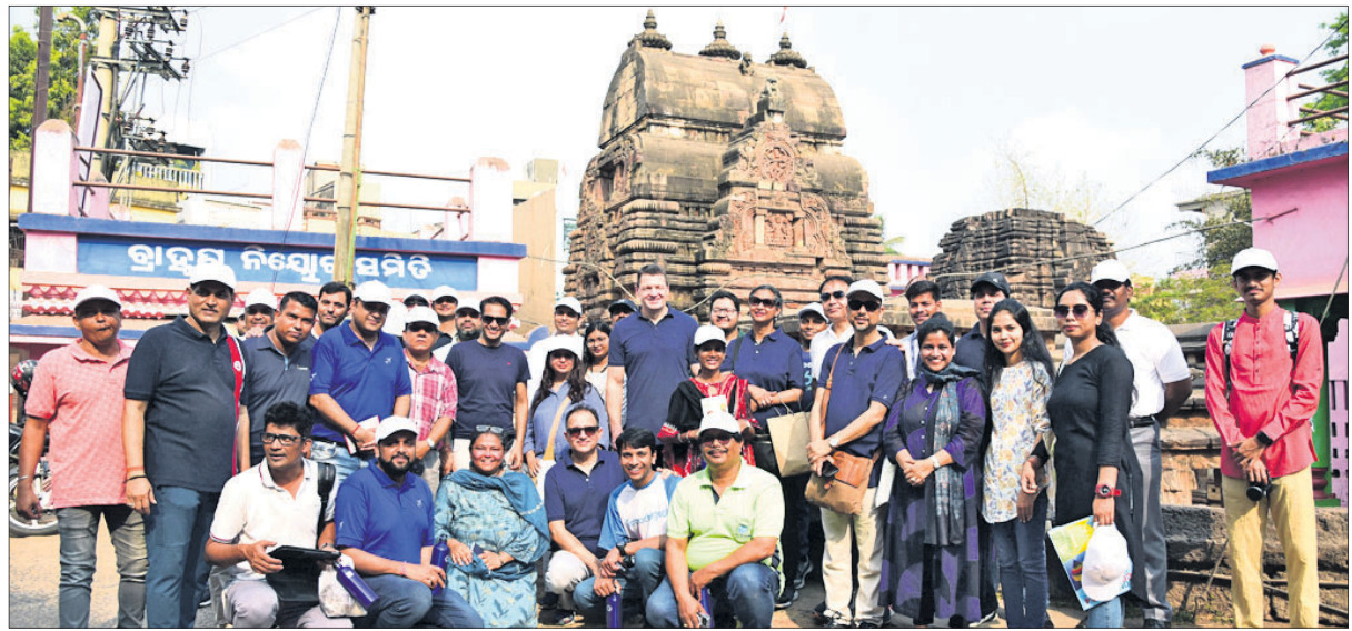
ଇଣ୍ଡୋରା ରିଫ୍ ଓ ଇଣ୍ଡରା ଗ୍ଳୋବାଲ ପାଇଣ୍ଡେଣ୍ଟସ ପକ୍ଷରୁ ରବିବାର 'ମାଲି ସିଟି ମାଲି ହେରିଟେଜ ଅଭିଯାନ'ର ବିତାଣ ସଂକଳନ ପଦକ୍ଷେପରେ ପର୍ଯ୍ୟଟକମାନେ ପୁରୁଣା ଭୁବନେଶ୍ୱରର ବିତାଣ ମନ୍ଦିର ପରିଦର୍ଶନ କରୁଛନ୍ତି।

ସେହିଭଳି ସେମିଲିଗୁଡ଼ା କ୍ଳବର ରାଜପୁଟ ଠାରେ ମିଶନ ଶକ୍ତି ଦ୍ୱାରା ପରିଚାଳିତ ଏକ ମିଳେଟ ପ୍ରୋସେଲିଙ୍ଗ ଯୁକ୍ତିଚରଣ ମଧ୍ୟ ଚାଳି ହୋଇଥିଲା। ସେହିଭଳି ସେମିଲିଗୁଡ଼ା କ୍ଳବର ରାଜପୁଟ ଠାରେ ମିଶନ ଶକ୍ତି ଦ୍ୱାରା ପରିଚାଳିତ ଏକ ମିଳେଟ ପ୍ରୋସେଲିଙ୍ଗ ଯୁକ୍ତିଚରଣ ମଧ୍ୟ ଚାଳି ହୋଇଥିଲା। ସେହିଭଳି ସେମିଲିଗୁଡ଼ା କ୍ଳବର ରାଜପୁଟ ଠାରେ ମିଶନ ଶକ୍ତି ଦ୍ୱାରା ପରିଚାଳିତ ଏକ ମିଳେଟ ପ୍ରୋସେଲିଙ୍ଗ ଯୁକ୍ତିଚରଣ ମଧ୍ୟ ଚାଳି ହୋଇଥିଲା।