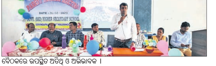
ବୈଠକରେ ଉପସ୍ଥିତ ଅତିଥି ଓ ଅଭିଭାବକ ।