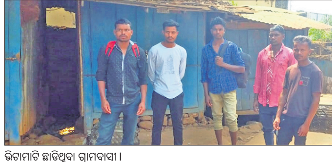
ଭିତାମାଟି ଛାତ୍ରଛତ୍ରି ଗ୍ରାମବାସୀ ।