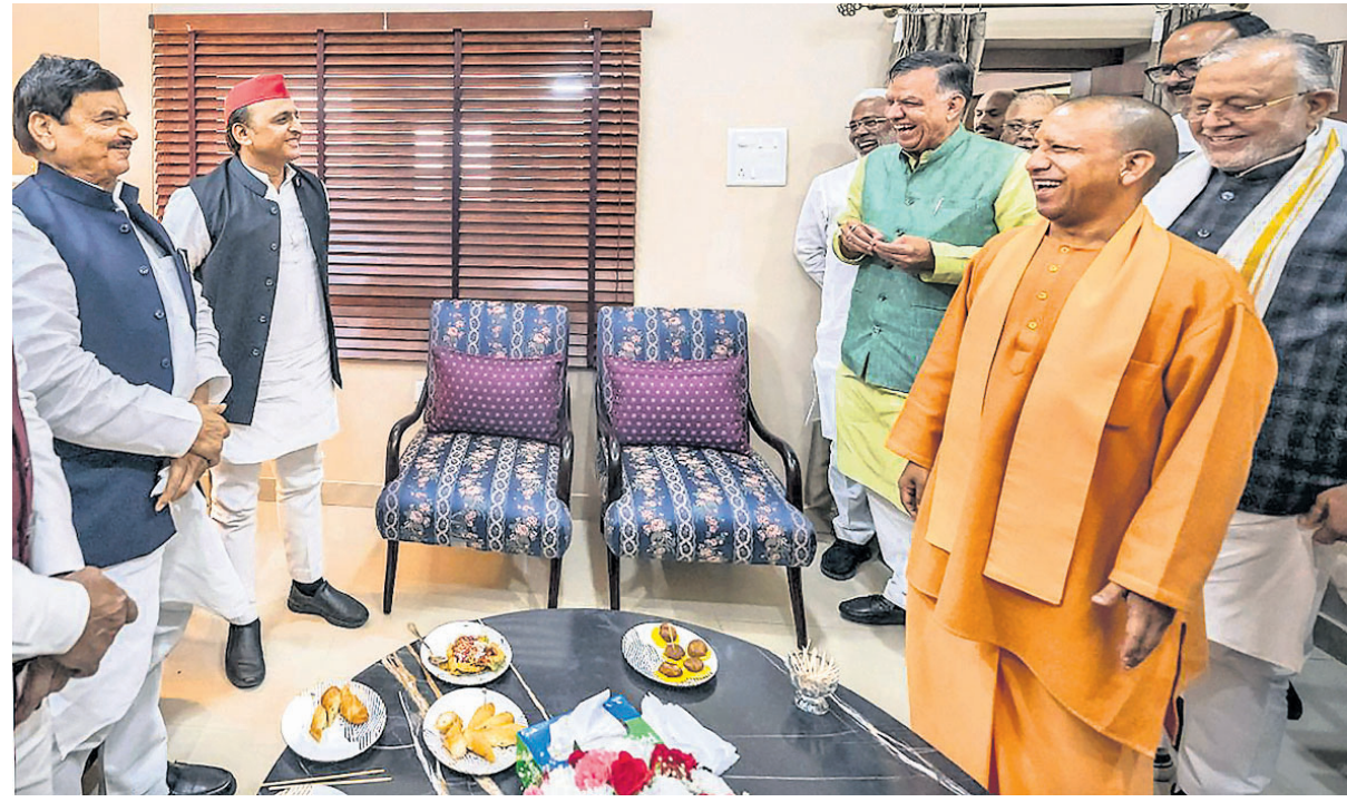
ଉତ୍ତରପ୍ରଦେଶ ବାଚସ୍ପତି ସତୀଶ ମାହାନାଙ୍କ ଦ୍ୱାରା ଲକ୍ଷ୍ମଣାସିତ ତାଙ୍କ ବାସଭବନରେ ରବିବାର ଆୟୋଜିତ ମଧ୍ୟାହ୍ନ ଭୋଜନ କାର୍ଯ୍ୟକ୍ରମରେ ଯୋଗଦେଇଛନ୍ତି ପୁଖ୍ୟମନ୍ତ୍ରୀ ଯୋଗୀ ଆଦିତ୍ୟନାଥ, ସମାଜବାଦୀ ପାର୍ଟି ନେତା ଅଖିଳେଶ ଯାଦବ, ଶିବପାଲ ଯାଦବ ଓ ଅନ୍ୟମାନେ ।