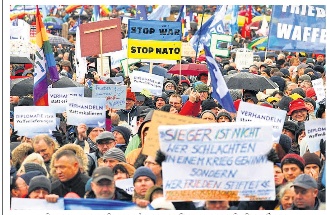
କିଭୁ ମୁହାଁଣି ଯୋଗାଣ ପ୍ରତିବାଦରେ ଜର୍ମାନୀ ସରକାରଙ୍କ ବିରୋଧରେ ବାମପନ୍ଥୀ ଟିପ୍ ଲିଙ୍କେ ପାର୍ଟି ପକ୍ଷରୁ ବର୍ଲିନରେ ଆୟୋଜିତ ବିକ୍ଷୋଭ ଶୋଭାଯାତ୍ରାରେ ୧୦ ହଜାରରୁ ଊର୍ଦ୍ଧ୍ୱ ଲୋକ ସାମିଲ ହୋଇଛନ୍ତି।