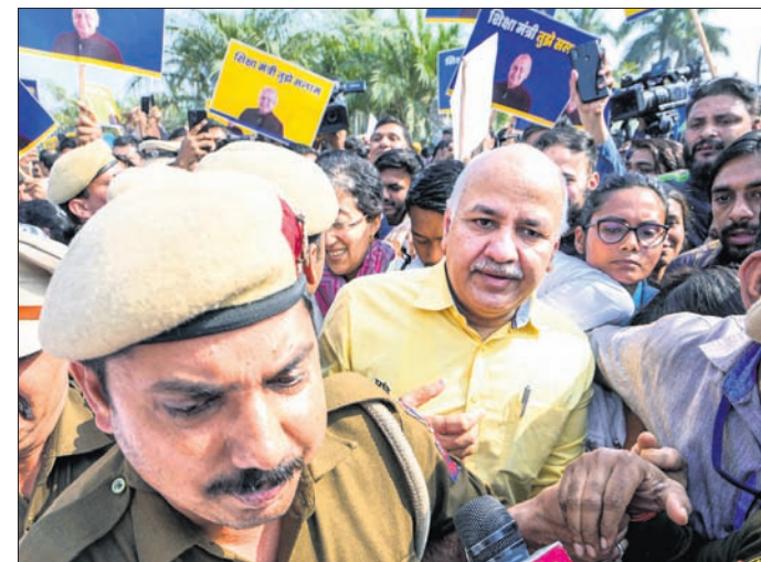
ସିବିଆଇ ନିକଟରେ ହାଜର ହେବାକୁ ଯାଉଛନ୍ତି ଦିଲ୍ଲୀ ଉପମୁଖ୍ୟମନ୍ତ୍ରୀ ମନୀଷ ସିସୋଡିଆ।

ଯାହା ଆଶଙ୍କା କରାଯାଇଥିଲା ତାହା ସତ ହେଲା। ଦିଲ୍ଲୀର ଅବକାରୀ ନୀତି ଦୁର୍ନୀତି ମାମଲାରେ କେନ୍ଦ୍ରୀୟ ତଦନ୍ତ ବ୍ୟୁରୋ (ସିବିଆଇ) ରବିବାର ଉପମୁଖ୍ୟମନ୍ତ୍ରୀ ମନୀଷ ସିସୋଡିଆଙ୍କୁ ପ୍ରାୟ ୮ ଘଣ୍ଟା ଧରି ପ୍ରଶ୍ନ କରିବା ପରେ ଗିରଫ କରିଛି। ଆମ୍ ଆର୍ଦ୍ଦନା ପାର୍ଟି (ଏଏପି) ଏହାକୁ ଏକ ଲୁଚାପତା ଚରମସୀମା ଭାବେ ସମାଲୋଚନା କରିବା ସହ ପ୍ରଧାନମନ୍ତ୍ରୀ ନରେନ୍ଦ୍ର ମୋଦିଙ୍କୁ କ୍ଷମା କରାଯିବ ନାହିଁ ବୋଲି କହିଛି। ୨୦୨୧-୨୨ ପାଇଁ ଦିଲ୍ଲୀ ମୁଖ୍ୟମନ୍ତ୍ରୀ ଅରବିନ୍ଦ କେଜ୍ରିୱାଲଙ୍କ ଏଏପି ସରକାର ଏକ ଅବକାରୀ ନୀତି ପ୍ରଣୟନ କରିଥିଲେ। ଏହାକୁ କାର୍ଯ୍ୟକାରୀ କରାଯିବାବେଳେ ବଡ଼ ଧରଣର ଦୁର୍ନୀତି ହୋଇଥିବା ଦର୍ଶାଇ ଉପରାଜ୍ୟପାଳ ଭି.କେ. ସାହେବ୍‌ନାଥ ଗତବର୍ଷ ସିବିଆଇ ତଦନ୍ତ ନିର୍ଦ୍ଦେଶ ଦେଇଥିଲେ। ପୂର୍ବରୁ ସିବିଆଇ ଏକାଧିକ ଥର ସିସୋଡିଆଙ୍କ ଘରେ ଯାଞ୍ଚ କରିବା ସହ ତାଙ୍କୁ ପଚରାଉଚରା ମଧ୍ୟ କରିଥିଲା। ସପ୍ତାହେ ତଳେ ପୁନର୍ବାର ଜେରା ପାଇଁ ସିବିଆଇ ମୁଖ୍ୟାଳୟରେ ହାଜର ହେବାକୁ ନୋଟିସ୍ କରାଯାଇଥିଲା। ଅର୍ଥ ବିଭାଗ ଦାୟିତ୍ୱରେ ଥିବା ସିସୋଡିଆ