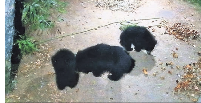
ଗାଁରେ ଜଣକ ବାଡ଼ିକୁ ଭାଲୁ ବେଲ ଖାଇଛନ୍ତି।

କେନ୍ଦ୍ରୀୟ ଜିଲ୍ଲା ଆନନ୍ଦପୁର ଉପଖଣ୍ଡ ଘସିପୁରା ବ୍ଲକ୍ ଅଳତା ଓ ବେଲପୁରୀ ଅଞ୍ଚଳରେ ଭାଲୁ ଆତଙ୍କ ଦେଖାଯାଇଛି। ସଞ୍ଜ ହେଲେ ପଲ ପଲ ହୋଇ ଭାଲୁ ଗାଁକୁ ପଶି ଆସୁଛନ୍ତି। ଫଳରେ ଲୋକେ ଘରୁ ବାହାରି ପାରୁ ନ ଥିବା ବେଳେ ଭୟଭୀତ ଅବସ୍ଥାରେ କାଳିପତା କରୁଛନ୍ତି। ରାତି ୮ ଟା ପରେ ଘରୁ ପଦାକୁ ବାହାରିବା ବିପଦପୂର୍ଣ୍ଣ ପରିସ୍ଥିତି ସୃଷ୍ଟି କରିଛି। ବନ ବିଭାଗ ଏଥିପ୍ରତି ଦୃଷ୍ଟି ଦେଇ ଭାଲୁ ଉତ୍ତୁଳିତାକୁ ଗ୍ରାମବାସୀ ଦାବି କରିଛନ୍ତି। ପୁରୀ ଅନୁଯାୟୀ, ବରାଙ୍ଗ ସଂରକ୍ଷିତ ଜଙ୍ଗଲ ନିକଟରୁ ଅଞ୍ଚଳକୁ ନିର୍ଯ୍ୟତ ଭାବେ ଭାଲୁ ଯିବା ଆସିବା କରୁଛନ୍ତି। ପୂର୍ବୀୟ ହେବା ମାତ୍ରେ ଭାଲୁ ଗାଁ ଭିତରକୁ ପଶିଆସୁଛନ୍ତି। ଖରା ଦିନରେ ଲୋକଙ୍କ ଦାଡ଼ି ବରିଚାରେ ବରକୋଳି, ବେଲ, କାକୁ ଆଦି ଖାଇବା ଲକ୍ଷ୍ୟରେ ଭାଲୁ ପଲ ହୋଇ ପଶିଆସୁଥିବା ସ୍ଥାନୀୟ ଲୋକେ ପ୍ରକାଶ କରିଛନ୍ତି। ଶନିବାର