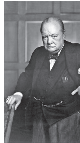
ସାର୍ ଫିଲିପ୍ସ୍ ଚର୍ଚ୍ଚିତ

କରିଥିଲେ। ୧୯୪୦ରୁ ୧୯୪୫ ବ୍ରିଟାନ୍ ବିଶ୍ୱମୁଖ୍ୟ ସମୟରେ ସେ ପ୍ରଧାନମନ୍ତ୍ରୀ ଥିଲେ। ପରେ ୧୯୫୧ରୁ ୧୯୫୫ ପର୍ଯ୍ୟନ୍ତ ମଧ୍ୟ ସେ ଏହି ଦାୟିତ୍ୱ ନିର୍ବାହ କରିଥିଲେ। ବ୍ରିଟାନ୍ ବିଶ୍ୱମୁଖ୍ୟରେ ବ୍ରିଟେନ୍‌ର ବିଜୟ ପଛରେ ଚର୍ଚ୍ଚିତଙ୍କ ବଡ଼ ଭୂମିକା ଥିବା କୁହାଯାଏ। ୧୮୭୪ ନଭେମ୍ବର ୩୦ରେ କ୍ଲେନ୍‌ହେମ ରାଜପ୍ରାସାଦରେ ଚର୍ଚ୍ଚିତଙ୍କ ଜନ୍ମ ଜଣେ ସେନା ଅଧିକାରୀ ଓ ପେସାରେ ଖବରଦାତା ହେବା ଯୋଗୁଁ ସେ ବହୁ ଦେଶ ଭ୍ରମଣ କରିଥିଲେ। ୧୯୦୦ ମସିହାରେ ତାଙ୍କ ରାଜନୈତିକ କ୍ୟାରିୟର ଆରମ୍ଭ ହୋଇଥିଲା। ୧୯୩୯ରେ ବ୍ରିଟାନ୍ ବିଶ୍ୱମୁଖ୍ୟ ଆରମ୍ଭ ହୋଇଥିବାବେଳେ ୧୯୪୫ରେ ଶେଷ ହୋଇଥିଲା। ୩୦ ଦେଶର ପାଖାପାଖି ୧୦୦ ନିଯୁକ୍ତ ଲୋକ ଉକ୍ତ ମୁଖ୍ୟରେ