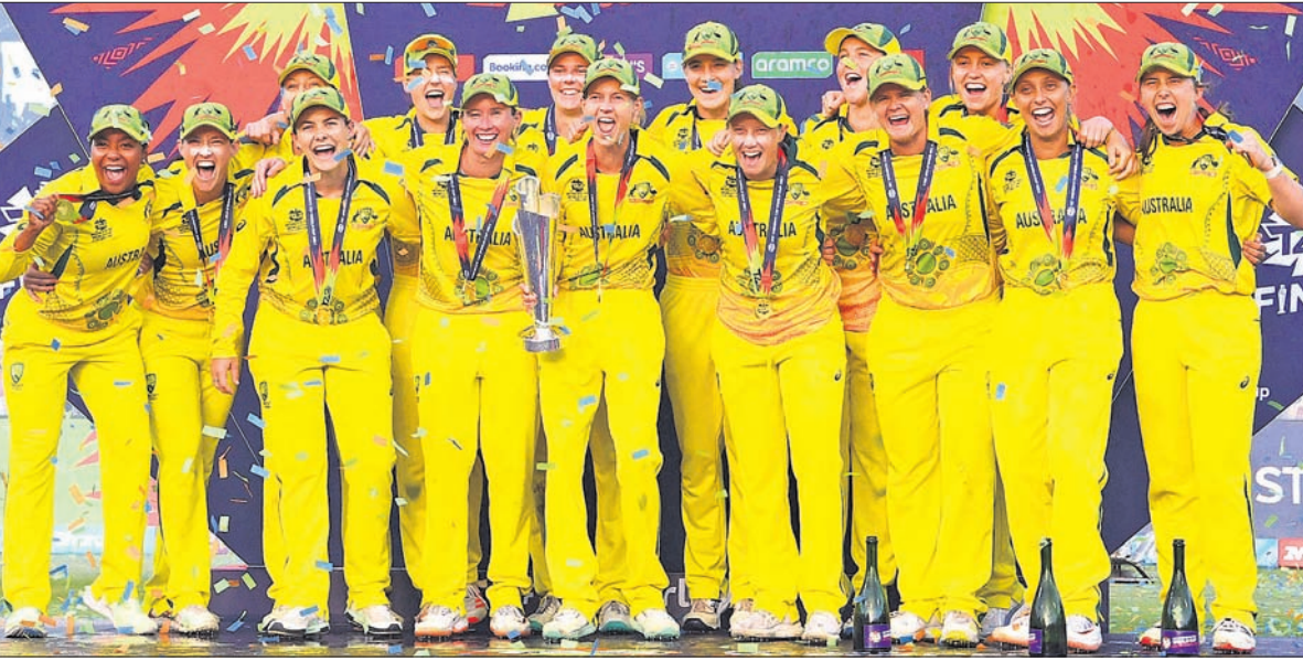
ମହିଳା ଟି୨୦ କ୍ରିକେଟ ବିଶ୍ୱକପ ଚାମ୍ପିୟନ ଅଷ୍ଟ୍ରେଲିଆ ଦଳ।

କେମ୍ବରଜ, ୨୬/୨ ଅଷ୍ଟ୍ରେଲିଆ ଯୁଦ୍ଧ ଅରପାଇଁ ମହିଳା ଟି୨୦ କ୍ରିକେଟ ବିଶ୍ୱକପ ଚାମ୍ପିୟନ ହୋଇଛି। ରବିବାର ଏଠାରେ ଅନୁଷ୍ଠିତ ଫାଇନାଲରେ ଦଳ ୧୯ ରନରେ ଦକ୍ଷିଣ ଆଫ୍ରିକାକୁ ପରାସ୍ତ କରିଛି। ଅନ୍ୟପକ୍ଷରେ ପ୍ରଥମଥରପାଇଁ ଫାଇନାଲ ଖେଳିଥିବା ଦକ୍ଷିଣ ଆଫ୍ରିକା ଚାପ ପରିସ୍ଥିତିର ମୁକାବିଲା କରି ନ ପାରି