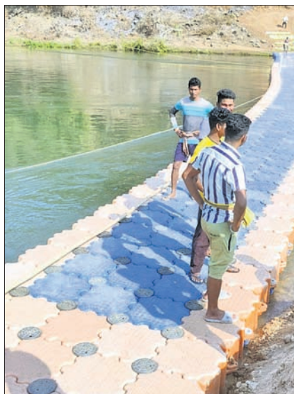
ପୋଲକୁ ନଦୀ ଘାଟରେ ବନ ବିଭାଗ ପକ୍ଷରୁ ନିର୍ମିତ ଭାସମାନ ପୋଲ।