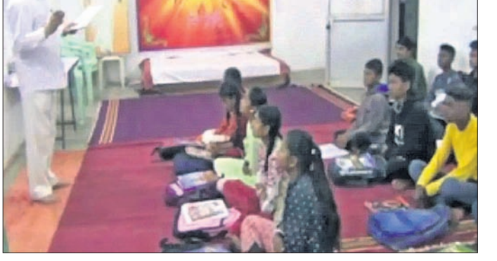
ବେଦାନ୍ତ ସମିତିରେ ପଢ଼ୁଥିବା ଛାତ୍ରାଛାତ୍ରୀମାନେ।