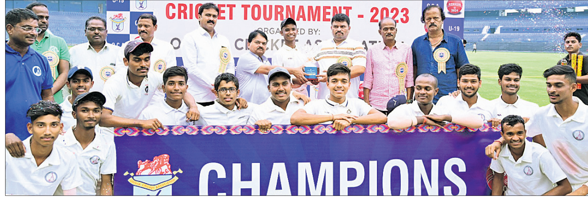
ପୂରସ୍କାର ସହ ଅତିଥିକ ଗହଣରେ ଭୁବନେଶ୍ୱର 'ବି' ଦଳ।