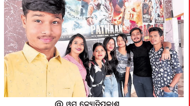
@ ଓମ୍ ଜ୍ୟୋତିପ୍ରକାଶ