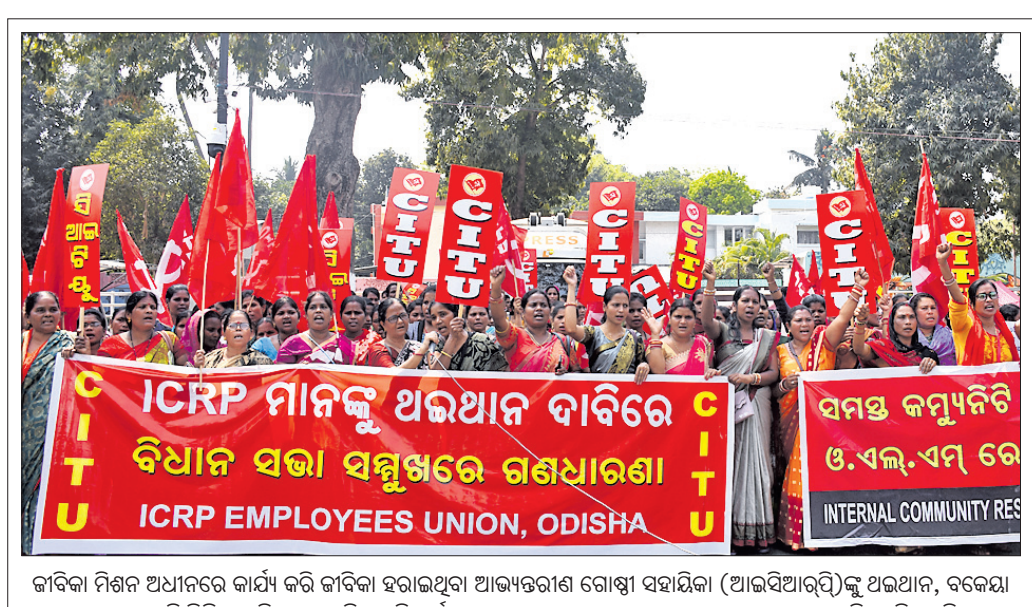
କାବିକା ମିଶ୍ର ଅଧୀନରେ କାର୍ଯ୍ୟ କରି କାବିକା ହରାଇଥିବା ଆଭ୍ୟନ୍ତରୀଣ ଗୋଷ୍ଠୀ ସହାୟିକା (ଆଇସିଆର୍ପି)ଙ୍କୁ ଅଧିକାର, ବକେୟା ପାଉଣା ପ୍ରଦାନ ଆଦି ବିଭିନ୍ନ ଦାବିରେ ଆଇସିଆର୍ପି କର୍ମଚାରୀ ସଂଘ ପକ୍ଷରୁ ଯୋଗାବାର ଭୁବନେଶ୍ୱର ଲୋୟର ପିଏମ୍‌ଜିରେ ବିରୋଧ।