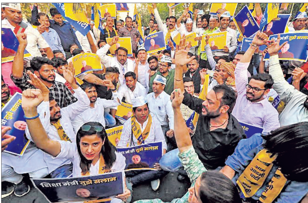
ମନାସ ସିସୋଡିଆଙ୍କୁ ଗିରଫକାରୀ ପ୍ରତିବାଦରେ ଜୟପୁରରେ ଏଏପି କର୍ମୀ ବିକ୍ଷୋଭ ପ୍ରଦର୍ଶନ କରୁଛନ୍ତି।

ଅବକାରୀ ନାଟି ଅନିୟମିତତା ମାମଲାରେ ଦିଲ୍ଲୀ ଉପମୁଖ୍ୟମନ୍ତ୍ରୀ ମନାସ ସିସୋଡିଆ ଗିରଫକାରୀ ଗିରଫ ହୋଇଥିବାବେଳେ ସ୍ଥାନୀୟ ଅବାଲତ ସୋମବାର ତାଙ୍କୁ ୫ ଦିନ ପାଇଁ ସିବିଆଇ ହାଜତକୁ ପଠାଇଦେଇଛନ୍ତି। ଯୋଜନାବଦ୍ଧ ଏବଂ ଗୋପନ ଭଙ୍ଗରେ ଷଡ଼ଯନ୍ତ୍ର ହୋଇଥିବାରୁ ଅଧିକ କେରା ଲାଗି ସିସୋଡିଆଙ୍କୁ ୫ ଦିନ ରିମାଣ୍ଡରେ ନେବା ଲାଗି ସିବିଆଇ ଅବାଲତକୁ ଅନୁରୋଧ କରିଥିଲା। ଅନ୍ୟ ପକ୍ଷରେ ଯଦି ଜଣେ କିଛି କିଛିବାକୁ ନ ଚାହୁଁଛି, ଏହି କାରଣ ପାଇଁ ତାଙ୍କୁ ଗିରଫ କରାଯାଇପାରିବ ନାହିଁ କହି ସିସୋଡିଆଙ୍କ ଓକିଲ ରିମାଣ୍ଡ ଆବେଦନକୁ ବିରୋଧ କରିଥିଲେ। ଓକିଲ କହିଥିଲେ, ମନ୍ତ୍ରୀ ପୁରୁଣା ଫୋନ୍ ବଦଳାଇ କଣ କରିବେ। ସେ ଏହାକୁ ସେକ୍ସଟ୍ ହାଣ୍ଡ ଦୋକାନକୁ ପଠାଇପାରିବେ ନାହିଁ। ଏଥିରେ ଗୁରୁତ୍ୱପୂର୍ଣ୍ଣ ତଥ୍ୟ ଥିଲା। ଏହାକୁ ନେଇ ସିସୋଡିଆ ପ୍ରଶ୍ନ କରିଥିଲେ ମଧ୍ୟ ସିସୋଡିଆ ସ୍ୱୀକାର କରି ନ ଥିଲେ ବୋଲି ତାଙ୍କ ଓକିଲ କହିଛନ୍ତି। ୨୦୨୧-