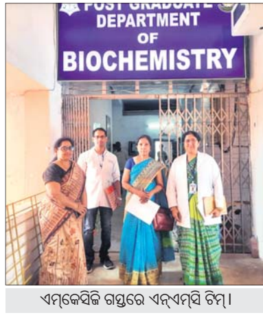
ଏମ୍ବିବିଏସ୍ ଟିମ୍ରେ ଏମ୍ବିବିଏସ୍ ଟିମ୍।