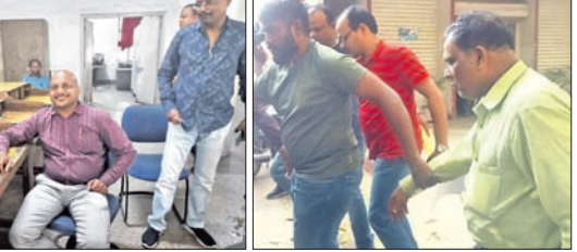
ସିବିଆଇ ଅଧିକାରୀ ଅଭିଯୁକ୍ତଙ୍କୁ ଗିରଫ କରିଛନ୍ତି।

ସିବିଆଇ ଅଧିକାରୀ ଅଭିଯୁକ୍ତଙ୍କୁ ଗିରଫ କରିଛନ୍ତି। ରାଉରକେଲା ଅଞ୍ଚଳ, ୨୭/୨