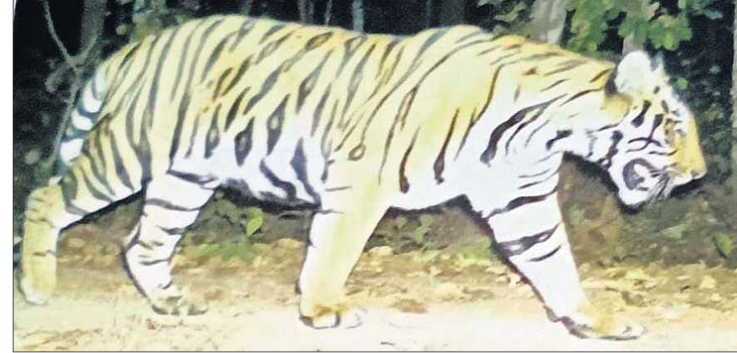
ହୋଇପାରିବ। ଇତିମଧ୍ୟରେ ଦେବ୍ରୀଗଡ଼କୁ ବ୍ୟାଘ୍ର ଅଭୟାରଣ୍ୟ ଘୋଷଣା ପାଇଁ ପ୍ରସ୍ତୁତ ଆରମ୍ଭ କରିବେକି ବନ ବିଭାଗ। ଦେବ୍ରୀଗଡ଼ରେ ଅଭୟାରଣ୍ୟ ଘୋଷଣା ପାଇଁ ପ୍ରସ୍ତୁତ ଆରମ୍ଭ କରାଯାଇଛି ବନ ବିଭାଗ। ଦେବ୍ରୀଗଡ଼ରେ କ୍ୟାମେରା ଗ୍ରୁପ୍ ସଂଖ୍ୟା ବଢ଼ାଯାଇଛି। ବାଘ

ପରିଚାଳନା ଲାଗି ଏକ ଅତିରିକ୍ତ ଷ୍ଟାଫ୍ ମଧ୍ୟ ମଞ୍ଜୁର କରାଯାଇଛି। ଏପରିକି ସେଠାରେ ବାଘର ପାଚିତ୍ୱ ତାଗ ଆନାଲିସିସ୍ ସହାୟତା କରିବାକୁ ଜଣେ ବାୟୋଲଜିଷ୍ଟଙ୍କୁ ପ୍ରତି ମାସରେ ୧୦ ଦିନ ଲାଗି ସେଠାକୁ ପଠାଯାଇଛି। ସେପରେ କେନ୍ଦୁଝର ଘଟଗାଁରେ ମଧ୍ୟ ଏକ ମହାବଳ ବାଘ ବୁଲୁଛି କରୁଥିବା ସୂଚନା ମିଳିଛି। ଏହାର ବୟସ ୩ରୁ ୪ବର୍ଷ ବୋଲି ଅନୁମାନ କରାଯାଇଛି। ତେଣୁ ସେହି ବାଘର ଗତିବିଧି ଉପରେ ନଜର ରଖିବା ପାଇଁ ପିସିସିଏଫ୍ ସେଠାରେ ଅଧିକ ସିସିକ୍ୟାମେରା ଲଗାଇବା ପାଇଁ ନିର୍ଦ୍ଦେଶ ଦେଇଛନ୍ତି। ଘଟଗାଁବାସୀ ଭୟଭୀତ ନ ହେବାକୁ ପିସିସିଏଫ୍ କହିଛନ୍ତି।