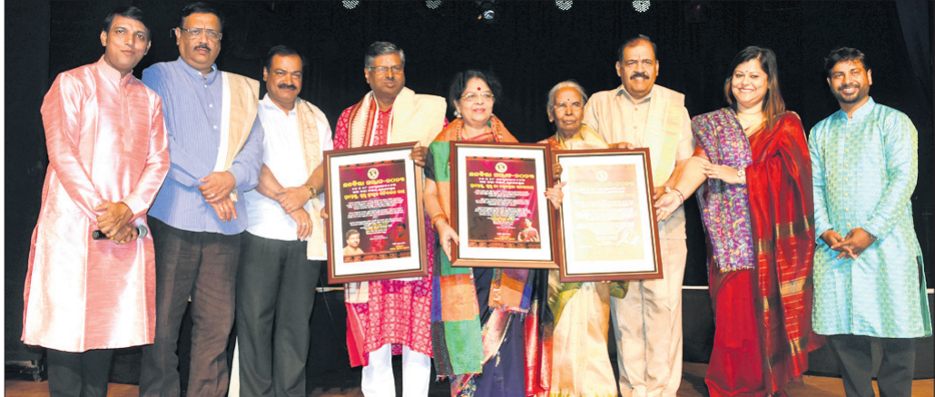
ଓଡ଼ିଶା ତ୍ୟାଗୁ କ୍ରୀଷଣ ପକ୍ଷରୁ ଉତ୍କଳକଳା ମଞ୍ଚପରେ ଆୟୋଜିତ ‘ଛନ୍ଦବିତା’ କାର୍ଯ୍ୟକ୍ରମରେ ଅତିଥିକ ଗହଣରେ ସମ୍ମାନିତ ପ୍ରତିଭାଧାରୀ।