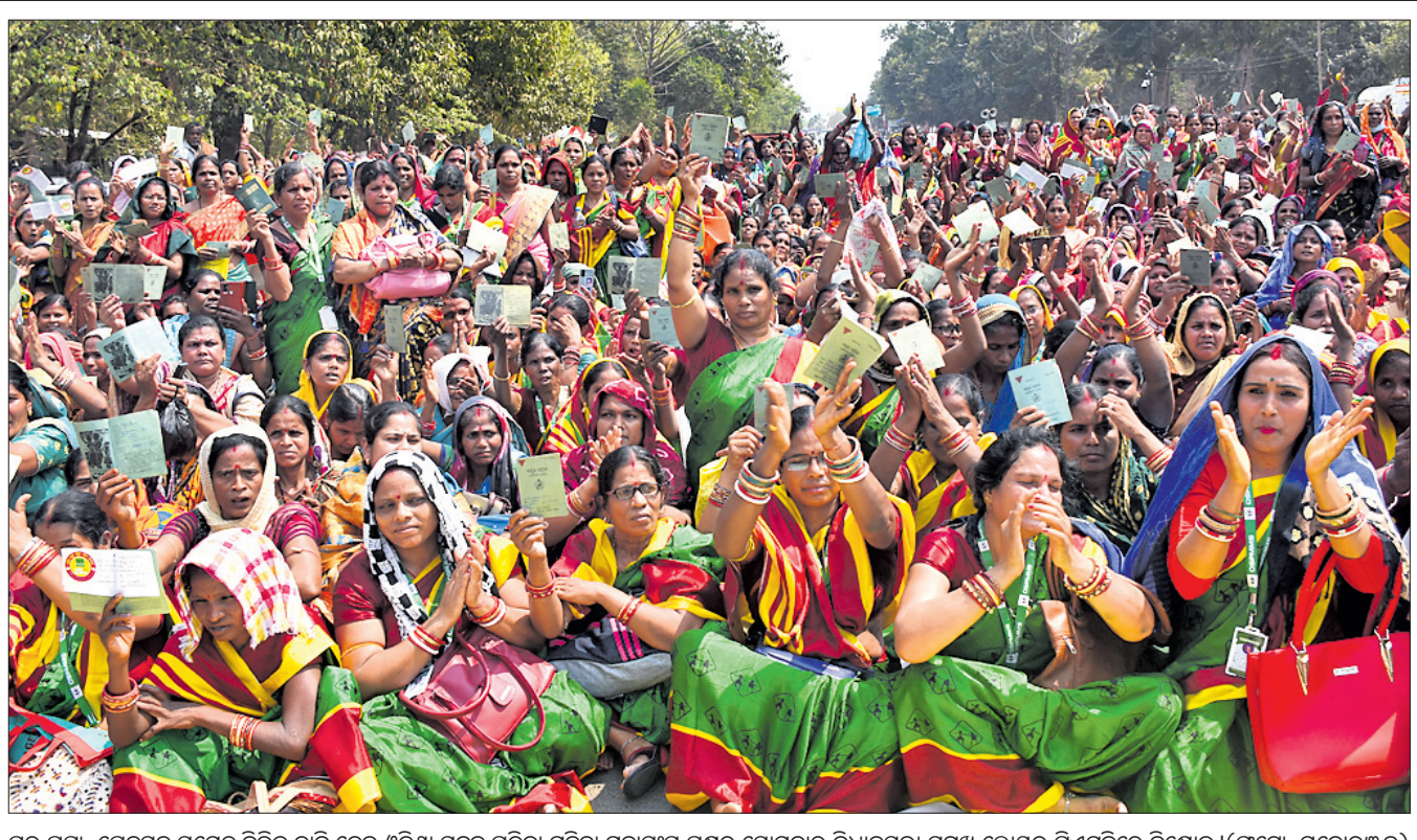
ଘର ପକା, ଚେନ୍ଦନ ସମେତ ବିଭିନ୍ନ ଦାବି ନେଇ ଓଡ଼ିଶା ସରକାର ପ୍ରତିକା ମହିଳା ମହାସଂଘ ପକ୍ଷରୁ ଯୋଗାବାର ବିଧାନସଭା ସମ୍ମୁଖେ ଲୋୟର ପିଏମ୍‌ଜିରେ ବିରୋଧ