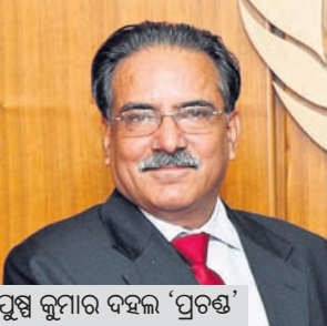
ପୁଷ୍ପ କୁମାର ଦହଲ 'ପ୍ରଚଣ୍ଡ'

ନେପାଳର ବିପ୍ଳବୀ ଦହଲ ରାଜନୈତିକ ଦଳ ପୂର୍ବତନ ପ୍ରଧାନମନ୍ତ୍ରୀ କେ.ପି. ଶର୍ମା ଓଲିଙ୍ଗ ସିପିଏନ୍-ୟୁଏମ୍‌ଏଲ୍ ପୁଷ୍ପ କୁମାର ଦହଲ 'ପ୍ରଚଣ୍ଡ'ଙ୍କ ନେତୃତ୍ୱାଧୀନ ସରକାରରୁ ସମର୍ଥନ ପ୍ରତ୍ୟାହାର କରିନେଇଛି। ଫଳରେ ମୋକ୍ଷ ସରକାର ସଙ୍କଟରେ ପଡ଼ିଯାଇଛି। ରାଷ୍ଟ୍ରପତି ନିର୍ବାଚନ ବେଳେ ରାଜନୈତିକ ସମାଜର ଉପରେ ପରିବର୍ତ୍ତନକୁ ନେଇ ଅଧିକାରୀ ସିପିଏନ୍-ୟୁଏମ୍‌ଏଲ୍ ଉପସ୍ଥାପନା ଦେଇ ବସି ସରକାରରୁ ଉତ୍ତରାଧିକାରୀ ସହ ସମର୍ଥନ ପ୍ରତ୍ୟାହାର