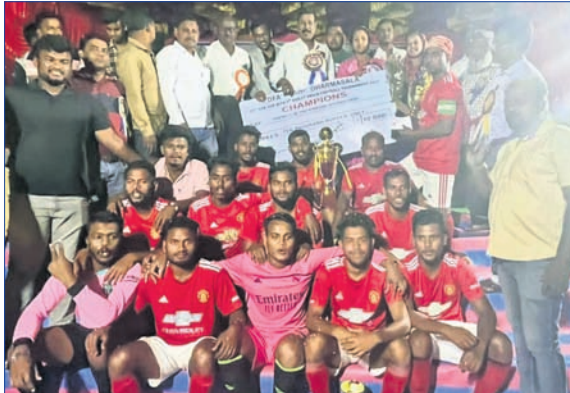
ଚାମ୍ପିୟନ ଭୁବନେଶ୍ୱର ପ୍ରତାପ କୁମ୍ଭ ଦଳ ଅତିଥିକ ସହ ।

ଯାକପୁର ଜିଲ୍ଲା ଧର୍ମଶାଳା ଯୁଗବାଳ ଆସୋସିଏଟସ୍ (ଡି.ପି.) ଅନୁକୂଳରେ ଚାମ୍ପିୟନ ଖେଳ ପଡ଼ିଆରେ ୨୫ତମ ଡି.ପି. କପ୍ ଓ ୫ମ ରଞ୍ଜିଟ୍ ସ୍କାଫ୍ଟ ଯୁଗବାଳ ଚୁନାମେଣ୍ଟ ସୋମବାର ରଦ୍ଦଯାପିତ ହୋଇଯାଇଛି । ଫାଇନାଲ ମ୍ୟାଚ୍ରେ ପ୍ରତାପ କୁମ୍ଭ ଭୁବନେଶ୍ୱର