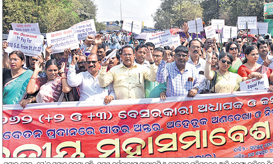
ସମାନ ଶ୍ରେଣୀର ଅଧ୍ୟାପକଙ୍କୁ ସମାନ ମାତ୍ରାରେ ପ୍ରଦାନ କରିବାକୁ ଚାହୁଁଥିବା ଅଧ୍ୟାପକମାନଙ୍କ ଦ୍ୱାରା ଆୟୋଜିତ ହୋଇଥିବା ଏକ ସମାବେଶର ସମୟରେ ଉପସ୍ଥିତ ଅଧ୍ୟାପକମାନଙ୍କ ଦ୍ୱାରା ଆଲୋଚନା କରାଯାଇଛି।

ସହଯୋଗ କରିବାକୁ ସଂଗୃହ୍ୟ ନିବେଦନ କରିଛନ୍ତି ଶିକ୍ଷକମାନେ। ସେ କହିଛନ୍ତି, ଦାବି ହାସଲ ପାଇଁ ଆଲୋଚନା କରିବା ଚିହ୍ନିତ।