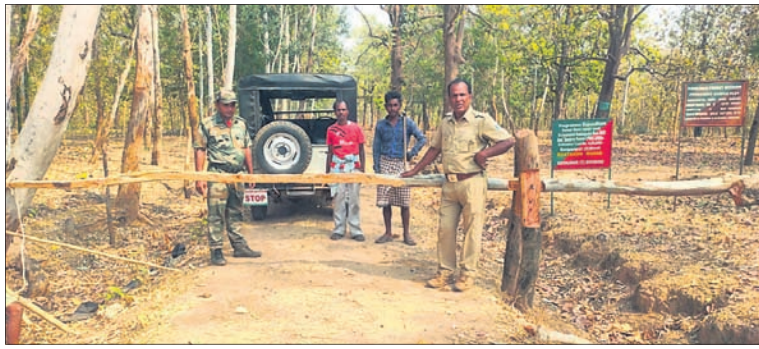
ଘଟଣା ରେଖା ବାଜଗାଣପାଳ ବିଦୁ ଯୁଗାହାଡ଼ି ଗ୍ରାମ ରାସ୍ତାରେ ହୋଇଥିବା ବ୍ୟାରିକେଡ୍।

କେନ୍ଦୁଝର,୨୮୧୨(ସ.ପ୍ର.) କେନ୍ଦୁଝର ଜିଲ୍ଲା ଘଟଣା ରେଖା ଅଞ୍ଚଳେ ସଂରକ୍ଷିତ ଜଙ୍ଗଲରେ ବାଘ ବୁଲୁଛି। ୩/୪ ବର୍ଷ ବୟସର ଏହା ଏକ ଅଜ୍ଞାନ ମହାବଳ ବୋଲି ବନ ବିଭାଗ ସୂଚନା ଦେଇଛି।