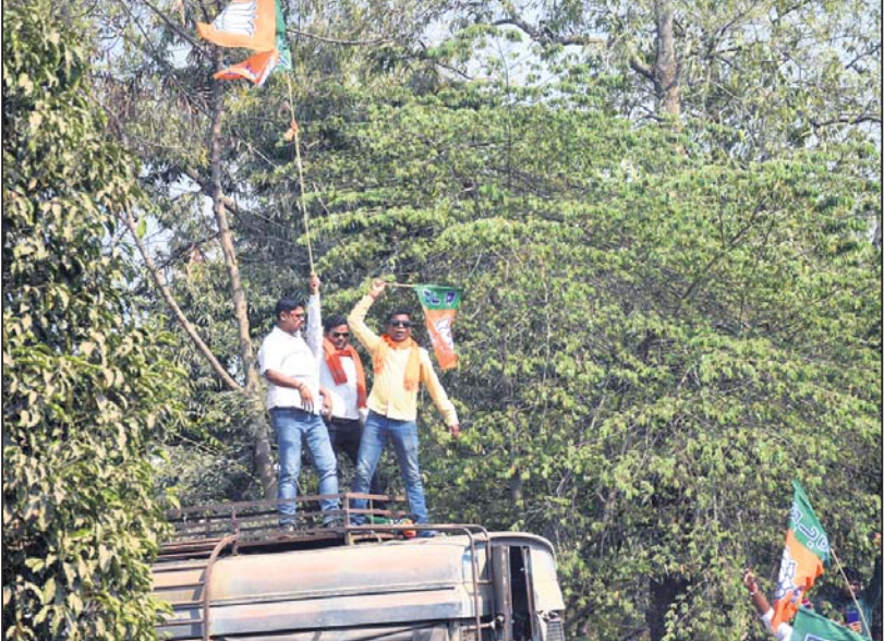
ଭାଜପା କର୍ମୀମାନେ ପୋଲିସ୍ ଭ୍ୟାନ୍ ଉପରେ ଚଢ଼ି ଦକାୟ ପତାକା ଉଡ଼ାଉଛନ୍ତି।