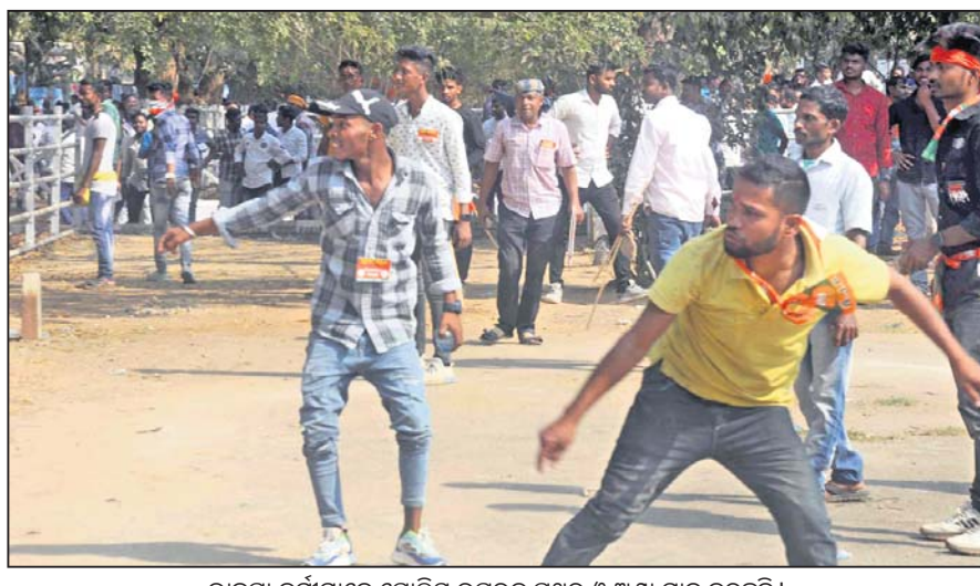
ଭାଜପା କର୍ମୀମାନେ ପୋଲିସ୍ ଉପରକୁ ପଥର ଓ ଅଣ୍ଡା ମାଡ଼ କରୁଛନ୍ତି।