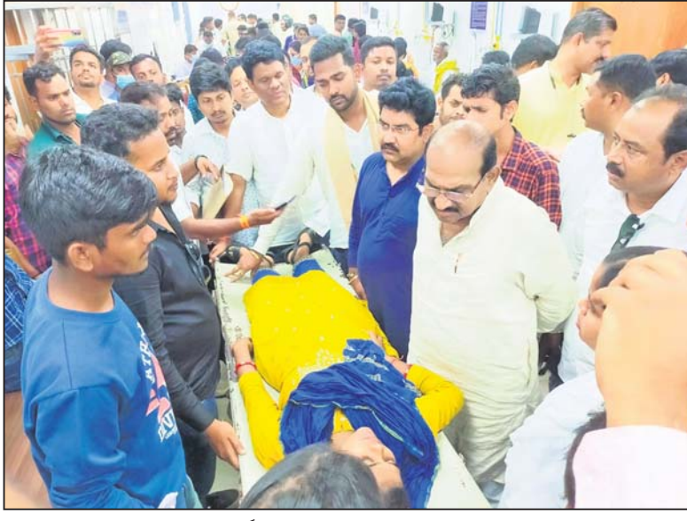
ଲାଠିମାଡ଼ରେ ଆହତ ଜଣେ ମହିଳା କର୍ମୀଙ୍କୁ ବିରୋଧୀ ଦଳ ନେତା ଜୟନାରାୟଣ ମିଶ୍ର ହସ୍ତାନ୍ତରଣ କରୁଛନ୍ତି।