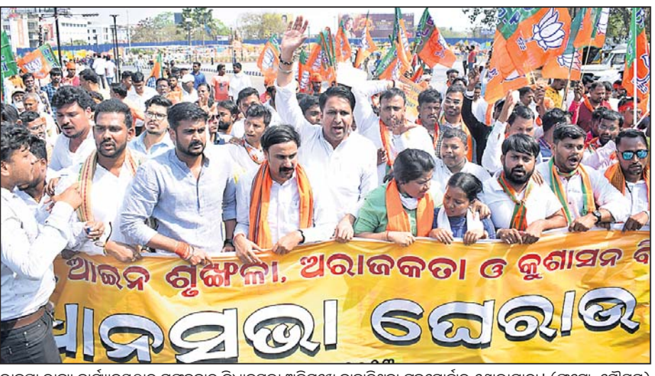
ଭାଜପା ରାଜ୍ୟ କାର୍ଯ୍ୟାଳୟରୁ ମଙ୍ଗଳବାର ବିଧାନସଭା ଅଭିଯୁକ୍ତ ବାହାରିଥିବା ଯୁବମୋର୍ଚ୍ଚାର ଶୋଭାଯାତ୍ରା।