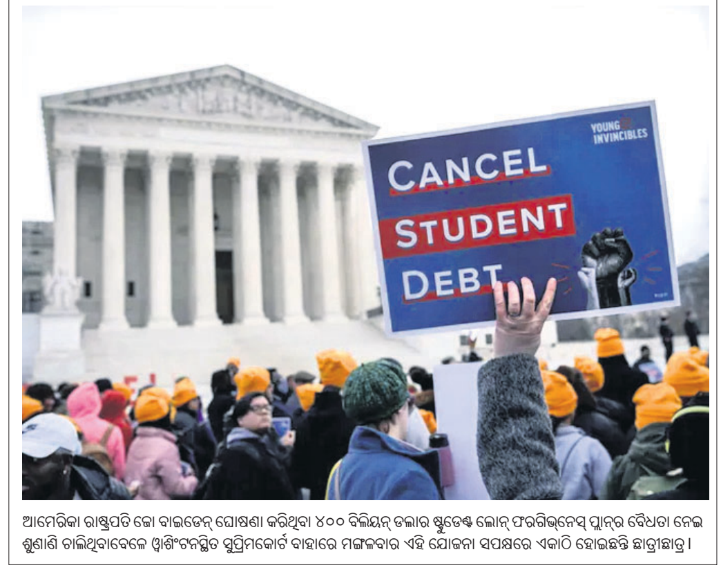
ଆମେରିକା ରାଷ୍ଟ୍ରପତି ଜୋ ବାଇଡେନ୍ ଦୋଷଣା କରିଥିବା ୪୦୦ ବିଲିୟନ୍ ଟଙ୍କାର ସ୍ତୁତ୍ୟ ଲୋଡ଼ ଫରଗିଭିନେସ୍ ପ୍ଲାନର ବିଧେୟ ନେଇ ଶୁଣାଣି ଚାଲିଥିବାବେଳେ ଖ୍ରୀଷ୍ଟିତନ୍ତ୍ରୀ ସ୍ତୁତିପକ୍ଷରେ ବାହାରେ ମଞ୍ଚଳଦାରି ଏହି ଯୋଜନା ସପକ୍ଷରେ ଏକାଠି ହୋଇଛନ୍ତି ଛାତ୍ରଛାତ୍ରୀ।