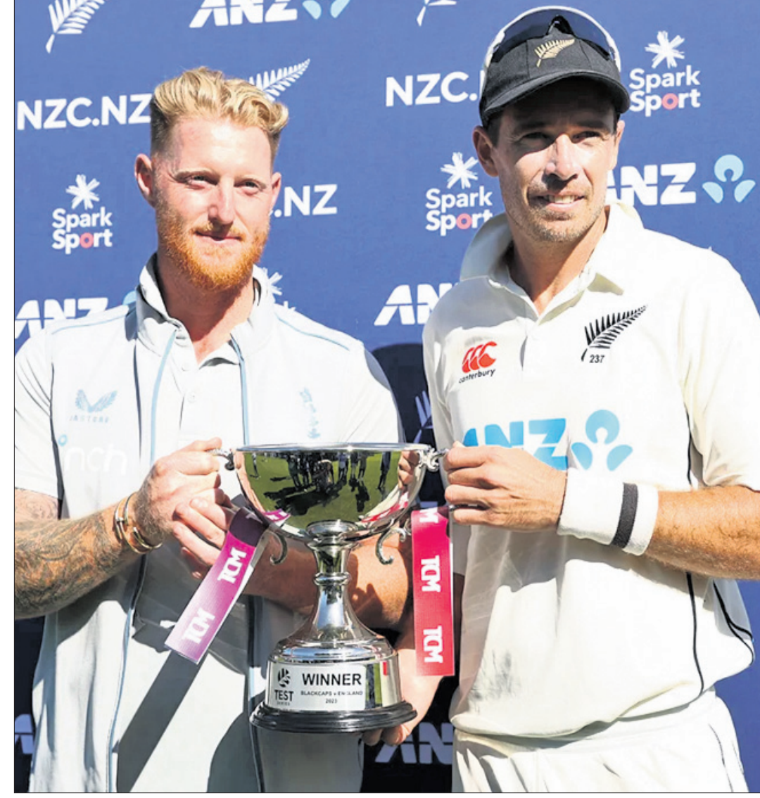
ଇଂଲଣ୍ଡ-ନ୍ୟୁଜିଲାଣ୍ଡ ଟେଷ୍ଟ ସିରିଜ ଡ୍ର ହେବାପରେ ଚିନ୍ତାଧାରା ସହ ବେନ୍ ଷ୍ଟୋକ୍ସ ଓ ଚିନ୍ତାଧାରା।

ରନର ଇନିଂସ ଖେଳିଥିବା ବୁକ୍ ଖାତା ଖୋଲିବା ଆଗରୁ ରନ ଆଉଟ ହୋଇଥିଲେ। କୋ ରୁଟ୍ (୯୫) ଓ ଅଧିନାୟକ ବେନ୍ ଷ୍ଟୋକ୍ସ (୩୩) ସମ୍ପୃକ୍ତ ଉଇକେଟରେ ୧୨୧ରନ୍ ଯୋଡ଼ିଥିଲେ। ରୁଟ୍ ୧୧୩ ବଲ୍ ଖେଳି ୮ ଚୋକା ଓ ୩ ଛକା ମାରିଥିଲେ। ବେନ୍ ଷ୍ଟୋକ୍ସ ୧୧୬ ବଲ୍ ଖେଳି ୬ ଚୋକା ମାରିଥିଲେ। ତେବେ ଉଭୟ ଖେଳାଳିଙ୍କୁ ମାତ୍ର ଦୁଇ ଓଭର ଓ ୧ ରନ ବ୍ୟବଧାନରେ ଆଉଟ କରିଥିଲେ ଡ୍ରାଗନର। ଉଭୟ ଆଉଟ ହେବା ସହିତ ନ୍ୟୁଜିଲାଣ୍ଡର ବିଜୟ ସମ୍ଭାବନା ବୃଦ୍ଧି ପାଇଥିଲା। ତେବେ ଉଇକେଟ କିପର ବେନ୍ ଫୋକ୍ସ ୩୫ ରନ କରି ଦଳକୁ ବିଜୟର ନିକଟବର୍ତ୍ତୀ କରିଥିଲେ। ବିଜୟ ପାଇଁ ୬ ରନ ଆବଶ୍ୟକ ଥିବା ବେଳେ ବେନ୍ ଫୋକ୍ସକୁ ଆଉଟ କରିଥିଲେ ଚିନ୍ତାଧାରା। ଡ୍ରାଗନର ବୋଲି କରିଥିବା ପରବର୍ତ୍ତୀ ଓଭରରେ କେପ୍ ଆଣ୍ଡରସନ୍ ଏକ ଚୋକା ମାରିବା ପରେ ଆଉଟ ହେବା ସହ ନ୍ୟୁଜିଲାଣ୍ଡ ହାତକୁ ମ୍ୟାଚ ଟେକି ଦେଇଥିଲେ। ନିଲ୍ ଡ୍ରାଗନର ୪ ଉଇକେଟ ନେଇଥିବା ବେଳେ ସାଉଥ୍ ୩ ଓ ମ୍ୟାଚ ହେନରୀ ବୁକ୍ ଉଇକେଟ ନେଇଥିଲେ। କେନ୍ ଡ୍ରାଗନର ୪ ଉଇକେଟ ନେଇଥିଲେ ଅର୍ପ୍ ଦ ମ୍ୟାଚ୍ ଓ ହ୍ୟାରୀ ବୁକ୍ସକୁ ଦ୍ୱେଷର ଅର୍ପ୍ ଦ ସିରିଜ ଘୋଷଣା କରାଯାଇଥିଲା।