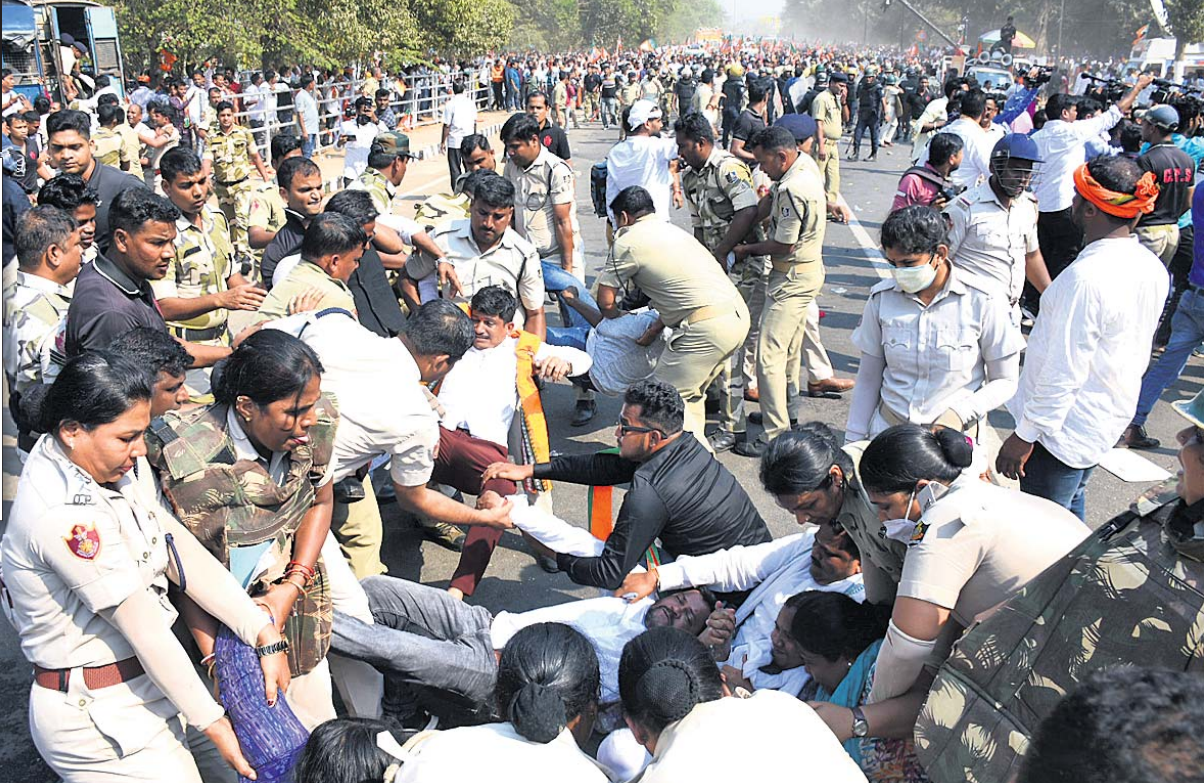
ଭୁବନେଶ୍ୱର ଲୋକସଭା ପିଏମ୍‌ଜିରେ ମଙ୍ଗଳବାର ଭାଜପା କର୍ମୀ ଓ ପୋଲିସ ମଧ୍ୟରେ ଧସାଧସି ସମୟର ଦୃଶ୍ୟ।