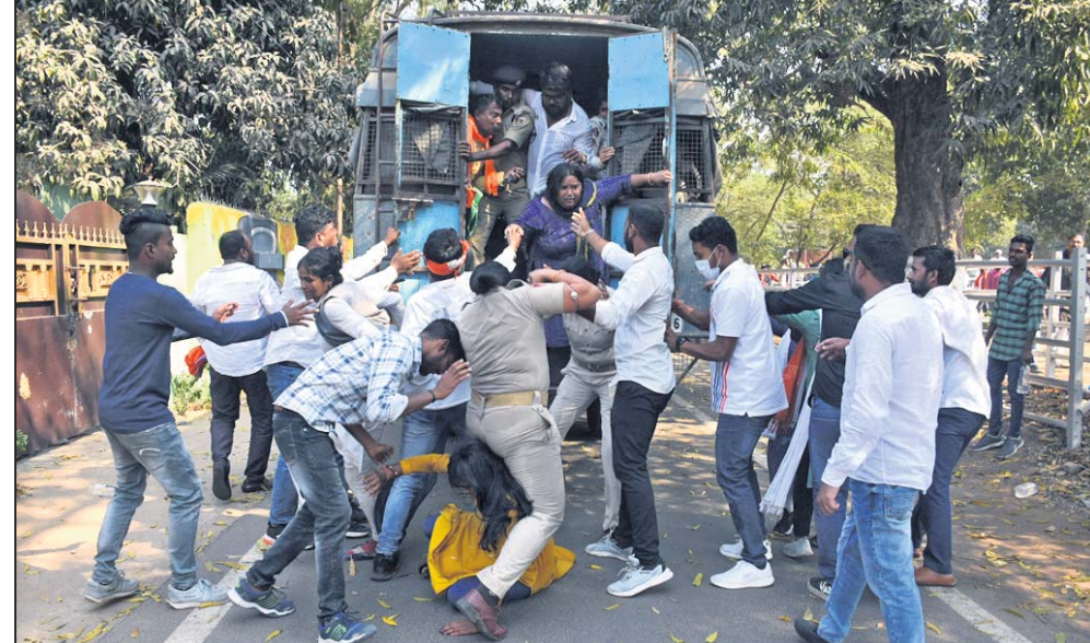
ଭାଜପା ଯୁବମୋର୍ଚ୍ଚା କର୍ମୀଙ୍କୁ ପୋଲିସ୍ ଭ୍ୟାନ୍‌ରେ ନେଇଥିବାବେଳେ ଜଣେ ମହିଳା କର୍ମୀ ତଳେ ପଡ଼ିଯାଇଛନ୍ତି।