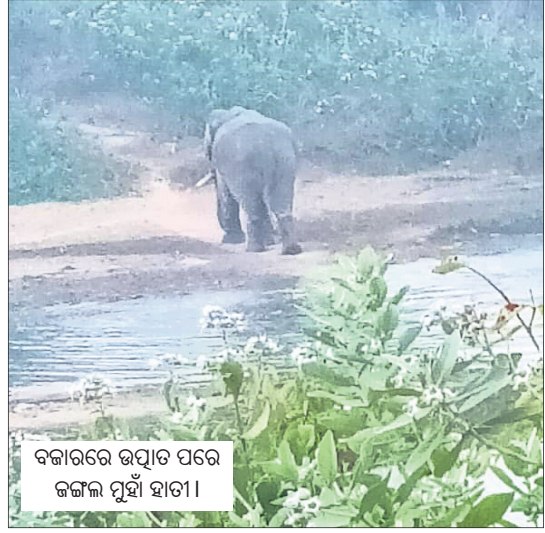
ବଜାରରେ ଉପାଦ ପରେ ଜଙ୍ଗଲ ପୁଣି ଯାତା।

ତେଲକୋଇ,୨୮୧୨(ଡି.ଏନ.ଏ): କେନ୍ଦୁଝର ଜିଲ୍ଲା ତେଲକୋଇ ବଜାର ଅଞ୍ଚଳରେ ମଙ୍ଗଳବାର ଏକ ଗୋଠଛଡ଼ା ଦନ୍ତା ବୁଲୁଥିବା ଦେଖିବାକୁ ମିଳିଥିଲା।