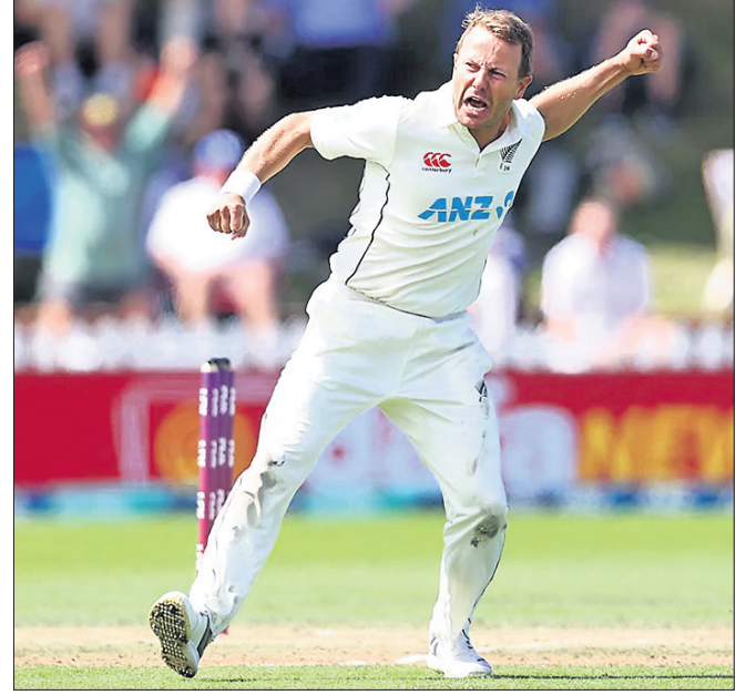
କେପ୍ ଆଣ୍ଡରସନଙ୍କ ଉଇକେଟ ନେବାପରେ ନିଲ୍ ଡ୍ରାଗନଙ୍କ ପ୍ରତିକ୍ରିୟା।

ଫ୍ରେଜିଂଟନ, ୨୮/୧ (ପି.ଟି.) ଫ୍ରେଜିଂଟନରେ ବେସିନ୍ ରିଜର୍ଭରେ ଅନୁଷ୍ଠିତ ଦ୍ୱିତୀୟ ଟେଷ୍ଟରେ ରୋମାଞ୍ଚକର ବିଜୟ ହାସଲ କରିଛନ୍ତି ନ୍ୟୁଜିଲାଣ୍ଡ। ଇଂଲଣ୍ଡ ୨୫୮ ରନର ପିଛା କରୁଥିବା ବେଳେ ୨୫୭ ରନରେ ସମସ୍ତ ଉଇକେଟ ହରାଇଥିଲା। ଫଳରେ ଏହି ମ୍ୟାଚକୁ ୧ ରନରେ ଜିତି ନେଇଥିଲା ଇନ୍ଦୋର ଦଳ। ଅନ୍ତିମ ଦିନରେ ଇଂଲଣ୍ଡ ପାଖରେ ୯ ଉଇକେଟ ରହିଥିବା ବେଳେ ବିଜୟ ପାଇଁ ମାତ୍ର ୨୧୦ ରନ ଆବଶ୍ୟକ ଥିଲା। ପ୍ରଥମ ଇନିଂସରେ ଶତକ ହାସଲକାରୀ କୋ ରୁଟ୍ (୯୫) ରନର ସମସ୍ତ ଇନିଂସ ଖେଳିଥିଲେ ମଧ୍ୟ ଦଳକୁ ବିଜୟ କରି ପାରି ନ ଥିଲେ। ପ୍ରଥମ ମ୍ୟାଚକୁ ଇଂଲଣ୍ଡ ୨୬୭ ରନରେ ଜିତିଥିବା ବେଳେ ନ୍ୟୁଜିଲାଣ୍ଡ ସିରିଜ ବରାବର କରିବାରେ ସମର୍ଥ ହୋଇଛି। ଏହା ସହ ତୃତୀୟ ଦଳ ଭାବରେ ଫାଇନାଲ୍ ପରେ ଟେଷ୍ଟ ମ୍ୟାଚ ଜିତିବାର ରେକର୍ଡ ନିଜ ନାମରେ କରିଛନ୍ତି ନ୍ୟୁଜିଲାଣ୍ଡ। ଇଂଲଣ୍ଡ (୧୮୯୪, ୧୯୮୧) ଓ ଭାରତ ୨୦୦୧ ମସିହାରେ ଏହି ସଫଳତା ହାସଲ କରିଥିଲେ। ନ୍ୟୁଜିଲାଣ୍ଡ ପକ୍ଷରୁ ନିଲ୍ ଡ୍ରାଗନର ୪ ଉଇକେଟ ନେଇ ବିଜୟରେ ପୁଷ୍ପ ଭୂମିକା ଗ୍ରହଣ କରିଥିଲେ। କୋ ରୁଟ୍ ୯୫ ରନ କରି ଏକାକୀ ଲଡେଇ କରିଥିଲେ ହେଁ ଅନ୍ୟ ବ୍ୟାଟରଙ୍କ ପକ୍ଷରୁ ଆବଶ୍ୟକ ସହଯୋଗ ମିଳି ନ