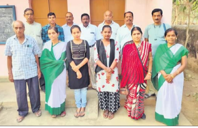
ଭଞ୍ଜନଗର ଶିକ୍ଷାକେନ୍ଦ୍ର ପରିଦର୍ଶନ କରୁଛନ୍ତି କର୍ମଚାରୀ ।

୨୦୨୩-୨୪ ଶିକ୍ଷାବର୍ଷଠାରୁ ନୂତନ ଶିକ୍ଷାନୀତି କଡ଼ାକଡ଼ି ପାଳନ କରିବା ପାଇଁ କେନ୍ଦ୍ର ସରକାର ନିର୍ଦ୍ଦେଶ ଦେଇଛନ୍ତି । ଏହାକୁ ରାଜ୍ୟ ସରକାର ମଧ୍ୟ କାର୍ଯ୍ୟକାରୀ କରିବାକୁ ଯାଚୁଛନ୍ତି ।