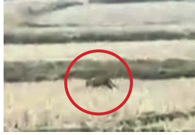
ଗାଁ ପାଖ ବିଲରେ ବାଘ। (ବୃତ୍ତ ଚିହ୍ନିତ)

ସୁନ୍ଦରଗଡ଼/ ବଡ଼ଗାଁ/ କୁଡୁଆ, ୧୫।୩।(ଡି.ଏନ୍.ଏ.)