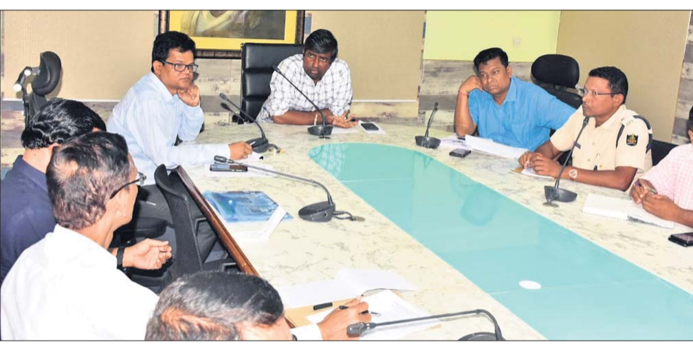
ବୈଠକରେ ଜିଲାପାଳ ଓ ଅନ୍ୟ ଅଧିକାରୀମାନେ ଆଲୋଚନା କରୁଛନ୍ତି ।

ଆସନ୍ତା ୧୪ ତାରିଖଠାରୁ ଗଞ୍ଜାମ ଜିଲାର ଅଧିକାରୀଙ୍କ ଦେବା ମା' ଚାରାତାରିଣୀଙ୍କ ଚୈତ୍ର ପର୍ବ ଅନୁଷ୍ଠିତ ହେବ । ଏହି ପର୍ବ ୪ ପାଳି ଅର୍ଥାତ୍ ମାର୍ଚ୍ଚ ୧୪, ୧୫ ଓ ୧୬ ତାରିଖ ଏବଂ ଏପ୍ରିଲ ୪ ତାରିଖ ଦିନ ଅନୁଷ୍ଠିତ ହେବ ।