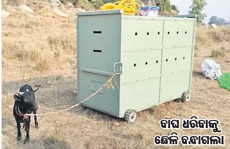
ଗାଁଘ ଧରିବାକୁ ଛେଳି ବନ୍ଧାଗଲା

ସୁନ୍ଦରଗଡ଼ ଜିଲ୍ଲା ବଡ଼ଗାଁ ବ୍ଲକ୍ ଅନ୍ତର୍ଗତ ଚିମନା ଗାଁରେ ବାଘ ଆତଙ୍କିତ ପୃଷ୍ଠି ହୋଇଛି। ବୁଧବାର ସକାଳେ ଲୋକମାନେ ନିଜ ଘରଠାରୁ ୨୦୦ରୁ ୩୦୦ ମିଟର ଦୂରରେ ଏକ କଲରାପତରିଆ ବାଘ ଦେଖିବାକୁ ପାଇ ଆତଙ୍କିତ ହୋଇପଡ଼ିଛନ୍ତି। ବାଘଟି ଗାଁ ଗାରିପଟେ ବିଲରେ ଘୁରିରୁଛନ୍ତି। ଏହାର ଭିତ୍ତିଠି