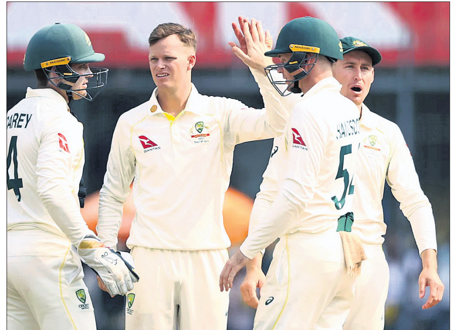
ଉଇକେଟ ନେବାପରେ ମାଥ୍ୟୁ କନେମନ(ବାମରୁ ତୃତୀୟ)ଙ୍କୁ ସାଥୀ ଖେଳାଳିଙ୍କ ବଧେଇ।

ଚହ୍ କିତ ଭାରତ ବ୍ୟାଟିଂ ନିଷ୍ଠୁରି ନେଇଥିଲା। ମାତ୍ର ପିଚୁ ମିଳିଥିବା ଚର୍ଚ୍ଚ ଓ ବାଉଁଶରୁ ଅଷ୍ଟ୍ରେଲିଆ ଫିନରମାନେ ଭରପୁର ଫାଇଦା ଉଠାଇବାକୁ ଭାରତ ଇନିଂସ ଉତ୍ତୁଡ଼ି ପଡ଼ିଥିଲା। ବିରାଟ କୋହଲି