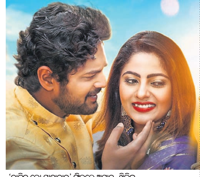
'ବାଜିବ ଲୋ ସାହାନାଲ' ଫିଲ୍ମରେ ଅମ୍ଳାନ-ଝିଲିକ୍