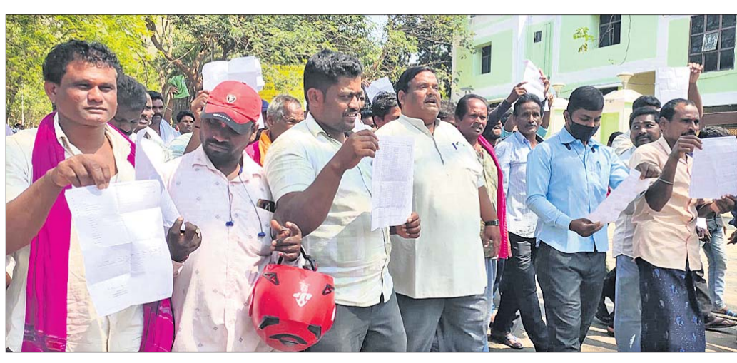
ଜିଲାପାଳଙ୍କ କାର୍ଯ୍ୟାଳୟ ସମ୍ମୁଖରେ ବିକ୍ଷୋଭ କରାଯାଇଛି ।

ପାରଳାଖେପୁଞ୍ଜି, ୧୩(ଡି.ଏନ୍.ଏ.): ଗଜପତି ଜିଲ୍ଲାରେ ଧାନ ସଂଗ୍ରହ କରିବାରେ ବ୍ୟାପକ ଅନିୟମିତତା ନେଇ ବୁଧବାର ଚାଷୀମାନେ ଜିଲାପାଳ କାର୍ଯ୍ୟାଳୟ ଘେରାଇ କରିଛନ୍ତି ।