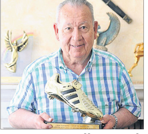
କାରଣରୁ ଅନ୍ୟ ଜଣଙ୍କ ଠାରୁ ମାରି ଆଣିଥିବା ଜୋଡାରେ ସେ ଖେଳିଥିଲେ। ପଶ୍ଚିମ ଜର୍ମାନୀ ବିପକ୍ଷ ଡ୍ରୋଇ ସ୍ଥାନ ମ୍ୟାଚରେ ସେ ୪ ଗୋଲ୍ ସ୍କୋର କରିଥିଲେ।

ଭୁବନେଶ୍ୱର, ୧୩ (ପି.ଟି.) ପ୍ରାନ୍ତ ପ୍ରସିଦ୍ଧ ଯୁବକଲର ଜଷ୍ଟି ଫୋର୍ଣ୍ଟାଇନଙ୍କ ୮୯ ବର୍ଷ ବୟସରେ ପରଲୋକ ଘଟିଛି। ଫୋର୍ଣ୍ଟାଇନଙ୍କ ପୂର୍ବତନ କୁବରିମ୍‌ସ୍ ପକ୍ଷରୁ ରୁଧିର ବାବୁ ଘୋଷଣା କରାଯାଇଛି। ୧୯୫୮ ସଂସ୍କରଣର ବିଶ୍ୱକପ୍ ଖେଳିବାର ସୁଯୋଗ ପାଇଥିବା ଫୋର୍ଣ୍ଟାଇନ ଦେଇଥିଲେ ୧୩ଟି ଗୋଲ୍। ମାଡ୍ରା ଗୋଟିଏ ସଂସ୍କରଣ ବିଶ୍ୱକପ୍ ଖେଳି ସର୍ବାଧିକ ଗୋଲ୍ ସ୍କୋରରକ ତାଲିକାରେ ଚତୁର୍ଥ ସ୍ଥାନରେ ରହିଛନ୍ତି ଫୋର୍ଣ୍ଟାଇନ। ଉଲ୍ଲେଖଯୋଗ୍ୟ ଯେ, ମରଲୋକେ ଜନ୍ମିତ ଫୋର୍ଣ୍ଟାଇନ ପ୍ରଥମ ପଦସର ଖେଳାଳି ଭାବରେ ପ୍ରାନ୍ତ ଦଳରେ ସ୍ଥାନ ପାଇଥିଲେ। ଶେଷ ମିନିଟରେ ତାଙ୍କୁ ଦଳରେ ସାମିଲ କରାଯାଇଥିବା ବେଳେ ଆଉ ଜଣେ ଠାରୁ ମାରି ଆଣିଥିବା ଗୋଟାରେ ସେ ଏହି କବିତା ଦେଖାଇଥିଲେ। ଏହି ଫରଫାଟ୍ ଖେଳାଳି ଜଣଙ୍କ ସ୍ମୃତେନ ବିଶ୍ୱକପ୍ରେ ସମସ୍ତଙ୍କ ମନୋରଞ୍ଜନ କରିଥିଲେ। ଏପରିକି ବିଶ୍ୱକପ୍ରେ ଅଭ୍ୟାସ କରିବା ବେଳେ ତାଙ୍କ ଜୋଡା ଛିଡିବିବା