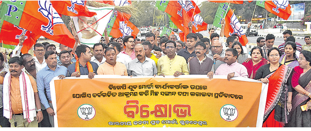
ମୁର ମୋର୍ଚ୍ଚା କର୍ମୀଙ୍କୁ ପୋଲିସର ଆକ୍ରମଣ ପ୍ରତିବାଦରେ ରୁଧିର ରାଜ୍ୟ ଭାଜପା ପକ୍ଷରୁ ମାଷ୍ଟରକ୍ୟାଣ୍ଡିଓ ଠାରେ ବିରୋଧ।