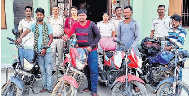
ଜବତ ବାଇକ୍ ସହ ଗିରଫ ଅଭିଯୁକ୍ତ।