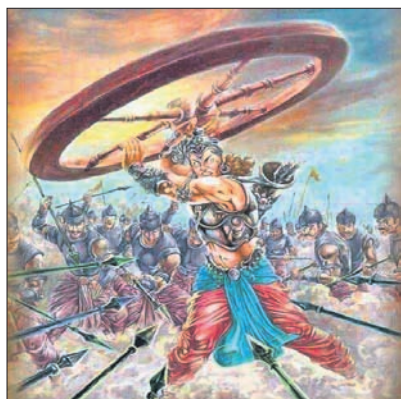
ଠକାମିର ଶିକାର ହେବା ଦ୍ୱାରା ପୁନର୍ବାର ପାଠକମାନଙ୍କ ପ୍ରତି ଦୁର୍ଯ୍ୟୋଧନଙ୍କ ଦୃଷ୍ଟା ବଦଳିଯାଇଥିଲା ।