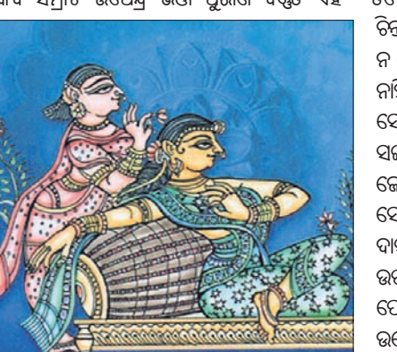
ନାରୀମାନଙ୍କୁ ଶିକ୍ଷା ଦେବା ପାଇଁ ଉପେନ୍ଦ୍ର ଭଞ୍ଜ ପୁରୁଷର ସମକକ୍ଷ ହୋଇପାରିବ ଭାବି ସେ ନିଜ ରଚନାରେ ନାରୀ ଚରିତ୍ରମାନଙ୍କୁ ବିଦ୍ୟା, ଶାସ୍ତ୍ର ବୁଦ୍ଧିସମ୍ପନ୍ନ ଭାବରେ ଚିତ୍ରଣ କରିଛନ୍ତି ।