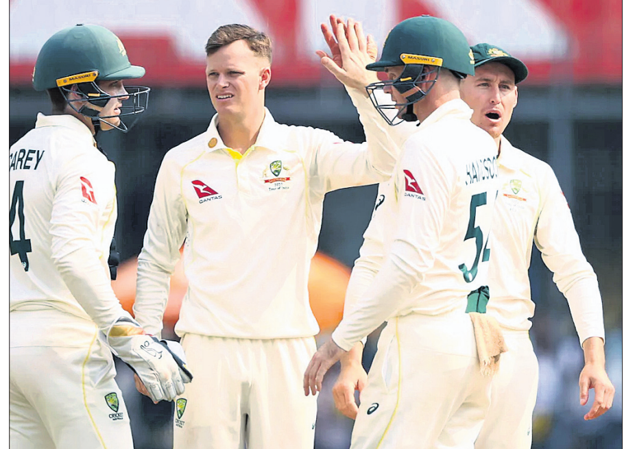
ଉଇକେଟ ନେବାପରେ ମାଥ୍ୟୁ କନେମନ(ବାମରୁ ଦ୍ୱିତୀୟ)ଙ୍କୁ ସାଥୀ ଖେଳାଳିଙ୍କ ବଧେଇ।

ଚହ୍ କିତ ଭାରତ ବ୍ୟାଟିଂ ନିଷ୍ଠୁରି ନେଇଥିଲା। ମାତ୍ର ପିଚୁ ମିଲିଥିବା ଚର୍ଚ୍ଚ ଓ ବାଉଁଶରୁ ଅଷ୍ଟ୍ରେଲିଆ ଫିନରମାନେ ଭରପୁର ଫାଇଦା ଉଠାଇବାକୁ ଭାରତ ଇନିଂସ ଉଠାଇବାକୁ ପଡ଼ିଥିଲା। ବିରାଟ କୋହଲି