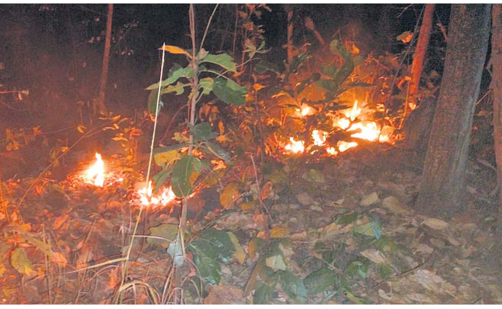
ଉତ୍ତର ଘୁମୁସର ବନଖଣ୍ଡରେ ଜଙ୍ଗଲରେ ନିଆଁ ଲାଗି ଜଳୁଛି ।