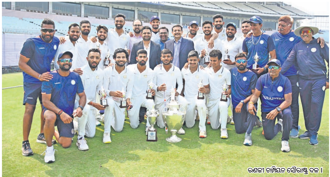
ରଣଜୀ ଚାମ୍ପିୟନ ସୌରାଷ୍ଟ୍ର ଦଳ ।

ପ୍ର- ଆଗାମୀ ଦିନ ପାଇଁ କ'ଣ ଯୋଜନା ରହିଛି ? ଉ- ରାଜ୍ୟ ତଥା ଦେଶ ପାଇଁ ପଦକ ଜିତିବା ମୋର ଏକମାତ୍ର ଲକ୍ଷ୍ୟ। ଆଗାମୀ ଦିନରେ ଓଡ଼ିଶା ଲାଗି ପଦକ ଜିତିବା ସହ ପ୍ୟାରୀଦେବୀଙ୍କ ପରି ଜାତୀୟ ଦଳରେ ସ୍ଥାନ ହାସଲ କରିବା ମୋର ଅଭିଳାଷ ରହିଛି। —ପ୍ରସ୍ତୁତି: ସରୋଜ କୁମାର ଜେନା