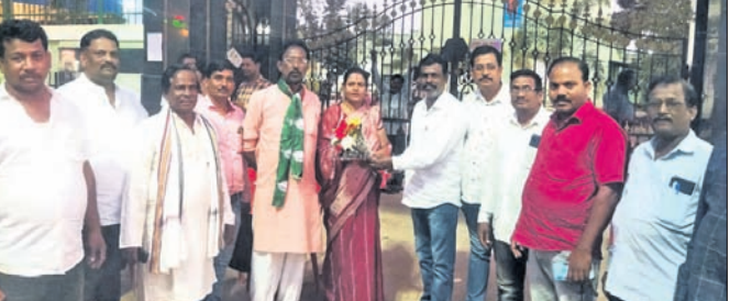
୬ ନମ୍ବର ଜୋନରୁ ସଭ୍ୟା ହେଲେ ସଂଯୁକ୍ତା

ପରେ ଶ୍ରୀଦେବୀ ବିନାମରେ ଜଗନ୍ନାଥବଲଭ ମଠକୁ ବିଜେ ହୋଇଥିଲେ। ଶ୍ରୀମନ୍ଦିରରେ ସନ୍ଧ୍ୟା ଆଳତି ବଢ଼ି ସନ୍ଧ୍ୟାଧୂପ ନିମନ୍ତେ ପାଣି ଦିଆଯାଇଛି।