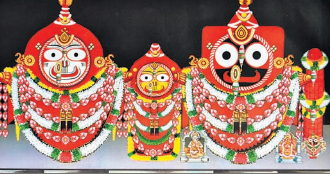
ନାଚି ବଢ଼ିଥିଲା। ପରେ ରତ୍ନସିଂହାସନରେ ଚାଟୋରୀ ବେଶ ବଢ଼ିଥିଲା।

ଫଗୁ ଦଶମୀ ଅବସରରେ ଗୁରୁବାର ଶ୍ରୀମନ୍ଦିରରେ ରତ୍ନସିଂହାସନାରୁ ଶ୍ରୀବିଗ୍ରହମାନଙ୍କର ଚାଟୋରୀ ବେଶ ଅନୁଷ୍ଠିତ ହୋଇଯାଇଛି।