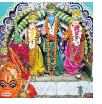
କଢାମଳ ରଘୁନାଥ ଦେବଙ୍କ ପୀଠ ଚଳଚଞ୍ଚଳ ହୋଇଥିଲା।

ବେଗୁନିଆ ବୁକ୍ ପଢ଼ାପଢ଼ି କଢାମଳ ଗ୍ରାମସ୍ଥିତ ରଘୁନାଥ ଦେବଙ୍କ ପୀଠ ପରିସର ଯାଜ୍ଞ ଯୋଗୁ ଚଳଚଞ୍ଚଳ ହୋଇଥିଲା।