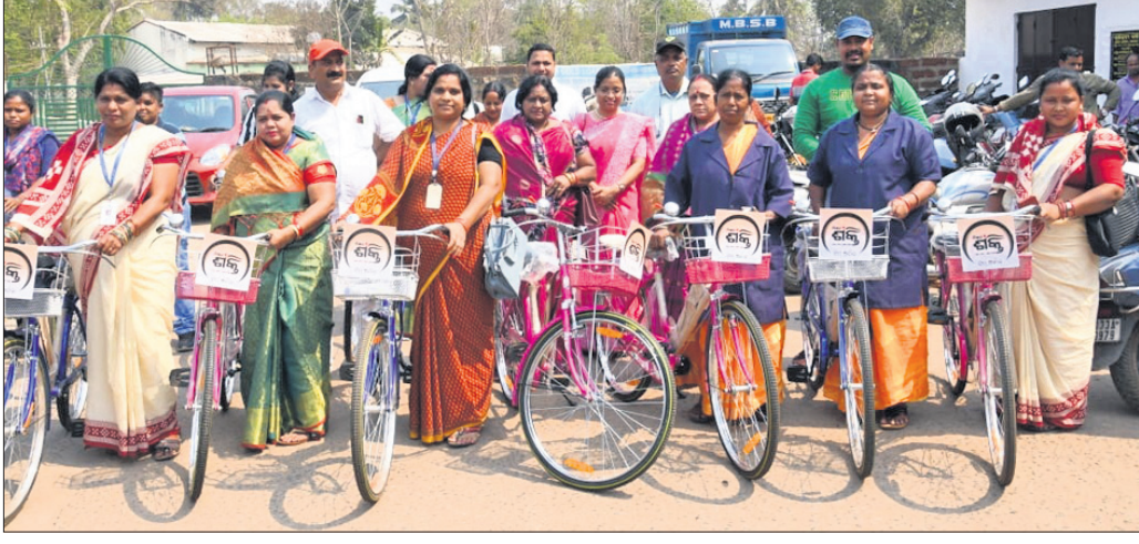
କାର୍ଯ୍ୟାଳୟରେ କାର୍ଯ୍ୟକାରୀ ଭାବେ ବ୍ୟବହାର ପାଇଁ ମହିଳାଙ୍କୁ ପ୍ରୋତ୍ସାହିତ କରାଯାଉଛି।

ନ୍ୟାୟ ମାରୁଛି ନୂତନ ପେନସନ ଯୋଜନାଭୁକ୍ତ ମାଧ୍ୟମିକ ଶିକ୍ଷକ ସଂଘ