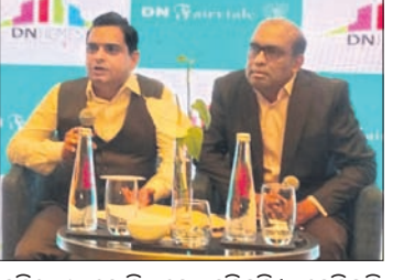
ଧୂରଣୀ ସରିବ ‘ଡିଏନ୍ ଫେରିଟେଲ’ ପ୍ରକଳ୍ପର ଅନୁଷ୍ଠାନ ଦିଆଯାଇଛି। ଏହି ପ୍ରକଳ୍ପର ଅନୁଷ୍ଠାନ ଦିଆଯାଇଛି।

ଧୂରଣୀ ସରିବ ‘ଡିଏନ୍ ଫେରିଟେଲ’ ପ୍ରକଳ୍ପର ଅନୁଷ୍ଠାନ ଦିଆଯାଇଛି। ଏହି ପ୍ରକଳ୍ପର ଅନୁଷ୍ଠାନ ଦିଆଯାଇଛି। ଏହି ପ୍ରକଳ୍ପର ଅନୁଷ୍ଠାନ ଦିଆଯାଇଛି। ଏହି ପ୍ରକଳ୍ପର ଅନୁଷ୍ଠାନ ଦିଆଯାଇଛି।