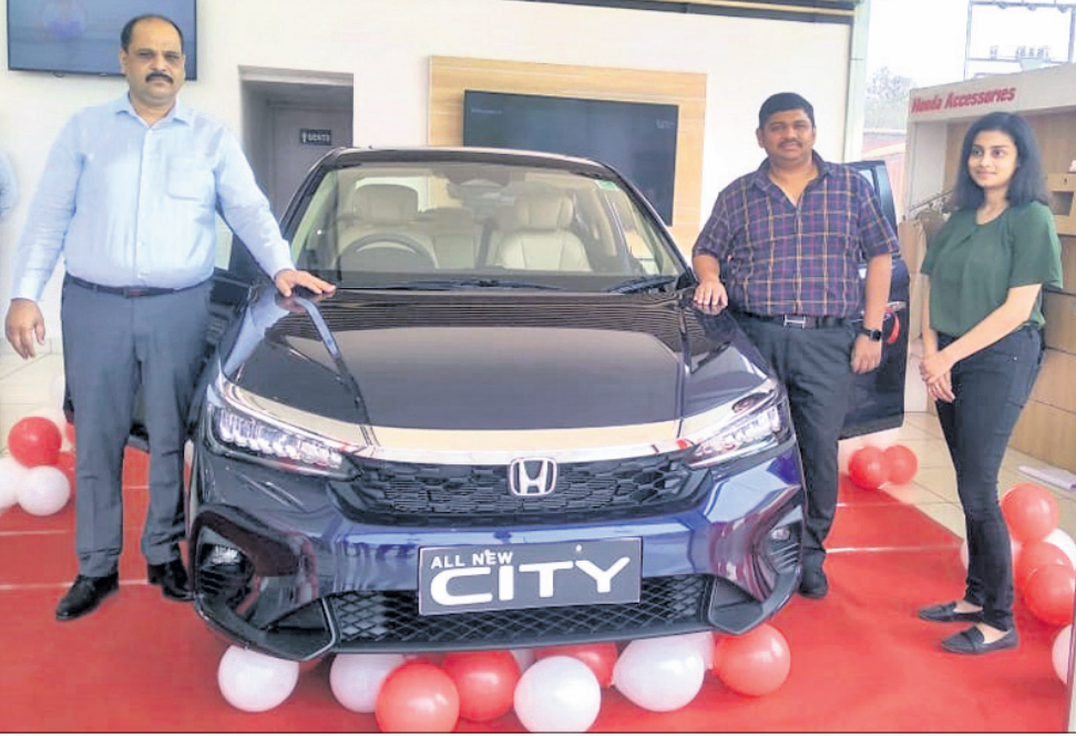
ହୋଣ୍ଡା ଅଲ୍ ନ୍ୟୁ ସିଟିର ବଜାର ପ୍ରବେଶ ହୋଇଛି। ଏହି ପରିସ୍ଥିତିରେ ହୋଣ୍ଡା ଅଲ୍ ନ୍ୟୁ ସିଟିର ବଜାର ପ୍ରବେଶ ହୋଇଛି।

ହୋଣ୍ଡା ଅଲ୍ ନ୍ୟୁ ସିଟିର ବଜାର ପ୍ରବେଶ ହୋଇଛି। ଏହି ପରିସ୍ଥିତିରେ ହୋଣ୍ଡା ଅଲ୍ ନ୍ୟୁ ସିଟିର ବଜାର ପ୍ରବେଶ ହୋଇଛି। ଏହି ପରିସ୍ଥିତିରେ ହୋଣ୍ଡା ଅଲ୍ ନ୍ୟୁ ସିଟିର ବଜାର ପ୍ରବେଶ ହୋଇଛି। ଏହି ପରିସ୍ଥିତିରେ ହୋଣ୍ଡା ଅଲ୍ ନ୍ୟୁ ସିଟିର ବଜାର ପ୍ରବେଶ ହୋଇଛି।