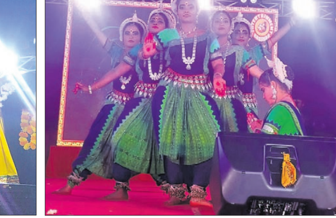
ଉତ୍ସବରେ କଳାକାରମାନେ ନୃତ୍ୟ ପରିବେଷଣ କରୁଛନ୍ତି।