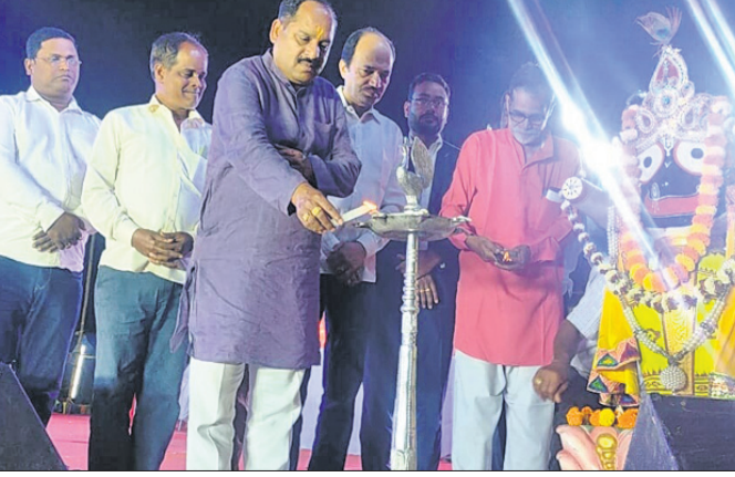
ବେଗୁନିଆରେ ଆମ ଗାଁ ମହୋତ୍ସବ ଉଦ୍‌ଘାଟନ ଅବସରରେ ଅତିଥିମାନେ ପ୍ରତୀପ ପ୍ରକଳ୍ପ କରୁଛନ୍ତି।