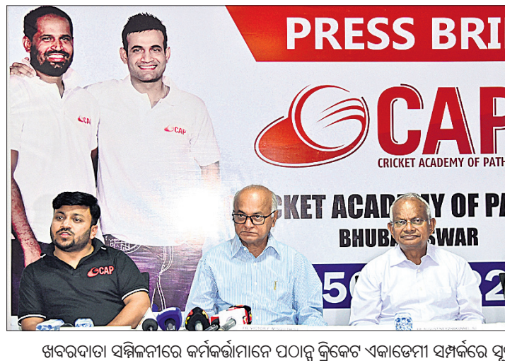
ଖବରଦାତା ସମ୍ମିଳନୀରେ କର୍ମକର୍ମୀମାନେ ପଠାନ୍ତୁ କ୍ରିକେଟ ଏକାଡେମୀ ସମ୍ପର୍କରେ ସୂଚନା ଦେଉଛନ୍ତି।

ଦେଉଥିବା ପ୍ରକାଶ କରିଥିଲେ। ଅନ୍ତର୍ଜାତୀୟ କ୍ରିକେଟରେ ସଫଳତା ପରେ ପଠାନ୍ତୁ ବ୍ରଦର୍ସ ତାଙ୍କ ସ୍ୱପ୍ନ କ୍ରିକେଟ ଏକାଡେମୀ ୨୦୧୪ ସେପ୍ଟେମ୍ବର ୧୧ରେ ଶୁଭାରମ୍ଭ କରିଥିଲେ। ଗତ ୯ ବର୍ଷ ମଧ୍ୟରେ ଦେଶର ବିଭିନ୍ନ ସ୍ଥାନରେ ଭିତ୍ତିପଥରେ ୨୬ଟି ଏକାଡେମୀ କାର୍ଯ୍ୟକ୍ଷମ ହୋଇଛି। ଏକାଡେମୀର ଭୁବନେଶ୍ୱର ଶାଖାରେ ୨ଟି ଚର୍ଚ୍ଚ ମ୍ୟାଚ ପିଚ୍ ଏବଂ ୩ଟି ପ୍ରାକ୍ଟିସ୍ ପିଚ୍ ରହିବ।