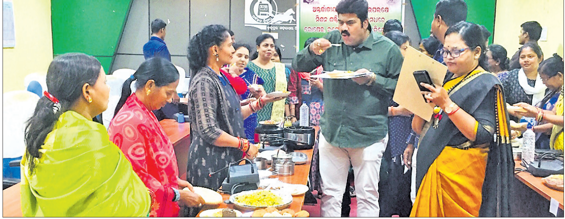
ଅତିଥିମାନେ ଖାଦ୍ୟର ସ୍ୱାଦ ପରଖୁଛନ୍ତି।