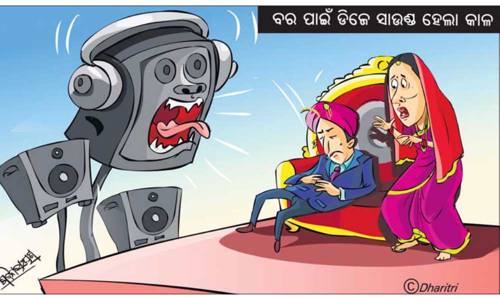
ବର ପାଇଁ ଡିଜେ ସାଉଣ୍ଡ ହେଲା କାଳ

ନେତୃତ୍ୱରେ ଓଡ଼ିଶା ଭିଜିଲାନୁ ଦ୍ୱାରା ଅନୁଗୋଳ, ଖୋର୍ଦ୍ଧା ଓ କଳାହାଣ୍ଡି ଜିଲାର ୮ଟି ସ୍ଥାନରେ ଏକକାଳୀନ ଚଢ଼ାଉ ଜାରି ରହିଛି। ଭୁବନେଶ୍ୱରର ବିଭିନ୍ନ ସ୍ଥାନରେ ଅନୁଗୋଳ ଜିଲା ଭୁବନେଶ୍ୱର ଥିବା ଏକ ଦୁଇମହଲା ଘର, ଖୁଲାରରେ ଏକ ପୁଅ ଓ ପେଡ଼ିକ ଗ୍ରାମ ବନ୍ଦୁକରେ ଥିବା ଘର, ଭବାନୀପାଟଣା ସରକାରୀ କ୍ୱାର୍ଟର ଓ କାର୍ଯ୍ୟାଳୟରେ ବର୍ତ୍ତମାନ ବି ଚଢ଼ାଉ ଜାରି ରହିଥିବା ଜଣାପଡ଼ିଛି।