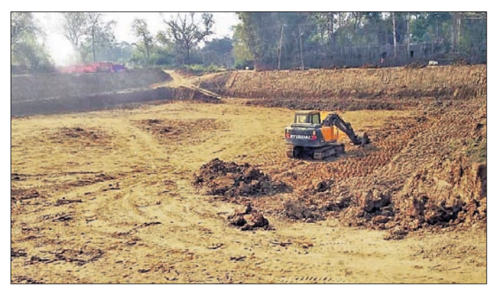
କେସିବି ଦ୍ୱାରା ପୋଖରୀ ଖନନ କରାଯାଇଛି।