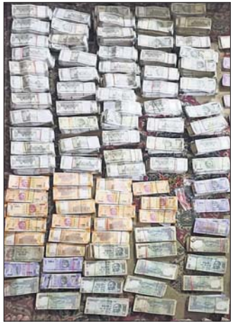
ଘରୁ ୦୧ ହୋଇଥିବା ପ୍ରାୟ ୧ କୋଟି ନଗଦ ଟଙ୍କା