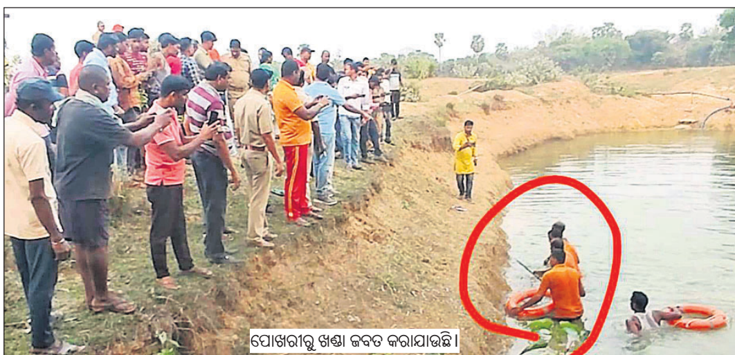
ସୋରରୁ ଖଣ୍ଡା ଜବତ କରାଯାଇଛି।