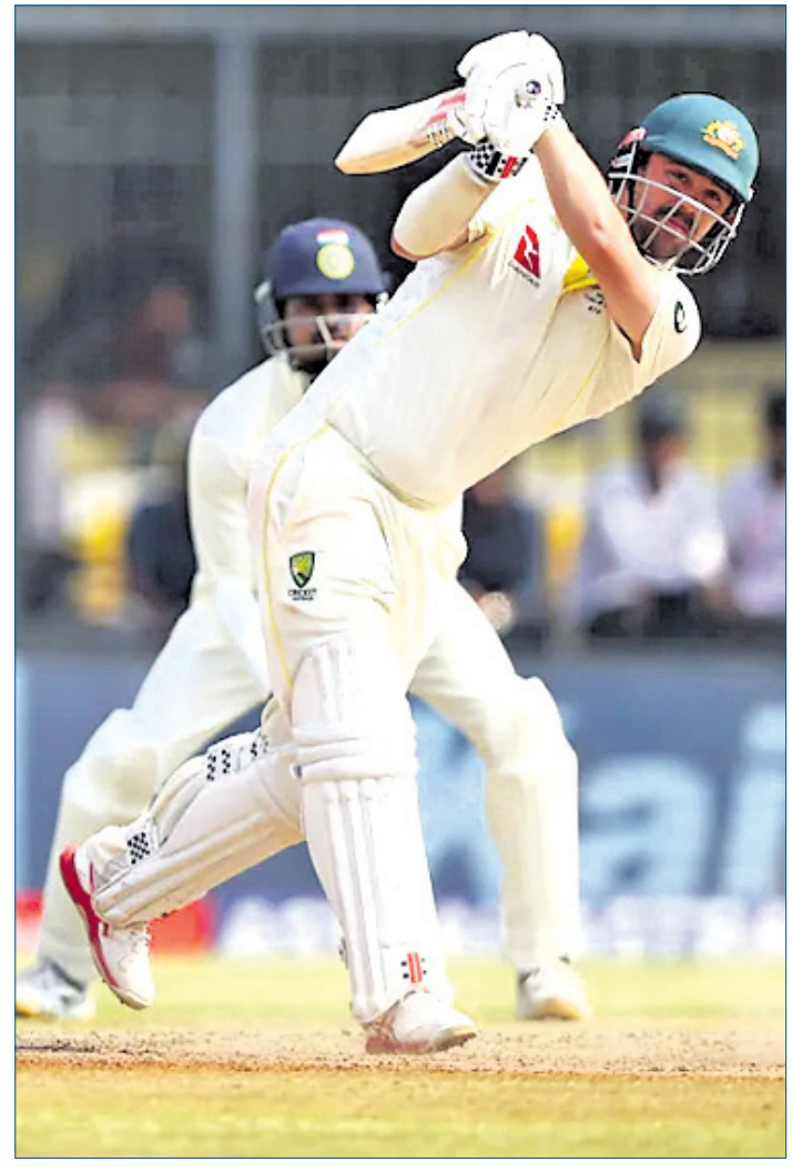
ଶତ ଖେଳିବା ଅବସରରେ ଗ୍ରାଭିସ ହେଉ।

ସାମାନ୍ୟ ଆଶା ସଞ୍ଚାର କରିଥିଲେ। ମାତ୍ର ଗ୍ରାଭିସ ହେଉ ୪୯ ଓ ମାର୍ନସ ଲାବୁସେନ ୨୮ ରନରେ ଅପରାଜିତ ରହି ଦଳକୁ ସହଜ ବିଜୟ ପ୍ରଦାନ କରିଥିଲେ। ଅପମାତ୍ର ଦ୍ୱିତୀୟ ଉଇକେଟରେ ଦୁହେଁ ୭୮ ରନ ଯୋଗ କରିଥିଲେ। ଅଷ୍ଟ୍ରେଲିଆ ପ୍ରଥମ ୧୦ ଓଭର ଡିଫେନ୍ସିଭ୍ ଖେଳି ୧ ଉଇକେଟରେ ମାତ୍ର ୧୩ ରନ କରିଥିଲା। ମାତ୍ର ୧୦ ଓଭର ପରେ ବଲ୍ ପରିବର୍ତ୍ତନ ସହ ଅଷ୍ଟ୍ରେଲିଆର ଆଗ୍ୟ ପରିବର୍ତ୍ତନ ହୋଇଥିଲା। ଆକ୍ରମଣାତ୍ମକ ବ୍ୟାଟିଂ ପାଇଁ ପରିଚିତ ହେଉ ଓ ଲାବୁସେନ ବଡ଼ ଶତ୍କ ଖେଳି ଭାରତୀୟ ବୋଲରଙ୍କୁ ନିରାଶ କରିଥିଲେ। ୧୯ତମ ଓଭରର ୫ମ ବଲ୍ରେ ଲାବୁସେନ ବିଜୟ ସୂଚକ ଚୌକା ମାରିବା ସହ