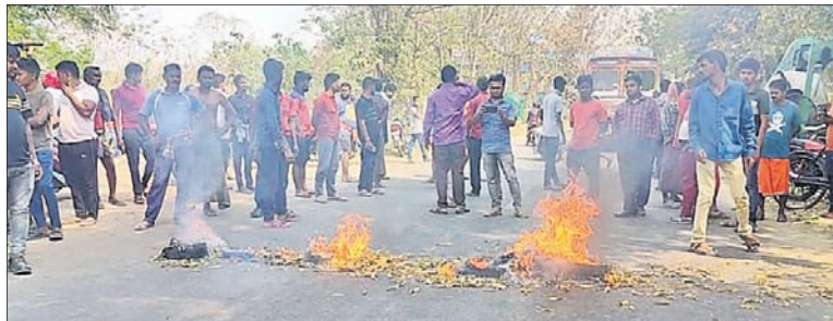
ଦୁର୍ଘଟଣା ପରେ ଲୋକେ ନିଆଁ ଜାଳି ରାସ୍ତାରେକୋ କରିଛନ୍ତି ।