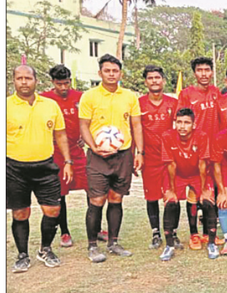
ଅତିଥି ଗହଣରେ ଉଭୟ ଦଳର ଖେଳାଳି।