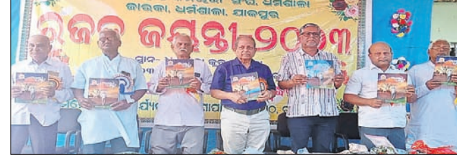
ଅବସର ଜ୍ୟୋତି ପତ୍ରିକାକୁ ଅତିଥିମାନେ ଉନ୍ମୋଚନ କରୁଛନ୍ତି।