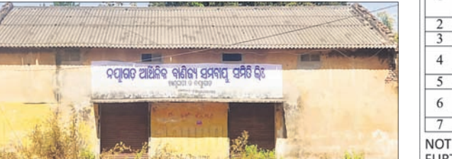
ଅବହେଳିତ ଭାବେ ପଡ଼ିଥିବା ବାଣିଜ୍ୟ ସମବାୟ ସମିତି ଗୃହ ।

ଖଣ୍ଡପଡ଼ା, ୩୩୩ (ସ.ପ୍ର.) ପ୍ରଶାସନ ପକ୍ଷରୁ ଖଣ୍ଡପଡ଼ା ସେବା ସମବାୟ ସମିତିରେ ଧାନମଣି ଖୋଲାଯାଇ ଗଣାକଠା ଧାନକ୍ରୟ କରାଯାଇଥିବା ବାଲିପାଏ ରାସ୍ତାର ଉଭୟ ପାର୍ଶ୍ୱରେ ଗଣାମାନେ ବହୁ କୁଳଖିଲ ଧାନ ମହଜୁର ରଖି ବିକ୍ରୀ କରିବା ଯୋଗୁ ଗ୍ରାମିକ ସମସ୍ୟା ସୃଷ୍ଟି ହୋଇଥିବା ଏହାକୁ ଦୃଷ୍ଟିରେ ରଖି ବାଣିଜ୍ୟ ସମବାୟ ସମିତି ଗୃହକୁ ପୁନଃ କାର୍ଯ୍ୟକାରୀ କରାଯାଇ ଖଣ୍ଡପଡ଼ା ସେବା ସମବାୟ ସମିତି କାର୍ଯ୍ୟାଳୟ ଅଧୀନକୁ ହସ୍ତାନ୍ତର କଲେ ଖଣ୍ଡପଡ଼ା ଅଞ୍ଚଳର ଶତାଧିକ ଗଣା ଉପକୂଳ ହୋଇ ପାରନ୍ତେ ବୋଲି ସାଧାରଣରେ ଆଲୋଚନା ହେଉଛି । ନୟାଗଡ଼ ଜିଲ୍ଲାପାଳ, ଜିଲ୍ଲା ଯୋଗାଣ ଅଧିକାରୀ ଏସ୍ପିପ୍ରତି ଦୃଷ୍ଟି ଦେବାକୁ ଦାବି ହେଉଛି ।