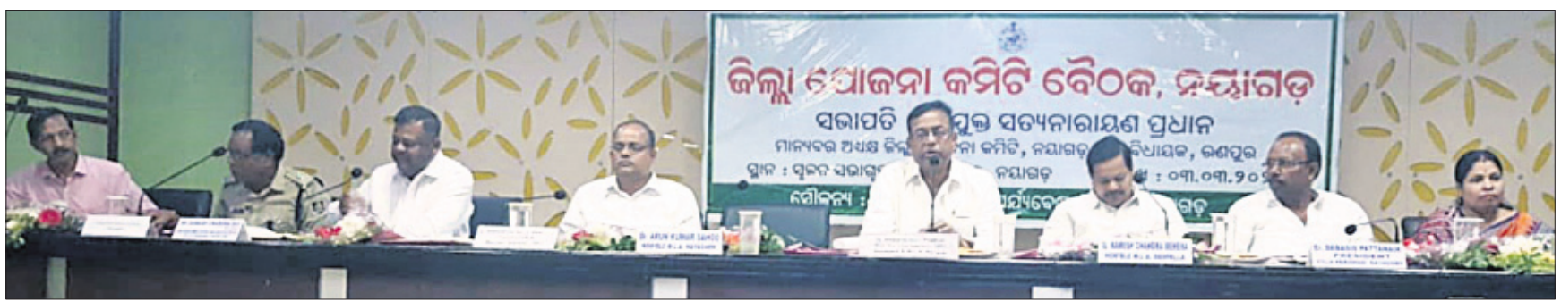
ଯୋଜନା କମିଟି ବୈଠକରେ ଜନ ପ୍ରତିନିଧି ଓ ଅନ୍ୟମାନେ ।

ସେଲ୍ଫି ପଠାଇବା ସମୟରେ ନିଜର ନାମ ଏବଂ ମୋବାଇଲ ନମ୍ବର ଦେବାକୁ ଜୁଲୁକ ନାହିଁ । ଯୋଗ୍ୟବେତନ ପତ୍ର ପ୍ରକାଶ ପାଇବ ।