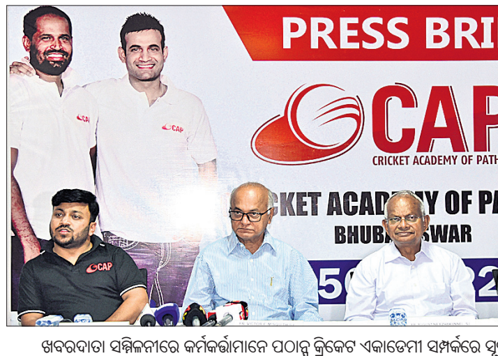
ଖବରଦାତା ସମ୍ମିଳନୀରେ କର୍ମକର୍ମୀମାନେ ପଠାନ୍ତୁ କ୍ରିକେଟ ଏକାଡେମୀ ସମ୍ପର୍କରେ ସୂଚନା ଦେଉଛନ୍ତି।