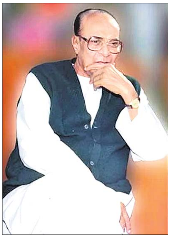
ପହଞ୍ଚିପାରିଥିଲେ। ପରିଶ୍ରମଶୂନ୍ୟ ପିଠିରେ ପଡ଼ିଥିଲା ଲାଠି ପାହାର।

ବିଜୁବାବୁ, ବିଜୁ ପଟ୍ଟନାୟକ ଓ ବିଜୁବାବୁ ଏହିପରି କିଛି ନାମରେ ପରିଚିତ ଥିଲେ ଅନେକ କିମ୍ବଦନ୍ତୀ କାହାଣୀର ସୃଷ୍ଟି, ମହାନାୟକ, ପ୍ରଖ୍ୟାତ ସ୍ୱାଧିନୀତା ରାଜନେତା ବିଜୁବାବୁ।