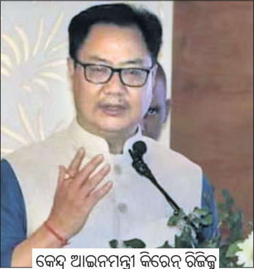
କେନ୍ଦ୍ର ଆଇନମନ୍ତ୍ରୀ କିରେନ୍ ରିଜିଷ୍ଟ୍ର