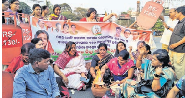
ଭୁବନେଶ୍ୱର ମାଷ୍ଟରକ୍ୟାଣ୍ଟିନ ଛକରେ ଲିଲା ମହିଳା କଂଗ୍ରେସ ପକ୍ଷରୁ ବିକ୍ଷୋଭ କରାଯାଇଛି।