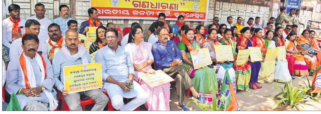
ଭୁବନେଶ୍ୱର ତିଥିପ ଅଫିସ୍ ସମ୍ମୁଖରେ ଶନିବାର ଭାଜପା ପକ୍ଷରୁ ଦିଆଯାଇଥିବା ଗଣଧାରଣାରେ ଦକ୍ଷା ନେତା ଓ କର୍ମୀ।

ଭୁବନେଶ୍ୱର, ୪ମାର୍ଚ୍ଚ(ସୁଧାକର) ତେଜାମାଳ ଲିଲାର ହିନ୍ଦୋଳ ଏବଂ ବରଗଡ଼ ଲିଲାର ଅତୀତରା ଏବଂ ଏହି ନିର୍ବାଚନ ପାଇଁ ସାଧାରଣ ପର୍ଯ୍ୟବେକ୍ଷକ ଓ ଖର୍ଚ୍ଚ ପର୍ଯ୍ୟବେକ୍ଷକ ନିୟୁକ୍ତି କରାଯାଇଛି।