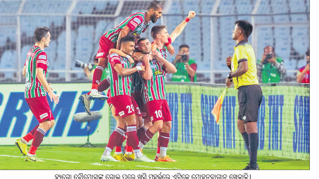
ଭୁବନେଶ୍ୱରରେ ଚଳିଥିବା ଖେଳାଳୀମାନଙ୍କ ପ୍ରତି ଯୁଦ୍ଧରେ ଓଡ଼ିଶା ଏଫ୍ ସିର ଅଭିଯାନ ଶେଷ ହୋଇଛି।

ବାହାରିନ୍ ଗ୍ରାଁ ପ୍ରିରେ ଭାଗନେବେ ହାମିଲଟନ୍ ହେବେ।