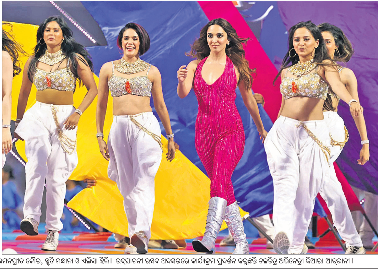
ପୁୟାଇ: ଓମେନ୍ସ ପ୍ରିମିୟର ଲିଗ୍ ର ଚୁପ୍ ଚମ୍ପିୟନ୍ ଅବସରରେ ଉପସ୍ଥିତ ଅଛନ୍ତି ଅନ୍ୟତମ ଶ୍ରେଣୀର ମହିଳା ଖେଳାଳୀ, ମେଗ୍ ଲାନ୍, ବେଥ୍ ପ୍ରି, ହରମନପ୍ରୀତ କୌର, ସ୍ମିତି ମହାନା ଓ ଏଲିସା ହିଲି। ଉଦ୍‌ଯାଗନା ଉତ୍ସବ ଅବସରରେ କାର୍ଯ୍ୟକ୍ରମ ପ୍ରଦର୍ଶନ କରୁଛନ୍ତି ଚଳିତ ଅଭିନେତ୍ରୀ କଥାଉଆ ଥାଉଆ।