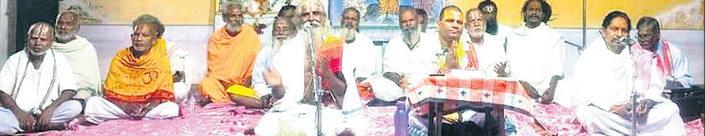
ଦେଶାନ୍ତ ଅଫିସ, ୪୩

ଦେଶାନ୍ତ ଅଫିସ ପ୍ରାଚୀନ ଯାତ୍ରା ପୋଖରୀ ମଠରେ ଗତ ୨୪ ତାରିଖରୁ ଚାଲିଥିବା ପର୍ଯ୍ୟଟନ ପ୍ରସ୍ତୁତ ହେବା ପରେ ପ୍ରମୁଖ ରାଜ୍ୟ ସରକାର ଏବଂ ପୋଲିସର ଏକକ କାର୍ଯ୍ୟକୁ ସମାଲୋଚନା କରିଥିଲେ।