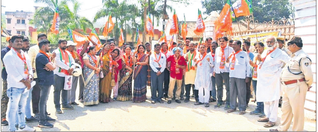
ଏସ୍ପିଙ୍କ କାର୍ଯ୍ୟାଳୟ ସମ୍ମୁଖରେ ଭାଜପା ନେତୃବୃନ୍ଦ ଧାରଣା।