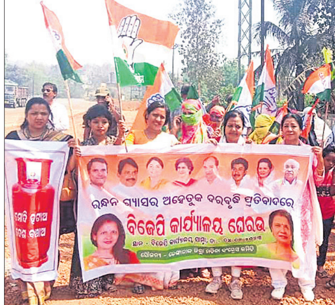
କଂଗ୍ରେସ କାର୍ଯ୍ୟକର୍ମୀମାନେ ଭାଜପା କାର୍ଯ୍ୟାଳୟ ଘେରାଇ କରିଛନ୍ତି।

ଠକାମି ବିବାହ ସାମାଜିକ ବ୍ୟାଧି ପାଲଟିଛି। ବିବାହ ପରବର୍ତ୍ତୀ ସମୟରେ ଠକେଇର ଶିକାର ହେଉଥିବା ମହିଳାଙ୍କ ଜୀବନ ହୁଣ୍ଡିତ ହୋଇପାରୁଛି।