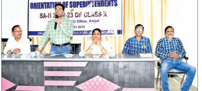
କର୍ମଶାଳାରେ ଉପସ୍ଥିତ ଅଧିକାରୀମାନେ।