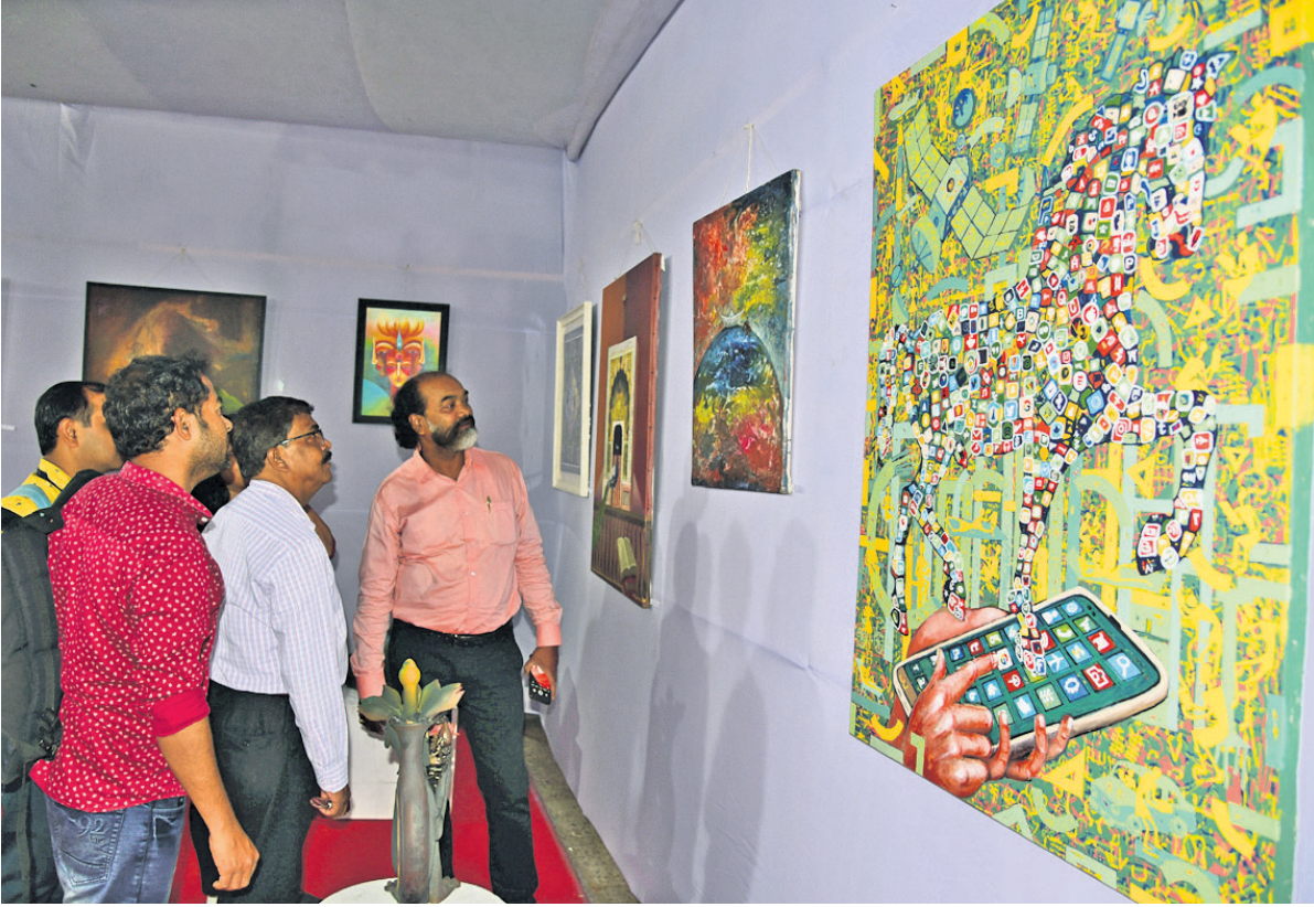
ଭୁବନେଶ୍ୱର ରବୀନ୍ଦ୍ର ମଣ୍ଡପଠାରେ ଶନିବାରଠାରୁ ଆରମ୍ଭ ହୋଇଥିବା କଳାଭୂମି ଫେଷ୍ଟିଭାଲରେ ପ୍ରଦର୍ଶିତ ଚିତ୍ରକଳାକୁ ଦର୍ଶକମାନେ ଦେଖୁଛନ୍ତି।

ଓଡ଼ିଆ ଜଗତମାଳି ଓ ଲୋକଗୀତ - ଫ୍ରେଣ୍ଡସ ପବ୍ଲିଶର୍ସ