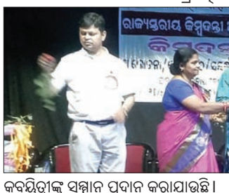
କବୟିତ୍ରୀଙ୍କୁ ସମ୍ମାନ ପ୍ରଦାନ କରାଯାଇଛି।