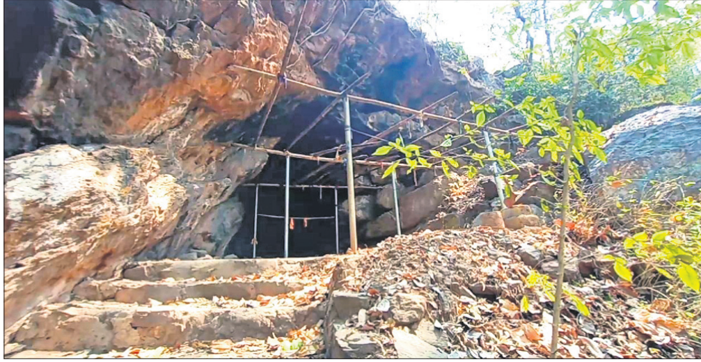
'ନନ୍ଦିନିଆ'ରେ ଥିବା ପ୍ରାଚୀନ ଗୁମ୍ଫା।

ସାତକୋଶିଆ ବ୍ୟାଘ୍ର କରିତରରେ ସାମାଜିକ କାର୍ଯ୍ୟକ୍ରମ ପରେ ପ୍ରାକୃତିକ ସୌନ୍ଦର୍ଯ୍ୟରେ ଭରପୂର୍ଣ୍ଣ 'ନନ୍ଦିନିଆ' ପର୍ଯ୍ୟଟନସ୍ଥଳୀ ମାନ୍ୟତା ବାଦ୍ ପଡ଼ିଛି।