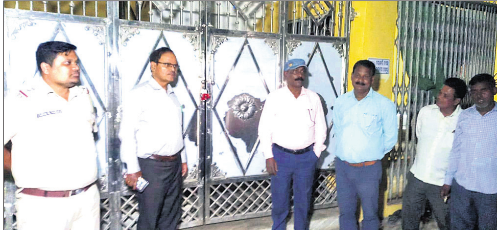
ଦେଶାନ୍ତ ଅଫିସ ପକ୍ଷରୁ ନର୍ସିଂ ହୋମ୍ ସିଲ୍ କରାଯାଇଛି।

ସ୍ୱାସ୍ଥ୍ୟ ଅନୁଷ୍ଠାନ ବିରୋଧରେ ଏଭଳି କାର୍ଯ୍ୟାନୁଷ୍ଠାନ ଗ୍ରହଣ କରାଯାଇଛି। ସୂଚନାଯୋଗ୍ୟ, ପକ୍ଷୀ ନର୍ସିଂ ହୋମ୍ ନାମରେ ପୂର୍ବରୁ ରୋଗୀଙ୍କୁ ଶୋଷଣ କରିବା, ସରକାରୀ ଯୋଜନାରେ ଅର୍ଥ ହତୁପ ଭଳି ଏକାଧିକ ଅଭିଯୋଗ ରହିଥିଲା।