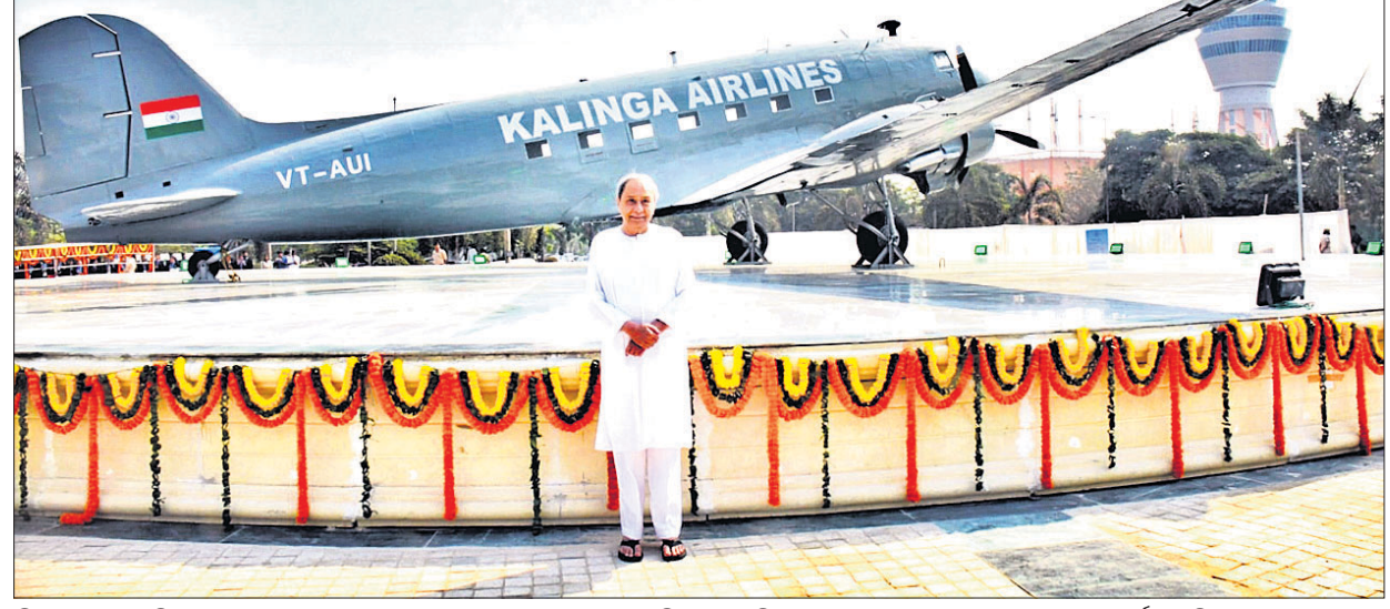
ବିଜୁ ପତ୍ତନାୟକ ବିମାନବନ୍ଦରଠାରେ ଜନସାଧାରଣଙ୍କ ଉଦ୍ଦେଶ୍ୟରେ ଡାକୋଟା ବିମାନକୁ ରବିବାର ମୁଖ୍ୟମନ୍ତ୍ରୀ ନବୀନ ପତ୍ତନାୟକ ଲୋକାର୍ପଣ କରିବା ଅବସରରେ।

ଭୁବନେଶ୍ୱର, ୫ମାର୍ଚ୍ଚ(ବୁଧବେଳା) ସ୍ୱାଧୀନତା ସଂଗ୍ରାମୀ, ଆଧୁନିକ ଓଡ଼ିଶାର ନିର୍ମାତା, ବୃକ୍ଷସାହସୀ ପାଇଲଟ୍ ପ୍ରବାହ ପୁରୁଷ ବିଜୁ ପତ୍ତନାୟକଙ୍କ ଐତିହାସିକ ଡାକୋଟା ବିମାନକୁ ମୁଖ୍ୟମନ୍ତ୍ରୀ ନବୀନ ପତ୍ତନାୟକ