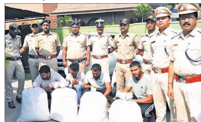
ଜବତ ଗଞ୍ଜେଇ ଓ କାର ଏବଂ ଗିରଫ ଅଭିଯୁକ୍ତ।