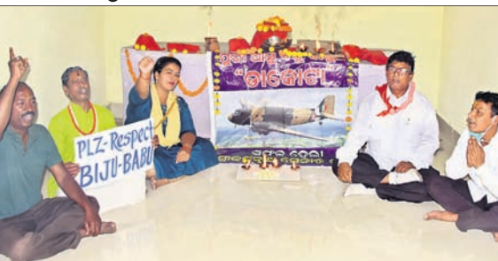
ଶ୍ରୀଜଗନ୍ନାଥ ସେନା ପକ୍ଷରୁ ପୁରୀ ଅର୍ବାନ ହାଟରେ ବିଜୁ ବାବୁଙ୍କ ଅସ୍ଥିକଳସ ପୂଜା କରାଯାଇଛି ।