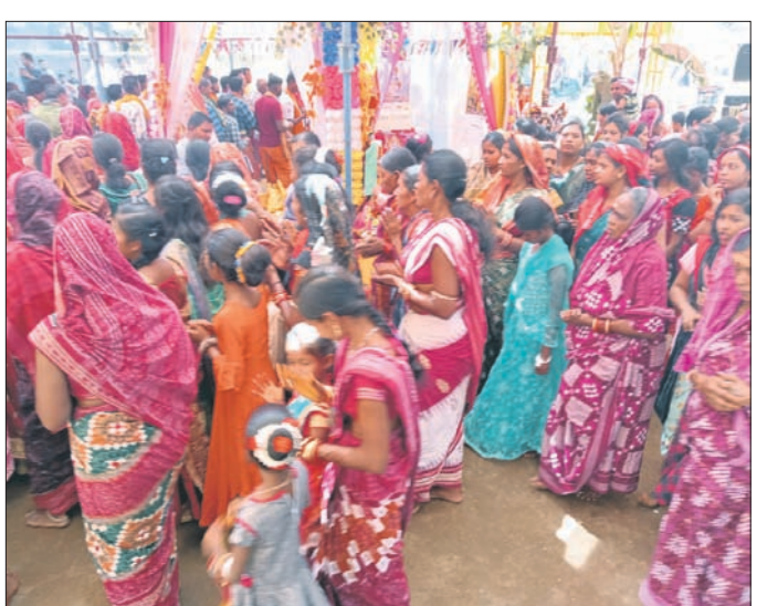
ମୁଖ୍ୟମନ୍ତ୍ରୀଙ୍କ ଶୋହଳ ପ୍ରହର ନାମୟ ଗାଳିଛି।