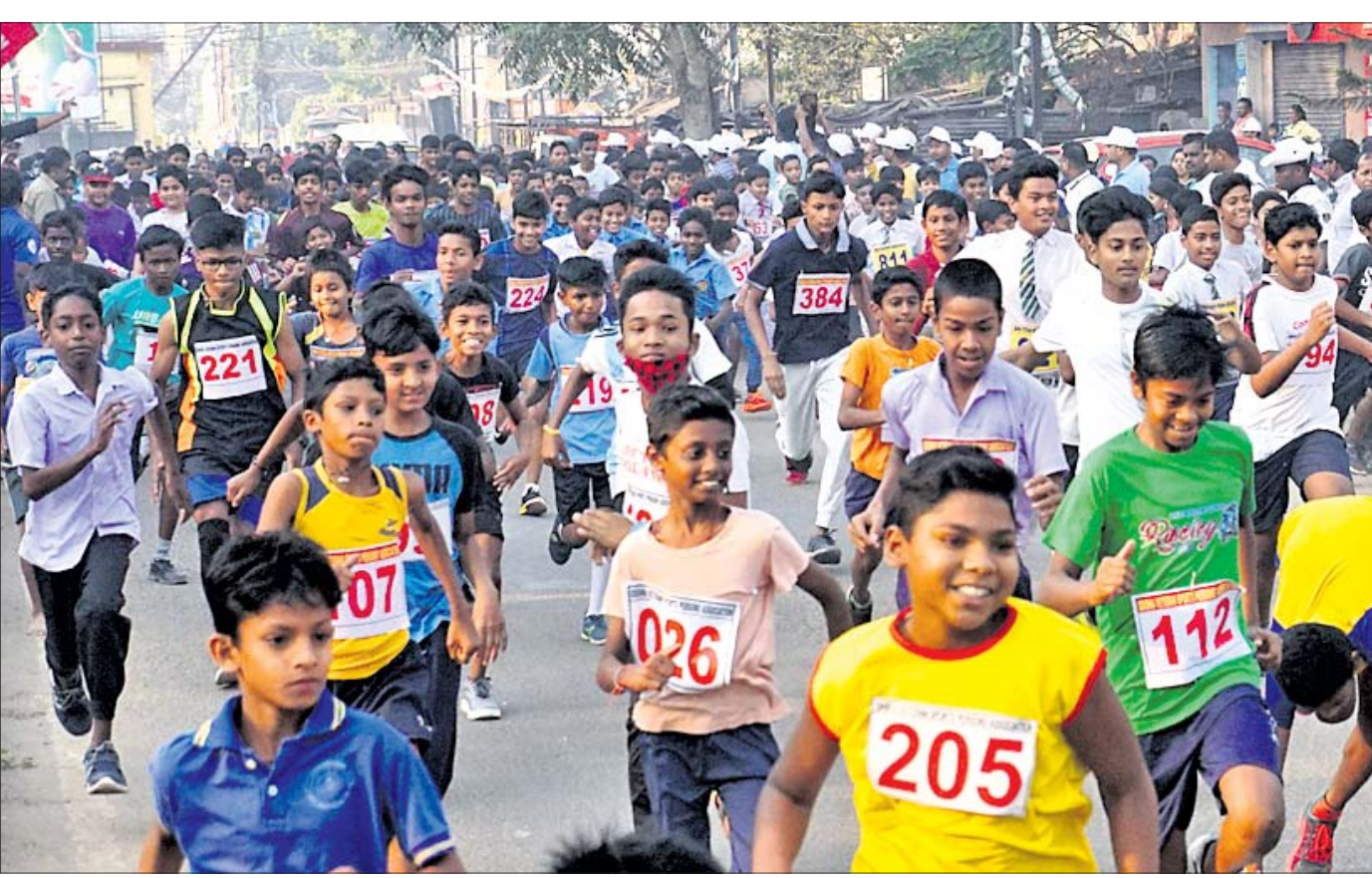
ପ୍ରବାସ ପୁରୁଷ ବିକ୍ରମ ପଟ୍ଟନାୟକଙ୍କ ଜୟନ୍ତୀ ଅବସରରେ ଭେଟେରାନ୍ ସୋର୍ଟ୍ସ ପର୍ସନ୍ସ ଆସୋସିଏସନ ପକ୍ଷରୁ ରବିବାର କଟକ ଆନନ୍ଦ ଭବନ ନିକଟରୁ ବାହାରିଥିବା ଗଣବୌଦ୍ଧରେ ଭାଗ ନେଇଥିବା ପିଲାମାନେ ।