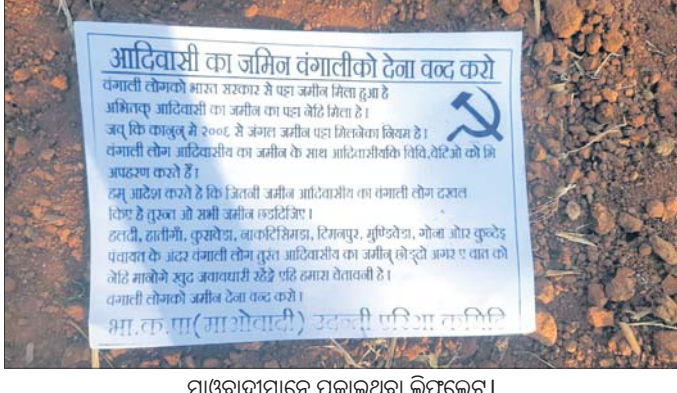
ମାଓବାଦୀମାନେ ପକାଇଥିବା ଲିଫ୍‌ଲେଟ୍ ।

ନବରଙ୍ଗପୁର ଜିଲ୍ଲା ରାଇଘର ବ୍ଲକ୍‌ରେ କିଛିଦିନର ବ୍ୟବଧାନ ପରେ ମାଓବାଦୀମାନେ ପୁଣି ଉପସ୍ଥିତ କାହିଁର କରିଛନ୍ତି । ବ୍ଲକ୍‌ରେ ଚିମନପୁର ଅଞ୍ଚଳରେ ମାଓବାଦୀ ଲିଫ୍‌ଲେଟ୍‌ ପତ୍ରର ବ୍ୟବସ୍ଥାକୁ ମିଳିଛି । ଉଦ୍‌ଗ୍ରୀ ଏରିଆ ମାଓବାଦୀ କମିଟି ଲୋଖାଧିକାରୀ ଏହି ଲିଫ୍‌ଲେଟ୍‌ରେ ବର୍ତ୍ତମାନ ଆଦିବାସୀମାନଙ୍କ ଜମିକୁ ବଜାଜିମାନଙ୍କୁ ଦେବା ବନ୍ଦ କରିବା ପାଇଁ ଉଦ୍‌ଗ୍ରୀ କରାଯାଇଛି । ବଜାଜିମାନଙ୍କୁ ଭାରତ ସରକାରଙ୍କ ତରଫରୁ ପତ୍ତା ଜମି ଦିଆଯାଇଛି । ହେଲେ ୨୦୦୭ରୁ ଆଦିବାସୀମାନଙ୍କୁ ଜମାଳ ଜମି ପତ୍ତା ଦେବା ନିୟମ ରହିଥିଲେ ମଧ୍ୟ ଏ ପର୍ଯ୍ୟନ୍ତ ପ୍ରଦାନ କରାଯାଇନାହିଁ । ବଜାଜିମାନେ ଆଦିବାସୀମାନଙ୍କ ଜମିକୁ ଦଖଲ କରିବା ସହ ସ୍ତ୍ରୀ, ଔଷଧୀନଙ୍କୁ ଅପହରଣ