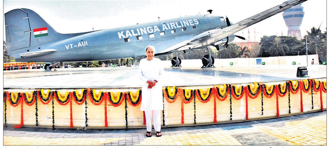
ବିଜୁ ପଟ୍ଟନାୟକ ବିମାନବନ୍ଦରଠାରେ ଜନସାଧାରଣଙ୍କ ଉଦ୍ଦେଶ୍ୟରେ ଡାକୋଟା ବିମାନକୁ ରବିବାର ମୁଖ୍ୟମନ୍ତ୍ରୀ ନବୀନ ପଟ୍ଟନାୟକ ଲୋକାର୍ପଣ କରିବା ଅବସରରେ।

ଭୁବନେଶ୍ୱର, ୫ମାର୍ଚ୍ଚ(ବୁଧବେ) ସ୍ୱାଧୀନତା ସଂଗ୍ରାମୀ, ଆଧୁନିକ ଓଡ଼ିଶାର ନିର୍ମାତା, ବୃକ୍ଷସାହସୀ ପାଇଲଟ୍ ପ୍ରବାଦ ପୁରୁଷ ବିଜୁ ପଟ୍ଟନାୟକଙ୍କ ଐତିହାସିକ ଡାକୋଟା ବିମାନକୁ ମୁଖ୍ୟମନ୍ତ୍ରୀ ନବୀନ ପଟ୍ଟନାୟକ