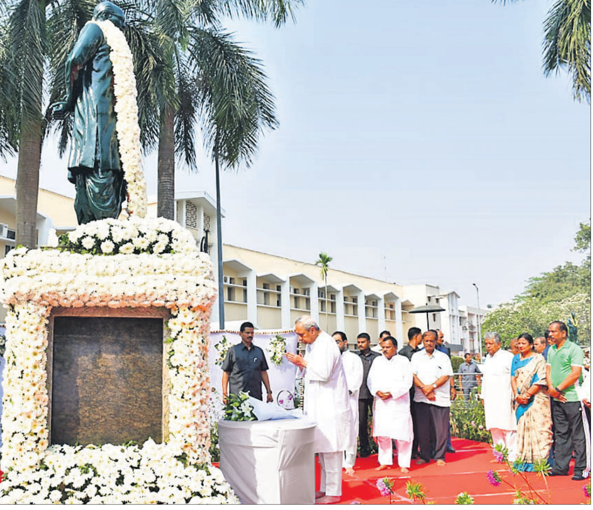
ବିଜୁ କନ୍ଧଡ଼ା ଅବସରରେ ରବିବାର ବିଧାନସଭା ପରିସରରେ ଥିବା ବିଜୁ ପଟ୍ଟନାୟକଙ୍କ ପ୍ରତିମୂର୍ତ୍ତି ନିକଟରେ ମୁଖ୍ୟମନ୍ତ୍ରୀ ନବୀନ ପଟ୍ଟନାୟକ ଶ୍ରଦ୍ଧାଧୁନି ଜ୍ଞାପନ କରୁଛନ୍ତି ।