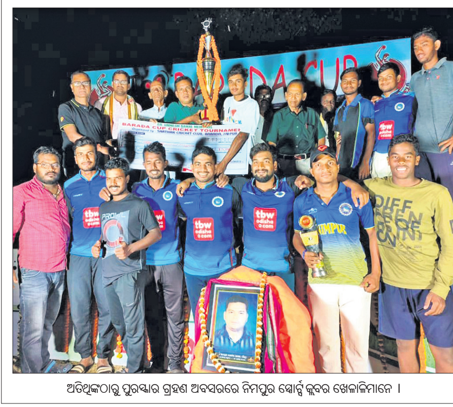
ଅତିଥିକ୍ରମେ ପୁରସ୍କାର ଗ୍ରହଣ ଅବସରରେ ନିମପୁର ଷ୍ଟୋର୍ସ୍ କ୍ଲବର ଖେଳାଳିମାନେ ।