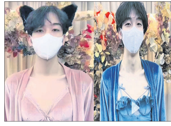
ମହିଳାଙ୍କ ଅନ୍ତଃବସ୍ତ୍ର ପିନ୍ଧିଲେ ପୁରୁଷ ମତେଲ୍

ଚାଇନାରେ ମହିଳା ଅନ୍ତଃବସ୍ତ୍ର ପିନ୍ଧି ଅନୁମୋଦିତ ମତେଲ୍ କରିବା ନିଷିଦ୍ଧ ହେବା ପରେ ଚାଇନା ଏକ ଲାଇଭ୍‌ଷ୍ଟ୍ରିମ୍ ପ୍ରଦର୍ଶନ କମ୍ପାନୀ ଏ କାମରେ ଏବେ ପୁରୁଷଙ୍କୁ ନିୟୋଜିତ କରିଛି। ମହିଳାଙ୍କ ପାଇଁ ଉପଲବ୍ଧ ପୁସ୍-ଅପ ବ୍ରା ଠାଣ୍ଡୁଆରମ୍ଭ କରି ଲେସ୍-ଟ୍ରାନ୍ସ ନାଉଟ୍ ଗାର୍ମେଣ୍ଟ ଓ ସ୍ପୋରଟ୍ସ ପୁରୁଷ ମତେଲ୍‌ମାନେ ପିନ୍ଧିଥିବା ଭିଡିଓ ଏବେ ସୋସିଆଲ୍