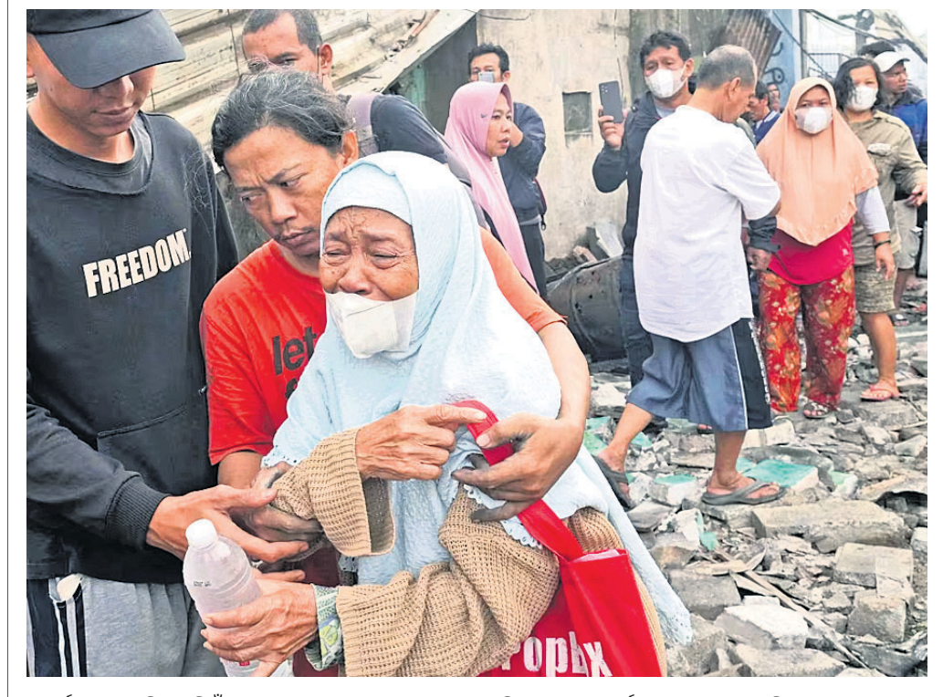
କାକର୍ତ୍ତାର ଲକ୍ଷନ ଡିପୋ ନିଆଁରେ ଘରବୁଡ଼ା ହରାଇ କାହାଣୀକୁ ତାଙ୍କ ସମ୍ପର୍କୀୟ ସାହୁରା ଦେଉଛନ୍ତି।