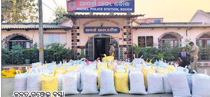
ଜବତ ଗଞ୍ଜେଇ ବସ୍ତୁ ।

ବୌଦ୍ଧ, ୫୩୩(ସ.ପ୍ର.) କଟିପତା ଥାନା ଅଧିକାରୀ ମାଧ୍ୟମରେ ନାଏକ ସୂଚନା ଦେଇଛନ୍ତି । ଘଟଣାର ୨୪ ଘଣ୍ଟା ବିତିଥିଲେ ହେଁ ଏହି ମାମଲାରେ ପୋଲିସ୍ କାହାରିକୁ ଗିରଫ କରିନାହିଁ । ସୂଚନାଯୋଗ୍ୟ, ବୌଦ୍ଧ ଜିଲ୍ଲା ଗଞ୍ଜେଇ ଗାଞ୍ଜ ଓ କାରବାରର ପୋଷ୍ଟମୁକ୍ତୀ ପାଇଛି । ଜିଲ୍ଲା ପ୍ରଶାସନ ପାଇଁ ବୌଦ୍ଧ ପୋଲିସ୍ ଶନିବାର ଉକ୍ତ ଜଙ୍ଗଲରେ ଚଢ଼ାଉ କରିଥିଲା । ଚଢ଼ାଉ ବେଳେ ଗଞ୍ଜେଇ ଭର୍ତ୍ତି ୧୭ଗାଡ଼ି ଜବତହୁଏ ଜବତ ହୋଇଥିଲା । ଜବତ ଗଞ୍ଜେଇ ବୌଦ୍ଧ ଥାନାରେ ରଖାଯାଇଛି । ଏନେଇ ବୌଦ୍ଧ ଥାନାରେ ନଂ. ୧୨୫/୨୩ ରେ ଏକ ମାମଲା ରୁଜୁ କରି ପୋଲିସ୍ ତଦନ୍ତ ଆରମ୍ଭ