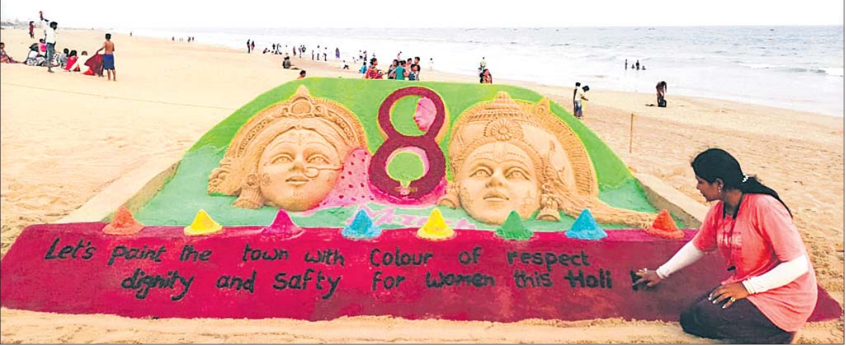
ହୋଲି ପର୍ବକୁ ପୁରସ୍କୃତ ଭାବେ ତଥା ପ୍ରାକୃତିକ ରଙ୍ଗରେ ଖେଳିବା ପାଇଁ ରବିବାର କୋଣାର୍କର ଚନ୍ଦ୍ରଭାଗା ସମୁଦାୟରେ ଶିଳ୍ପୀ ସରିତା ଗୋଲ୍ଲାୟତ ବାଲୁକା କଳା ମାଧ୍ୟମରେ ସତେଜତା ବାଣୀ ଦେଖିଛନ୍ତି ।