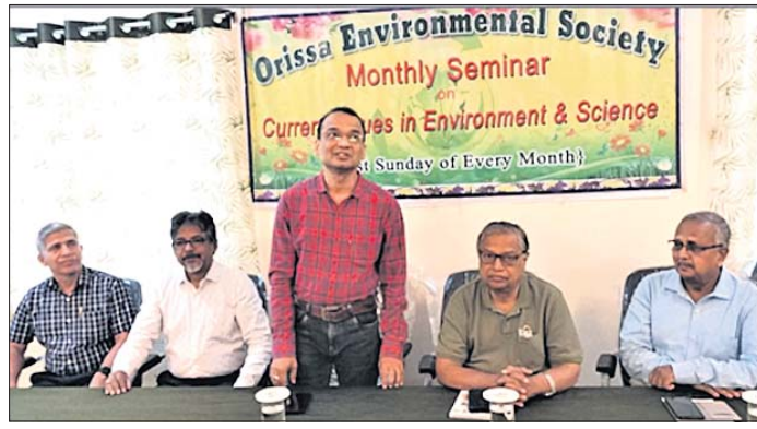
ଆଲୋଚନାଚକ୍ରରେ ଯୋଗ ଦେଇଥିବା ଅତିଥିମାନେ ।

ଆଧୁନିକ ଜୀବନଶୈଳୀର ଦୈନିକ କାର୍ଯ୍ୟରେ ପ୍ଲାଷ୍ଟିକ ପଦାର୍ଥ ବହୁଳ ବ୍ୟବହାର ହେଉଛି । ମାତ୍ର ଏସବୁ ପଦାର୍ଥ ନିର୍ଦ୍ଦୋଷ ଭାବେ ପ୍ରତି ସାଧାରଣ ଲୋକେ ବିଶେଷ ଅବଗତ ନ ଥିବାରୁ ସଚେତନତା ବୃଦ୍ଧିର ଯଥେଷ୍ଟ ଆବଶ୍ୟକତା ରହିଛି । ଅଣୋଧିକ ଟେକ୍, ପ୍ରାକୃତିକ ଗ୍ୟାସ୍ କିମ୍ବା କୋଇଲା ପରି ଜୀବାଣୁ ଲବଣରୁ ସଂଶ୍ଳେଷିତ ପ୍ଲାଷ୍ଟିକ ଉତ୍ପାଦିତ ହେଉଥିବାରୁ ଏହାର ପ୍ରସ୍ତୁତି ଓ ବିତରଣରେ ଅଜ୍ଞାନମାନଙ୍କୁ ଏବଂ ମିଥେନ ପରି ସବୁଜଗୃହ ବାଷ୍ପ ନିର୍ଗମନ ହୋଇ ବିଶ୍ୱ ତାପମାତ୍ରା ବୃଦ୍ଧିର କାରଣ ହେଉଛି । ସେହିପରି ବ୍ୟବହାର ପରେ ପରିବେଶକୁ ବର୍ଷା ଭୂପେ ନିଷ୍କାସିତ ହେଉଥିବାରୁ ଏହା ପ୍ରଚୁର ପରିଷ୍କାର ବିଭିନ୍ନ ସମସ୍ୟା ସୃଷ୍ଟି କରୁଛି । ତେଣୁ ଏଥିରୁ ବୃତ୍ତେଇ ରହିବା ଆବଶ୍ୟକ । ତେଣୁ ଏହି ପ୍ଲାଷ୍ଟିକ ବିପଦରୁ ରକ୍ଷା କରିବା ଜୈବ ପ୍ଲାଷ୍ଟିକର ବ୍ୟବହାର କରିବାକୁ ପ୍ରକଳ୍ପ ସୃଷ୍ଟି ପ୍ଲାଷ୍ଟିକ ନିର୍ବାକରଣ ଯୋଗ୍ୟ ପଦାର୍ଥକୁ ଆସିଆସି, ଯାହା ମୁଖ୍ୟତଃ ଉଦ୍ଭିଦଜାତିରୁ ଏସବୁ ପ୍ଲାଷ୍ଟିକ ବିପଦରୁ ରକ୍ଷା କରିବ ଜୈବପ୍ଲାଷ୍ଟିକ