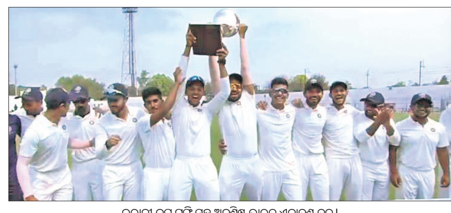
ଭାରତୀୟ କ୍ରିକେଟ୍ ସଂଘର ଅଧିକାରୀଙ୍କ ସହିତ ଉତ୍ତମ ଟ୍ୟାଲେଣ୍ଟ୍‌ସ୍ ଦଳ ।