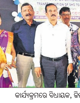
କାର୍ଯ୍ୟକ୍ରମରେ ବିଧାୟକ, ଜିଲ୍ଲାପାଳଙ୍କ ସମେତ ଅନ୍ୟମାନେ।

ବୋଲି କହିଥିଲେ। ଏହି ଅବସରରେ ବିଭିନ୍ନ ବ୍ଲକ୍ ୬୫ ଉଦ୍ୟୋଗୀଙ୍କ ଉଦ୍‌ଘାଟିତ ସାମଗ୍ରୀ ପ୍ରଦର୍ଶନ କରାଯାଇଛି। ଏସ୍ଏସ୍‌ଜି ସ୍ୱାରା ପ୍ରସ୍ତୁତ ଖାଦ୍ୟ ଓ ଗୃହ ଉପକରଣ ସାମଗ୍ରୀ ବିକ୍ରୟ କରାଯାଇଛି। ପ୍ରଦର୍ଶନୀ ଆସନ୍ତା ୯ ଚାରିଶ ଯାଏ ଚାଲିବ। ଏହି ଅବସରରେ ଜିଲ୍ଲାର ୮ ବ୍ଲକ୍‌ରେ ଏସ୍ଏସ୍‌ଜିକୁ ସମର୍ଥନ କରାଯାଇଥିଲା। ଜିଲ୍ଲା ଶିଳ୍ପକେନ୍ଦ୍ର ସାଧାରଣ ପରିଚାଳକ ପି. ପ୍ରଭାକର ରାଓ ଧନ୍ୟବାଦ ଦେଇଥିଲେ।