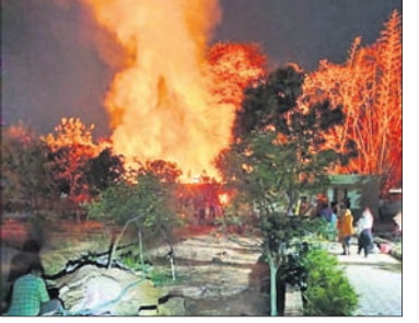
ପରେ ବୁଲି ଉପରେ କାଠ ଶୁଖି ଯାଇଥିଲା। ରାତିରେ ବୁଲି ନିଆଁ କାଠରେ ସଂଯୋଗ ହୋଇଥିଲା।

ପାଟଣା, ୫୩୩(ସ.ପ୍ର.) କେନ୍ଦ୍ରରେ ଜିଲ୍ଲା ପାଟଣା ବ୍ଲକ୍ ରାଜନଗରସ୍ଥିତ ସରକାରୀ ଉଚ୍ଚ ବିଦ୍ୟାଳୟରେ ଶନିବାର ବିଳମ୍ବିତ ରାତିରେ ଅଗ୍ନିକାଣ୍ଡ ଘଟିଛି। ଏଥିରେ କାଠବେଞ୍ଚ ପୋଡ଼ି ନଷ୍ଟ ହୋଇଯାଇଛି। ଏଥିସହ ଷ୍ଟୋରରେ ଥିବା ରୋଷେଇ ସାମଗ୍ରୀ ଓ ମାଙ୍କଡ଼ ଏମିତିଏମ୍ ରାଶନ ପୋଡ଼ି ପାଉଁଶ ହୋଇଯାଇଛି।