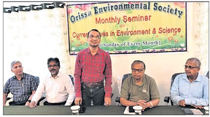
ଆଲୋଚନାଚକ୍ରରେ ଯୋଗ ଦେଇଥିବା ଅତିଥିମାନେ ।

ଆଧୁନିକ ଜୀବନଶୈଳୀର ଦୈନିକ କାର୍ଯ୍ୟରେ ପ୍ଲାଷ୍ଟିକ ପଦାର୍ଥ ବହୁଳ ବ୍ୟବହାର ହେଉଛି। ମାତ୍ର ଏସବୁ ପଦାର୍ଥ ନିକାରାତ୍ମକ ଭାବେ ପ୍ରତି ସାଧାରଣ ଲୋକେ ବିଶେଷ ଅବଗତ ନ ଥିବାରୁ ସେତେବେଳେ ବୃଦ୍ଧିର ଯଥେଷ୍ଟ ଆବଶ୍ୟକତା ରହିଛି। ଅଶୋଧିତ ଟେକ, ପ୍ରାକୃତିକ ଗ୍ୟାସ କିମ୍ବା କୋଇଲା ପରି ଜୀବାଣୁ ଲାଭନୀୟ ସଂଶ୍ଳେଷିତ ପ୍ଲାଷ୍ଟିକ ଉତ୍ପାଦିତ ହେଉଥିବାରୁ ଏହାର ପ୍ରସ୍ତୁତି ଓ ବିକାଶରେ ଅଞ୍ଚଳରାଜ୍ୟ ଏବଂ ମିଥେନ ପରି ସବୁଜଗୃହ ବାସ୍ତୁ ନିର୍ମାଣ ହୋଇ ବିଶ୍ୱ ଡାପମାତ୍ରା ବୃଦ୍ଧିର କାରଣ ହେଉଛି। ସେହିପରି ବ୍ୟବହାର ପରେ ପରିବେଶକୁ ବର୍ଷା ଭୂପେ ନିଷ୍କାସିତ ହେଉଥିବାରୁ ଏହା ପ୍ରଦୂଷଣ ଘଟାଇ ବିଭିନ୍ନ ସମସ୍ୟା ସୃଷ୍ଟି କରୁଛି। ତେଣୁ ଏଥିରୁ ଦୂରରେ ରହିବା ଆବଶ୍ୟକ। ତେଣୁ ଏହି ପ୍ଲାଷ୍ଟିକ ବିପଦରୁ ରକ୍ଷା କରିବା ଜୈବ ପ୍ଲାଷ୍ଟିକର ଗୁରୁତ୍ୱ ବଢ଼ିଛି। ଜୈବିକ ଉତ୍ପାଦ ସୃଷ୍ଟି ପ୍ଲାଷ୍ଟିକ ନିର୍ମାଣରେ ଯୋଗ୍ୟ ପଦାର୍ଥରୁ ଆସିଥାଏ, ଯାହା ମୁଖ୍ୟତଃ ଉଦ୍ଭିଦଜାତି। ଏସବୁ