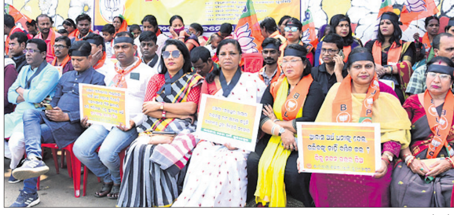
ଭୁବନେଶ୍ୱର କଳ୍ପନା ଛକ ନିକଟ ମ୍ୟୁଜିୟମ୍ ଷୋରାୟ ନିକଟରେ ରବିବାର ଧାରଣାରେ ବସିଥିବା ଭାଙ୍ଗପା ନେତା ଓ କର୍ମଚାରୀ।

ଭୁବନେଶ୍ୱର, ୫ମା (ବୁଧବେଳା) ଭାଙ୍ଗପା ପଞ୍ଚମ ବୃତ୍ତର ୩୧୪ ବୁକରେ ହାତରେ କଳାପତି ବାହି ଭାଙ୍ଗପା କର୍ମୀମାନେ ବିରୋଧ ପ୍ରଦର୍ଶନ କରିବାକୁ ଦେଖିବାକୁ ମିଳିଛି। ଦଳ ପକ୍ଷରୁ କୁହାଯାଇଛି ଯେ, ପଞ୍ଚମ ବୃତ୍ତର ଭାଙ୍ଗପା କର୍ମୀମାନେ ବିରୋଧ ପ୍ରଦର୍ଶନ କରିବାରେ ଉତ୍ସାହୀ ହୋଇଛନ୍ତି। ଭାଙ୍ଗପା କର୍ମୀମାନେ ବିରୋଧ ପ୍ରଦର୍ଶନ କରିବାରେ ଉତ୍ସାହୀ ହୋଇଛନ୍ତି। ଭାଙ୍ଗପା କର୍ମୀମାନେ ବିରୋଧ ପ୍ରଦର୍ଶନ କରିବାରେ ଉତ୍ସାହୀ ହୋଇଛନ୍ତି। ଭାଙ୍ଗପା କର୍ମୀମାନେ ବିରୋଧ ପ୍ରଦର୍ଶନ କରିବାରେ ଉତ୍ସାହୀ ହୋଇଛନ୍ତି।