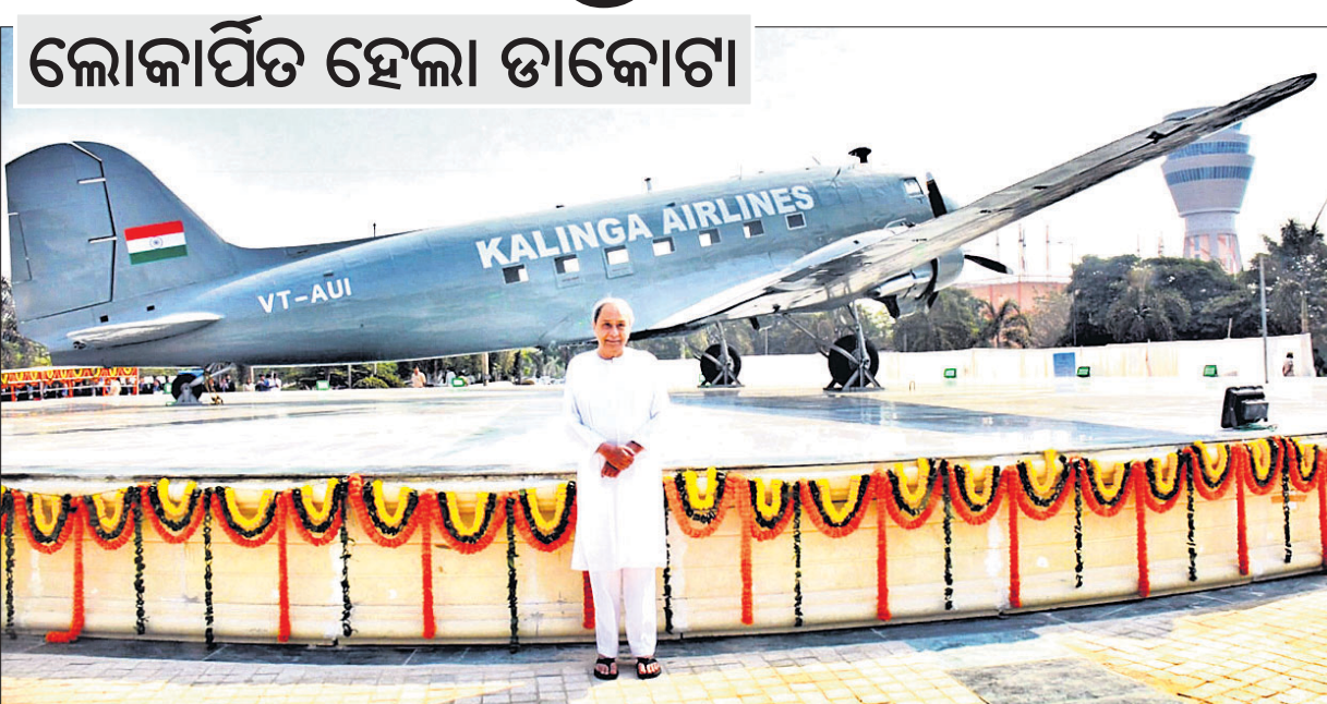
ଲୋକାର୍ପିତ ହେଲା ଡାକୋଟା

ବିଜୁ ପଟ୍ଟନାୟକ ବିମାନବନ୍ଦରଠାରେ ଜନସାଧାରଣଙ୍କ ଉଦ୍ଦେଶ୍ୟରେ ଡାକୋଟା ବିମାନକୁ ଉଦ୍ଦେଶ୍ୟରେ ମୁଖ୍ୟମନ୍ତ୍ରୀ ନବୀନ ପଟ୍ଟନାୟକ ଲୋକାର୍ପଣ କରିବା ଅବସରରେ। ଭୁବନେଶ୍ୱର, ୫ମାର୍ଚ୍ଚ(ଭୁଂସୋ) ସାଧାରଣ ସଂସ୍ଥାମାନ, ଆଧୁନିକ ଓଡ଼ିଶାର ନିର୍ମାତା, ଦୁଃସାହସୀ ପାଇଲଟ୍ ପ୍ରଦାତା ପୁରୁଷ ବିଜୁ ପଟ୍ଟନାୟକଙ୍କ ଐତିହାସିକ ଡାକୋଟା ବିମାନକୁ ମୁଖ୍ୟମନ୍ତ୍ରୀ ନବୀନ ପଟ୍ଟନାୟକ ଲୋକାର୍ପଣ କରିବା ଅବସରରେ।