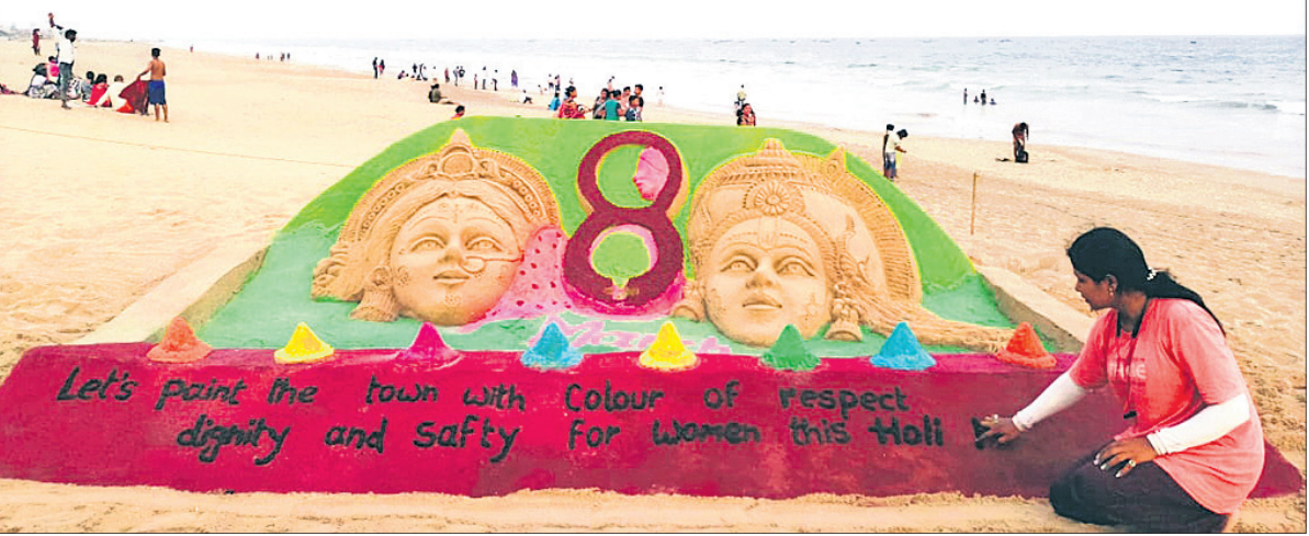
ହୋଲି ପର୍ବକୁ ପୁରସ୍କୃତ ଭାବେ ତଥା ପ୍ରାକୃତିକ ରଙ୍ଗରେ ଖେଳିବା ପାଇଁ ରବିବାର କୋଣାର୍କର ଚନ୍ଦ୍ରଭାଗା ସମୁଦ୍ରକୂଳରେ ଶିଳ୍ପୀ ସରିତା ଗୋଲାୟତ ବାଲୁକା କଳା ମାଧ୍ୟମରେ ସେତେନଟା ବାଲି ଦେଖାଇଛନ୍ତି।