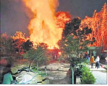
ପରେ ବୁଲି ଉପରେ କାଠ ଶୁଖା ଯାଇଥିଲା। ରାତିରେ ବୁଲି ନିଆଁ କାଠରେ ସଂଯୋଗ