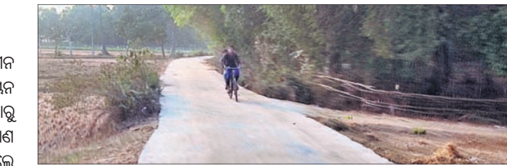
ପୁନଃନିର୍ମାଣ ହୋଇଥିବା କଂକ୍ରିଟ୍ ଆଠାରୁ ରାସ୍ତା।

ବାଲେଶ୍ୱର ଜିଲ୍ଲା ଖରୋ ବ୍ଲକ୍ ଅଧୀନ ମହତାପୁର- ଗୋଳିଆ ଗ୍ରାମ୍ୟ ଉନ୍ନୟନ ବିଭାଗ ରାସ୍ତାର କଂକ୍ରିଟ୍ ଆଠାରୁ ପଡ଼ିରାଜପୁର ପର୍ଯ୍ୟନ୍ତ ରାସ୍ତା ନିର୍ମାଣ ନିକଟରେ ଶେଷ ହୋଇଛି। ହେଲେ ପଡ଼ିରାଜପୁର ବୋକ ମେଳନକୁ ଦୃଷ୍ଟିରେ ନ ରଖିବେପରୁଆ ଭାବେ ଅଣାଓସାରିଆ ରାସ୍ତା ନିର୍ମାଣ ଯୋଗୁ ଯାତ୍ରୀମାନେ ଦୁର୍ଘଟଣାର ସମ୍ମୁଖୀନ ହେବା ନେଇ ଯଥେଷ୍ଟ ସମ୍ଭାବନା ଦେଖା ଦେଇଛି। ଆସନ୍ନ ବିପଦକୁ ନେଇ ଯାତ୍ରୀମାନଙ୍କ ଚିନ୍ତା ବଢ଼ିବାରେ ଲାଗିଛି। ଉକ୍ତ ରାସ୍ତାଟି ପ୍ରସିଦ୍ଧ ପଡ଼ିରାଜପୁର ବୋକମେଳନ ପଡ଼ିଆକୁ ସଂଯୋଗ କରୁଛି। ପ୍ରତ୍ୟେକ ବର୍ଷ ପାଳଗୁନ ପୂର୍ଣ୍ଣିମାଠାରୁ