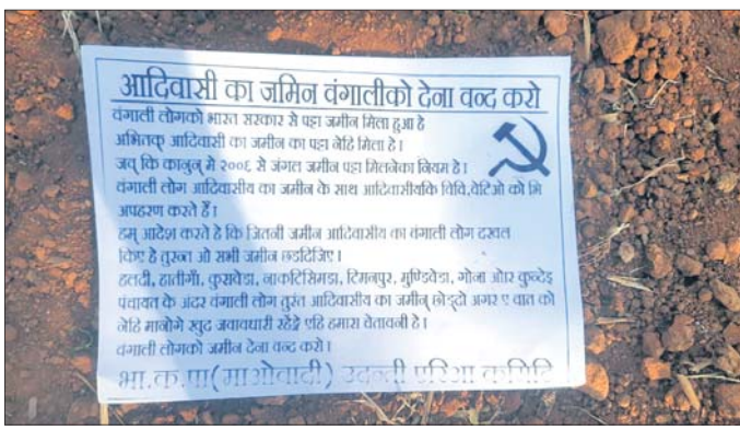
ମାଓବାଦୀମାନେ ପକାଇଥିବା ଲିଫ୍‌ଲେଟ୍।

ନବରଙ୍ଗପୁର ଜିଲ୍ଲା ରାଇଘର ବ୍ଲକ୍‌ରେ କିଛିଦିନର ବ୍ୟବଧାନ ପରେ ମାଓବାଦୀମାନେ ପୁଣି ଉପସ୍ଥିତ କାହିଁର କରିଛନ୍ତି। ବ୍ଲକ୍‌ର ଟିମନପୁର ଅଞ୍ଚଳରେ ମାଓବାଦୀ ଲିଫ୍‌ଲେଟ୍‌ ପତ୍ରଟିଏ ଦେଖିବାକୁ ମିଳିଛି। ଉଦନ୍ତା ଏରିଆ ମାଓବାଦୀ କମିଟି ଲେଖାଥିବା ଏହି ଲିଫ୍‌ଲେଟ୍‌ରେ ବର୍ତ୍ତମାନ ଆଦିବାସୀମାନଙ୍କ ଜମିକୁ ବଜାରିବାକୁ ଦେବା ବନ୍ଦ କରିବା ପାଇଁ ଉଲ୍ଲେଖ କରାଯାଇଛି। ବଜାରିବାକୁ ଭାରତ ସରକାରଙ୍କ ତରଫରୁ ପତ୍ତା ଜମି ଦିଆଯାଇଛି। ହେଲେ ୨୦୦୭ରୁ ଆଦିବାସୀମାନଙ୍କୁ ଜଙ୍ଗଲ ଜମି ପତ୍ତା ଦେବା ନିୟମ ରହିଥିଲେ ମଧ୍ୟ ଏ ପର୍ଯ୍ୟନ୍ତ ପ୍ରଦାନ କରାଯାଇନାହିଁ। ବଜାରିବାରେ ଆଦିବାସୀମାନଙ୍କ ଜମିକୁ ଦଖଲ କରିବା ସହ ସ୍ତ୍ରୀ, ଔଷଧୀନଙ୍କୁ ଅପହରଣ