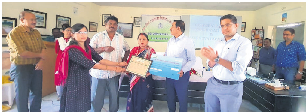
ଉତ୍ତର ଓଡ଼ିଶା କାର୍ଯ୍ୟ ପାଇଁ ଜଣେ ଜନ ପ୍ରତିନିଧିଙ୍କୁ ପୁରସ୍କୃତ କରାଯାଇଛି।