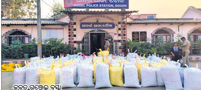
ଜବତ ଗଞ୍ଜେଇ ବସ୍ତୁ।

ବୌଦ୍ଧ, ୫୩୩(ସ.ପ୍ର.) କଟିଥିବା ଥାନା ଅଧିକାରୀ ମାଧ୍ୟମରେ ନାଏକ ସୂଚନା ଦେଇଛନ୍ତି। ଘଟଣାର ୨୪ ଘଣ୍ଟା ବିତ୍ତେଇ ହେଁ ଏହି ମାମଲାରେ ପୋଲିସ୍ କାହାରିକୁ ଗିରଫ କରିନାହିଁ। ସୂଚନାଯୋଗ୍ୟ, ବୌଦ୍ଧ ଜିଲ୍ଲା ଗଞ୍ଜେଇ ଗଞ୍ଜ ଓ କାରବାରର ଯାଇଥିବା କୋଣାର୍କ ବିଶ୍ୱପୁର ଖବର ପାଇ ବୌଦ୍ଧ ପୋଲିସ୍ ଶନିବାର ଉଚ୍ଚ ଜଙ୍ଗଲରେ ଚଢ଼ାଇ କରିଥିଲା। ଚଢ଼ାଇ ବେଳେ ଗଞ୍ଜେଇ ଭର୍ତ୍ତି ୧୭ଗାଡ଼ି ଜରିତସ୍ତ୍ରୀ ଜବତ ହୋଇଥିଲା। ଜବତ ଗଞ୍ଜେଇ ବୌଦ୍ଧ ଥାନାରେ ରଖାଯାଇଛି। ଏନେଇ ବୌଦ୍ଧ ଥାନାରେ ନଂ. ୧୨୫/୨୩ ରେ ଏକ ମାମଲା ରୁଜୁ କରି ପୋଲିସ୍ ତଦନ୍ତ ଆରମ୍ଭ