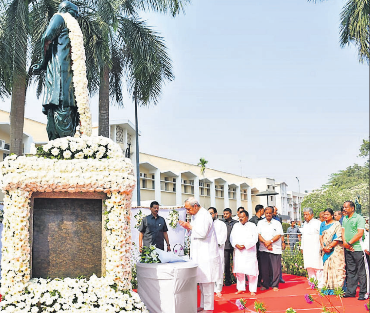
ବିଜୁ କନ୍ଧଟା ଅବସରରେ ରବିବାର ବିଧାନସଭା ପରିସରରେ ଥିବା ବିଜୁ ପଟ୍ଟନାୟକଙ୍କ ପ୍ରତିମୂର୍ତ୍ତି ନିକଟରେ ପୁଖ୍ୟମନ୍ତ୍ରୀ ନବୀନ ପଟ୍ଟନାୟକ ଶ୍ରଦ୍ଧାପୁନଃ ଖାପନ କରୁଛନ୍ତି ।