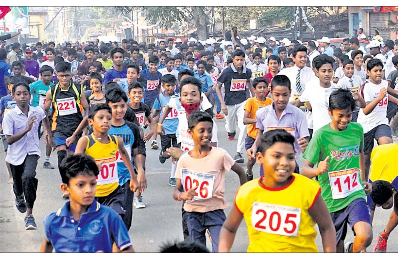
ପ୍ରବାସ ପୁରୁଷ ବିକ୍ର ପଟ୍ଟନାୟକଙ୍କ ଜୟନ୍ତୀ ଅବସରରେ ଭେଟେରାନ୍ ସୋର୍ଟ୍‌ସ୍‌ପର୍ଟ୍ ଆସୋସିଏସନ୍ ପକ୍ଷରୁ ରବିବାର କଟକ ଆନନ୍ଦ ଭବନ ନିକଟରୁ ବାହାରିଥିବା ଗଣବୌଦ୍ଧରେ ଭାଗ ନେଇଥିବା ପିଲାମାନେ।

ହୋଇ କଳିବାକୁ ଲାଗିଥିଲା। ନିଆଁର ପ୍ରକୋପ ଏତେ ମାତ୍ରରେ ଥିଲା ଗାଁ ପୁଅ ଉଚ୍ଚରେ ଝୁଲି ଉପରକୁ ଉଠିଥିଲା। ଗ୍ଲାନାୟ ଲୋକେ ଅଗ୍ନିଶମ ବିଭାଗକୁ ଖବର ଦେଇଥିଲେ। ପାଟଣା ଅଗ୍ନିଶମ କର୍ମଚାରୀ ପହଞ୍ଚିବା ନିଆଁକୁ ଆୟତ୍ତ କଲାବେଳକୁ ବିଦ୍ୟାଳୟର ଷ୍ଟୋର ରୁମ୍‌ରେ ଥିବା ସମସ୍ତ ବେଞ୍ଚ, ବିଦ୍ୟାଳୟ ପରିସରକୁ କଟାଯାଇ ରଖା ଯାଇଥିବା ଗଛ ଗଣ୍ଡି, ରୋଷେଇ ପାଇଁ ମହକୁସ ମାଙ୍କଡ଼ ସାମଗ୍ରୀ କଳି ଧୁସ ହୋଇଯାଇଥିଲା। ତେବେ ଅନ୍ୟ ରୁମ୍‌କୁ ନିଆଁ ଟେକିବା ପୂର୍ବରୁ ଅଗ୍ନିଶମ ବାହିନୀ ନିଆଁକୁ ଆୟତ୍ତ କରିବାକୁ ସଫଳ ହୋଇଥିଲେ।