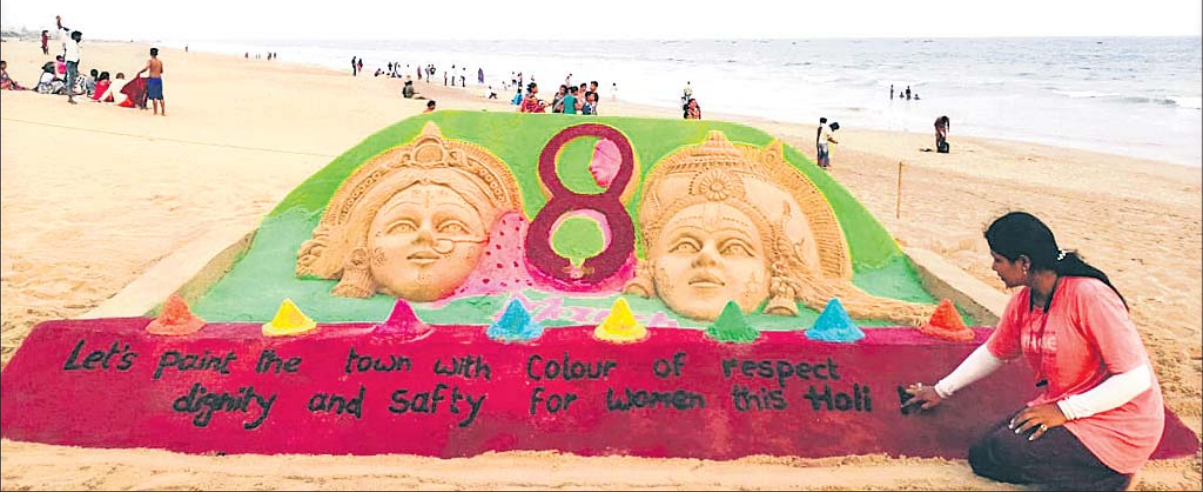
ହୋଲି ପର୍ବକୁ ପୁରସ୍କୃତ ଭାବେ ତଥା ପ୍ରାକୃତିକ ରଙ୍ଗରେ ଖେଳିବା ପାଇଁ ରବିବାର କୋଣାର୍କର ଚନ୍ଦ୍ରଭାଗା ସମୁଦ୍ରକୂଳରେ ଶିଳ୍ପୀ ସରିତା ଗୋଲାୟତ ବାଲୁକା କଳା ମାଧ୍ୟମରେ ସତେଜତା ବାଣୀ ଦେଖିଛନ୍ତି।