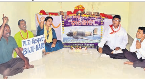
ଶ୍ରୀଜଗନ୍ନାଥ ସେନା ପକ୍ଷରୁ ପୁରୀ ଅର୍ଦ୍ଧନ ହାଟରେ ବିଜୁ ବାବୁଙ୍କ ଅସ୍ଥିକଳସ ପୂଜା କରାଯାଇଛି ।