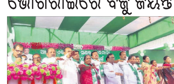
ଦଳୀୟ ନେତା ଓ କର୍ମୀ ଶପଥ ନେଉଛନ୍ତି।