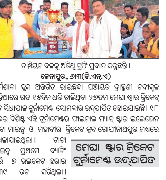
ଟାଟା ମାଇନ୍ସ ଚାମ୍ପିୟନ ଉପରେ ପ୍ରଦାନ କରାଯାଇଥିବା ମୂର୍ତ୍ତି । ଧର୍ମଶାଳା, ୬ମାର୍ଚ୍ଚ(ଡି.ଏନ.ଏ.)