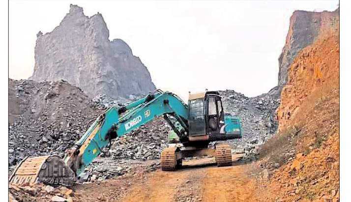
ବିଛାଖଣ୍ଡରୁ କଳାପଥର ଖନନ ଚାଲିଛି ।

ନିୟନ୍ତ୍ରଣ ହେବ ଲଘୁ ଖଣିଜ ଦ୍ରବ୍ୟ ଲୁଚୁ । ସେ ଆଇନ ଉଲ୍ଲଙ୍ଘନକାରୀକ ବିରୋଧରେ ଆପରାଧିକ ମାମଲା ଗୁରୁତ୍ୱ ସହ ଚଳାଉଛନ୍ତି ଅର୍ଥ ଶାସନ ବିଭାଗ ।