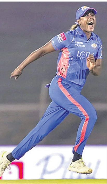
ପ୍ରେମର ଅଫ୍ ଦି ମ୍ୟାଚ୍ ହିଲି ମାଥ୍ୟୁସ।