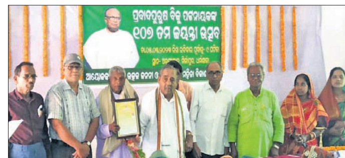
ବିଜୁବାବୁଙ୍କ ଜନ୍ମଦିନ ସମ୍ମାନେ ମଞ୍ଚାସୀନ ଅଟନ୍ତି । ଧର୍ମଶାଳା, ୬ମାର୍ଚ୍ଚ(ଡି.ଏନ.ଏ.)

ବିଜୁ ପଞ୍ଚନାୟକଙ୍କ ଜନ୍ମଦିନ ୭ ସେପ୍ଟେମ୍ବର ୨୦୨୩ରେ ପୂର୍ଣ୍ଣ ହେଉଛି । ବିଜୁ ପଞ୍ଚନାୟକଙ୍କ ଜନ୍ମଘର ଉତ୍କଳ ଚଳଚ୍ଚିତ୍ର ନିର୍ଦ୍ଦେଶନା ପାଇଁ ଅଧିକାଂଶ ସମୟ ଉତ୍କଳ ଜନନୀ ଅନୁଷ୍ଠାନ ପକ୍ଷରୁ ଅଭିଯୋଗ ହୋଇଥିଲା ।