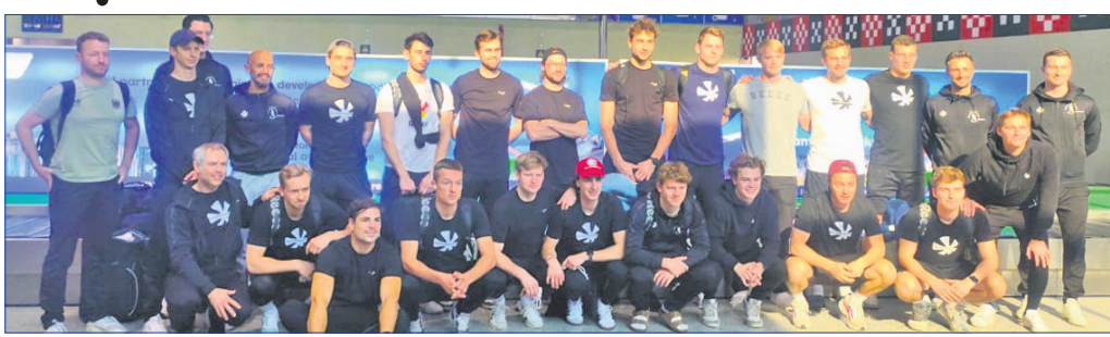
ରାଉରକେଲାରେ ପହଞ୍ଚିଲା ଜର୍ମାନୀ ହକି ଦଳ।

ରାଉରକେଲା ଅର୍ପିଏ /ଭୁବନେଶ୍ୱର (ସ୍ପୋର୍ଟ୍ସ ଡେସ୍କ) ୬ମାର୍ଚ୍ଚ: ଏପ୍ଟାଇଭର୍ ଗ୍ରୁପ୍-୩ରେ ଓଡ଼ିଶା ପହଞ୍ଚିଲା ହକି ଦଳ। ଭାରତ, ଅଷ୍ଟ୍ରେଲିଆ ଓ ଜର୍ମାନୀ ମଧ୍ୟରେ ୬ ମ୍ୟାଚ ଖେଳାଯିବାକୁ ଥିବା ବେଳେ ସମସ୍ତ ମ୍ୟାଚ୍ ବିରା ଓଡ଼ିଶା ହକି ଟିମ୍‌ରେ ଅନୁଷ୍ଠିତ ହେବ। ଭୁବନେଶ୍ୱର-ରାଉରକେଲାରେ ଅନୁଷ୍ଠିତ ହେବାର ପ୍ରଥମ ମ୍ୟାଚ୍ ଓଡ଼ିଶା ଅଜିତ କରିଥିଲା। ଭଲ ଫର୍ମରେ ଥିବା ଜର୍ମାନୀ ବର୍ତ୍ତମାନ ୪ ମ୍ୟାଚ୍ ୮ ପଏଣ୍ଟ ସହିତ ଏପ୍ଟାଇଭର୍ ଟ୍ରାପ୍‌ରେ ୫ ନମ୍ବର ସ୍ଥାନରେ ରହିଛି। ୩ ଦଳ ପରସ୍ପର ସହିତ ଚଳୁଥିବା ମ୍ୟାଚ୍‌ରେ ଓଡ଼ିଶା ମାର୍ଚ୍ଚ ୧୦ରେ ଭାରତ ବିପକ୍ଷରେ ଜର୍ମାନୀ ସହାୟ ଅଭିଯାନ ଆରମ୍ଭ କରିବେ। ୧୧ ତାରିଖରେ ଅଷ୍ଟ୍ରେଲିଆ ବିପକ୍ଷରେ ଦଳ ଏହାର ଦ୍ୱିତୀୟ ମ୍ୟାଚ୍ ଖେଳିବ। ମାର୍ଚ୍ଚ ୧୨ରେ ଭାରତ ସହିତ ତୃତୀୟ ମ୍ୟାଚ୍ ଖେଳିବା ପରେ ୧୪ ତାରିଖରେ ଅଷ୍ଟ୍ରେଲିଆ ସହିତ ଅନ୍ତିମ ମ୍ୟାଚ୍ ଖେଳିବ। ମାର୍ଚ୍ଚ ୧୫ରେ ଭାରତ ଓ ଅଷ୍ଟ୍ରେଲିଆ ମଧ୍ୟରେ ଶେଷ ମ୍ୟାଚ୍ ଖେଳାଯିବ।