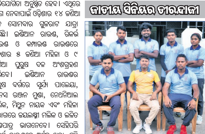
କୋଚ୍ଙ୍କ ସହ ଚାମ୍ପିୟନ ଦଳ।