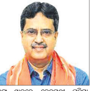
୮ରେ ଶପଥ ନେବେ

ମାନିକ୍ ଶାହା ଜ୍ରମାଗତ ତ୍ରିପୁରା ଥର ପାଇଁ ଉତ୍ତରପୂର୍ବାଞ୍ଚଳ ରାଜ୍ୟ ତ୍ରିପୁରାର ମୁଖ୍ୟମନ୍ତ୍ରୀ ହେବାକୁ ଯାଉଛନ୍ତି। ସୋମବାର ଭାଜପା ବିଧାୟକ ଦଳ ବୈଠକରେ ଉକ୍ତ ନିଷ୍ପତ୍ତି ନିଆଯାଇଛି। ଦଳର ସମସ୍ତ ବିଧାୟକ ତାଙ୍କୁ ସର୍ବସମ୍ମତକ୍ରମେ ନେତା ନିର୍ବାଚନ କରିଥିବା ଭାଜପା ମୁଖପାତ୍ର ସୂଚନା ଦେଇଛନ୍ତି।