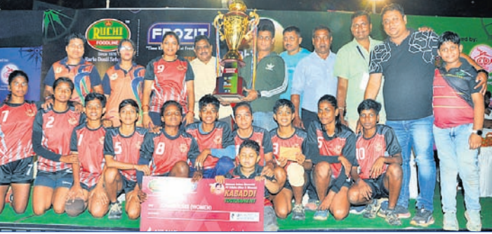
ମହିଳା ବିଭାଗରେ ଚାମ୍ପିୟନ କିଙ୍ଗ୍ ଦଳ ଟ୍ରଫି ସହ ଅତିଥିଙ୍କ ସମ୍ମାନରେ।