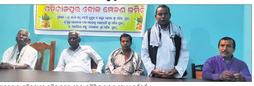
ଖବରଦାତା ସମ୍ମିଳନୀରେ ପତିରାଜପୁର ମେଳା କମିଟି ଓ ଚାରଣ ଗୋଷ୍ଠୀ କର୍ମକର୍ମୀ।

ବାଲେଶ୍ଵର ଜିଲ୍ଲା ଅଧୀନ ଖଇରା ବ୍ଲକ୍ ପତିରାଜପୁର ଠାରେ ୩ଶହ ବର୍ଷ ଧରି ପାଳିତ ହୋଇଆସୁଥିବା ପ୍ରସିଦ୍ଧ ଦୋଳମେଳନ ଆରମ୍ଭ ହୁଏ। ଗୋଟିଏ ଦିନ ଥିବା ବେଳେ ଏଥିପାଇଁ ପ୍ରସ୍ତୁତି ଚୁଡ଼ାକ ପର୍ଯ୍ୟାୟରେ ପହଞ୍ଚିଲା।