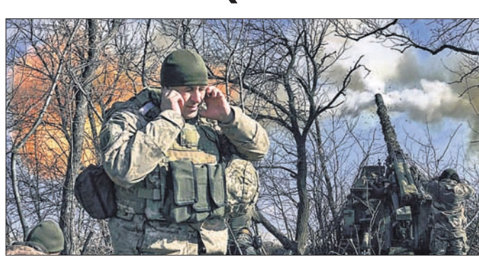
ମତ ଦେଇଥିଲେ। ଅନ୍ୟ ପକ୍ଷରେ ରୁକ୍ଷିଆ ସୈନ୍ୟତାଦେୟ ସହରାଞ୍ଚଳ ଓ ଆଖପାଖ ଗ୍ରାମ ଉପରେ କୋର୍ଦ୍ଦାର ସେଲ୍ ମାଡ଼ କରିଚାଲିଛି। ବାଖମୁର୍ ବାସିନ୍ଦାଙ୍କୁ ଶେଷ କରିଦେବା ଲାଗି ମନ୍ଦୋ ଅଧିକ ସୈନ୍ୟ ସହଜ ନିୟୋଜିତ କରିଛି। ସେଲ୍ ମାଡ଼କୁ ରକ୍ଷା ପାଇବା ପାଇଁ ନାଗରିକମାନେ

୮ରେ ଶପଥ ନେବେ ନକ୍ଷା ଏବଂ ବିଭିନ୍ନ ଭାଜପା ଶାସିତ ରାଜ୍ୟର ମୁଖ୍ୟମନ୍ତ୍ରୀମାନେ ଉପସ୍ଥିତ ରହିପାରନ୍ତି। ୬୦ ଆସନ ବିଶିଷ୍ଟ ତ୍ରିପୁରା ବିଧାନସଭା ନିର୍ବାଚନରେ ଭାଜପା ୩୨ ଆସନ ଜିତି ପୂର୍ଣ୍ଣ ସଂଖ୍ୟାଗରିଷ୍ଠତା ହାସଲ କରିଥିଲା ବେଳେ ଏହାର ସହଯୋଗୀ ଇଣ୍ଡିଏନଏସ୍ ପିପୁଲ୍ସ୍ ଫ୍ରଣ୍ଟ୍ ଆର୍ଡ୍ଡ୍ ତ୍ରିପୁରା ଗୋଟିଏ ଆସନ ମିଳିଛି। ଆସାମ ମୁଖ୍ୟମନ୍ତ୍ରୀ ହିମନ୍ତ ବିଶ୍ୱଶର୍ମା ରବିବାର ତ୍ରିପୁରା ଯାଇ ସେଠାରୁ ଶପଥ ଗ୍ରହଣ କରିବେ। ତାଙ୍କ ଶପଥ ଗ୍ରହଣ ଉତ୍ସବରେ ପ୍ରଧାନମନ୍ତ୍ରୀ ନରେନ୍ଦ୍ର ମୋଦି, ଭାଜପା ରାଷ୍ଟ୍ରୀୟ ଅଧ୍ୟକ୍ଷ ଜେ.ପି.